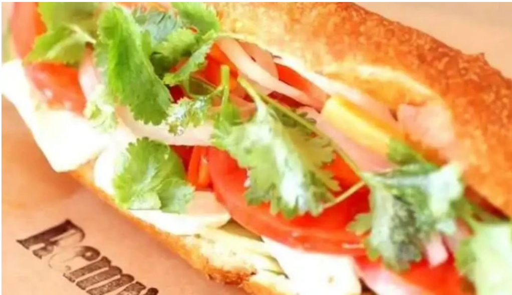
ピザワイン テラ サンドイッチ