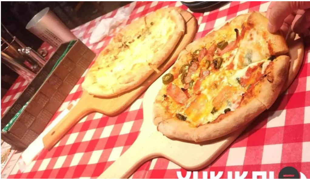
ピザワイン テラ ピザ