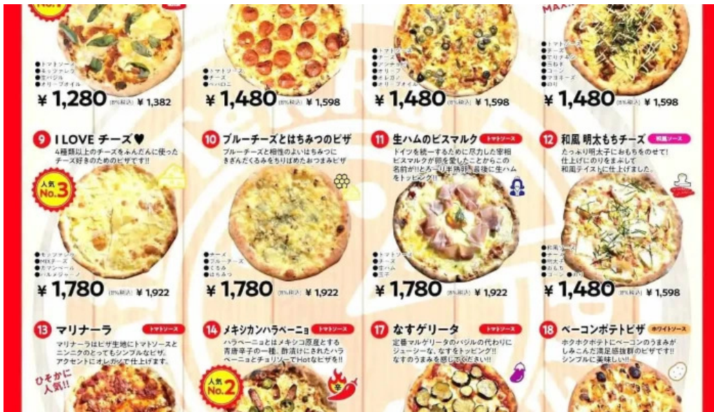
ピザワイン テラ メニュー