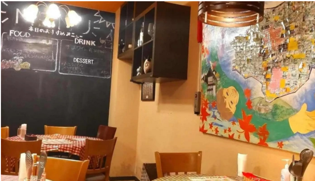
ピザワイン テラ 雰囲気