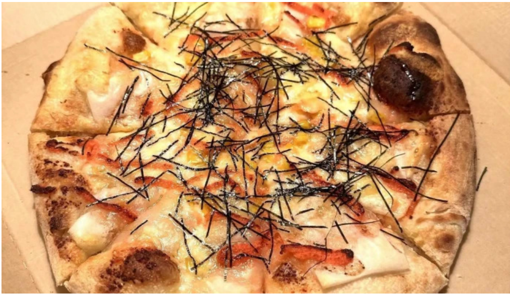
ピザワイン テラ 電話