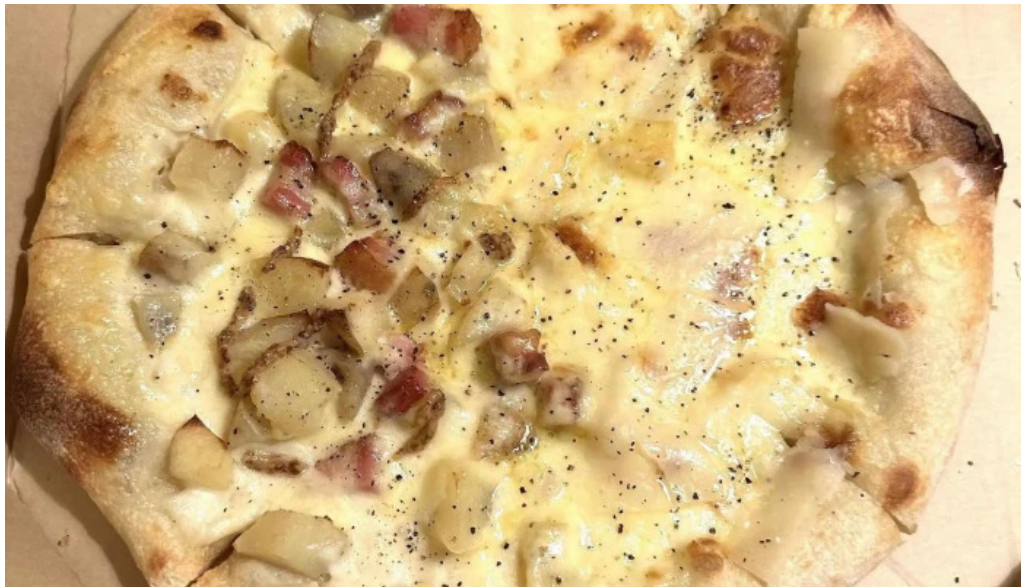
ピザワイン テラ 所在地