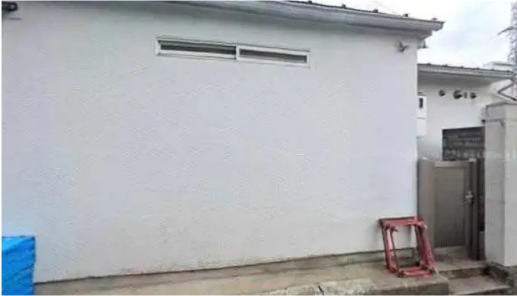
ピザワイン テラ 長岡京市