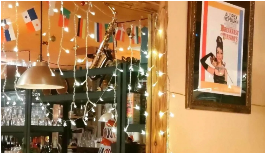
ピザワイン テラ 写真