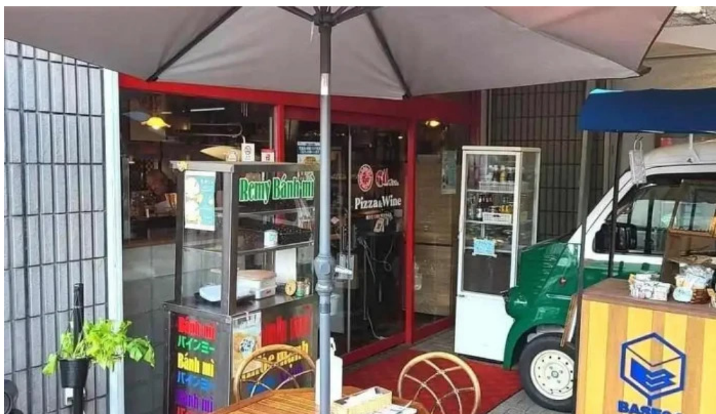
ピザ&ワイン テラ 長岡京市