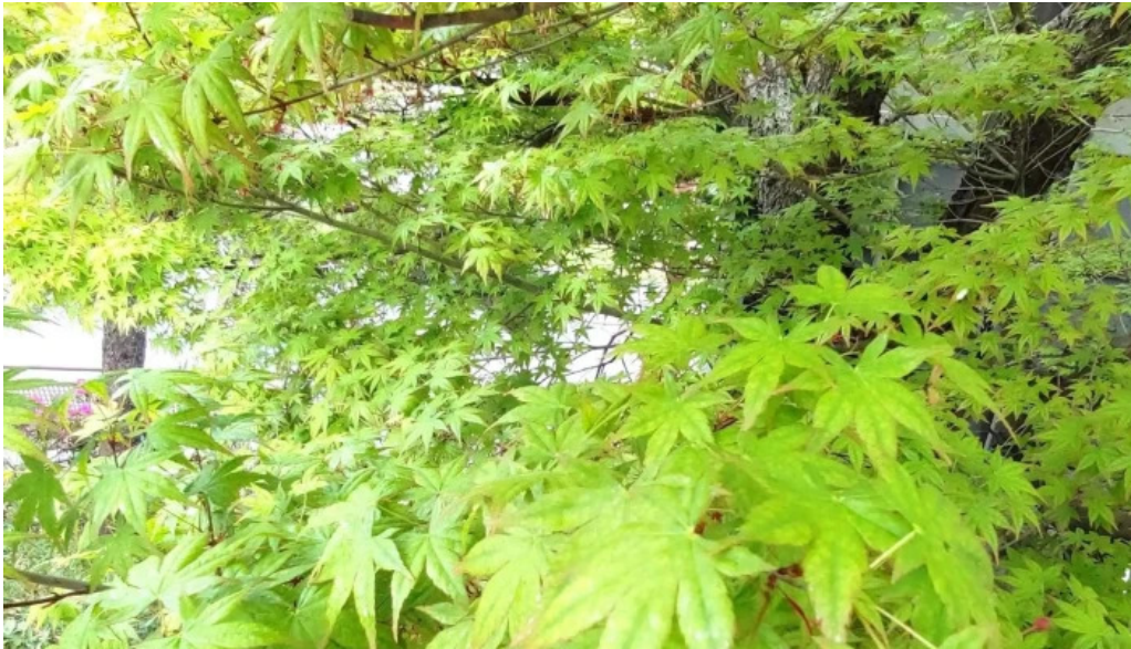
ピザワイン テラ 行き方