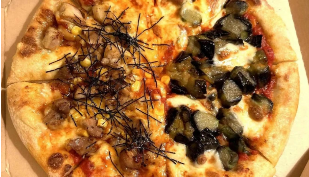
ピザワイン テラ コメント