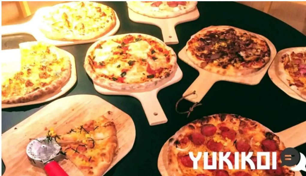
ピザワイン テラ 料理飲み物