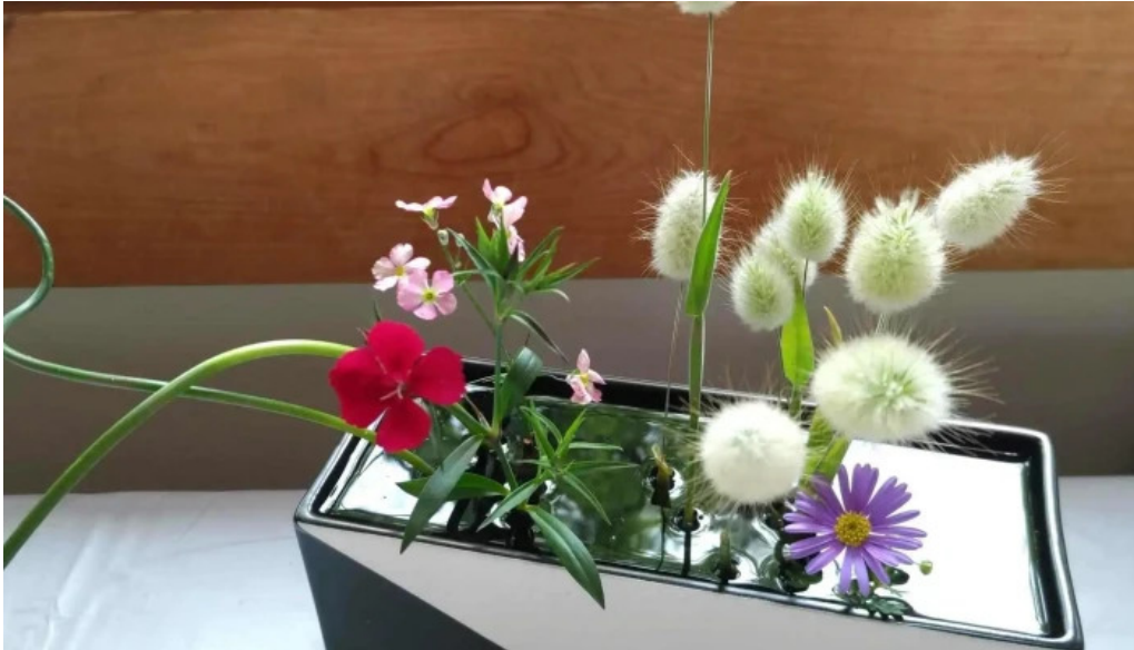
ピザワイン テラ ウェブサイト