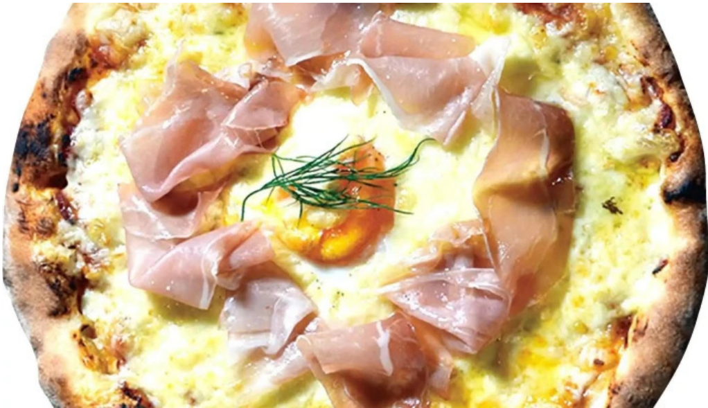
ピザワイン テラ オーナー提供