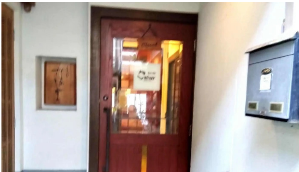
ビストロクールウェブサイト