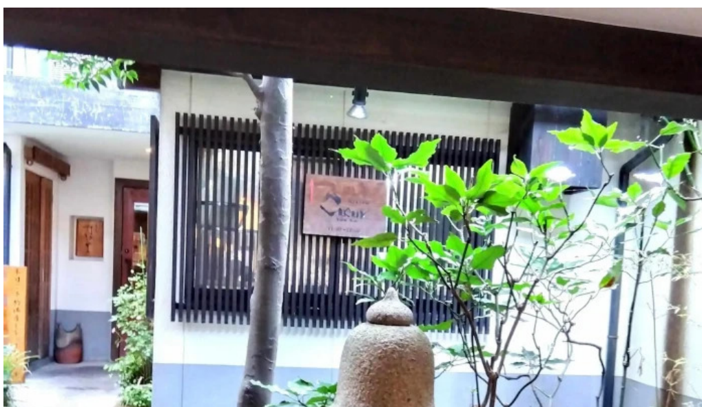
ビストロ クール 所在地