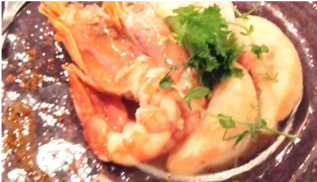
ビストロ クール コメント