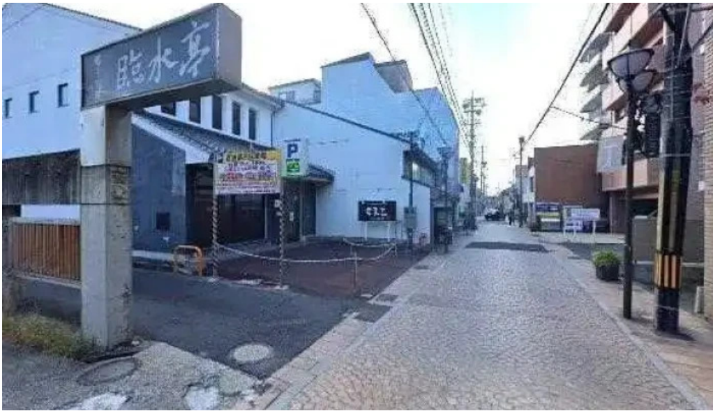
ビストロクール 松江市