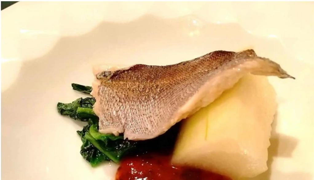
ビストロクール 近く