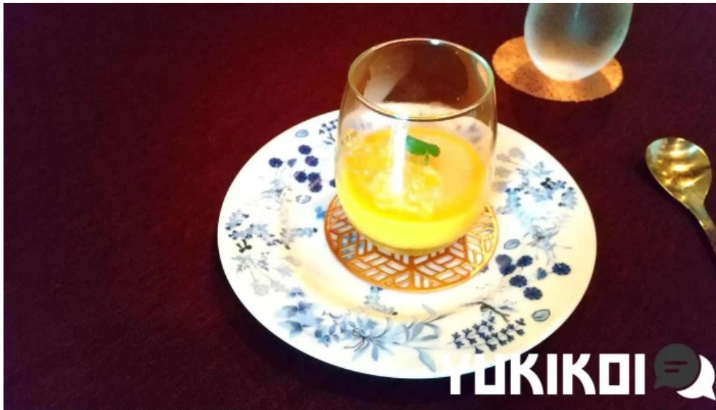
ビストロ クール パンナコッタ