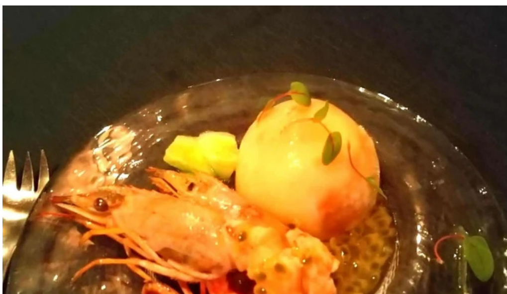
ビストロクールどこ