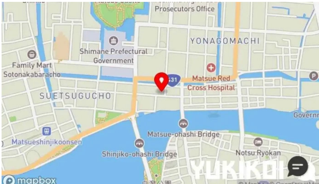
ビストロクール 地図