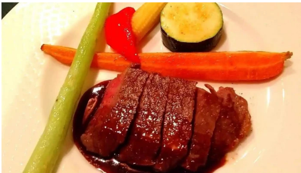
ビストロ クール 料理飲み物