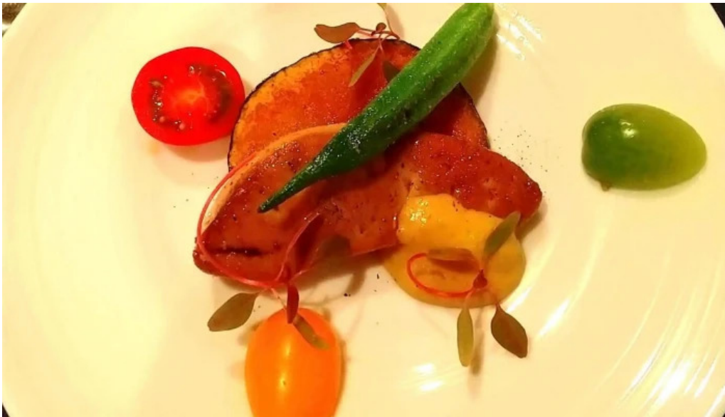
ビストロクール住所