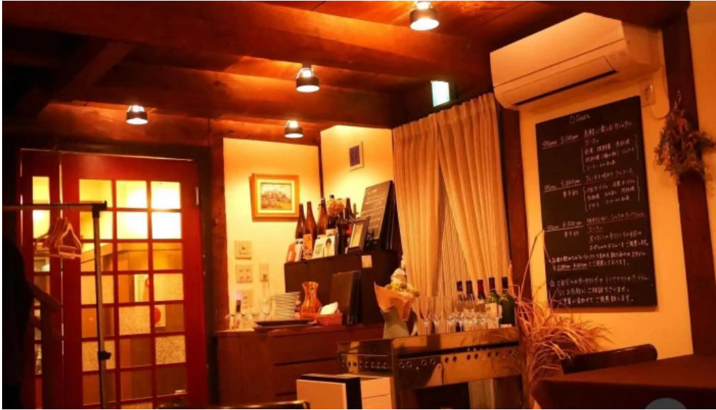
ビストロクール 雰囲気