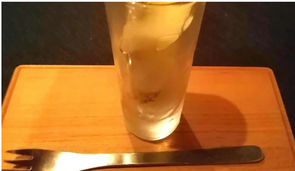
ビストロクール 営業時間