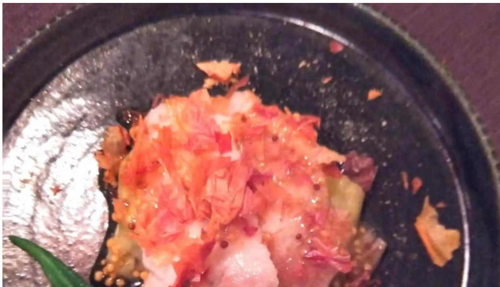
ビストロクール 電話