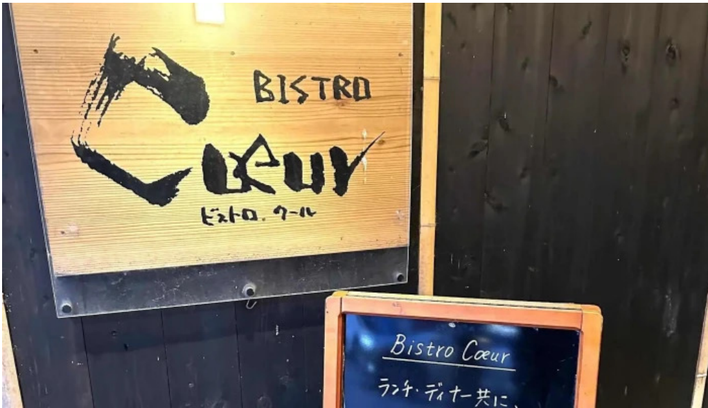
ビストロクール 料金