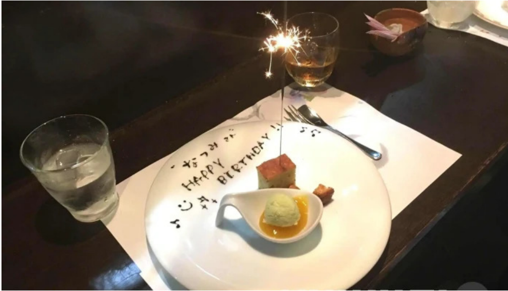
ビストロ新 料理飲み物