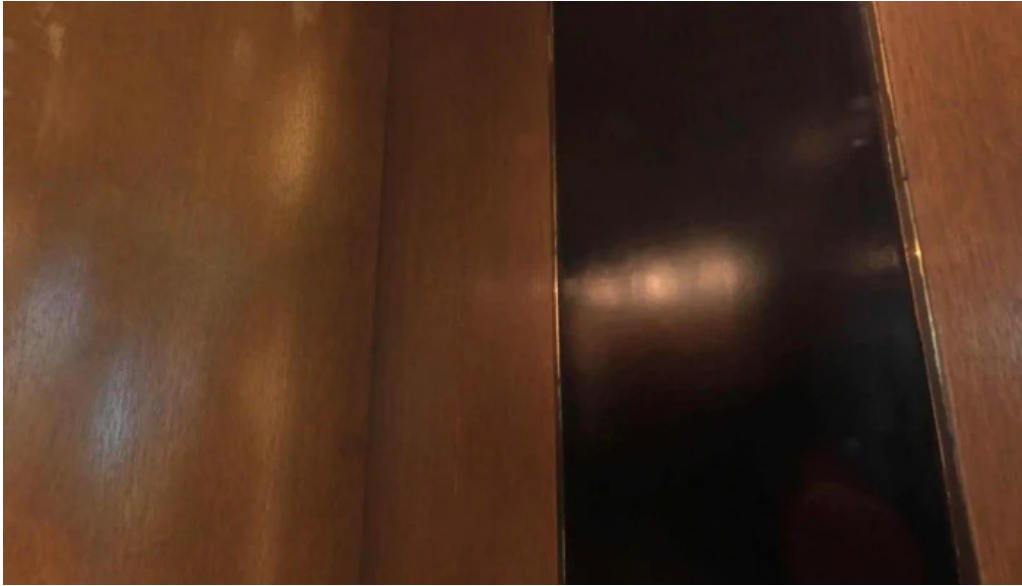
ビストロ新 寝屋川市