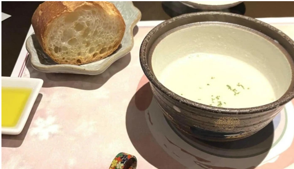
ビストロ新 ロコミ