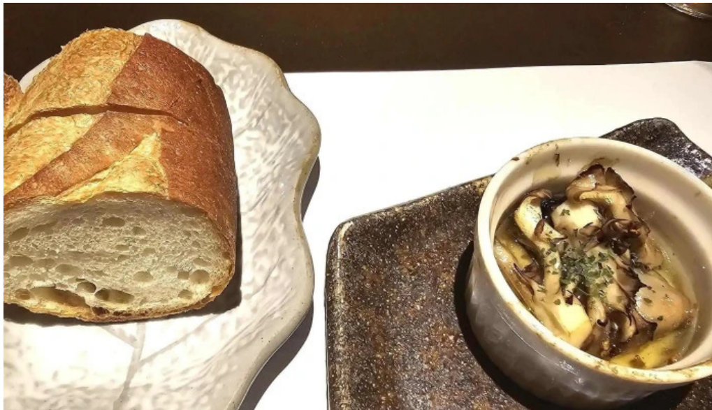
ビストロ新コメント