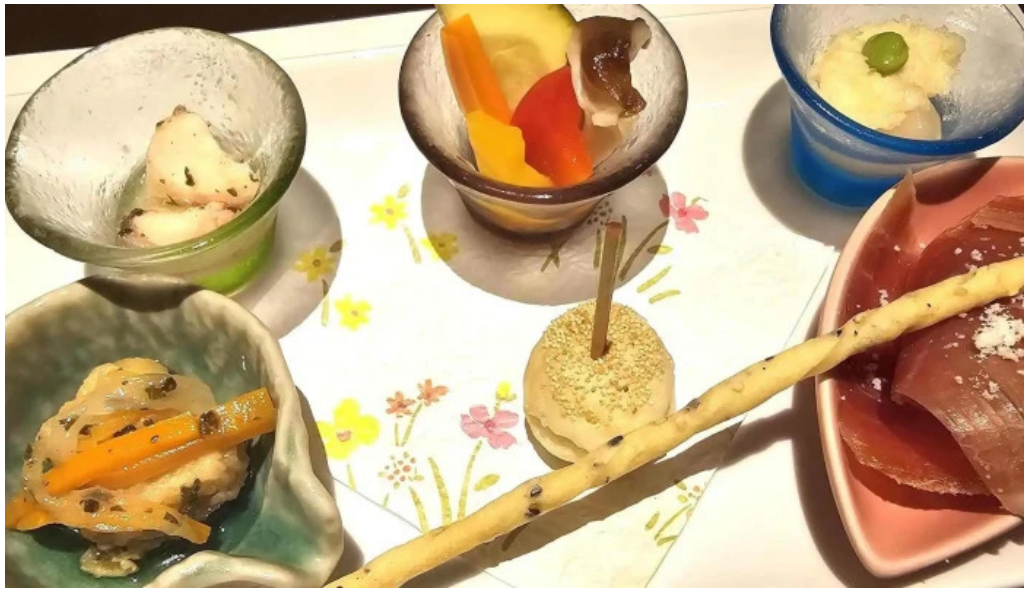
ビストロ新 営業中