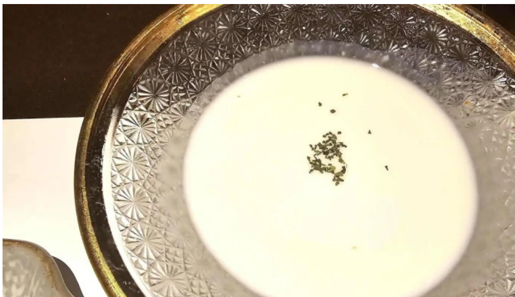
ビストロ新 ウェブサイト