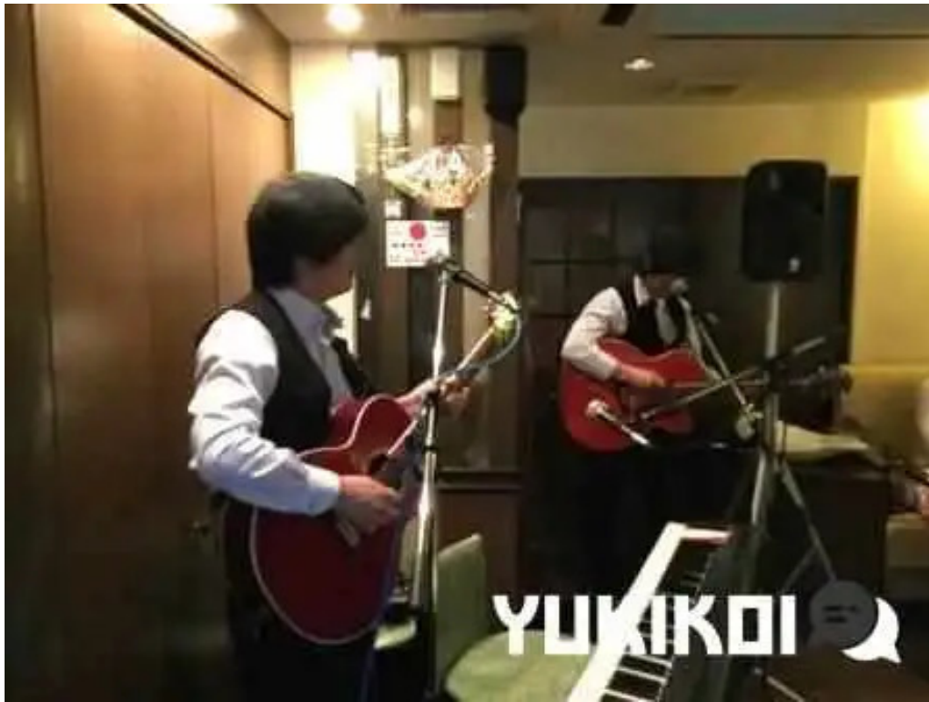
ビストロ新 オーナー提供