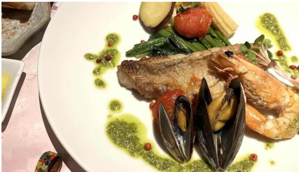
ビストロ新 エリア