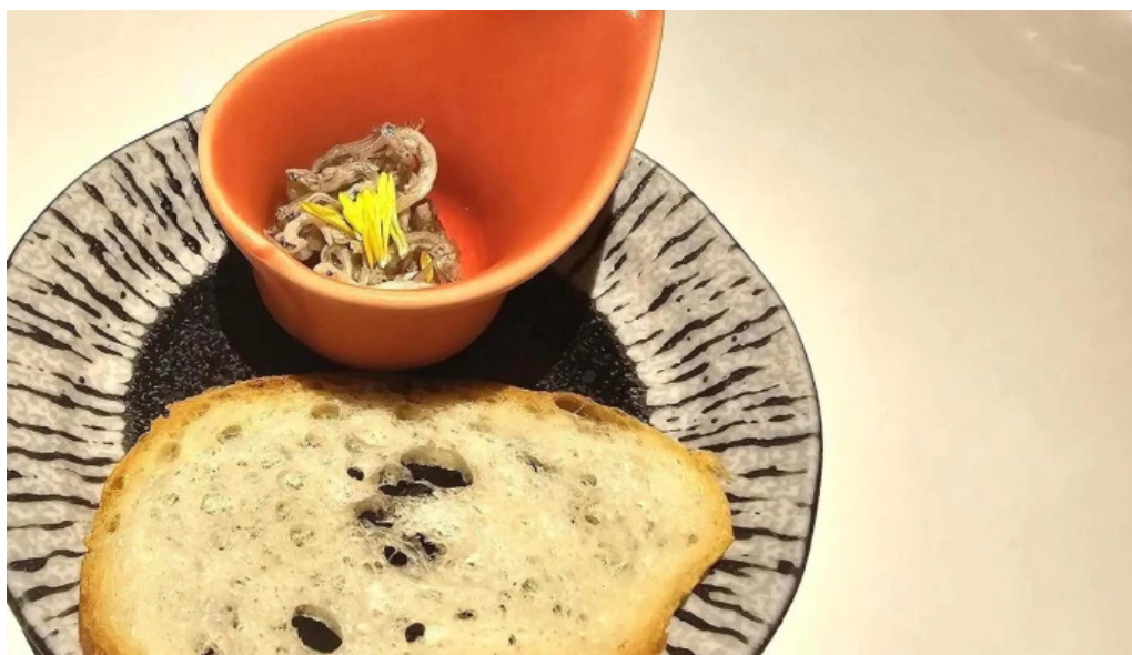
ビストロ新 行き方