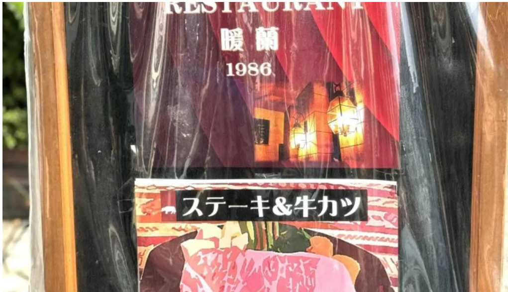
ビストロ暖蘭 所在地