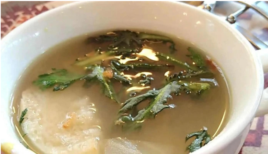
ビストロ暖蘭 住所