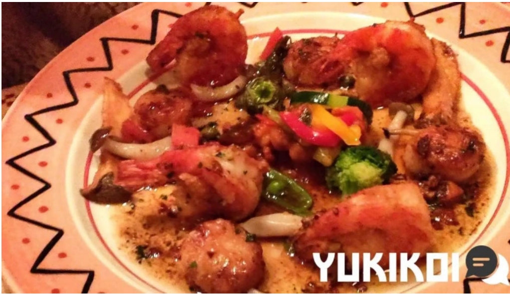
ビストロ暖蘭 動画