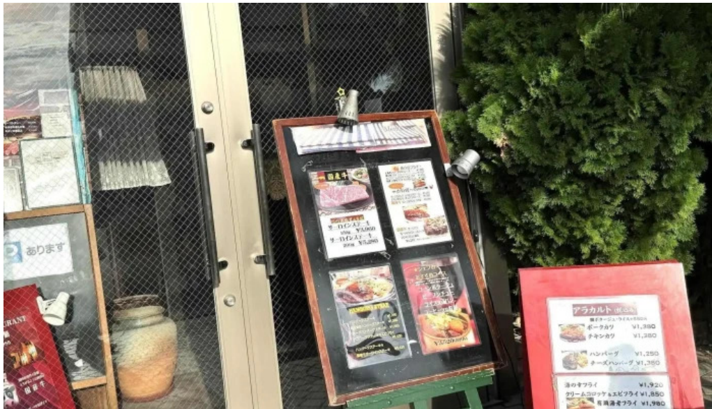
ビストロ暖蘭 行き方