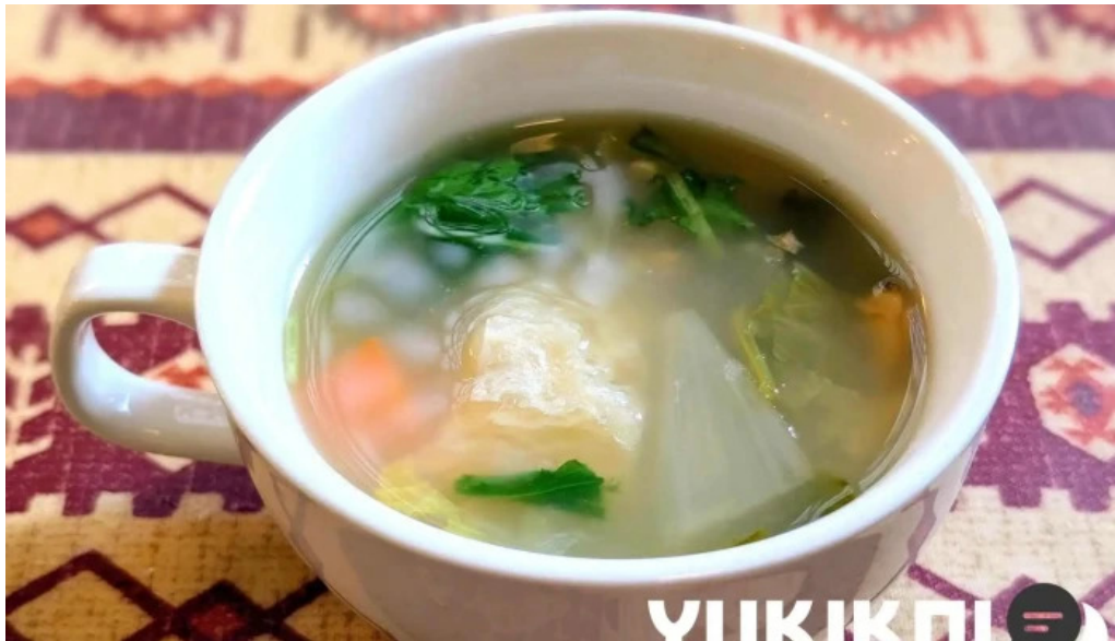
ビストロ暖蘭 スープ