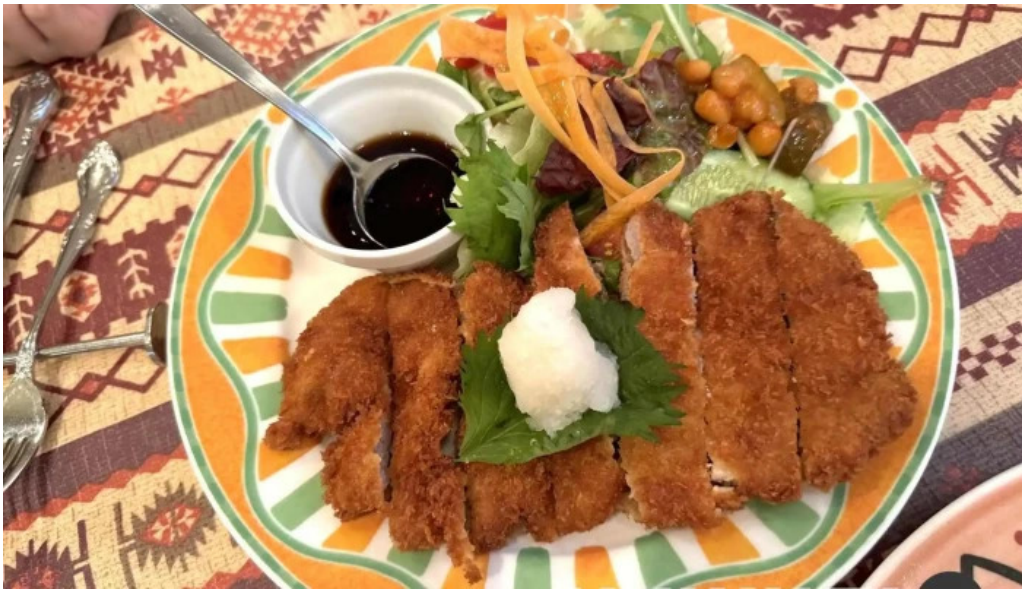
ビストロ暖蘭 豚カツ