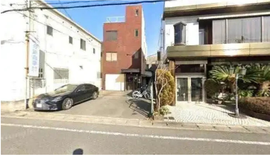
ビストロ暖蘭 京都市