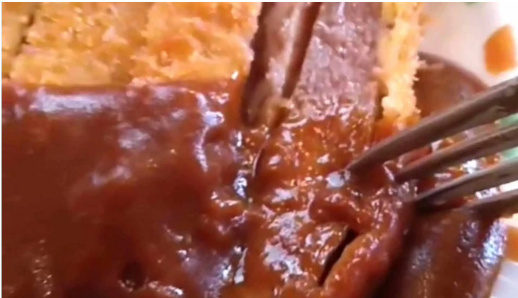
ビストロ暖蘭 電話