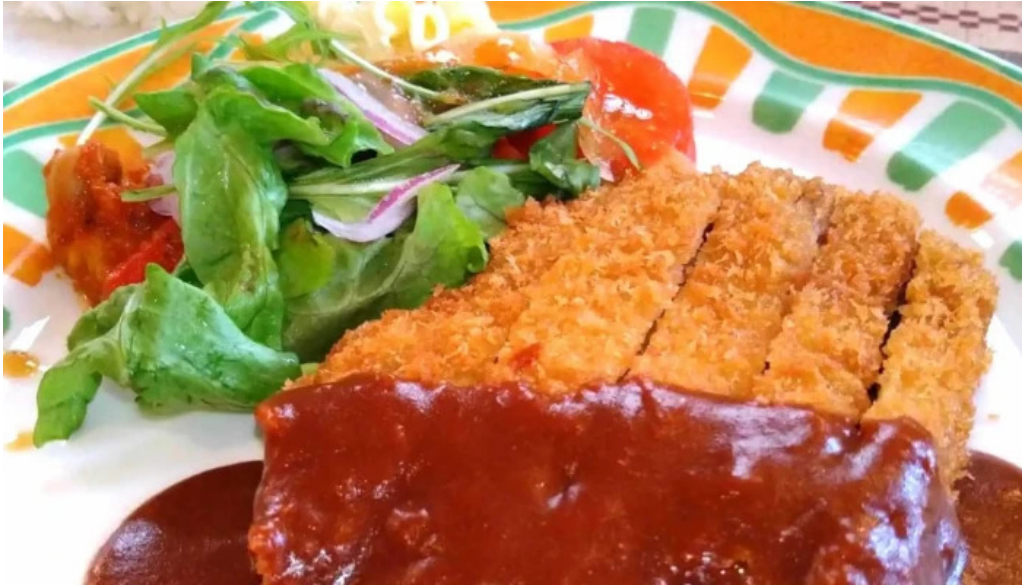
ビストロ暖蘭 営業時間