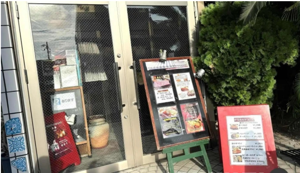
ビストロ暖蘭 メニュー