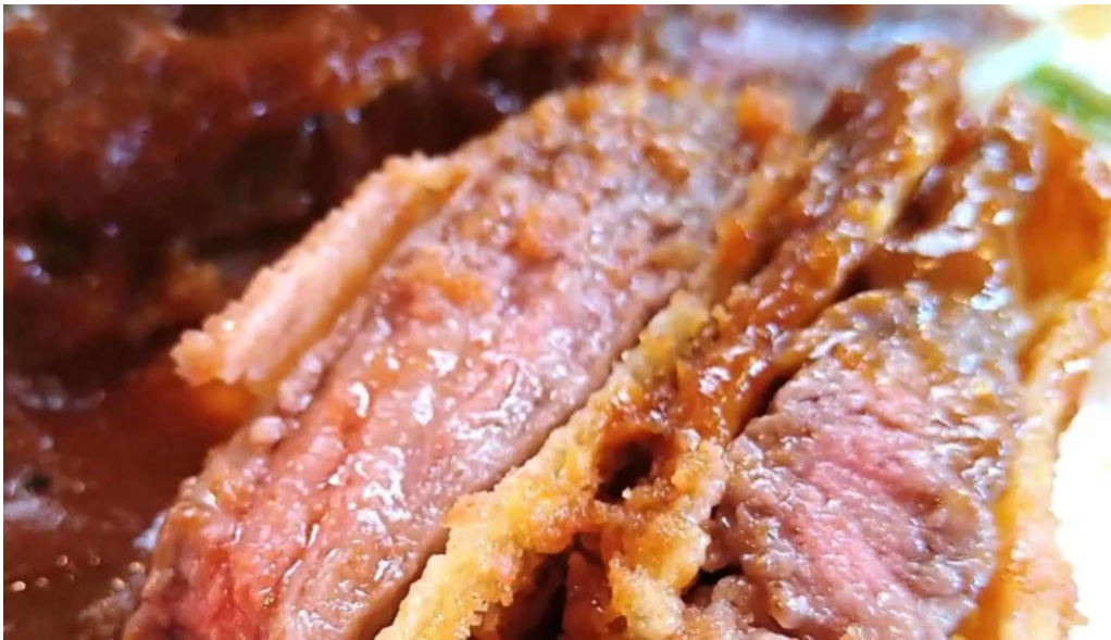
ビストロ暖蘭 営業中