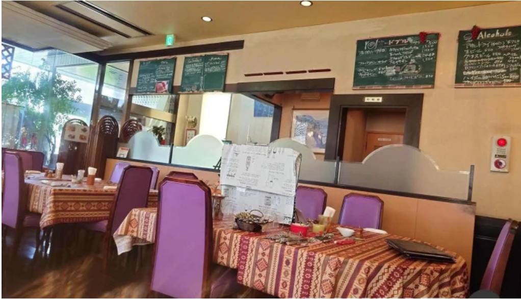
ビストロ暖蘭 雰囲気