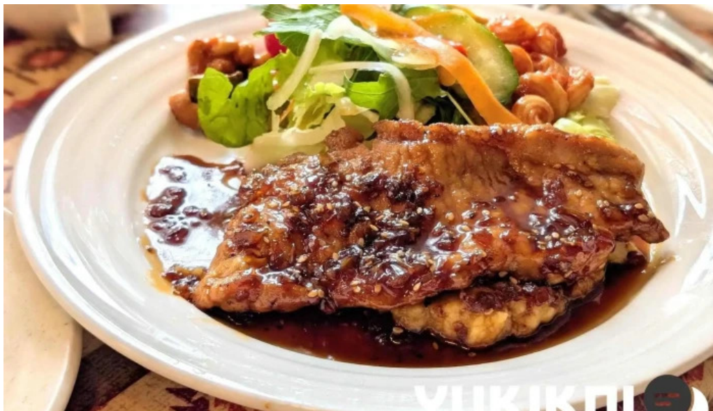
ビストロ暖蘭 料理飲み物