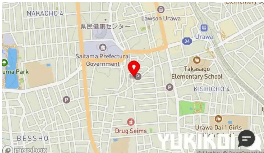
ビストロ・ド・タニ さいたま市