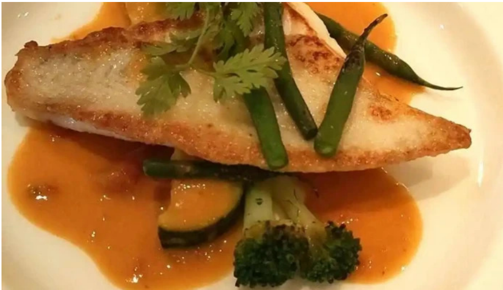
ビストロドタニ 動画