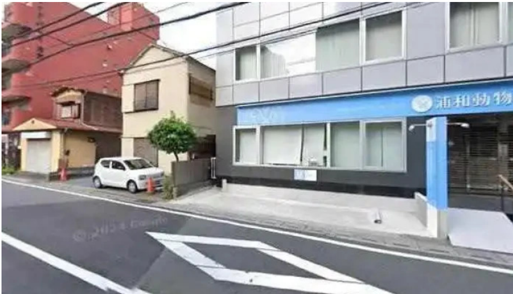
ビストロドタニビストロ