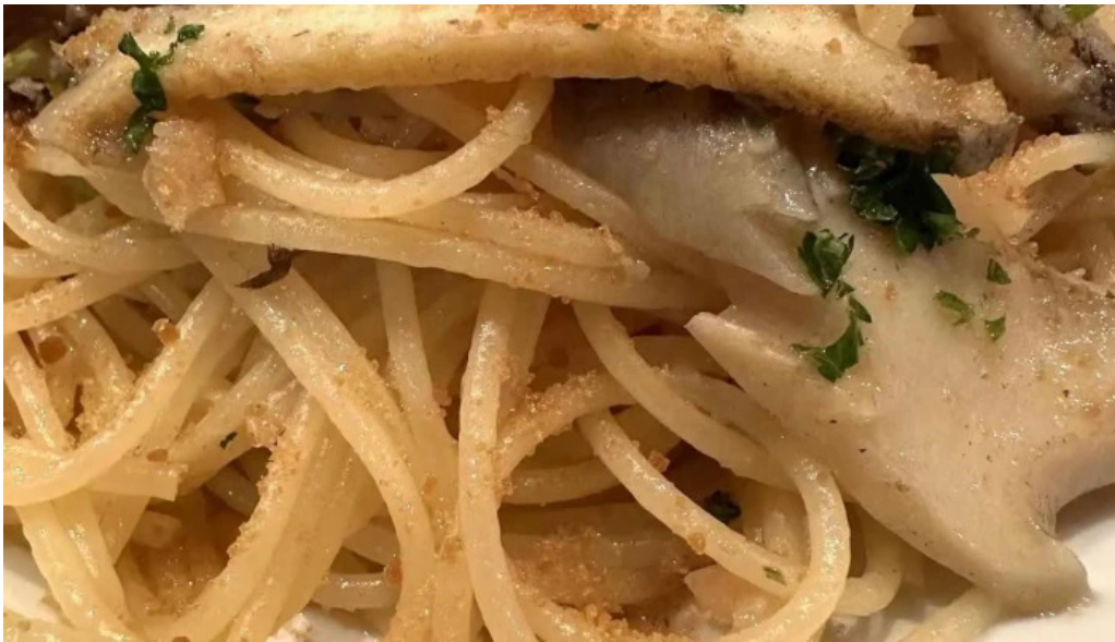
ビストロドタニ スパゲッティ