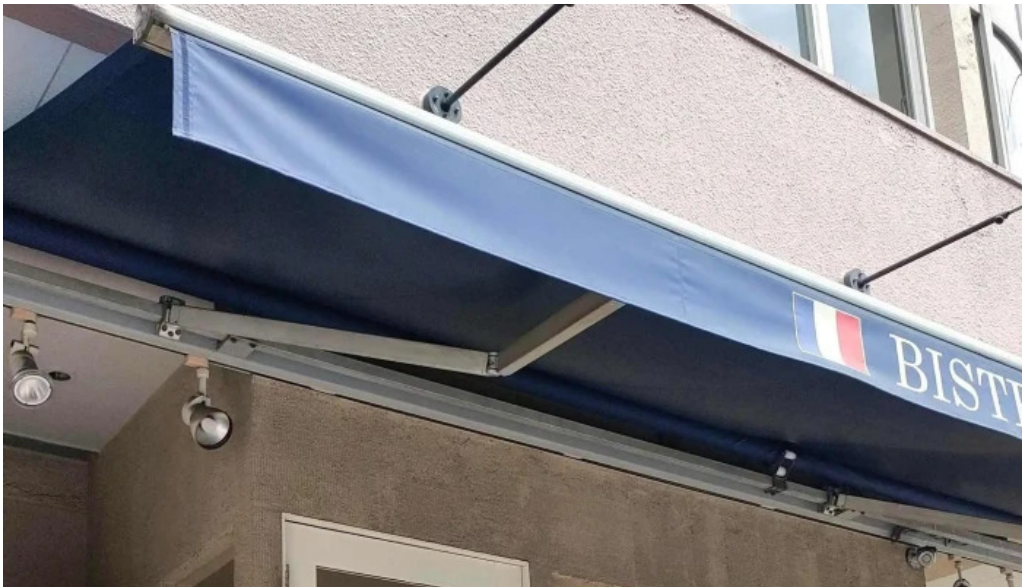
ビストロダニ 料金