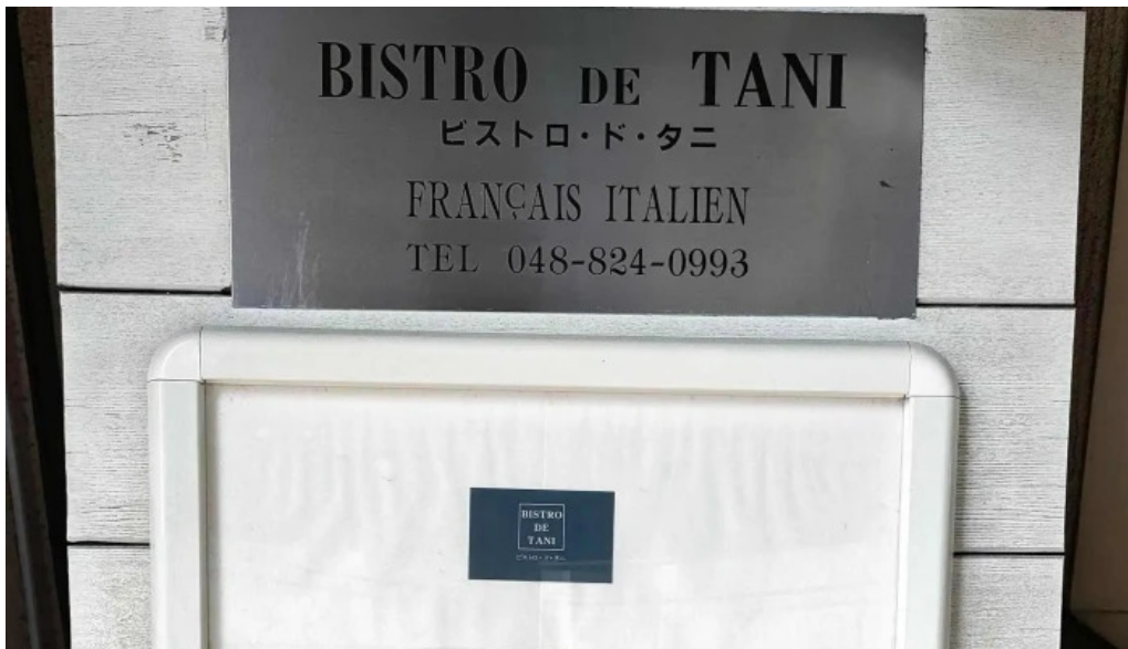
ビストロドタニ 口コミ