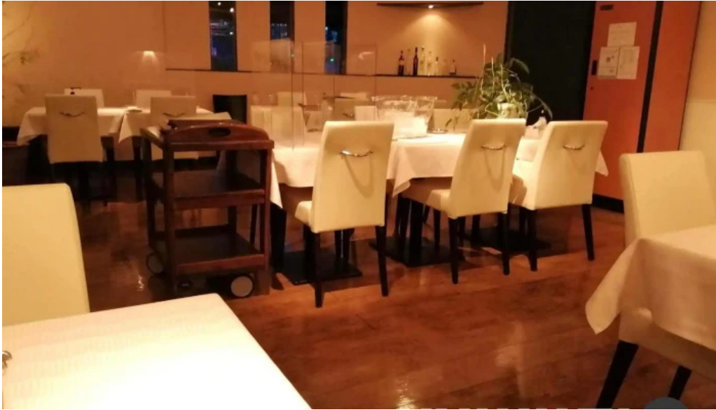
ビストロダニ 雰囲気