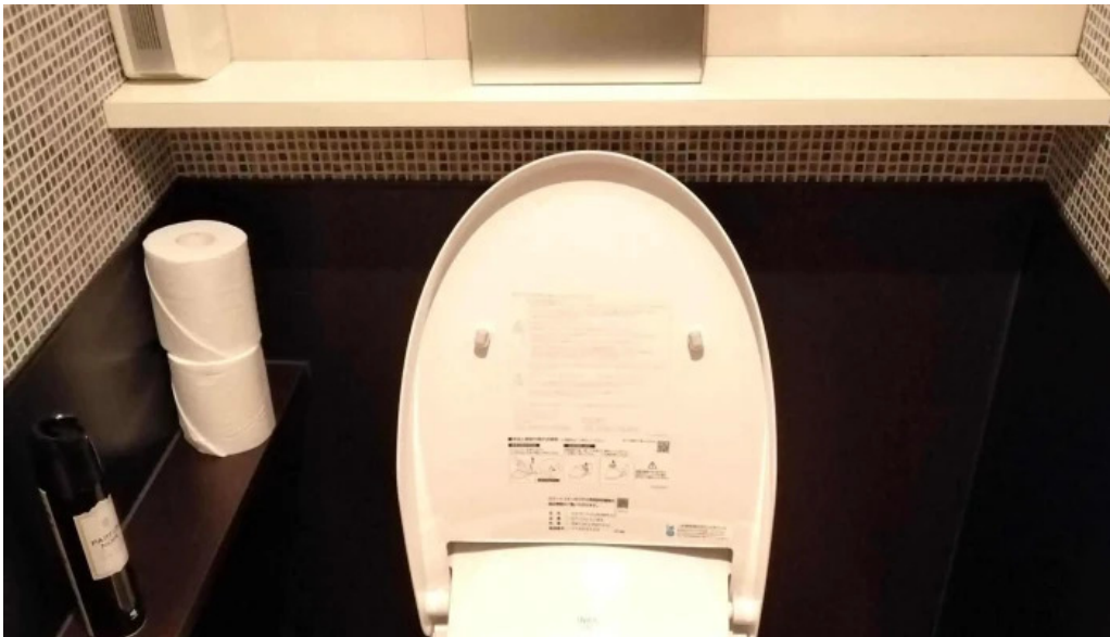
ビストロダニ エリア