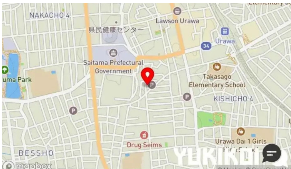
ビストロドタニ 地図