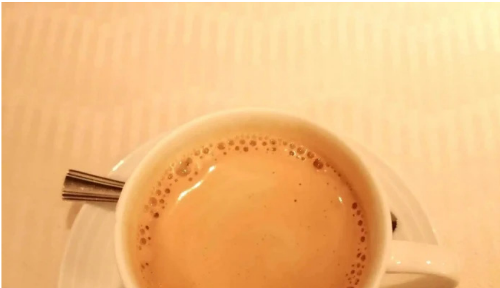
ビストロドタニ 住所