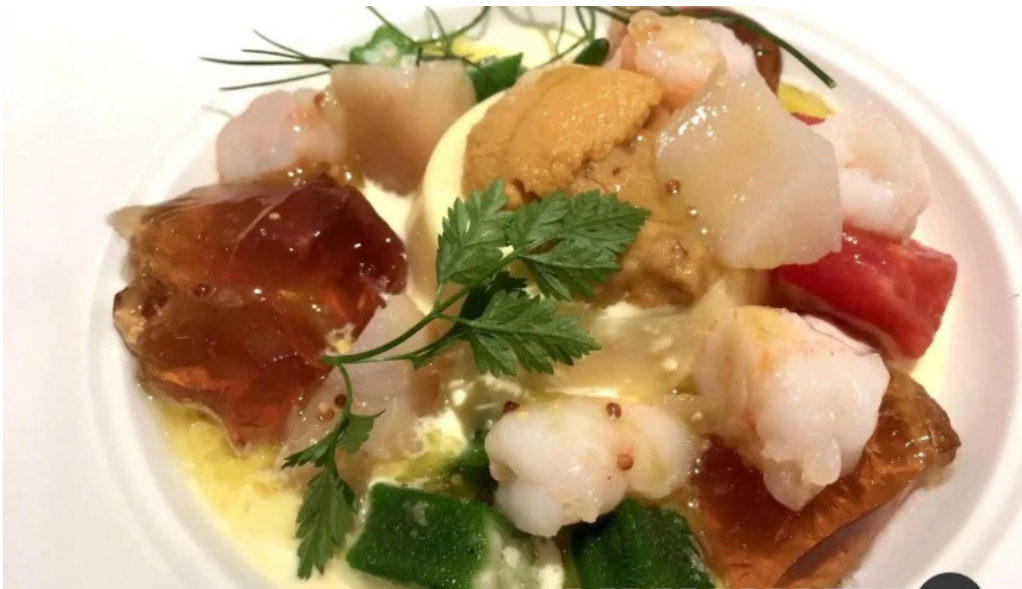
ビストロダニ シーフード