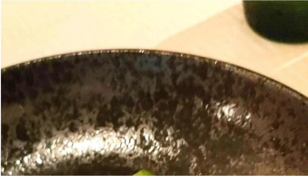
ビストロドタニ さいたま市