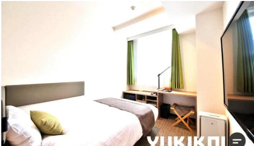
レンブラントスタイル御殿場驛門 客室