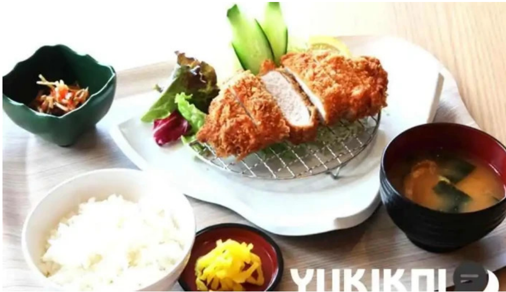
レンブラントスタイル御殿場駒門 料理飲み物