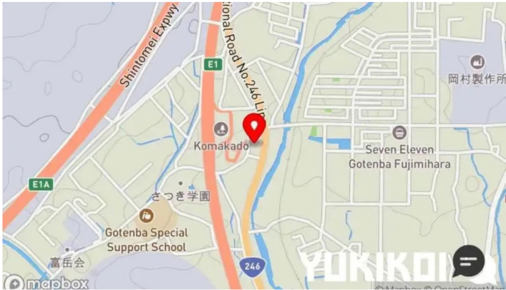
レンブラントスタイル御殿場駒門 地図