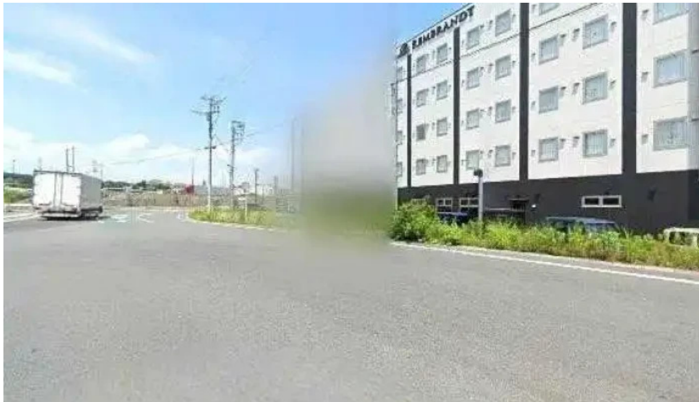
レンブラントスタイル御殿場駒門 御殿場市