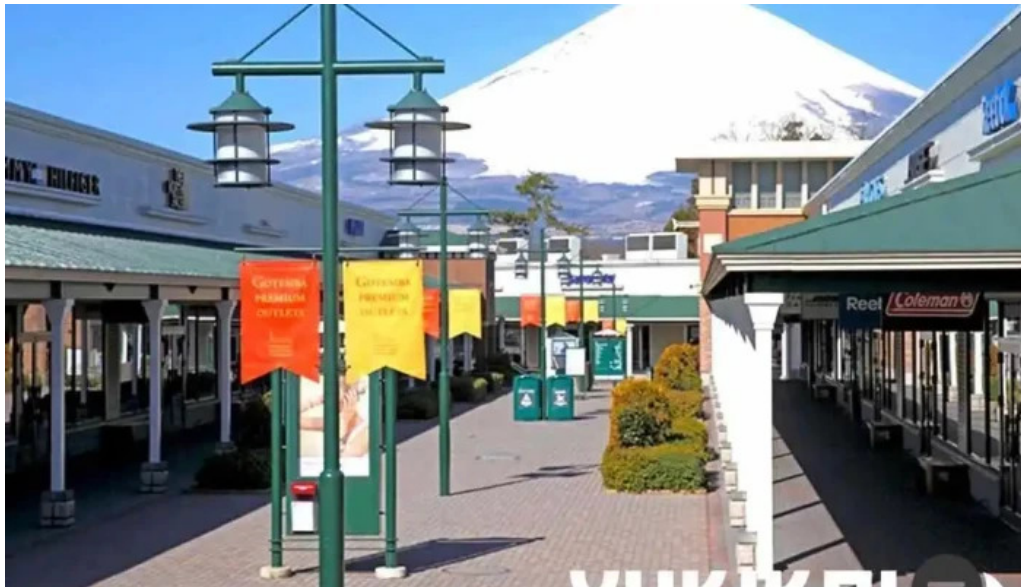
レンブラントスタイル御殿場驛門 外観