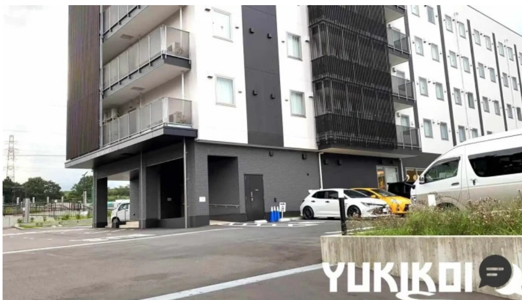
レンブラントスタイル御殿場駒門