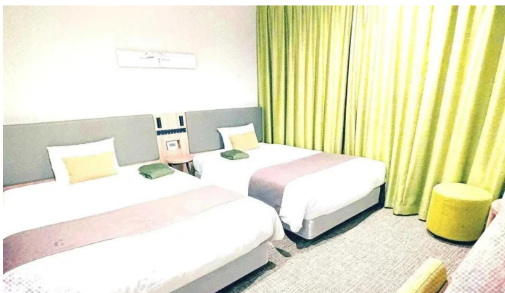
レンブラントスタイル御殿場駒門 最新