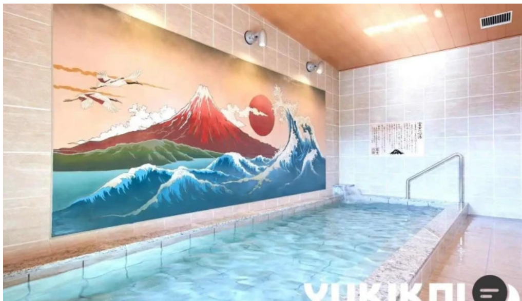
レンブラントスタイル御殿場駒門 設備