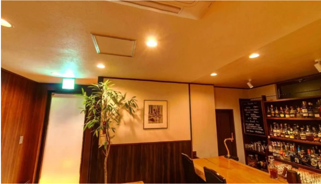
Bardining nico gotemba 御殿場市