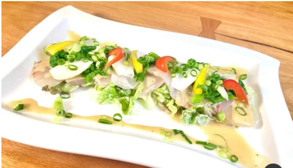
Bardining nico gotemba 料理飲み物