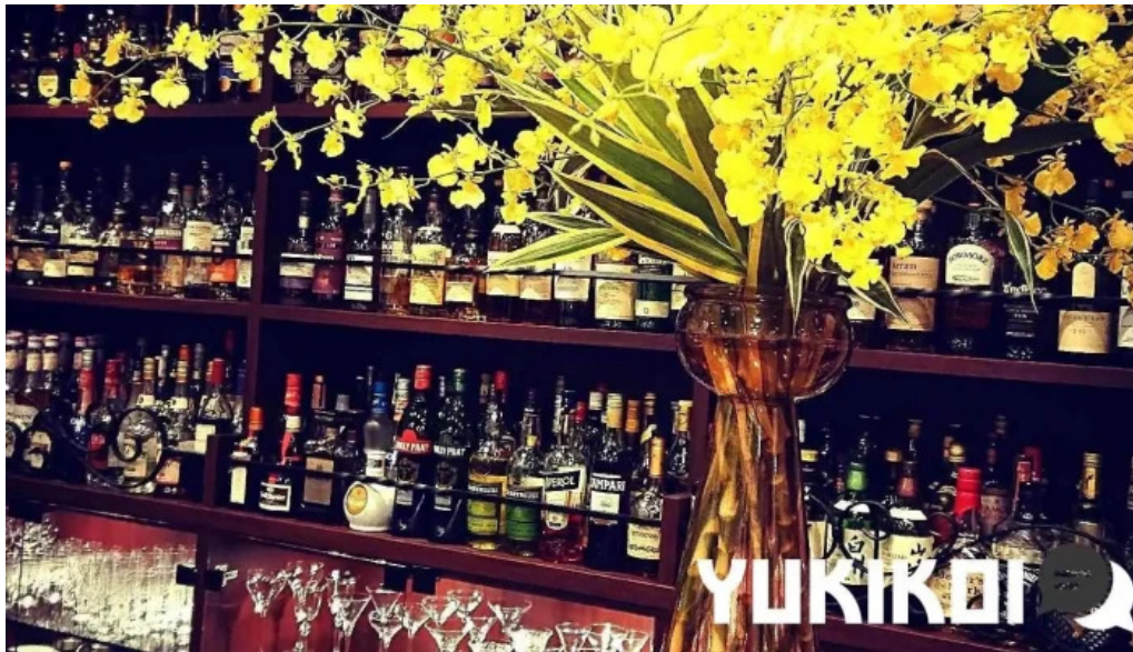
Bar dining nico gotemba 御殿場市