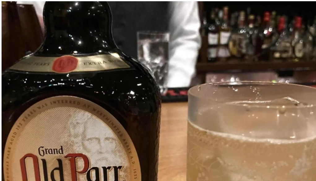
Bardining nico gotemba 料金