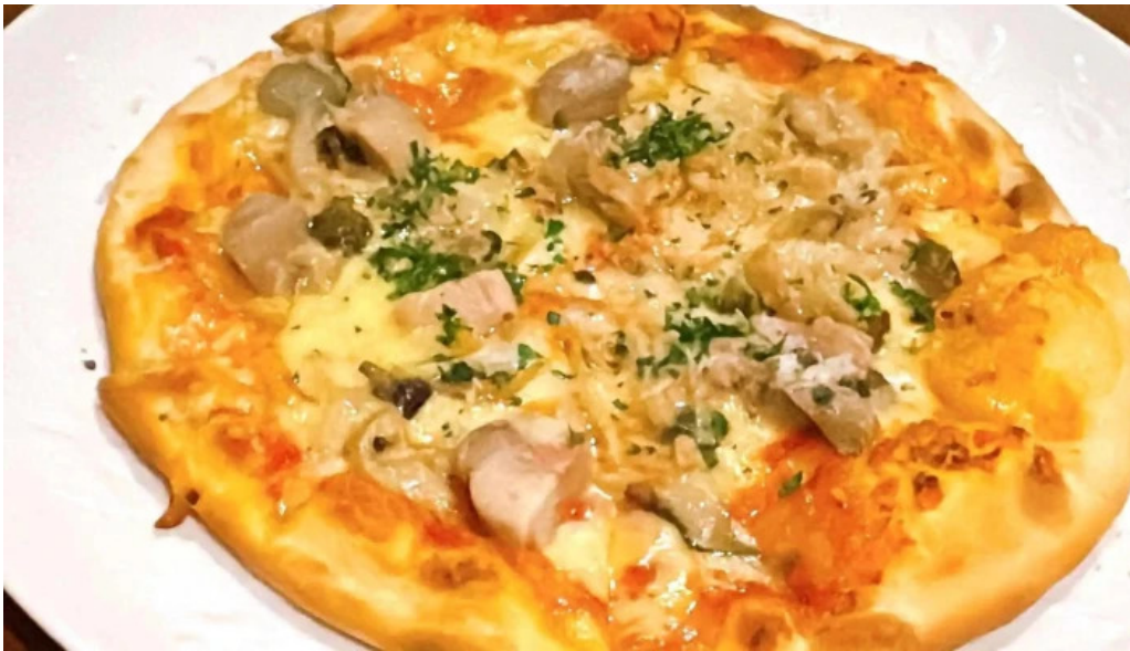
Bardining nico gotemba 畵引