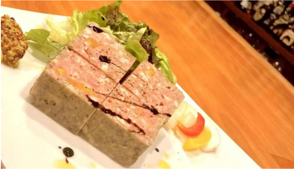
Bardining nico gotemba