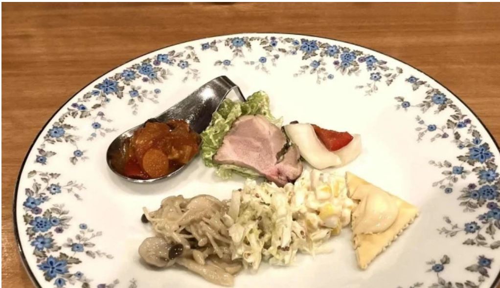
Bardining nico gotemba エリア