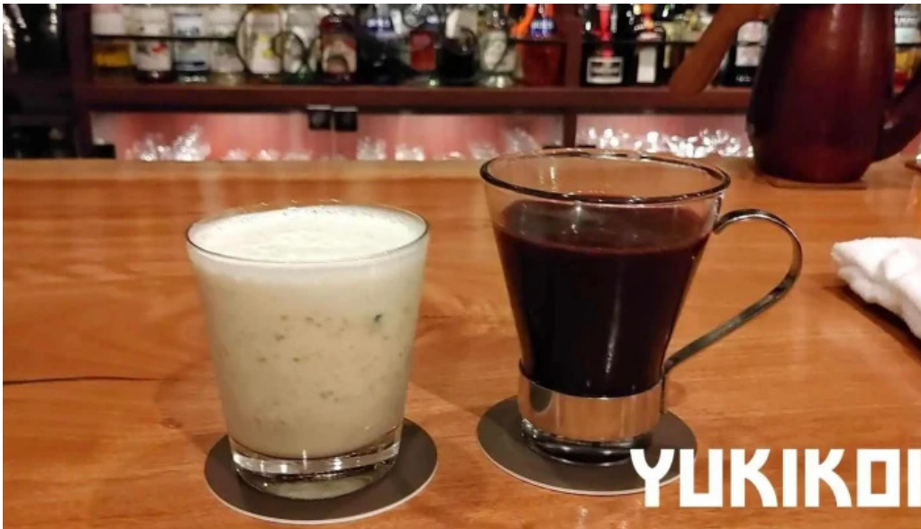
Bardining nico gotemba ジュース