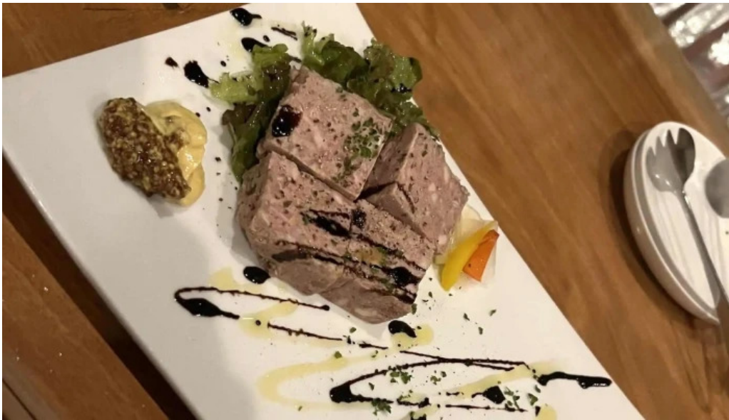
Bardining nico gotemba 營業中