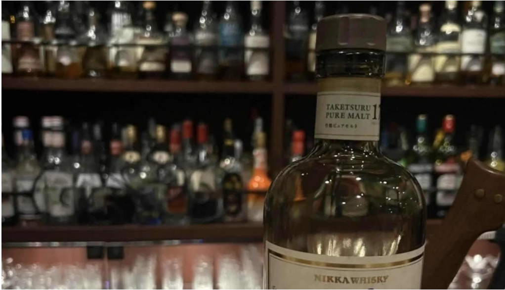
Bardining nico gotemba 住所