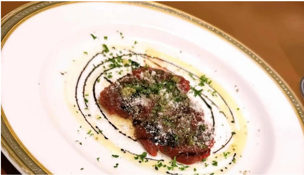
Bardining nico gotemba 營業時間