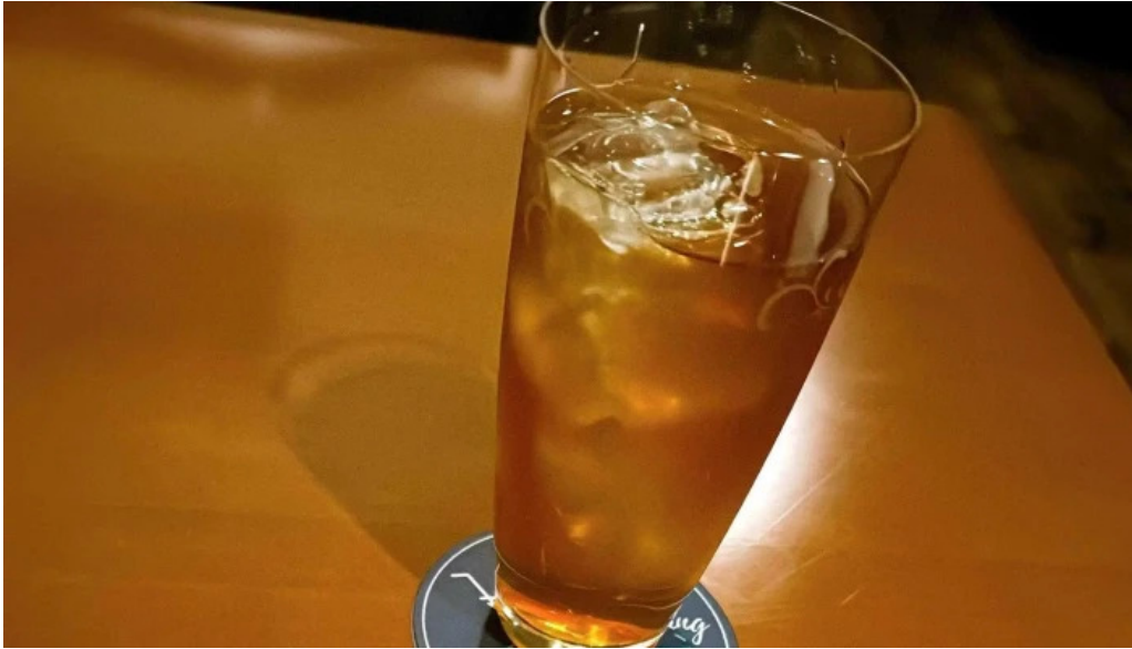
Bardining nico gotemba 口口三