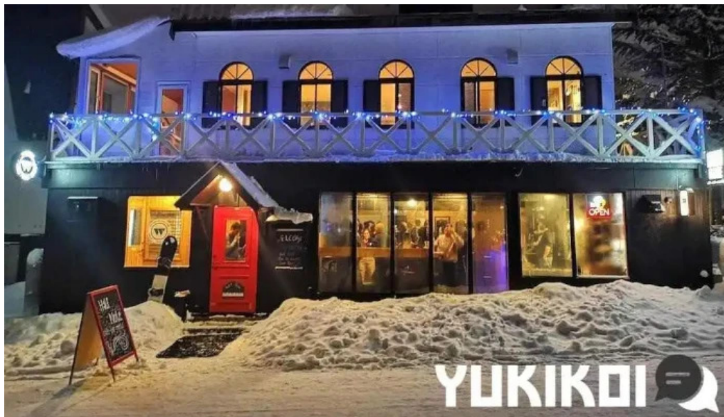
Niseko half note オーナー提供