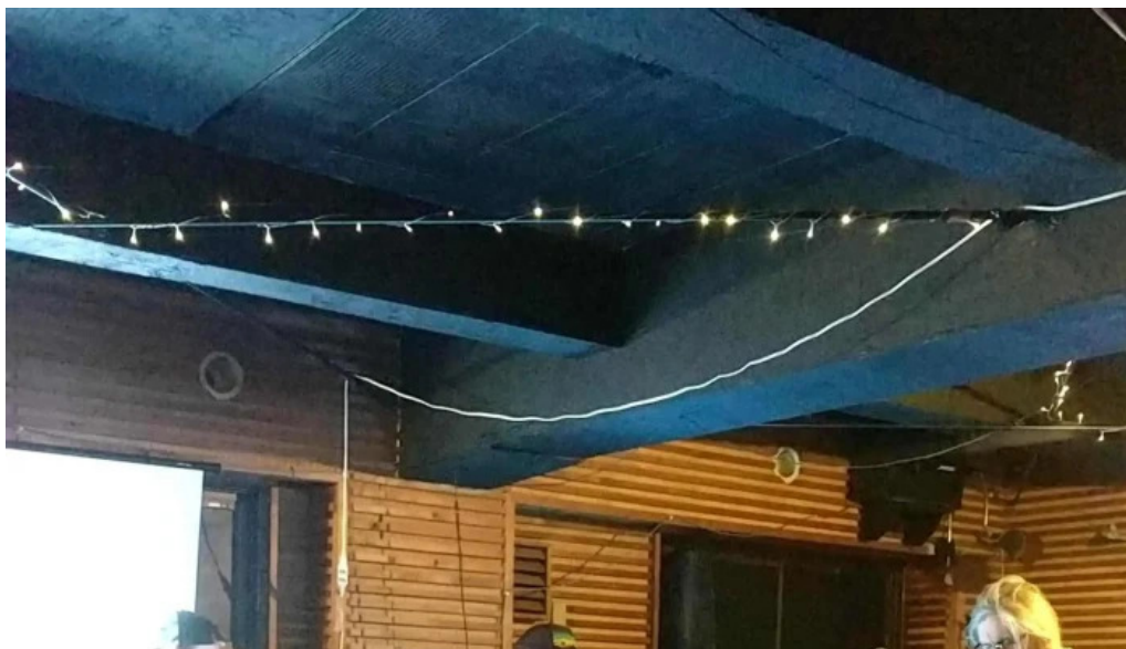
Niseko half note 電話