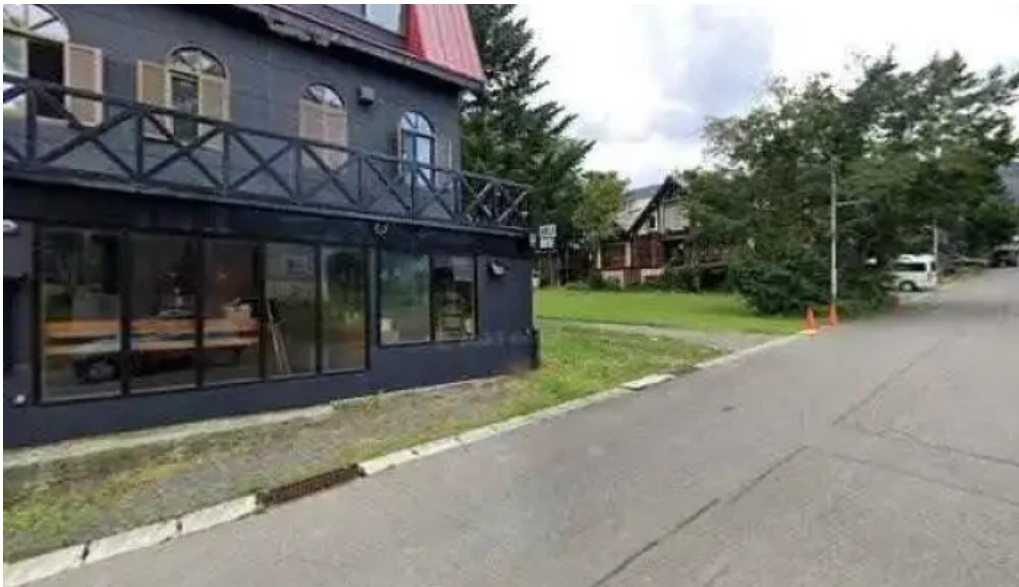
Niseko half note 倶知安町