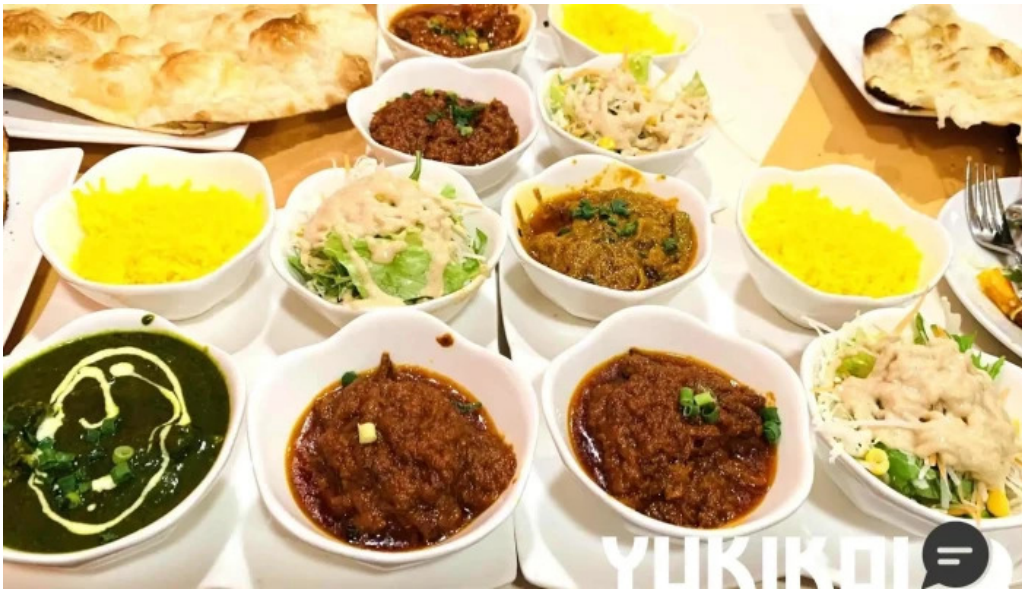
御殿場インドア halal 料理飲み物