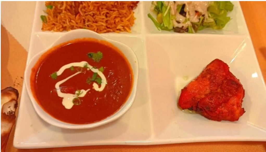
御殿場インドア halal 動画