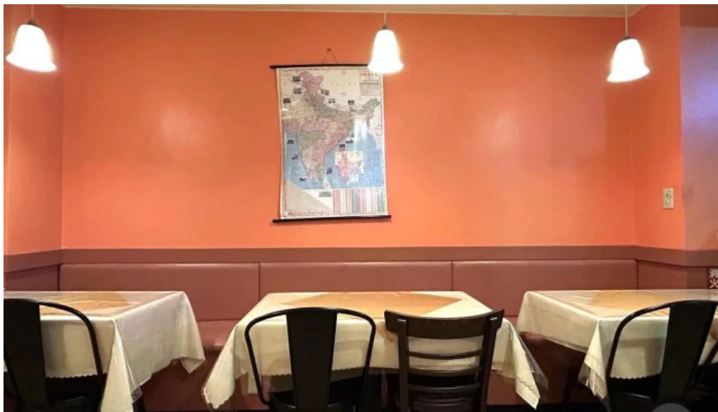
御殿場インドア halal 雰囲気