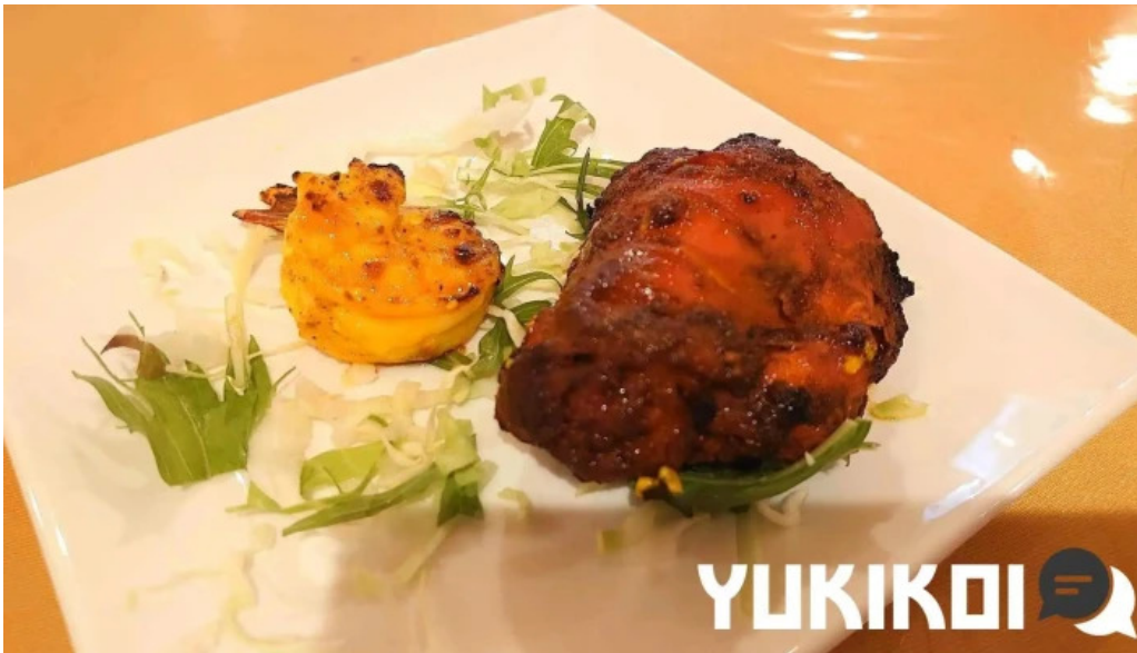
御殿場インドア halal タンドリーチキン