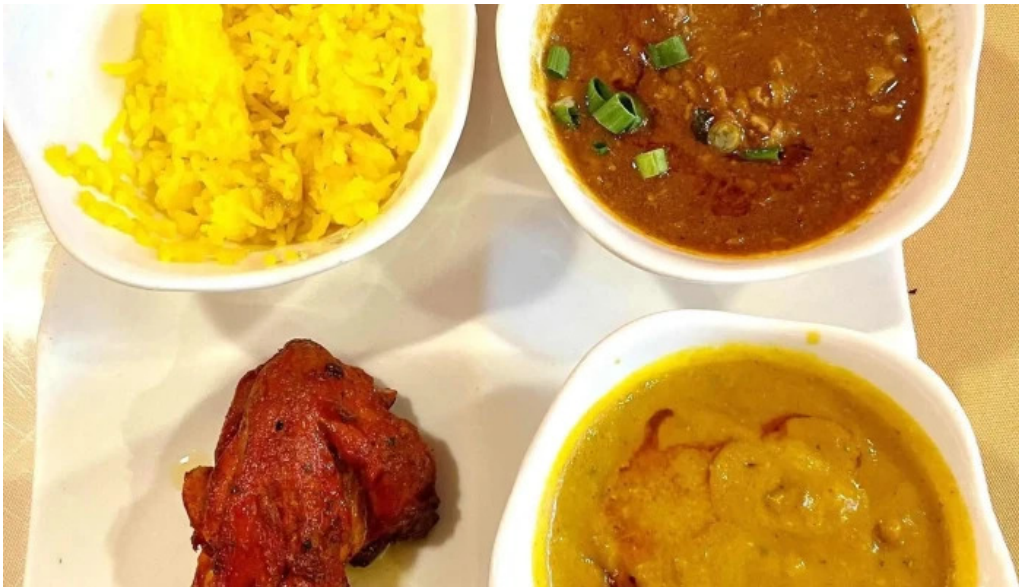
御殿場インドア halal コメント