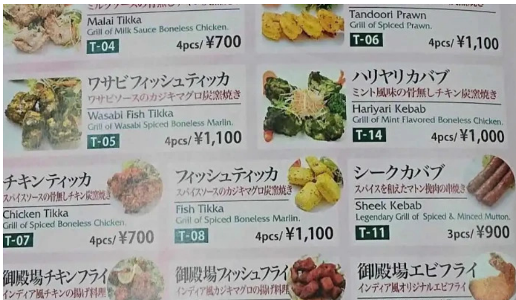
御殿場インドア halal メニュー