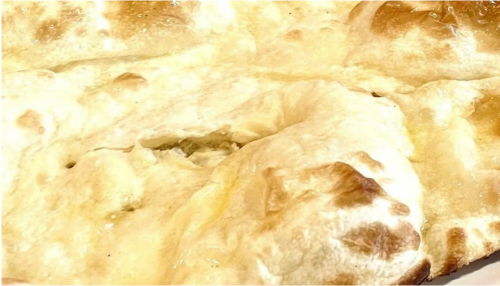
御殿場インドア halal 御殿場市