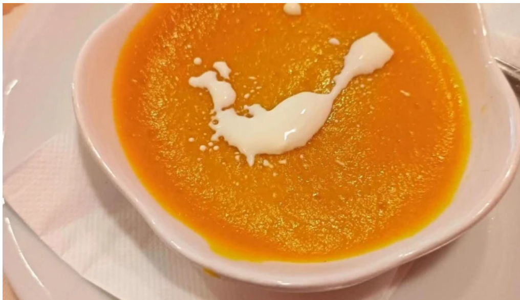
御殿場インドア halal プロモーション