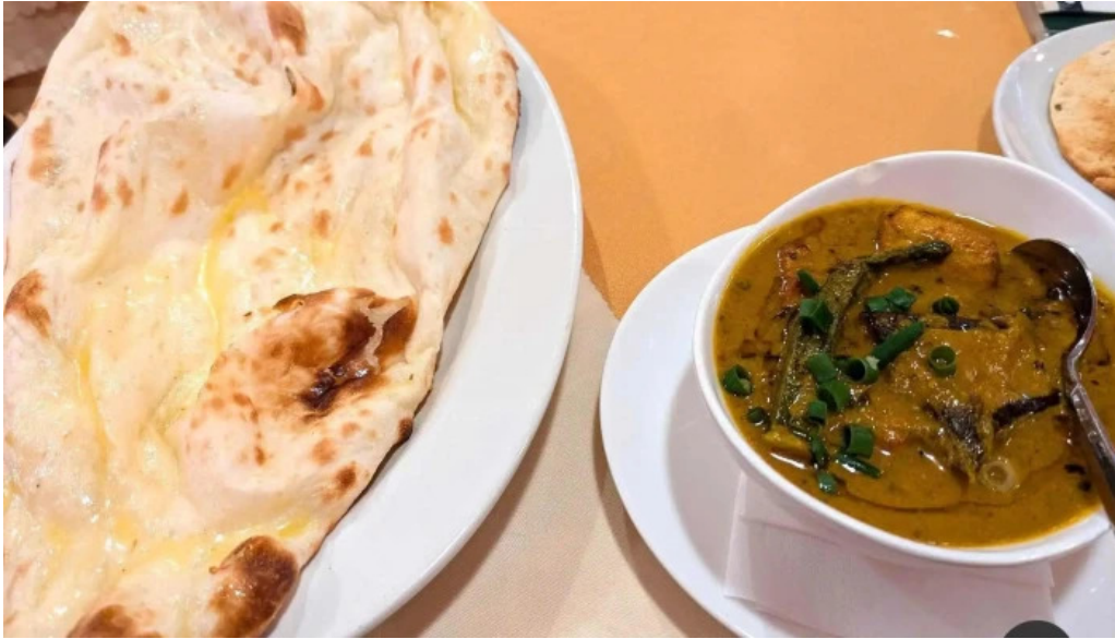
御殿場インドア halal ナン