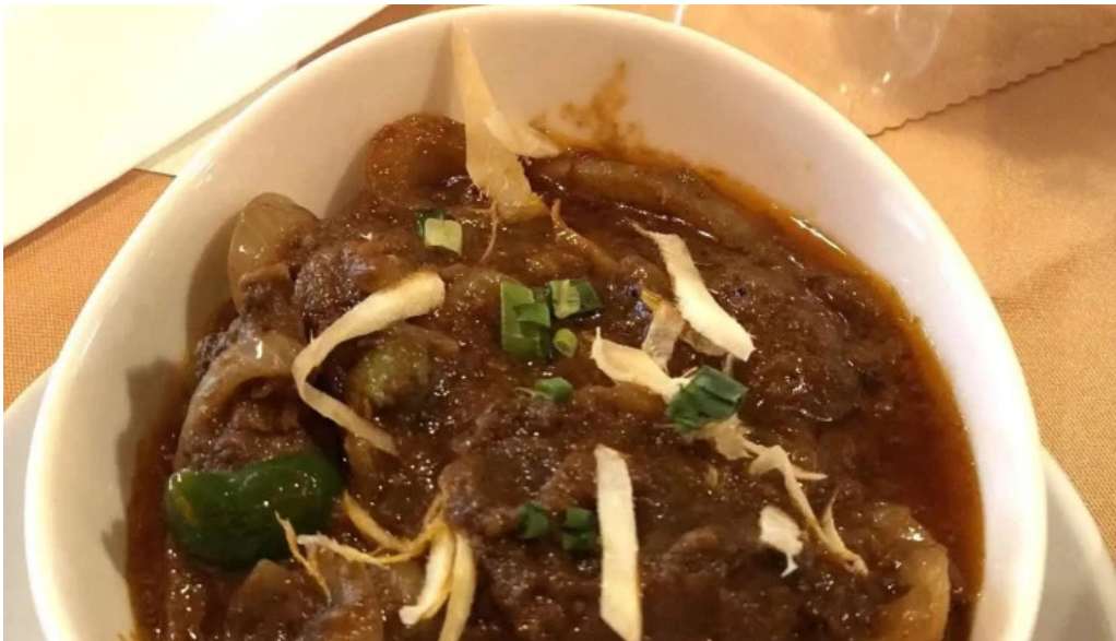
御殿場インドア halal ヴィンダルー