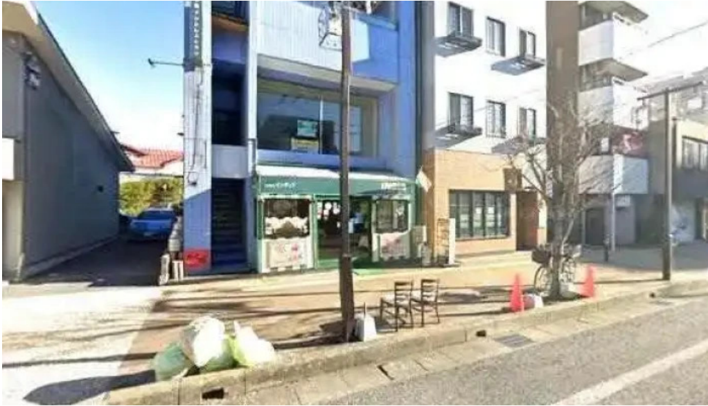
御殿場インドア halal 最新