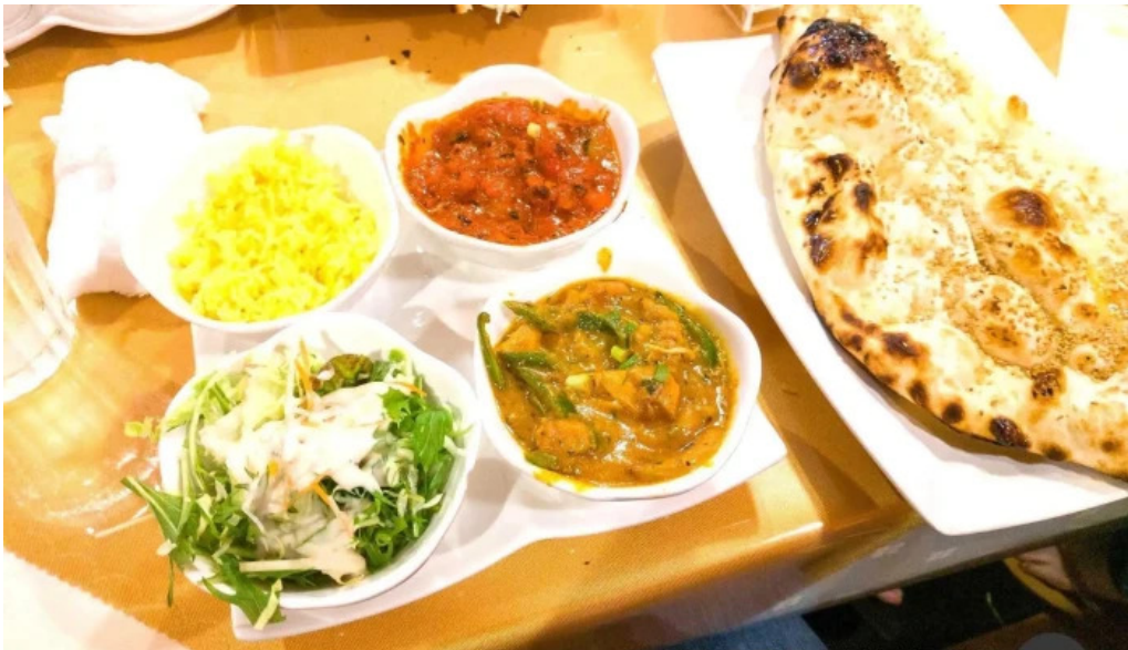
御殿場インドア halal カレー