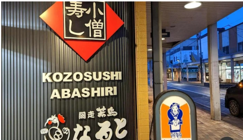
小僧寿し 網走店 すべて