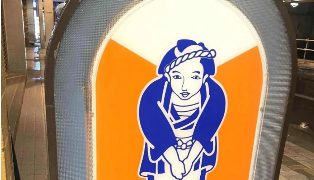
小僧寿し 網走店 comentario 1