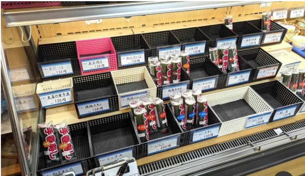
小僧寿し 網走店 メニュー