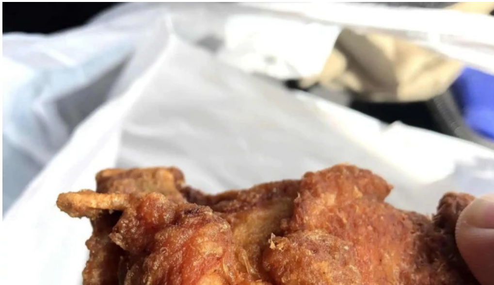
小僧寿し 網走店 comentario 4