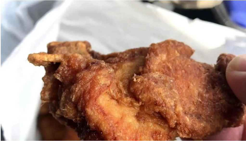
小僧寿し 網走店 料理飲み物