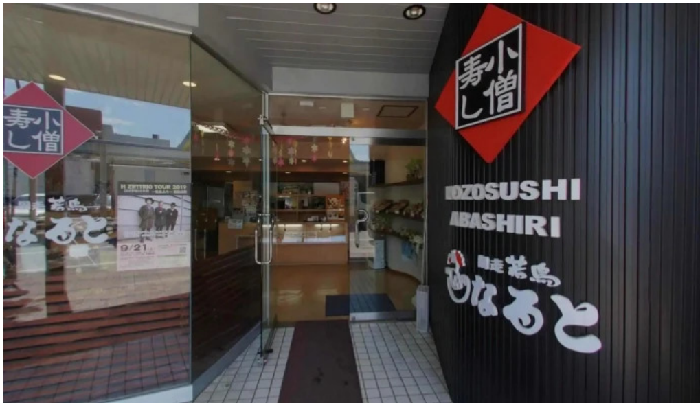
小僧寿し 網走店 ストリートビューと 360 ビュー