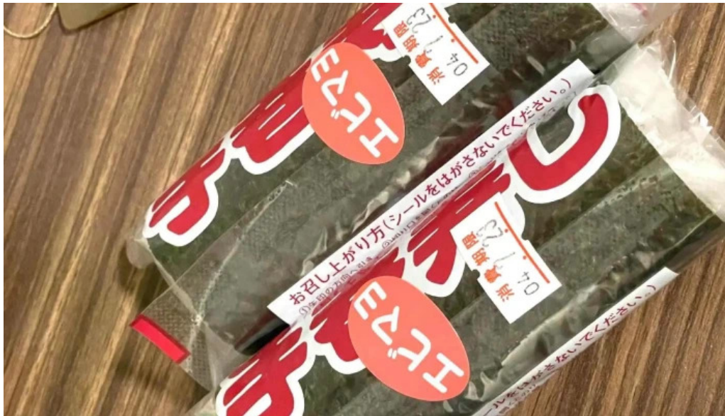
小僧寿し 網走店 comentario 3