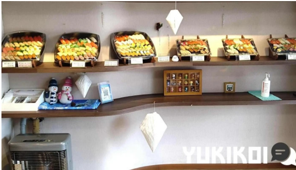
小僧寿し 網走店 雰囲気