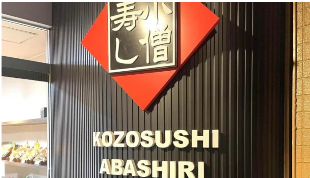
小僧寿し 網走店 comentario 2