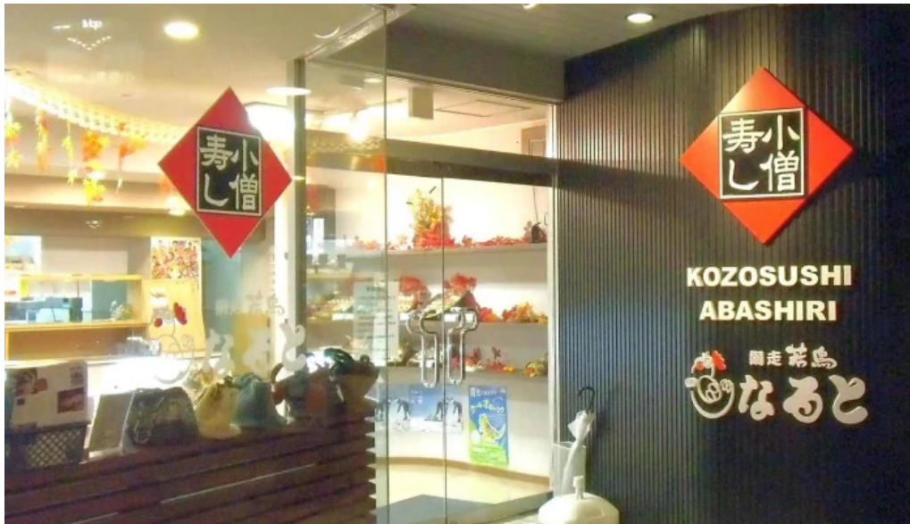
小僧寿し 網走店 comentario 5