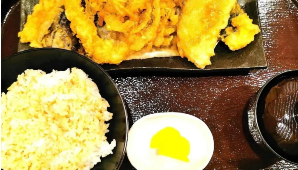
すし蔵のはなれ 江津店 comentario 6