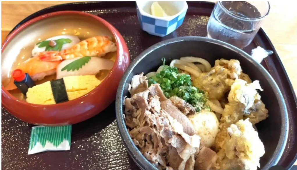
すし蔵のはなれ 江津店 料理飲み物