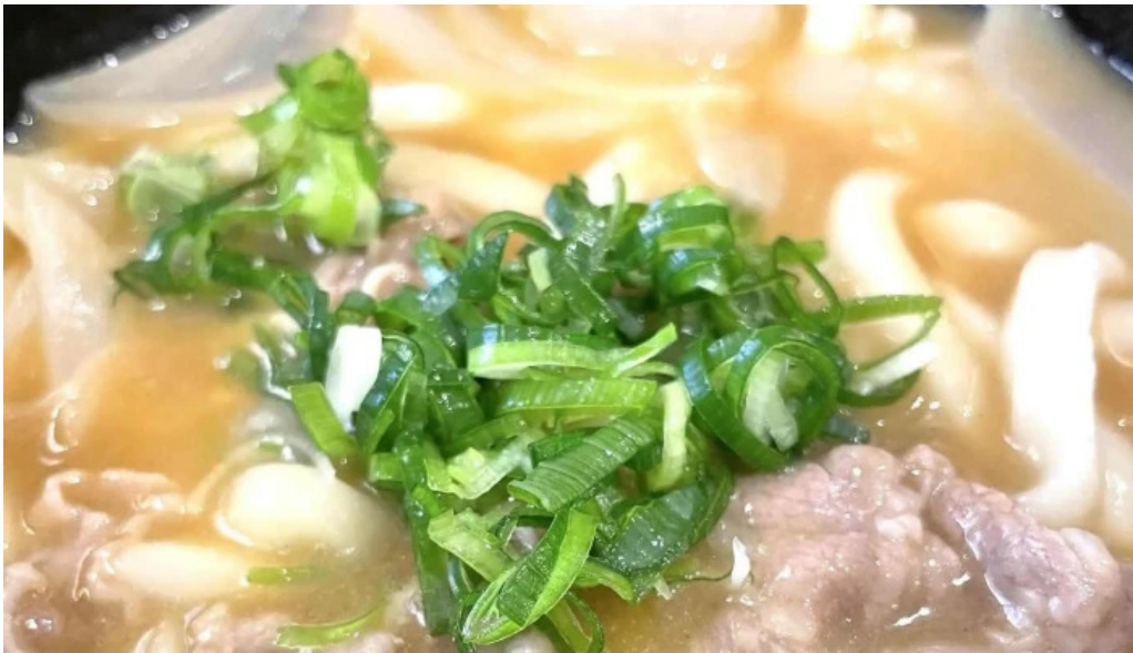
すし蔵のはなれ 江津店 comentario 5