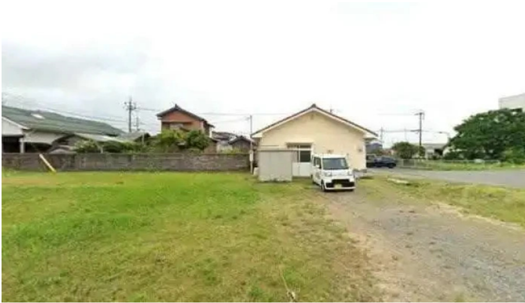
すし蔵のはなれ 江津店 ストリートビューと 360 ビュー