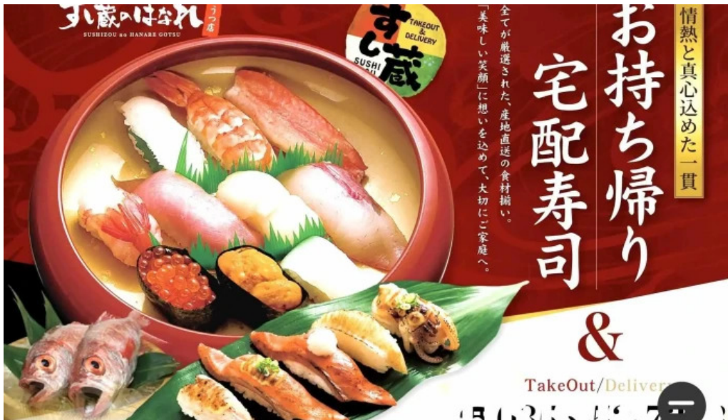
すし蔵のはなれ 江津店 メニュー