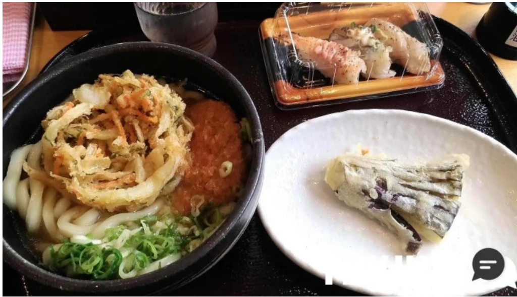
すし蔵のはなれ 江津店 すべて