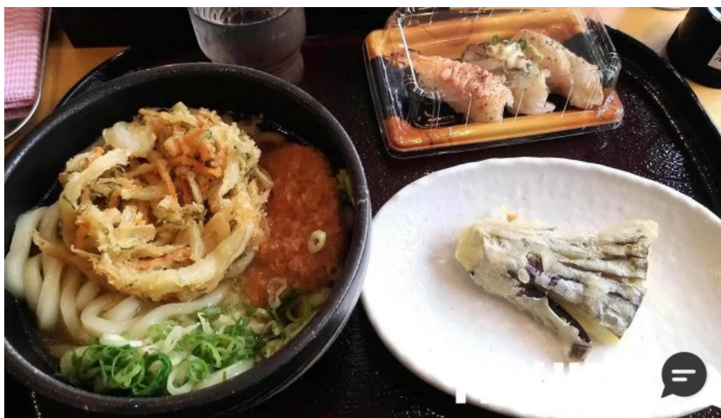
すし蔵のはなれ 江津店 江津市