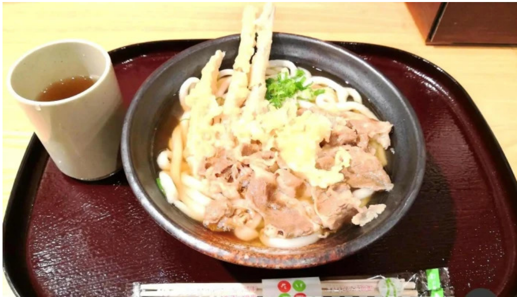
すし蔵のはなれ 江津店 うどん