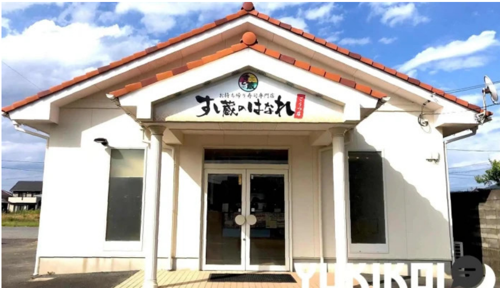
すし蔵のはなれ 江津店