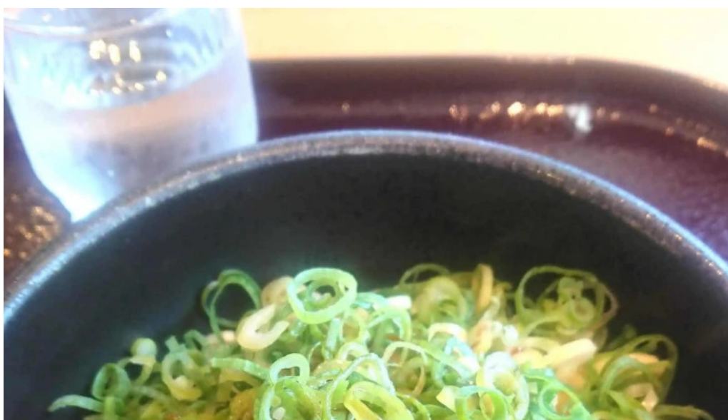
すし蔵のはなれ 江津店 comentario 1