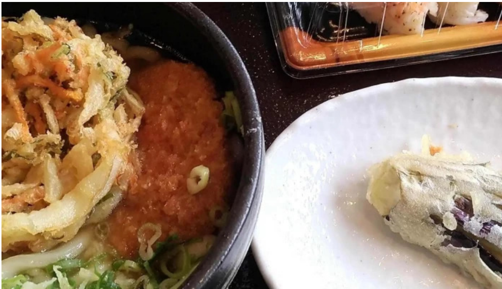
すし蔵のはなれ 江津店 comentario 3