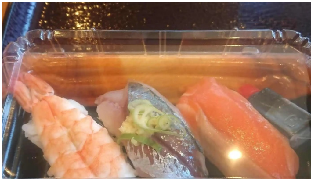
すし蔵のはなれ 江津店 comentario 2