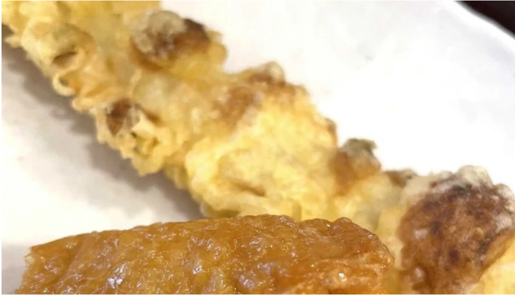
すし蔵のはなれ 江津店 comentario 4