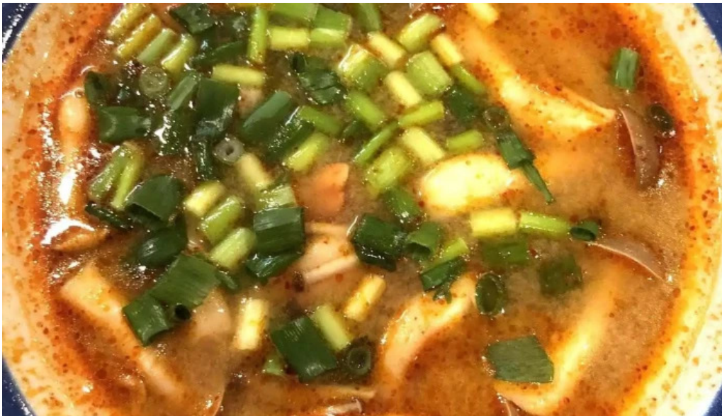
タイ料理 ライタイトムヤム