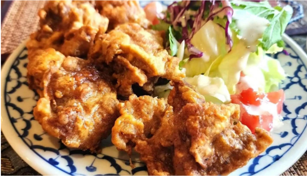
タイ料理 ライタイ から揚げ