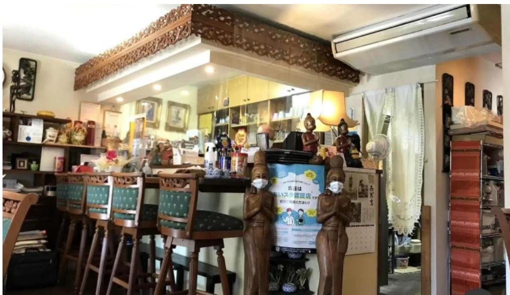
タイ料理 ライタイ 雰囲気