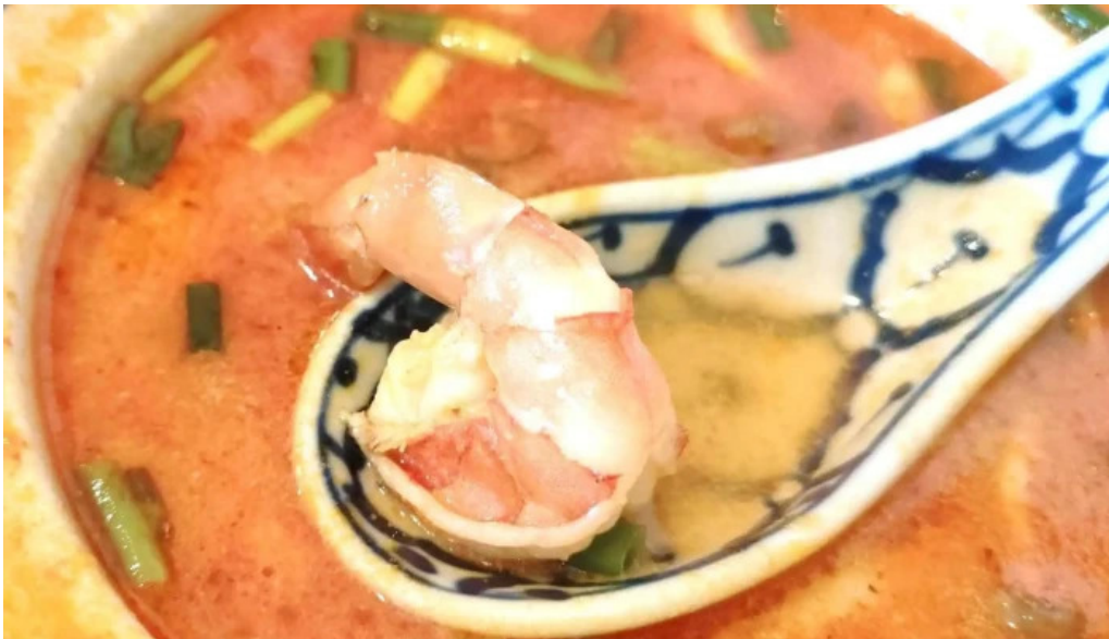
タイ料理 ライタイ 半田市