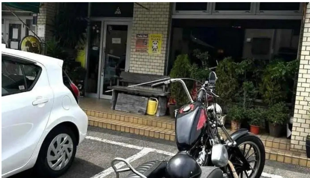
タイ料理 ライ・タイ 半田市