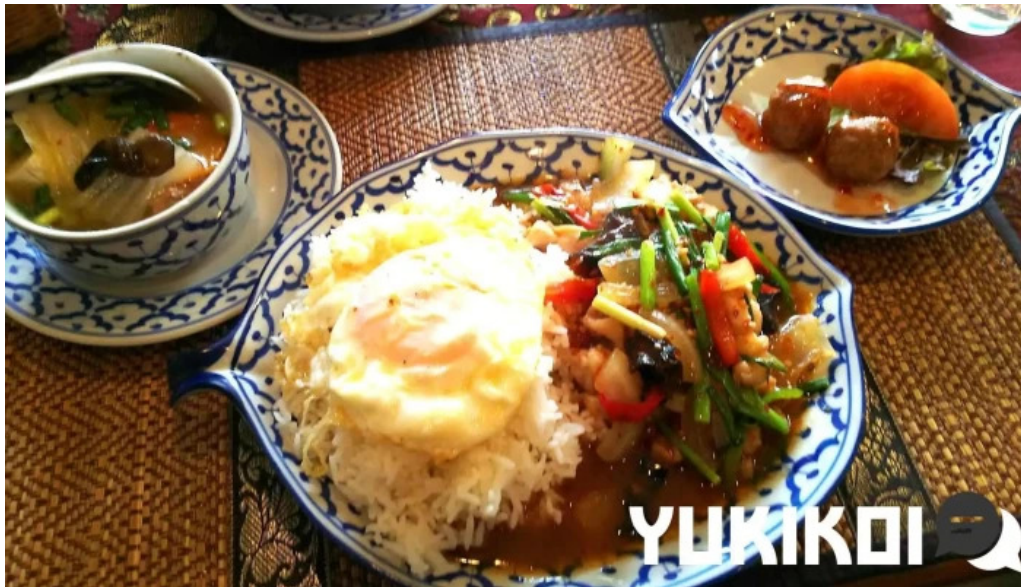
タイ料理 ライタイ スープ