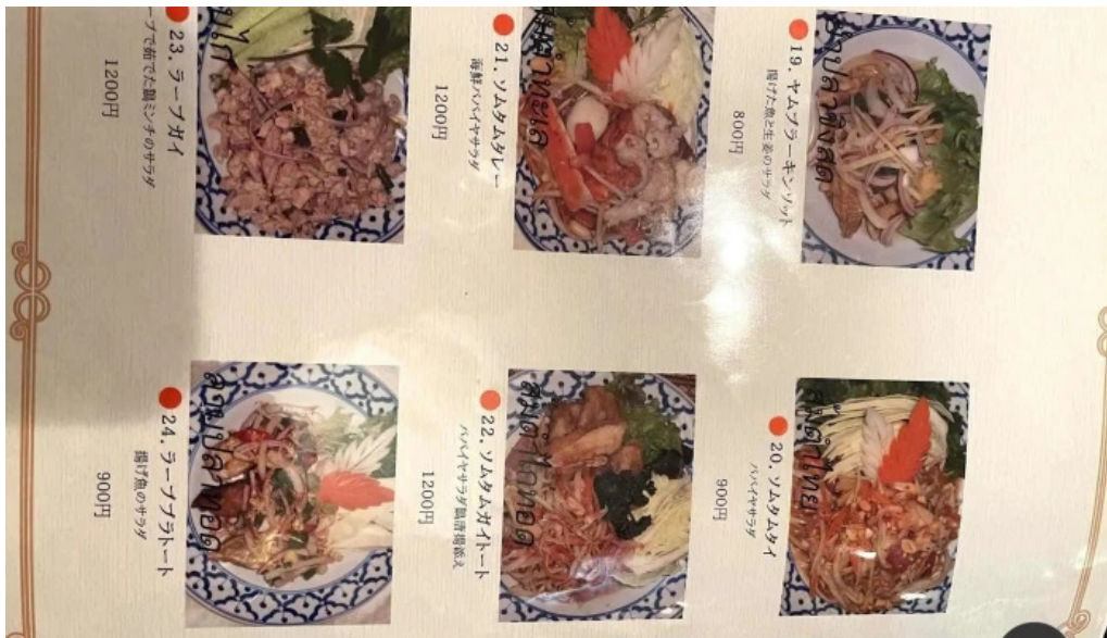
タイ料理 ライタイメニュー