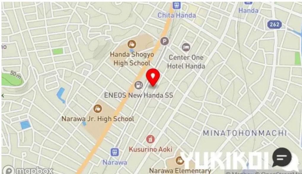
タイ料理 ライタイ 地図