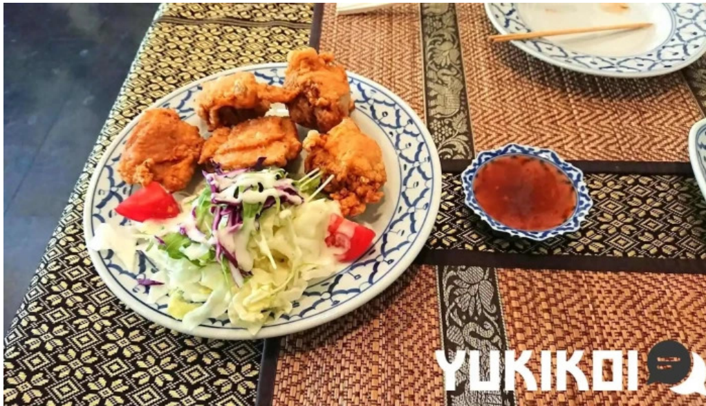
タイ料理 ライタイ 料理飲み物