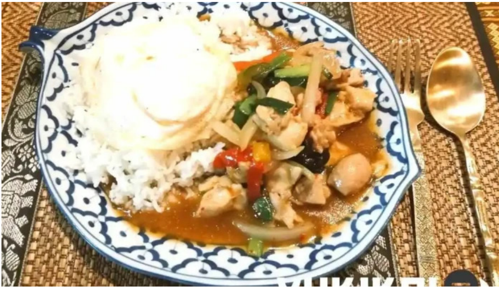
タイ料理 ライタイ カレー