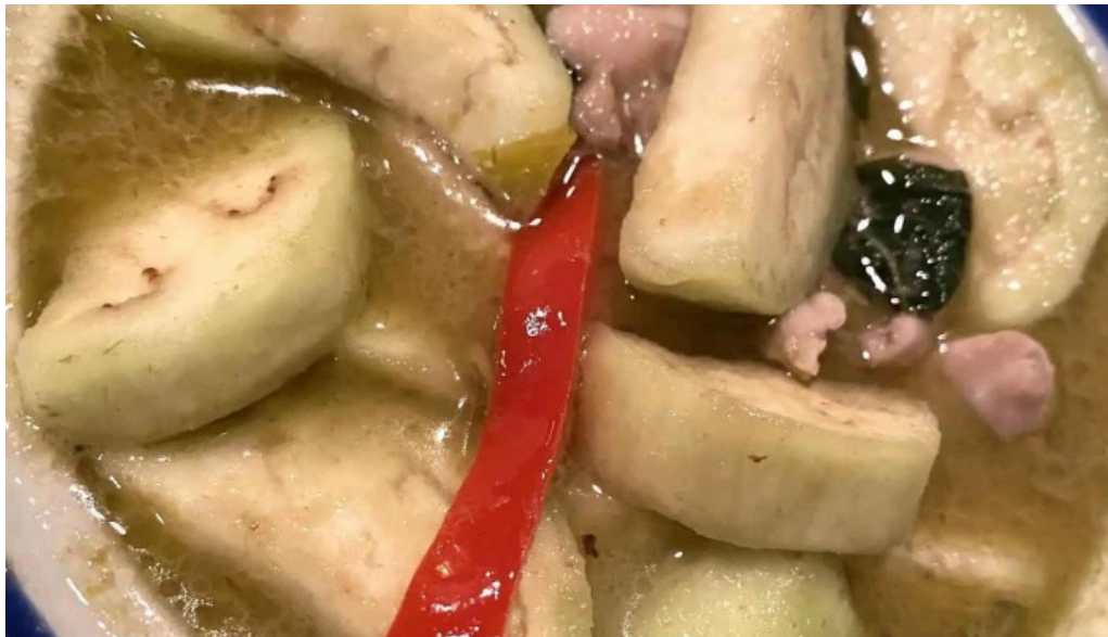
タイ料理 ライタイ グリーンカレー