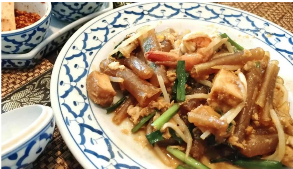
タイ料理 ライタイ 所在地