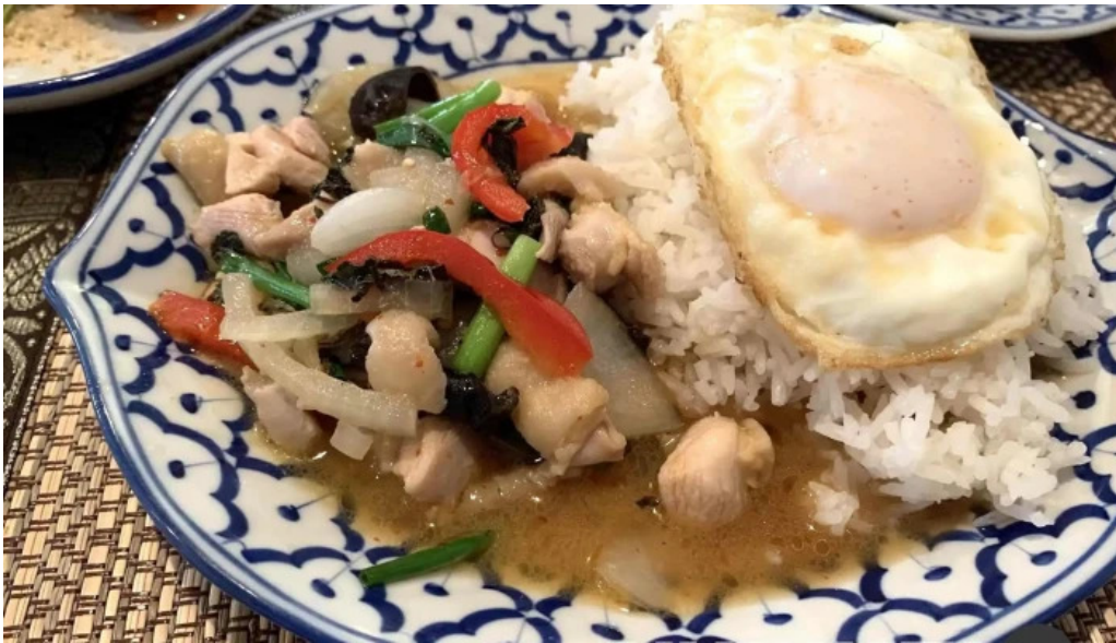
タイ料理 ライタイ カオパット