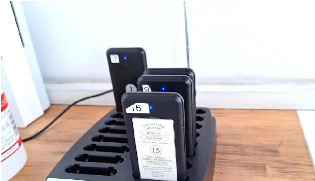
ステーキハンバーグ ビッグシェフ亭 野田店 動画