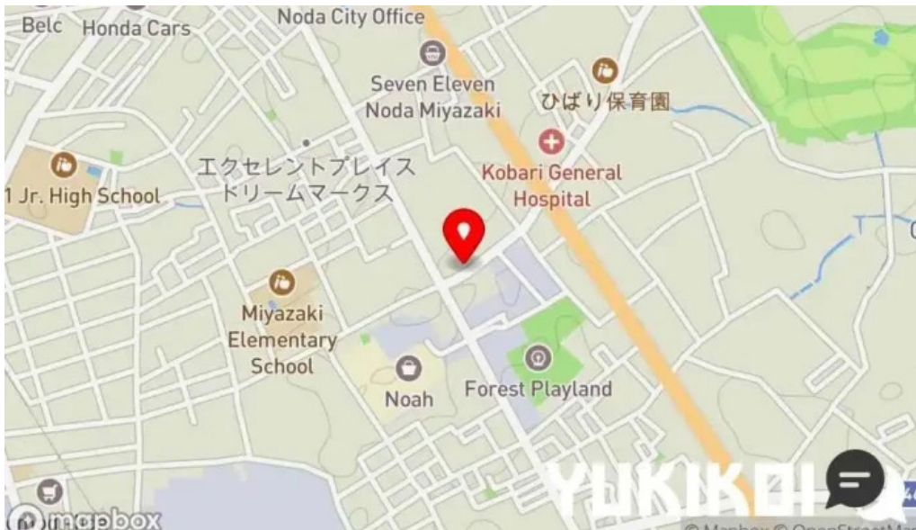
ステーキハンバーグ ビッグシェフ亭 野田店 地図