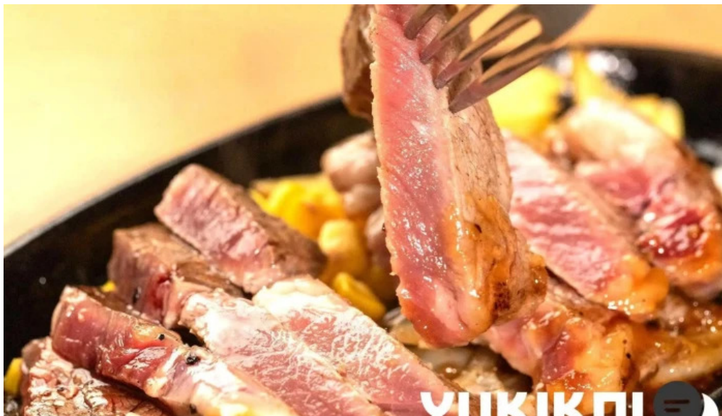
ステーキハンバーグ ビッグシェフ亭 野田店 ステーキ