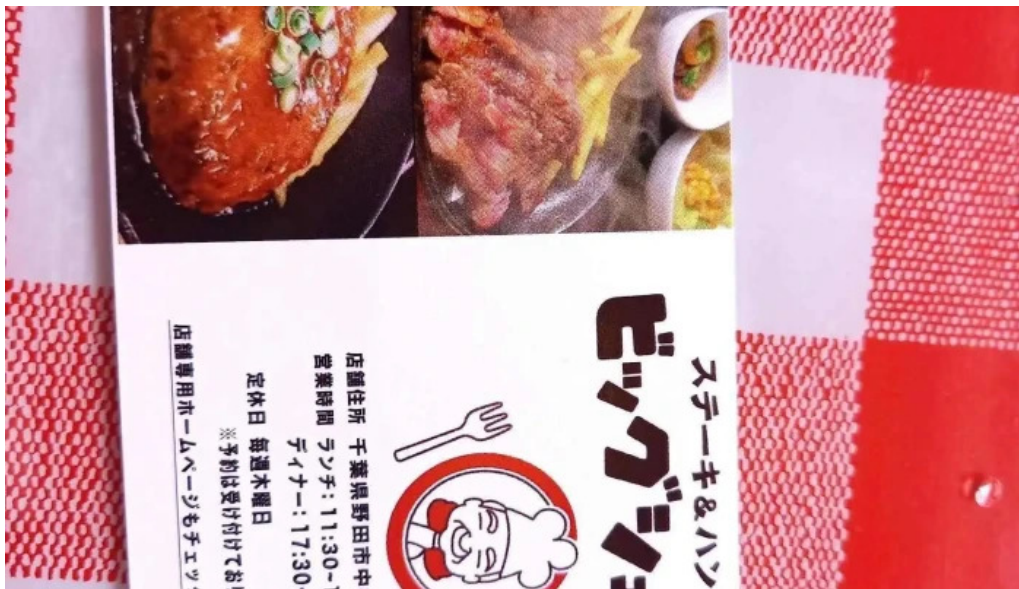
ステーキハンバーグ ビッグシェフ亭 野田店 メニュー