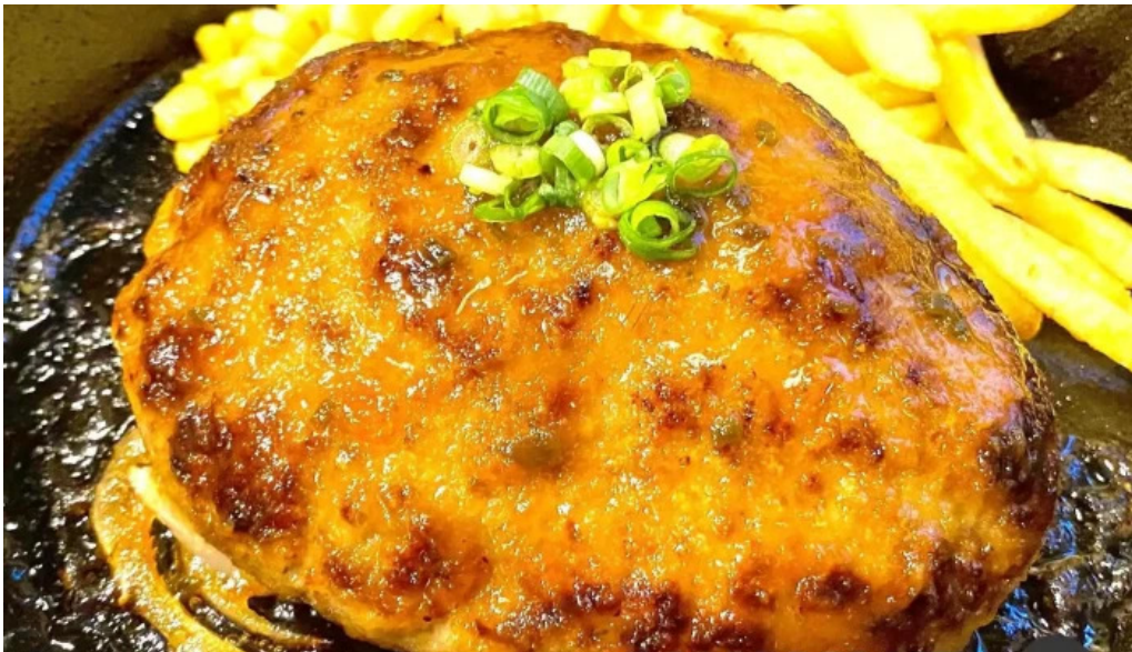
ステーキハンバーグ ビッグシェフ亭 野田店 フライドポテト