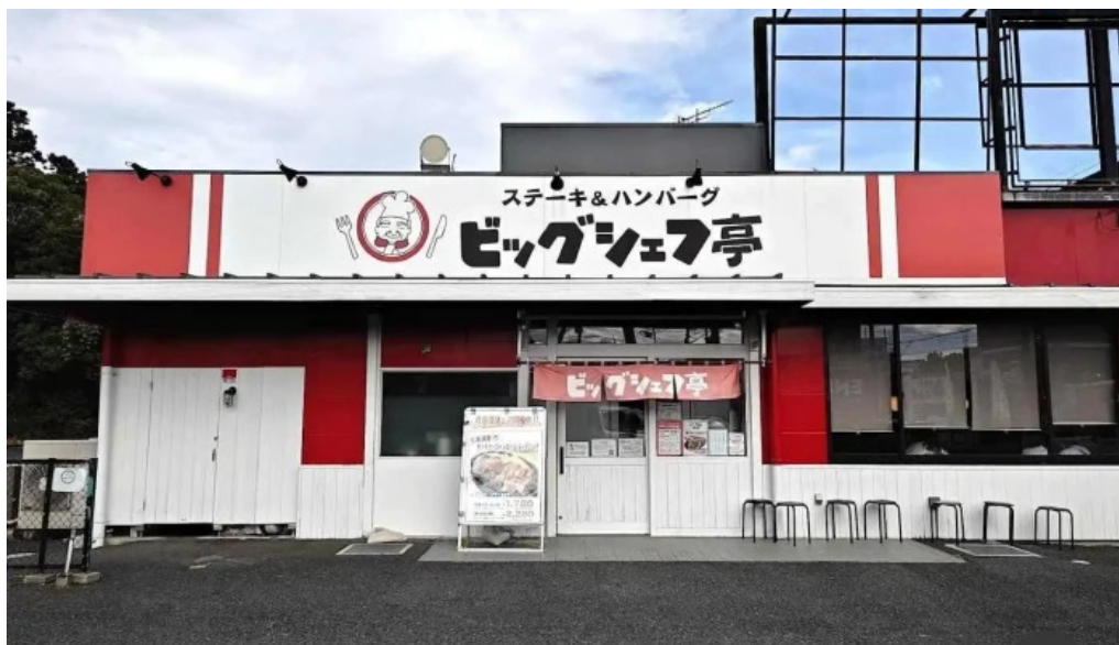
ステーキ&ハンバーグ ビッグシェフ亭 野田店 野田市