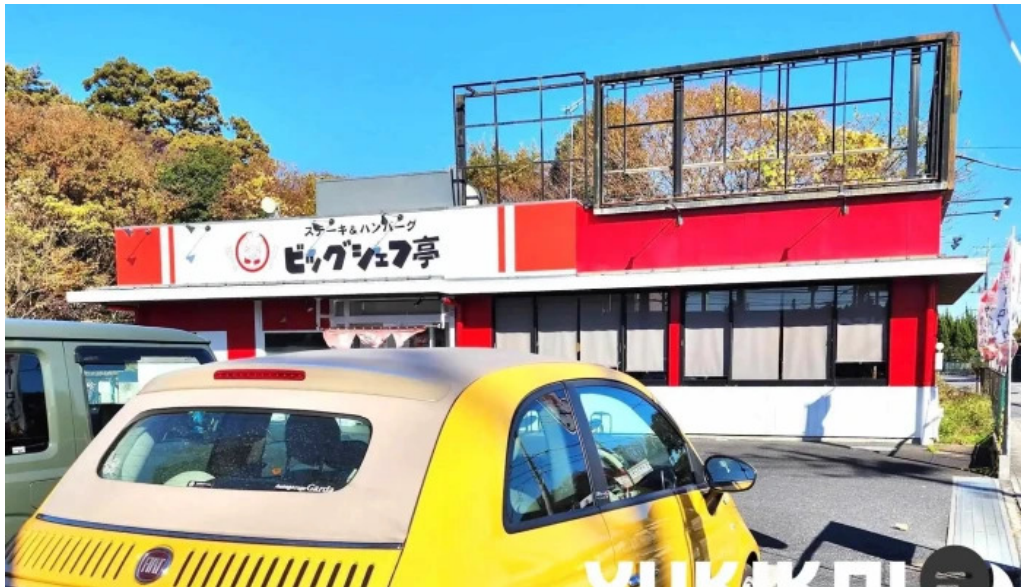
ステーキハンバーグ ビッグシェフ亭 野田店 最新