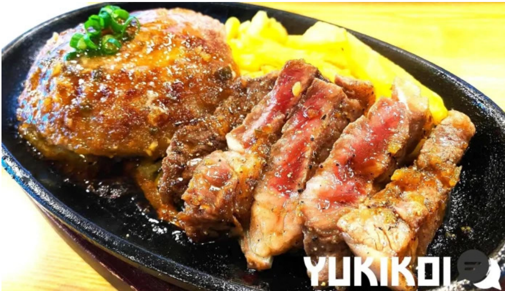
ステーキハンバーグ ビッグシェフ亭 野田店