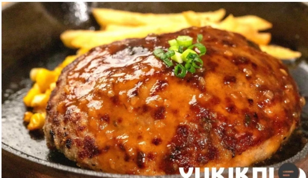
ステーキハンバーグ ビッグシェフ亭 野田店 料理飲み物