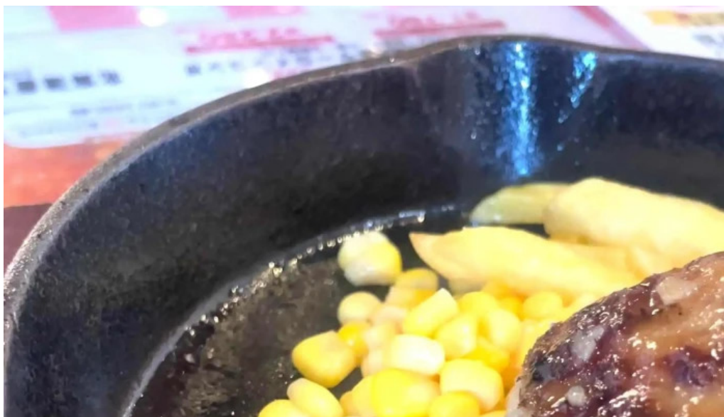
ステーキハンバーグ ビッグシェフ亭 野田店 スコア