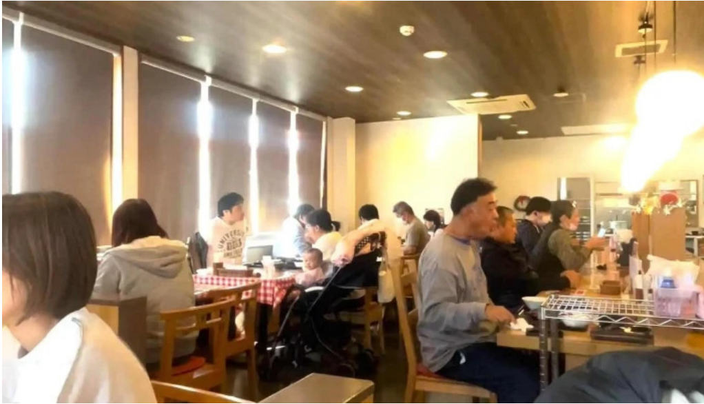
ステーキハンバーグ ビッグシェフ亭 野田店 コメント