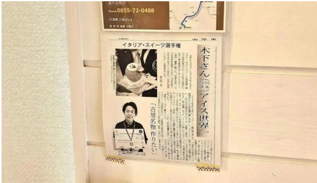
ピッコルツメニュー