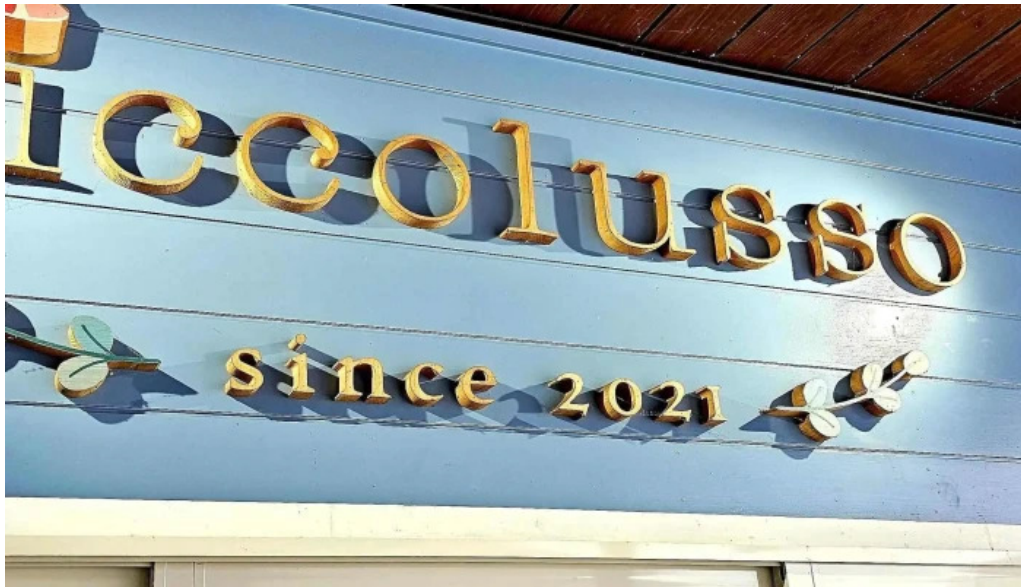
ピッコルツソ comentario 2