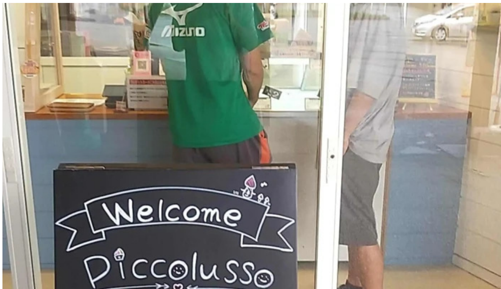
ピッコルツソ comentario 1