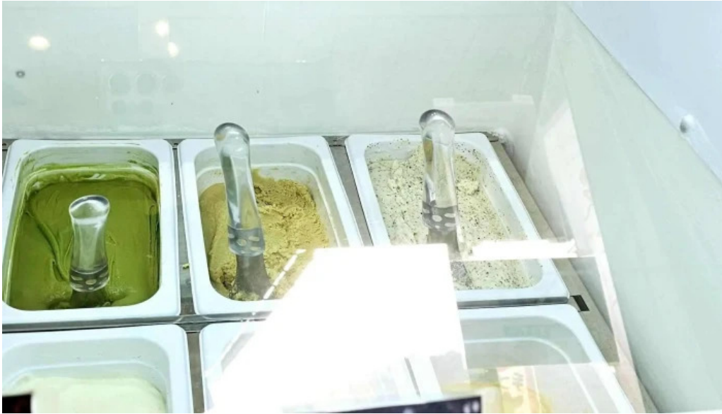
ピッコルツソ comentario 4