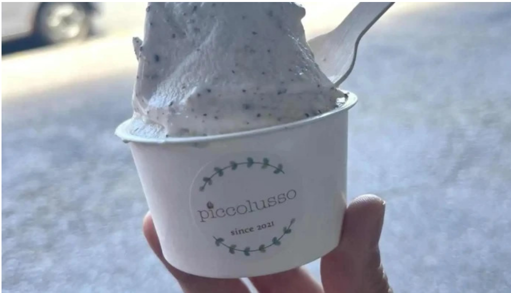
ピッコルッソ アイスクリーム