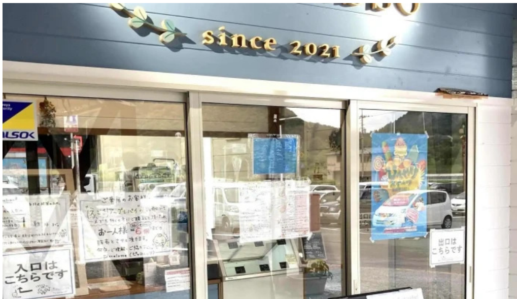
ピッコルツソ comentario 6