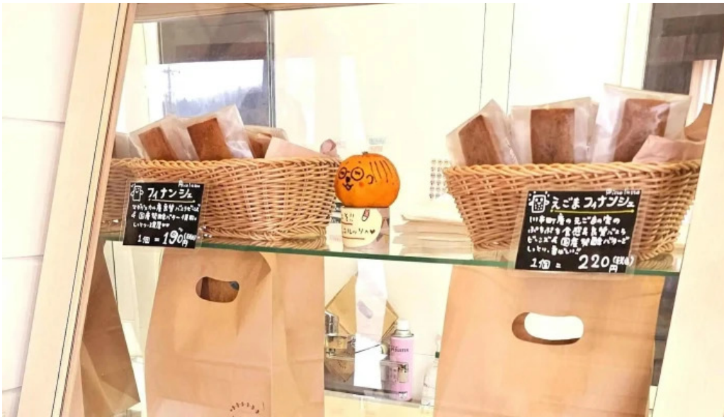
ピッコルツソ comentario 3