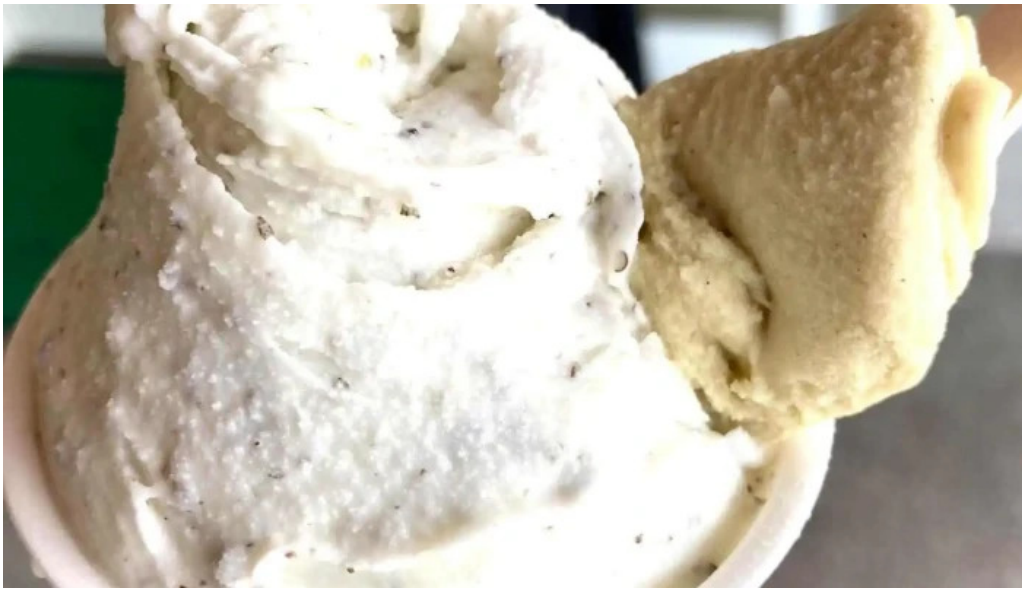
ピッコルッソ ジェラート