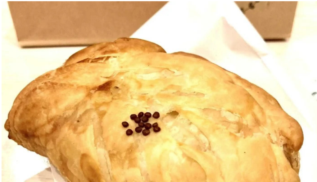
ピッコルツソ comentario 7