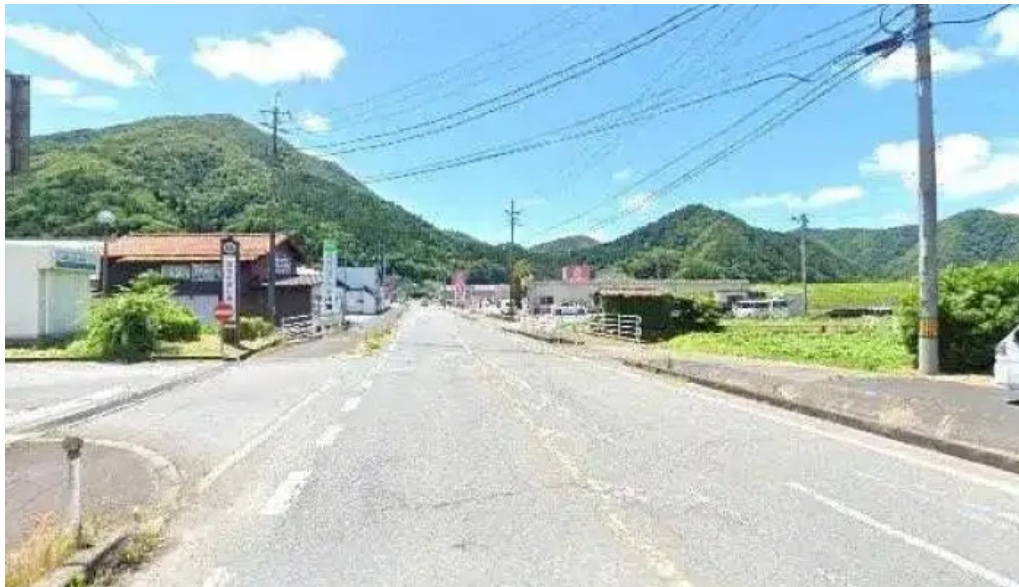
ピッコルツ ストリートビューと 360 ビュー