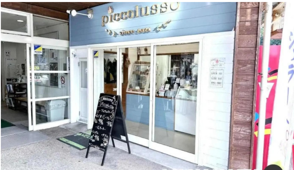
ピッコルッソ 川本町