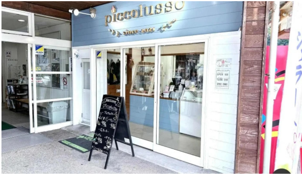
ピッコルツソ すべて