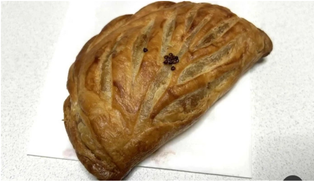
ピッコルッソ 料理飲み物