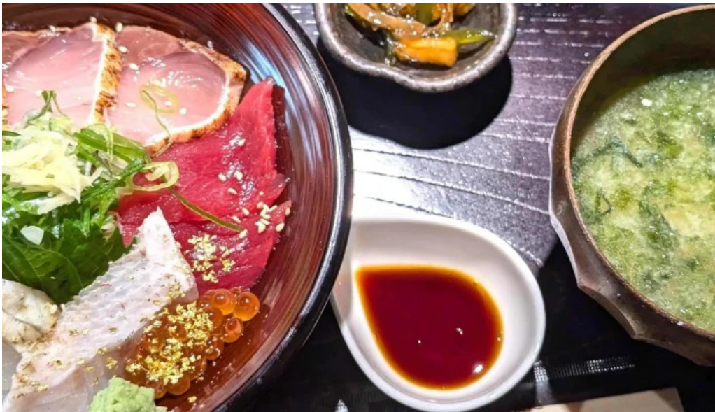
うしおや カタログ