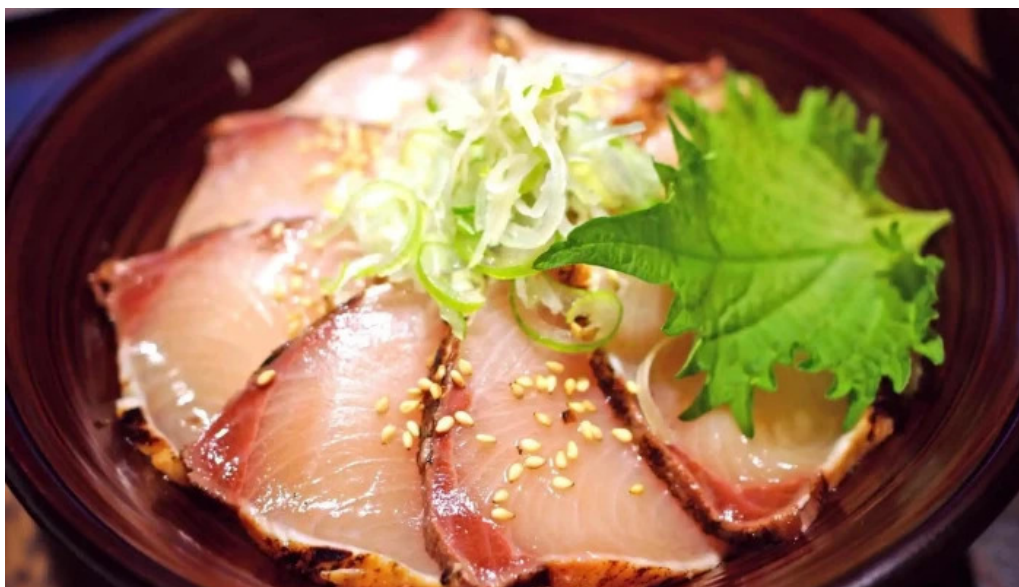
うしおや オーナー提供