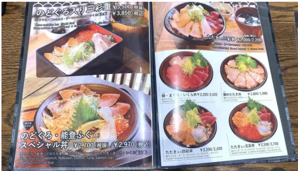
うしおや メニュー