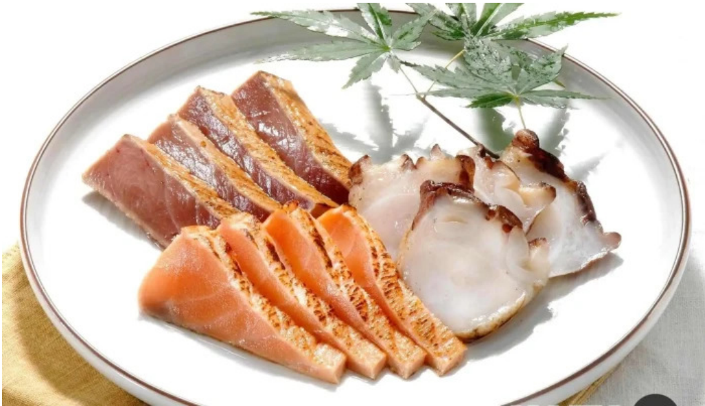
うしおや 料理飲み物