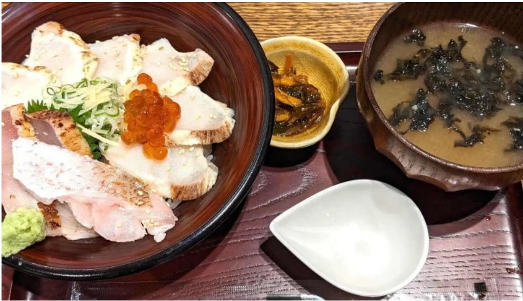
うしおや コメント