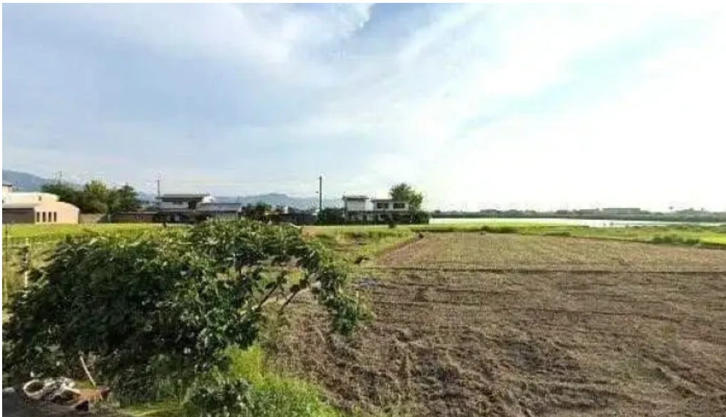
たこのやーちゃん 観音寺市