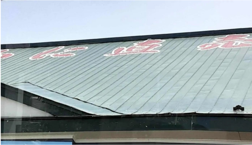
入丸水産 comentario 7