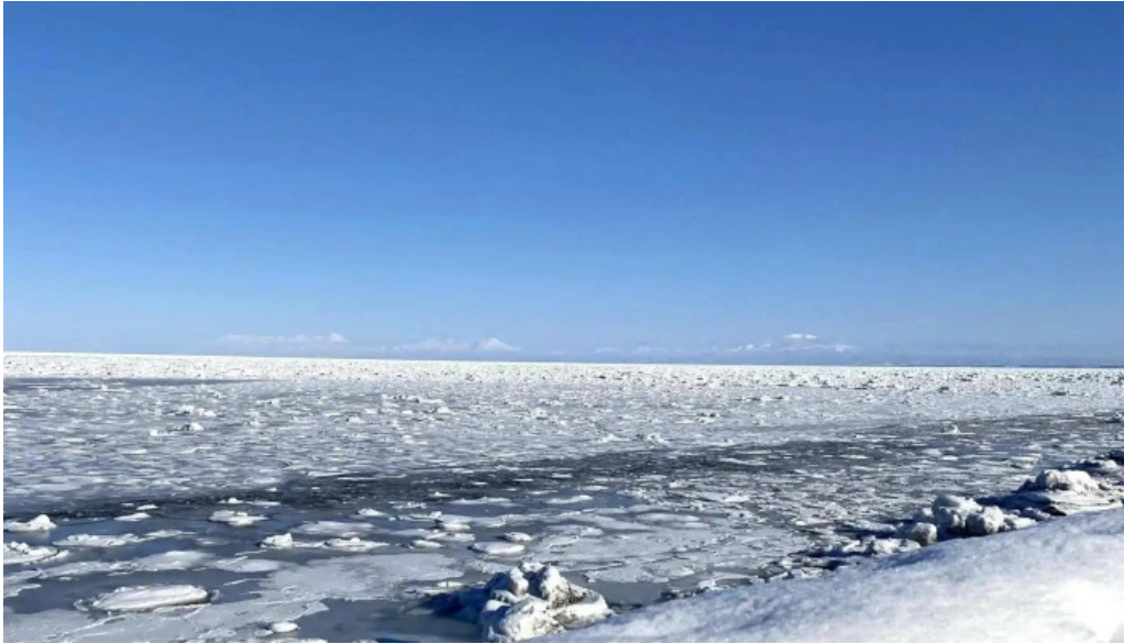
入丸水産 comentario 5