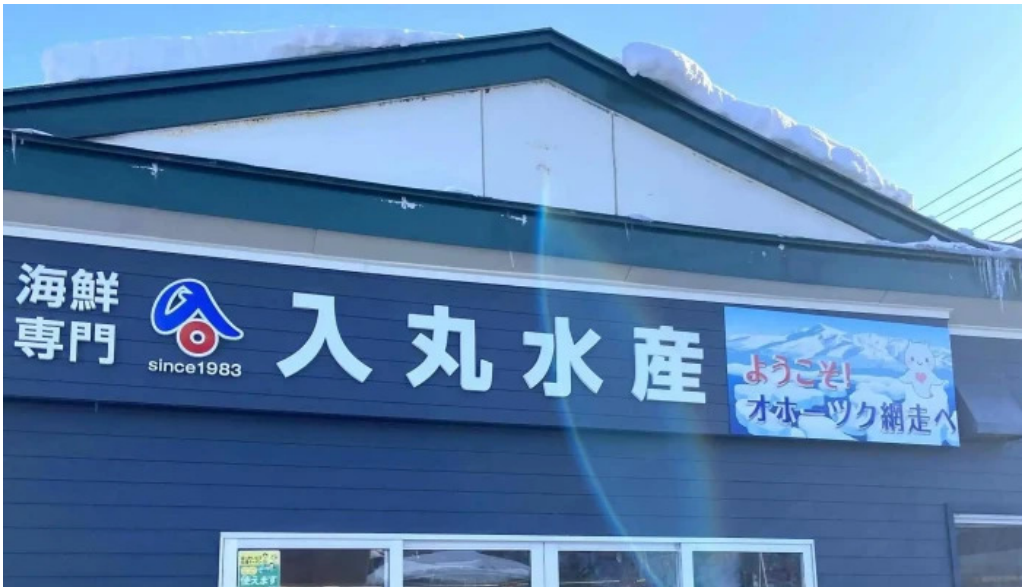
入丸水産 comentario 2