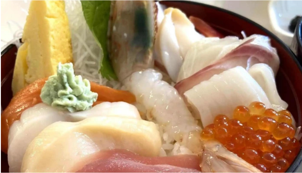
入丸水産 comentario 3