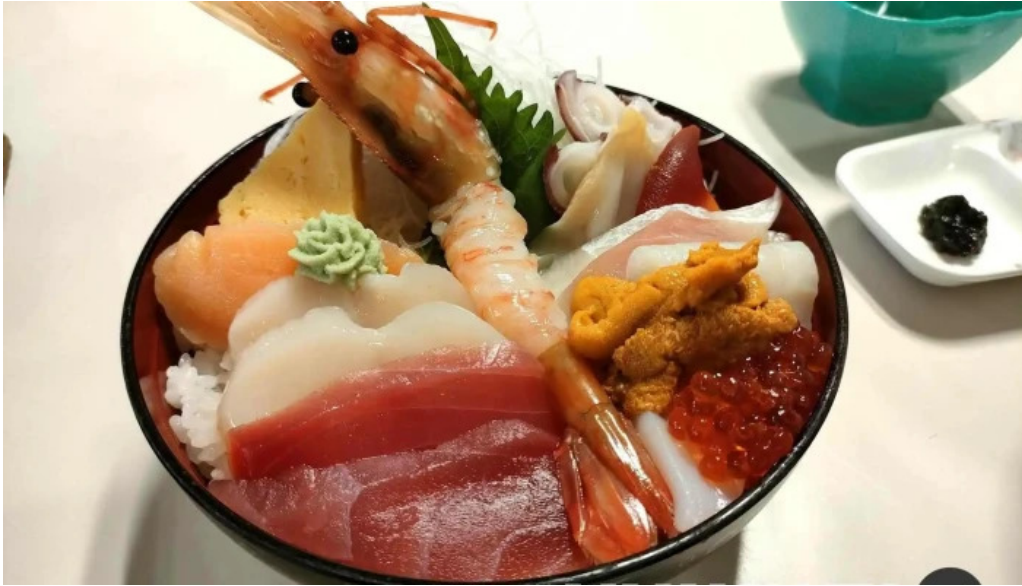
入丸水産 料理飲み物