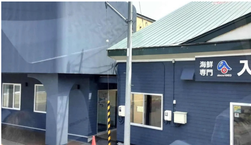
入丸水産 comentario 8