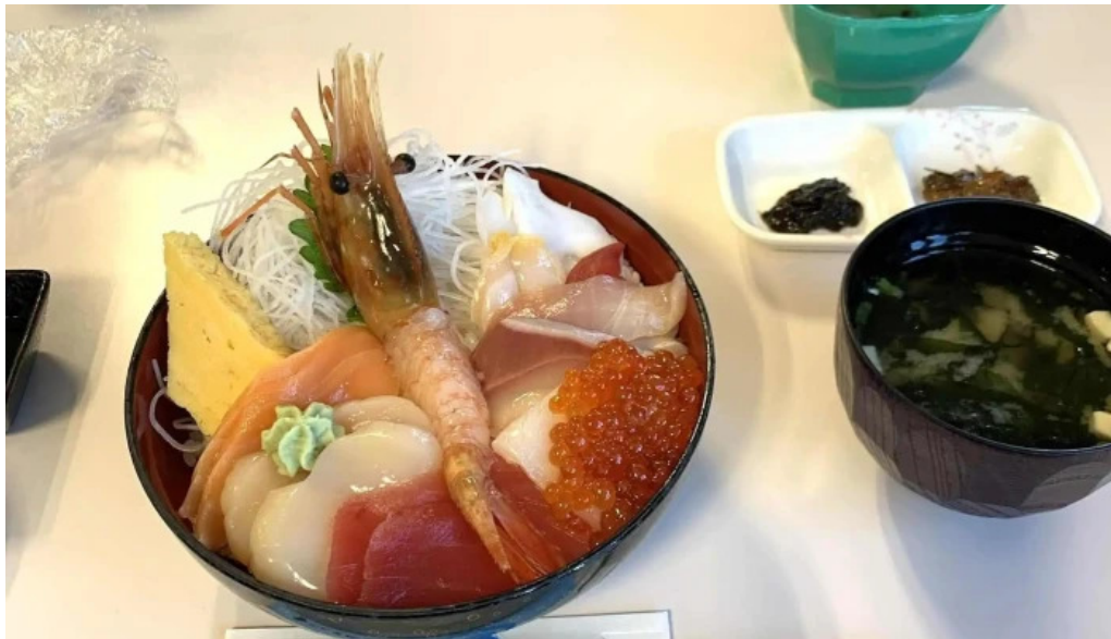
入丸水産 comentario 1