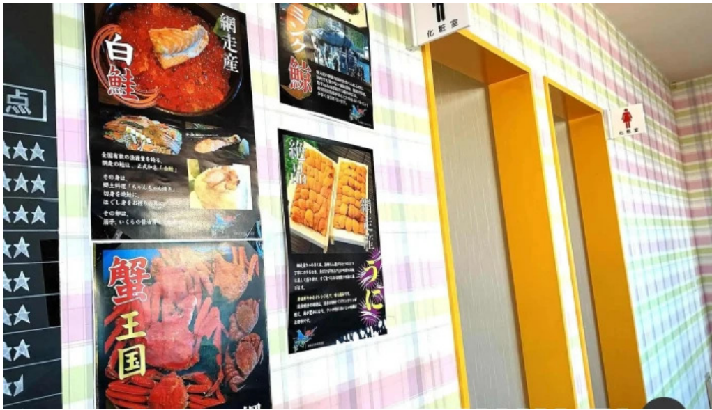
入丸水産 メニュー