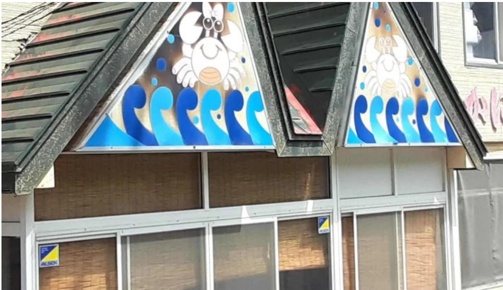
入丸水産 comentario 6