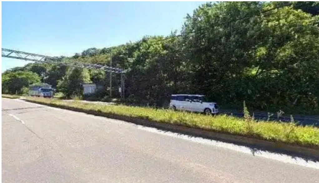
入丸水産 ストリートビューと 360 ビュー