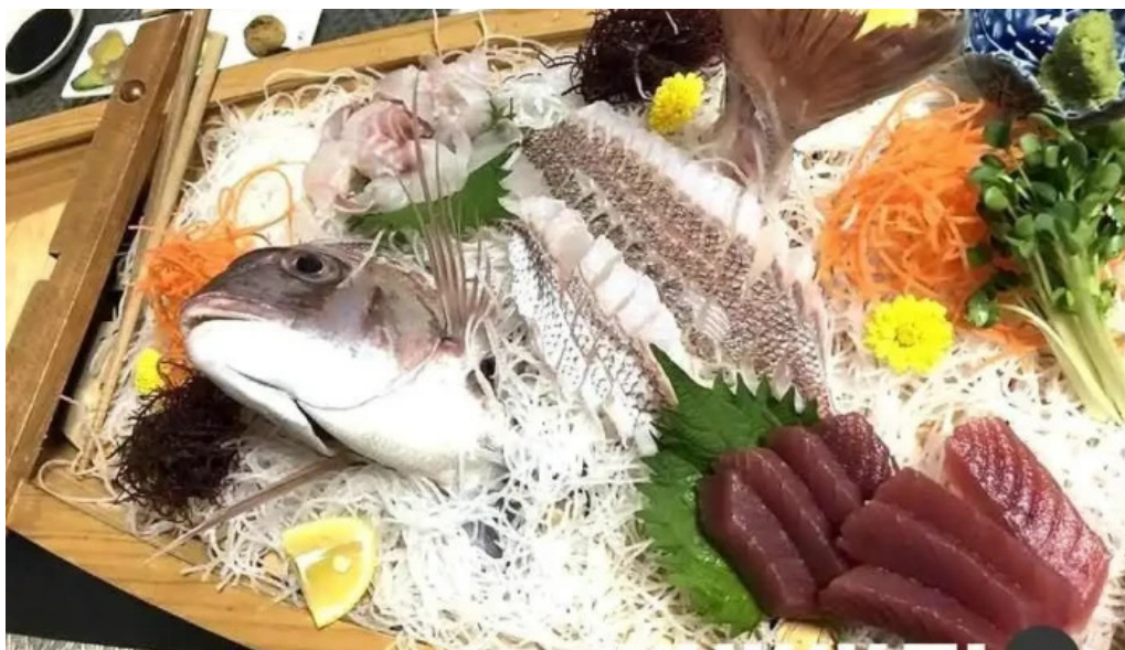
活魚磯物 多賀田 魚類