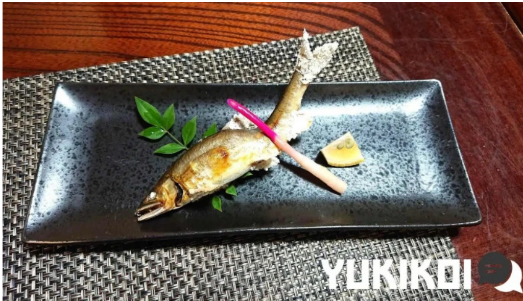
活魚磯物 多賀田 懐石