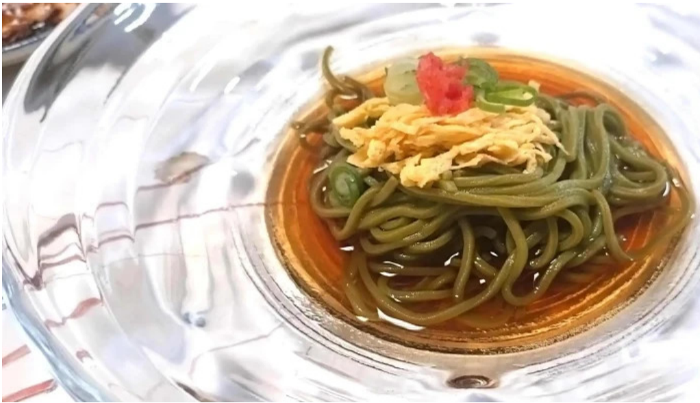
活魚磯物 多賀田 コメント