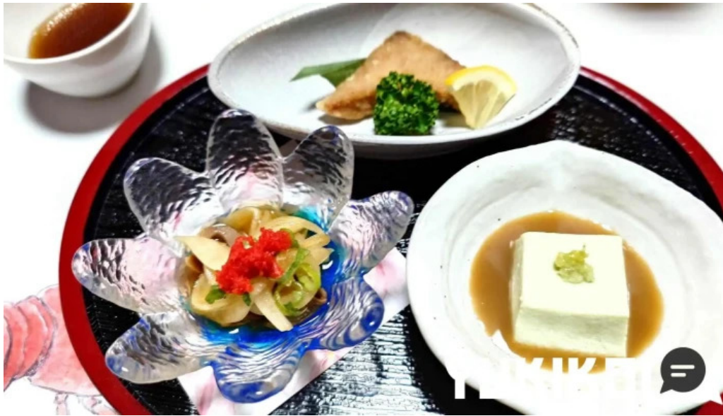
活魚磯物 多賀田 料理飲み物