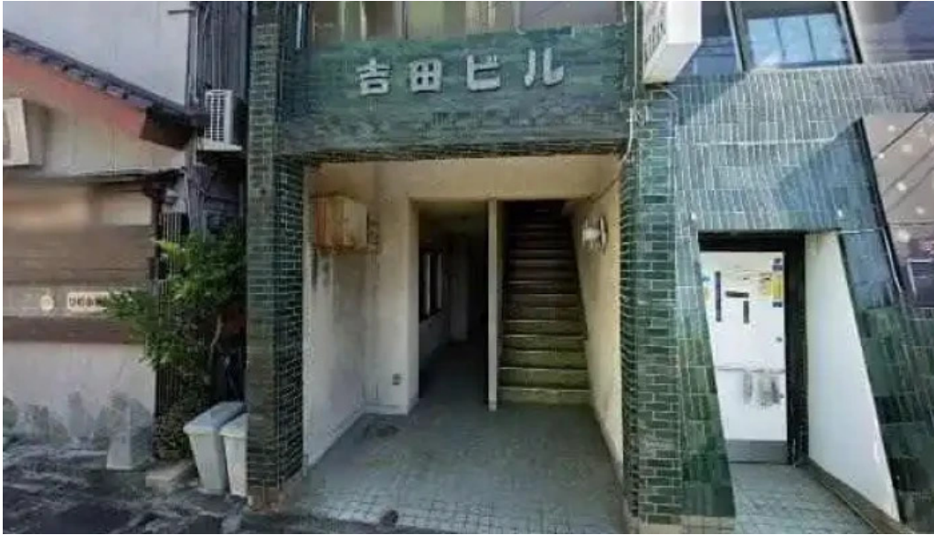
活魚磯物 多賀田 延岡市