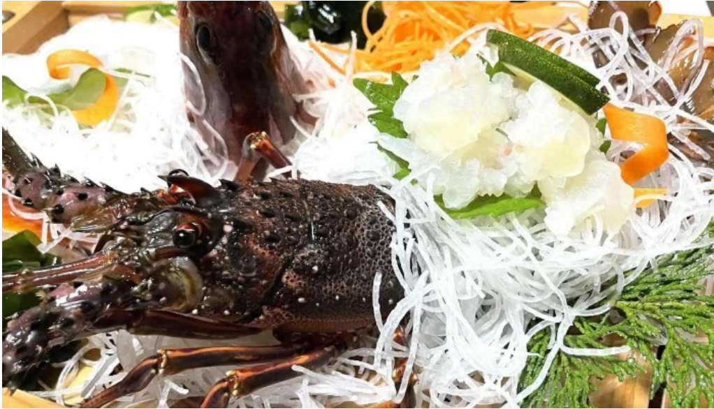
活魚磯物 多賀田 instagram