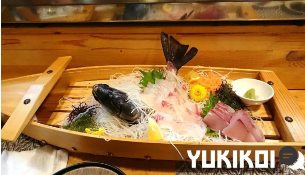
活魚磯物 多賀田 刺身