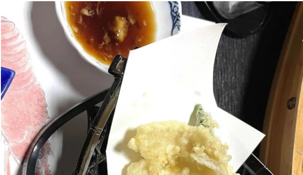
活魚磯物 多賀田 ウェブサイト