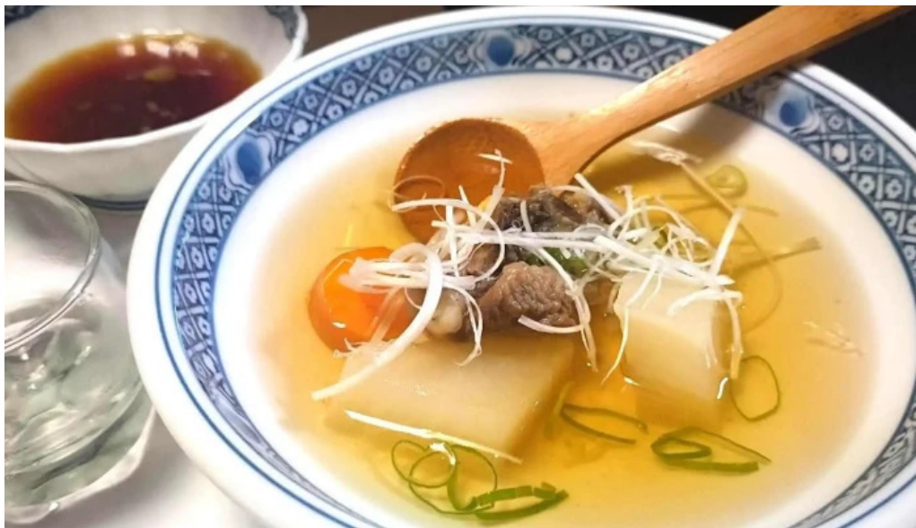
活魚磯物 多賀田 営業時間