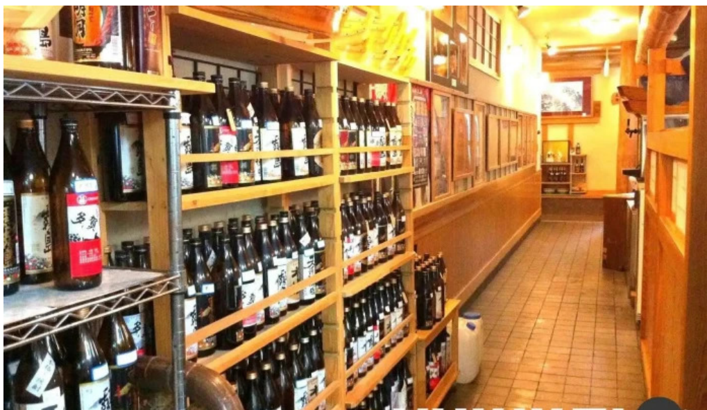
活魚磯物 多賀田 雰囲気