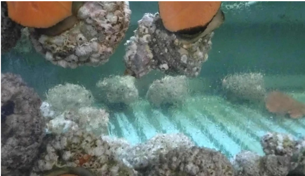
活魚磯物 多賀田 プロモーション