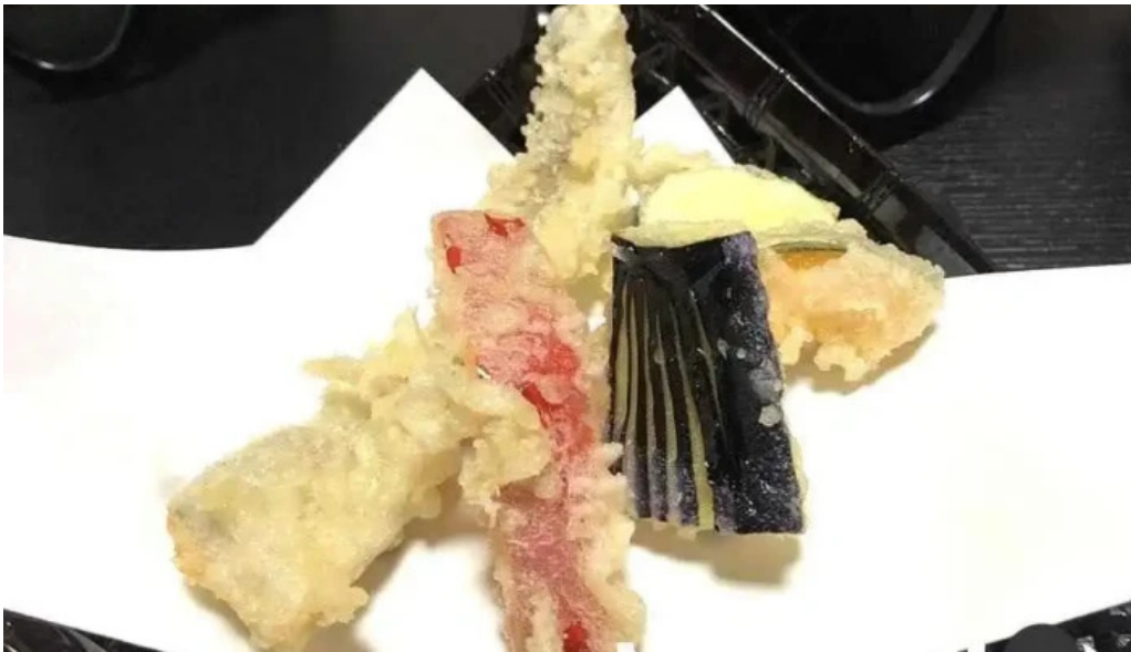
活魚磯物 多賀田 天ぷら