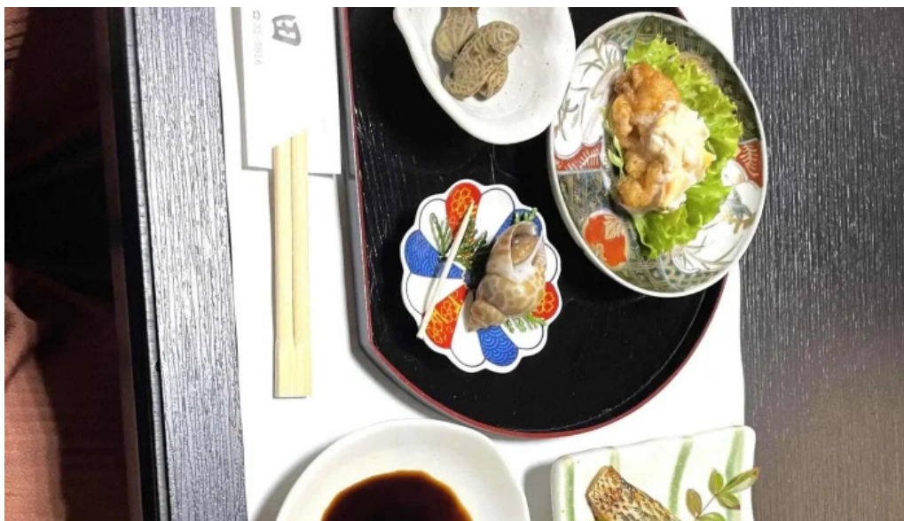
活魚磯物 多賀田 料金