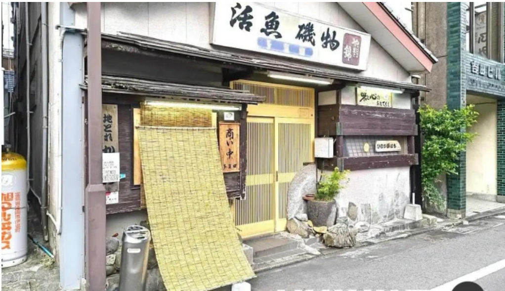
活魚・磯物 多賀田 延岡市