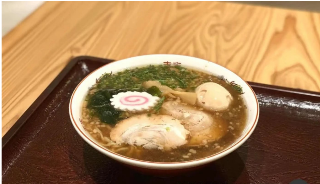
港の食堂kan ラーメン