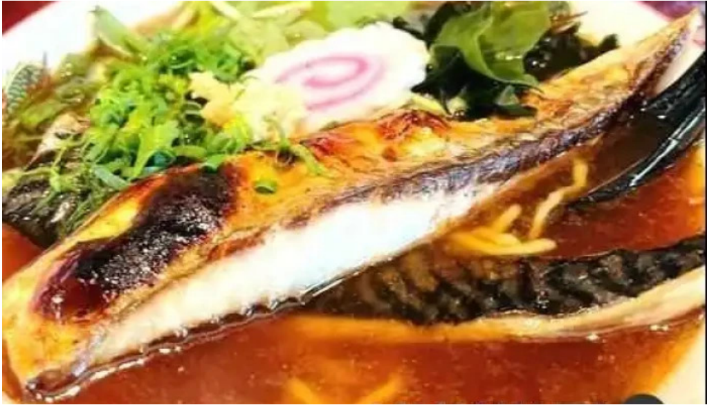
港の食堂kan 料理飲み物