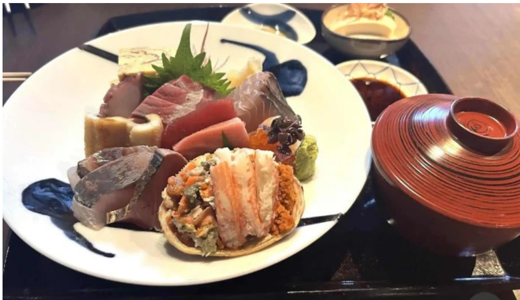
越前 蟹の坊 最新