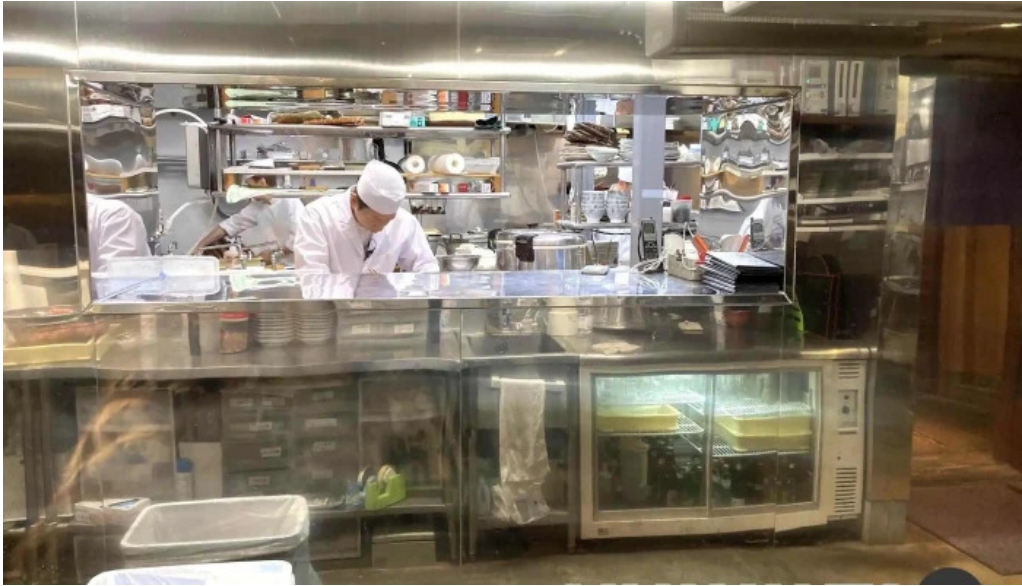
越前 蟹の坊 雰囲気