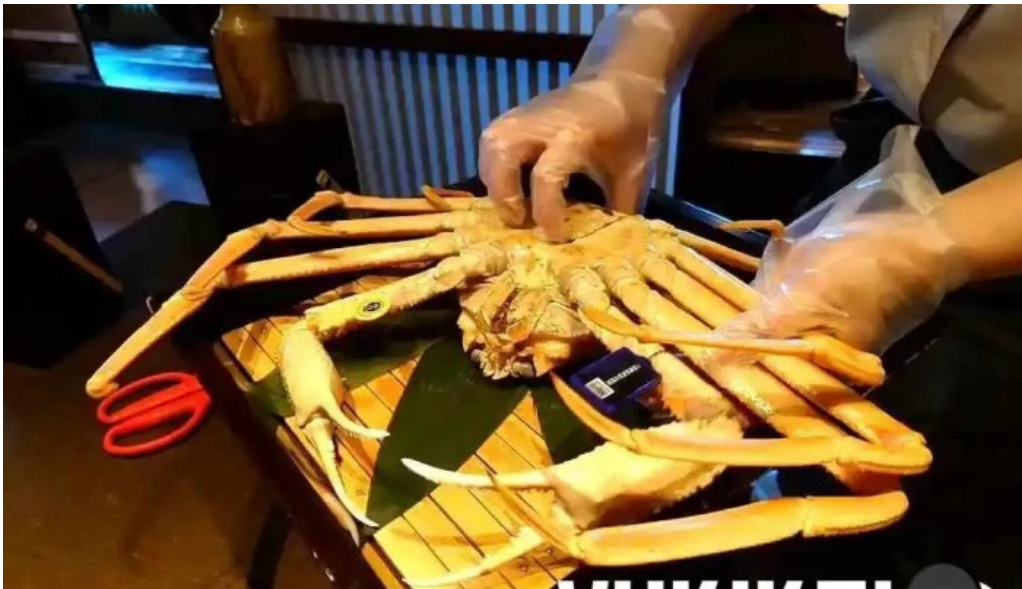
越前 蟹の坊 カニ