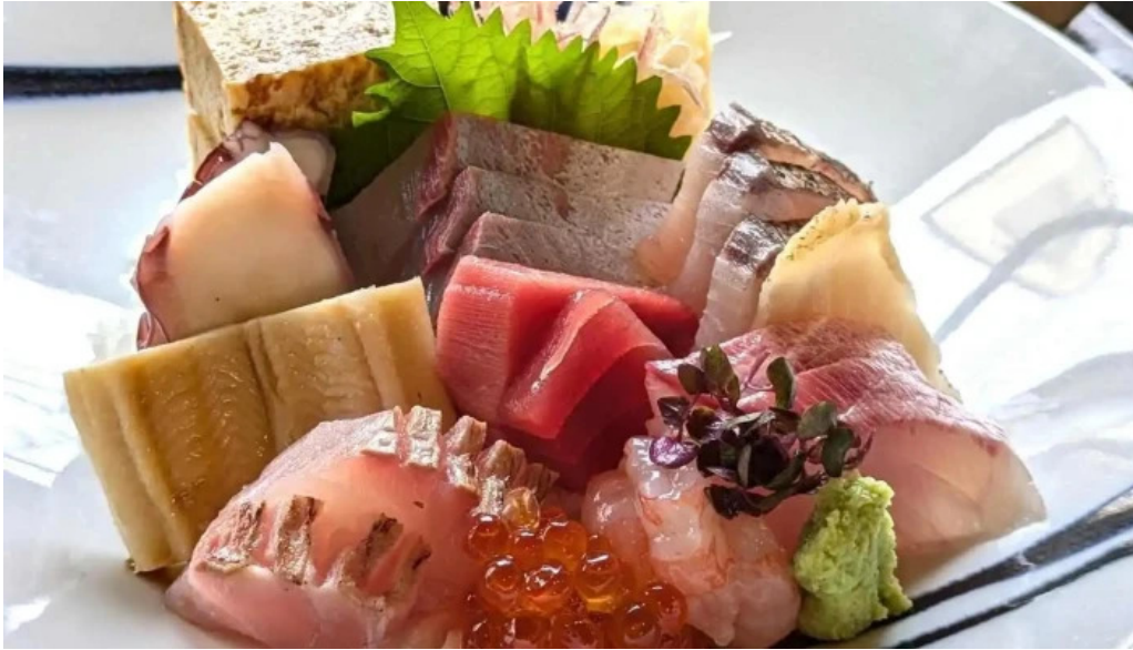
越前 蟹の坊 刺身