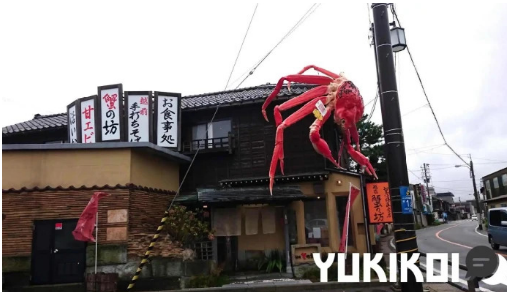
越前 蟹の坊 すべて