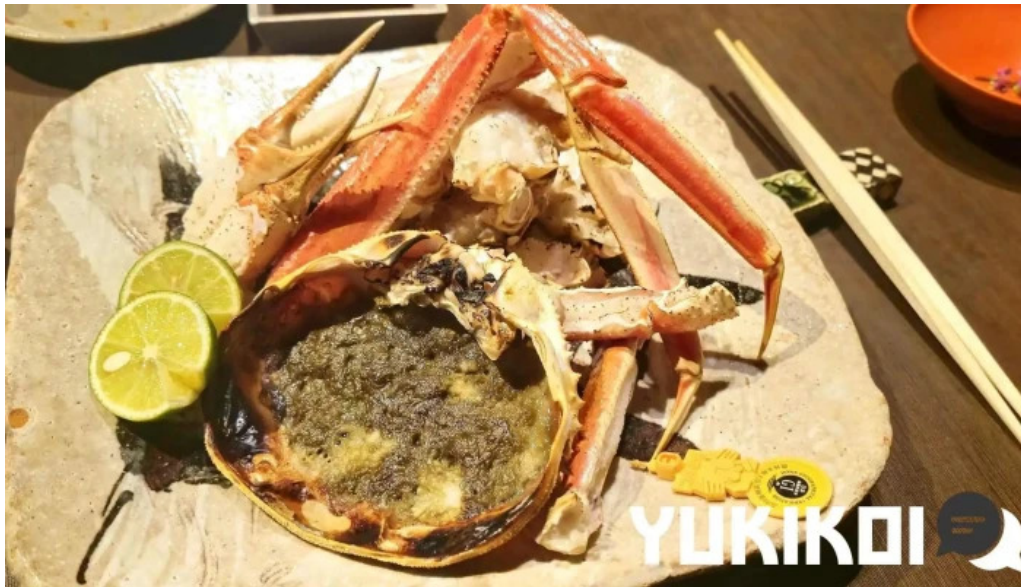
越前 蟹の坊 料理飲み物