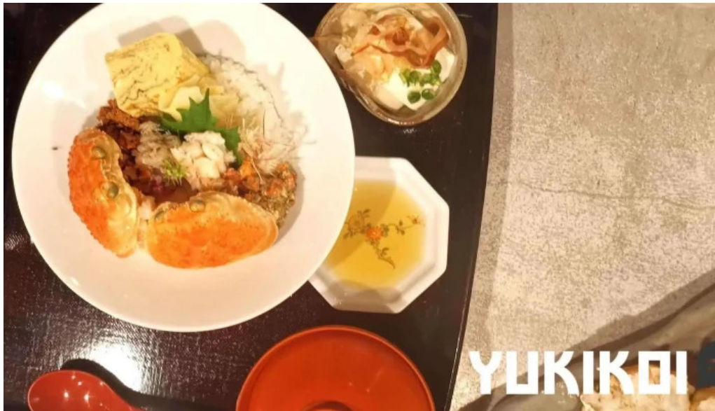
越前 蟹の坊 蕎麦