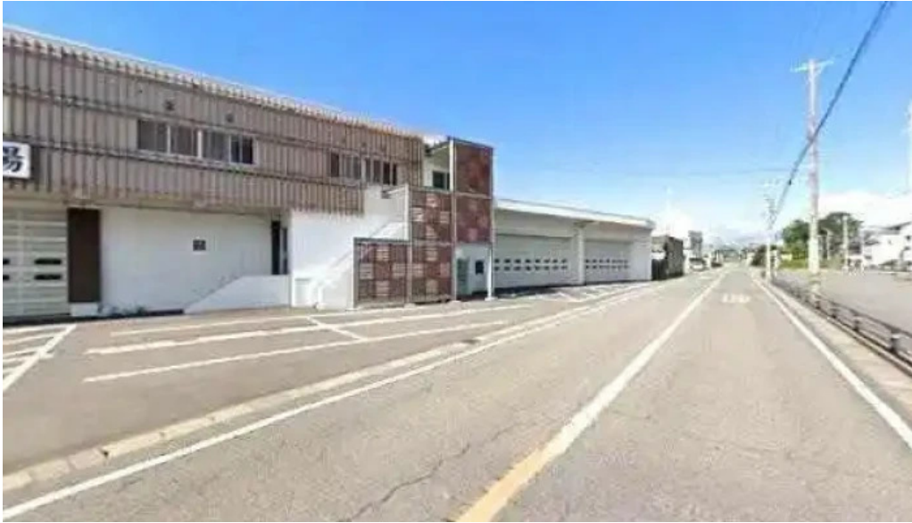
越前 蟹の坊 ストリートビューと 360 ビュー