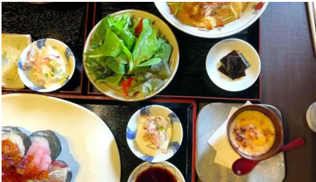
越前 蟹の坊 動画