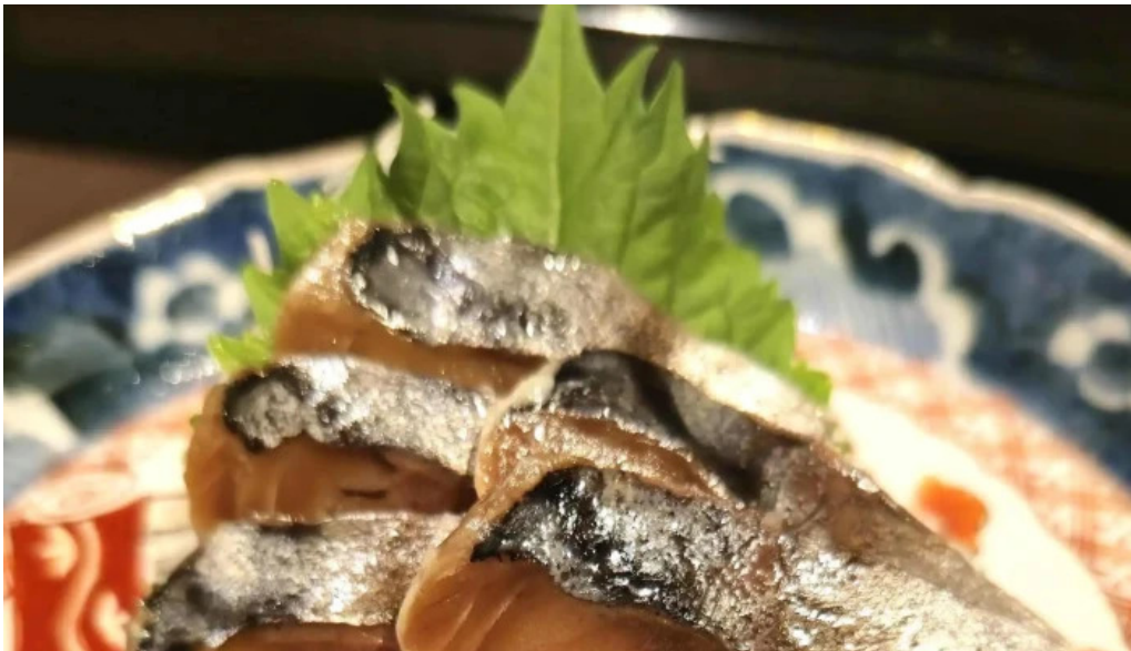
越前 蟹の坊 comentario 1