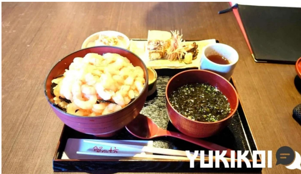
越前 蟹の坊 天ぷら