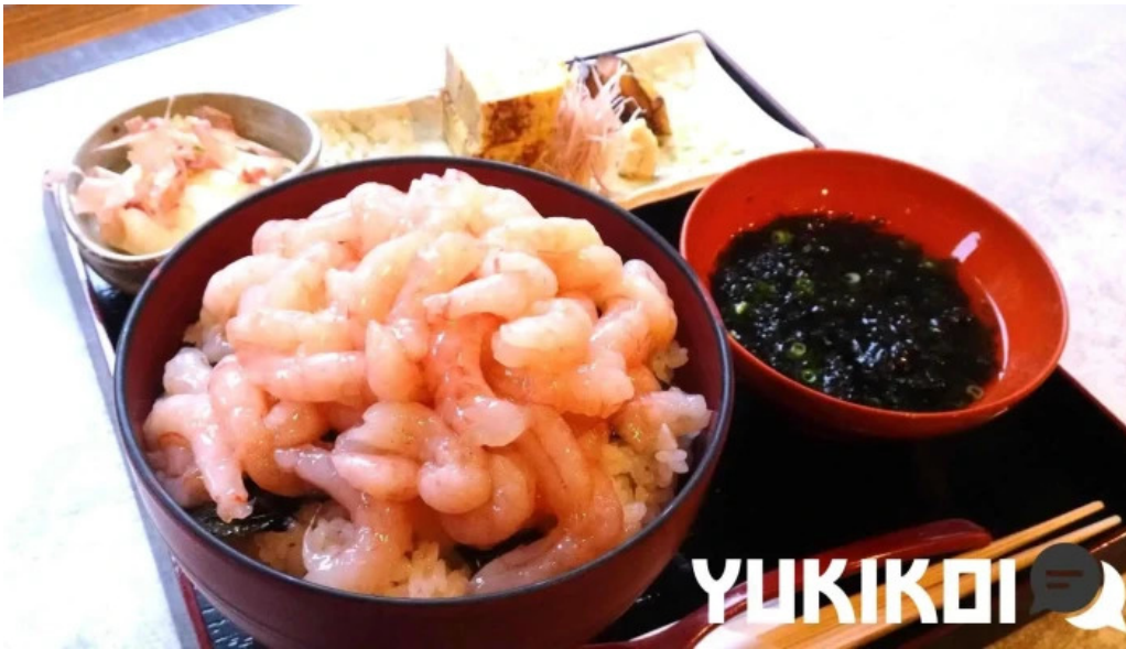
越前 蟹の坊 エビ