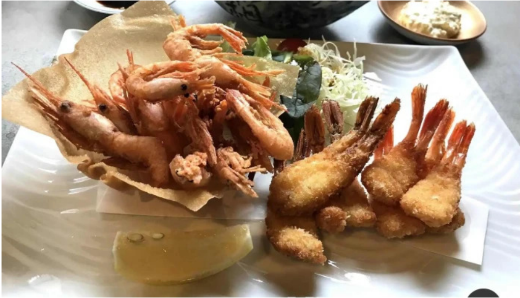
越前 蟹の坊 エビフライ