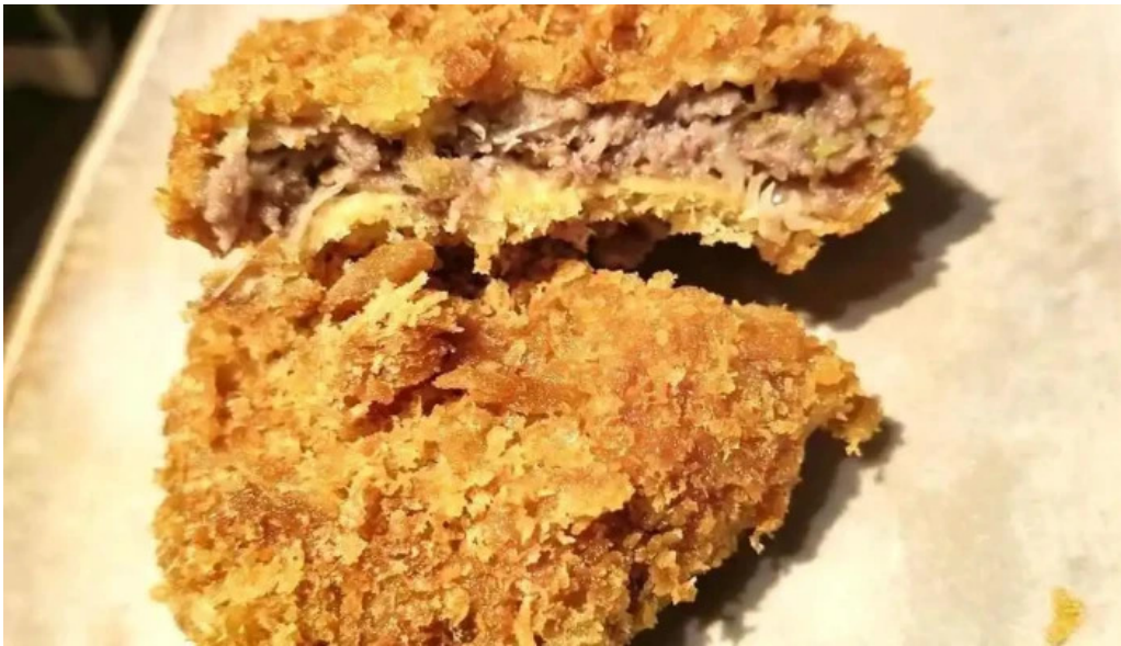
越前 蟹の坊 豚カツ