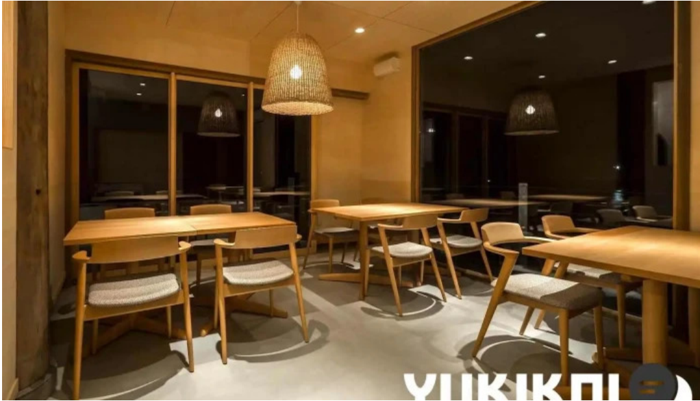
海のレストランおおとく 坂井市