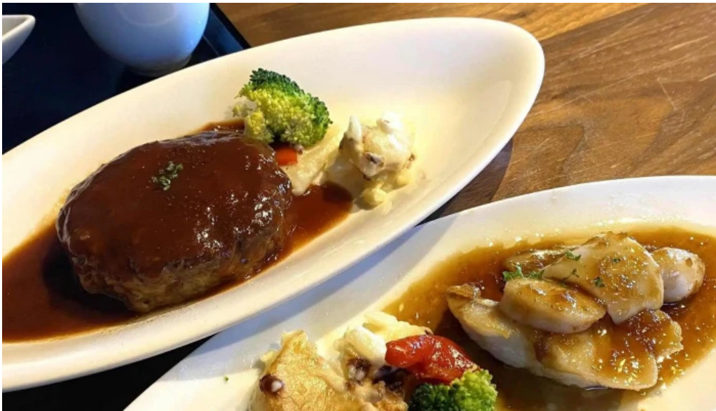
海のレストランおおとく comentario 3