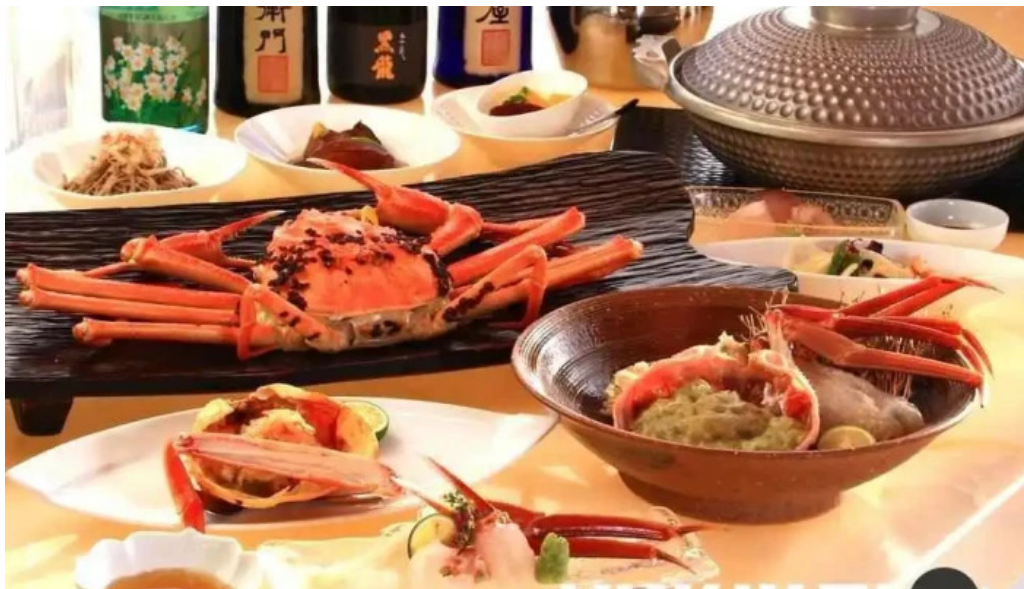
海のレストランおおとく 料理飲み物