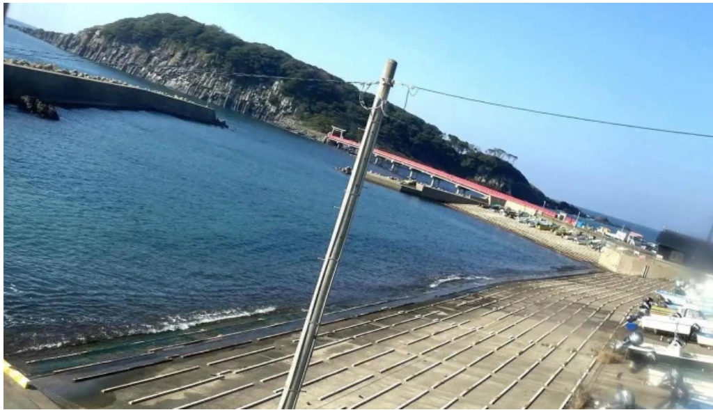
海のレストランおおとく 最新