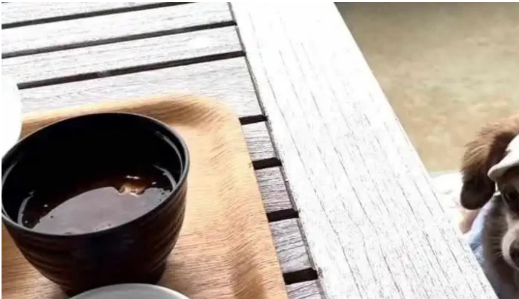
海のレストランおおとく 動画