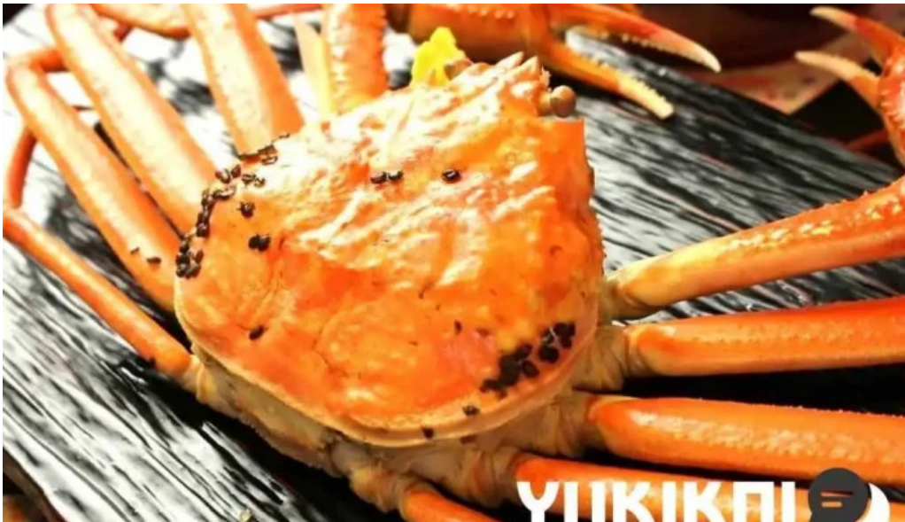
海のレストランおおとく カニ