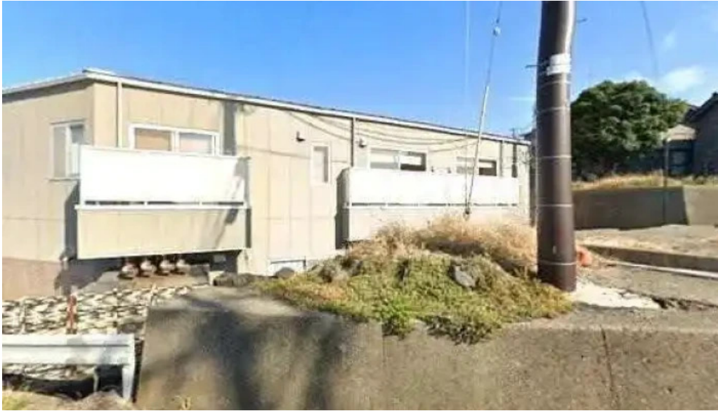
海のレストランおおとく ストリートビューと 360 ビュー