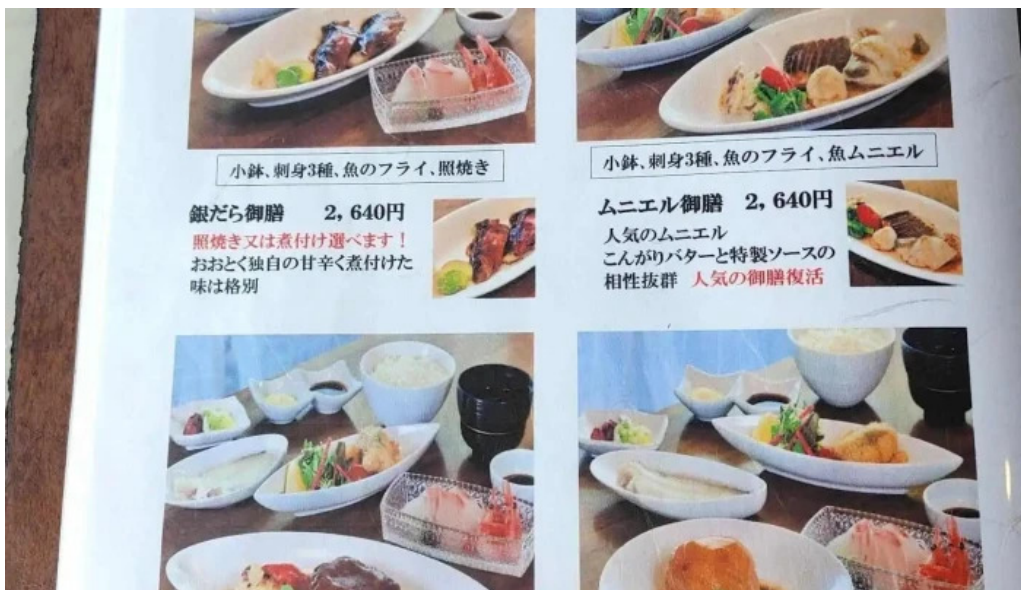
海のレストランおおとく メニュー