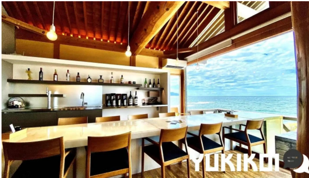
海のレストランおおとく 雰囲気