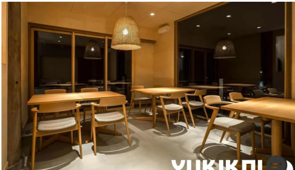
海のレストランおおとく すべて