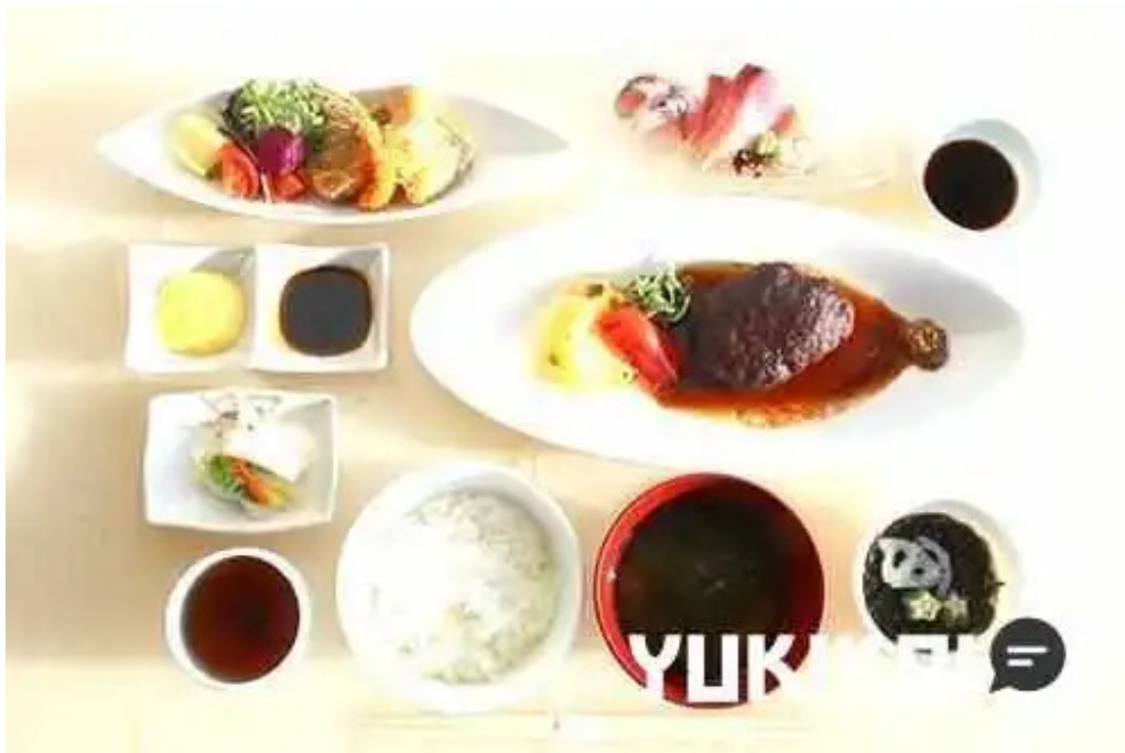
海のレストランおおとく 刺身