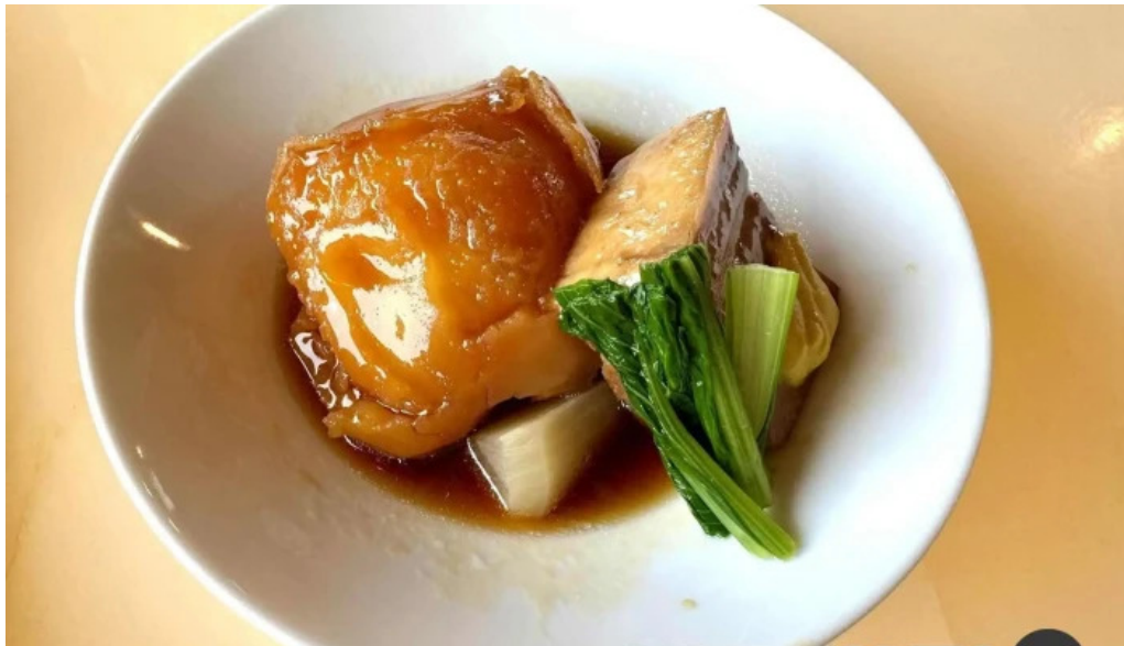
海のレストランおおとく 豚ばら肉