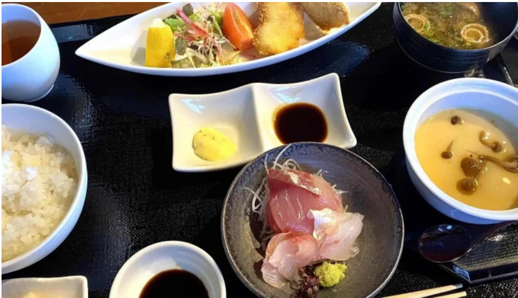
海のレストランおおとく comentario 1