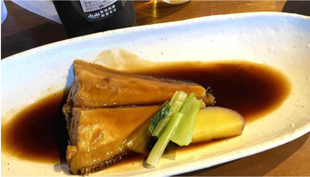
海のレストランおおとく comentario 2