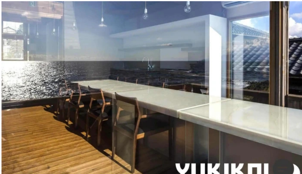
海のレストランおおとく