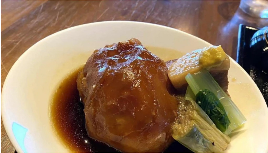
海のレストランおおとく comentario 4