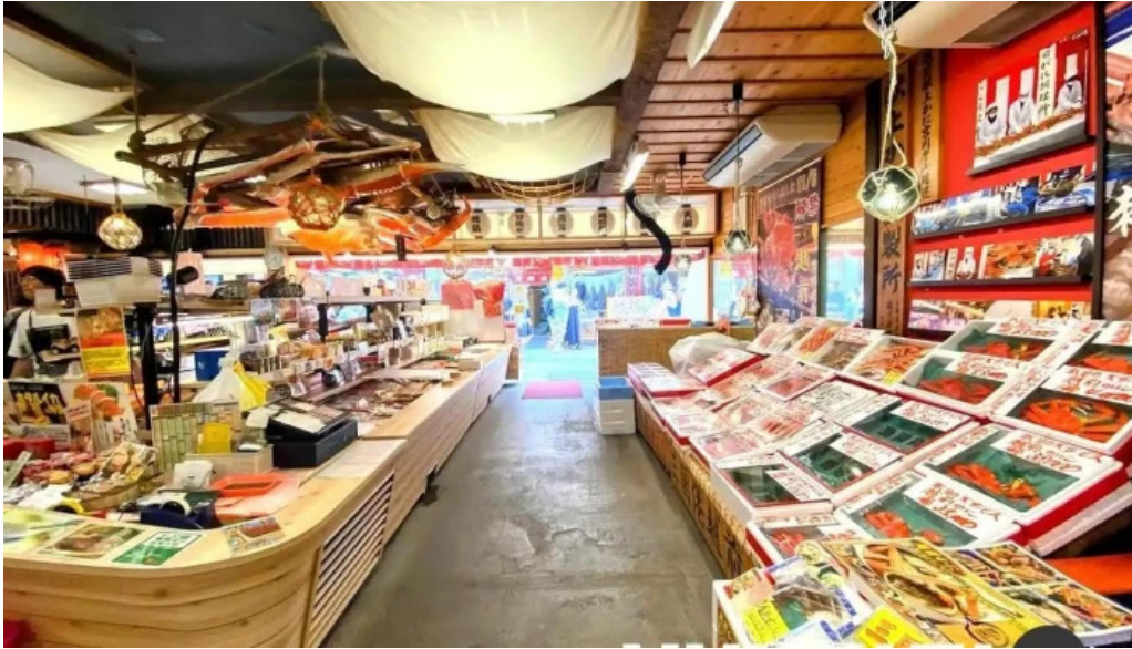
やまに水産 坂井市