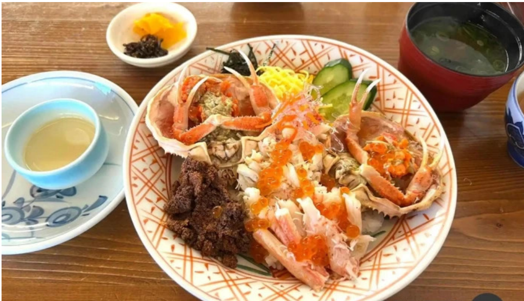
やまに水産 シーフード