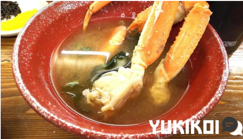
やまに水産 味噌汁