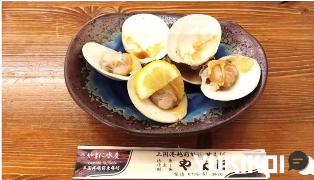
やまに水産 イタヤガイ科