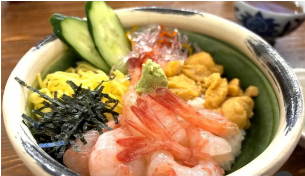
やまに水産 料理飲み物