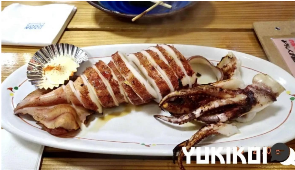
やまに水産 イカ焼き