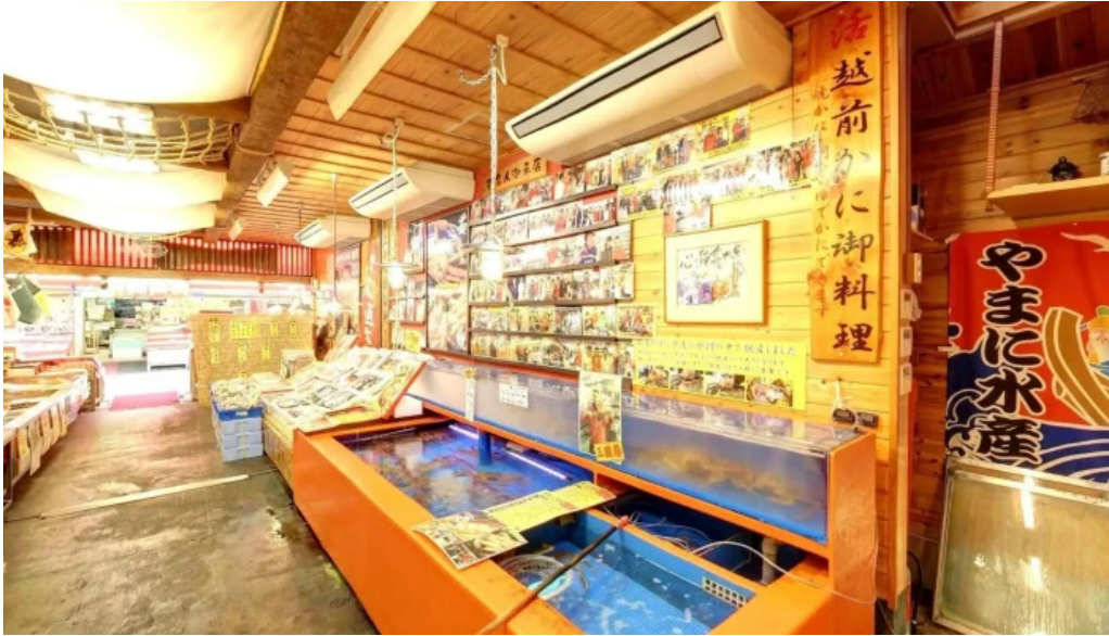
やまに水産 ストリートビューと 360 ビュー