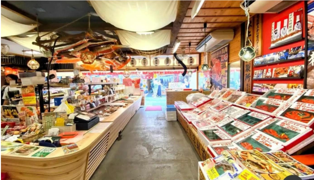
やまに水産 すべて