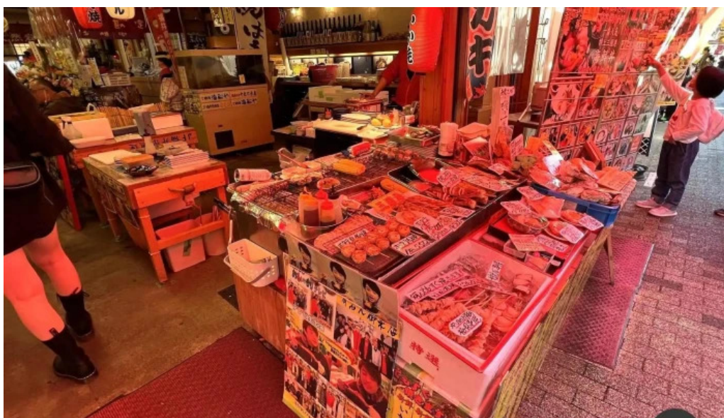
やまに水産 雰囲気