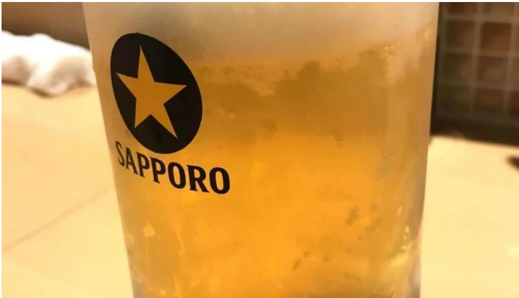
魚肴食堂 魚ふじ ビール