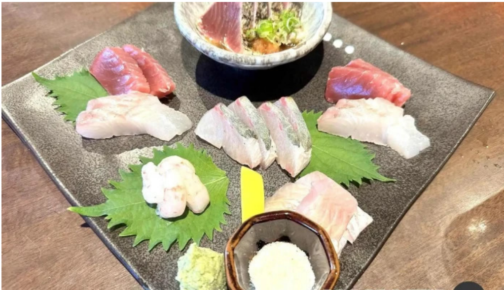
魚肴食堂 魚ふじ 刺身