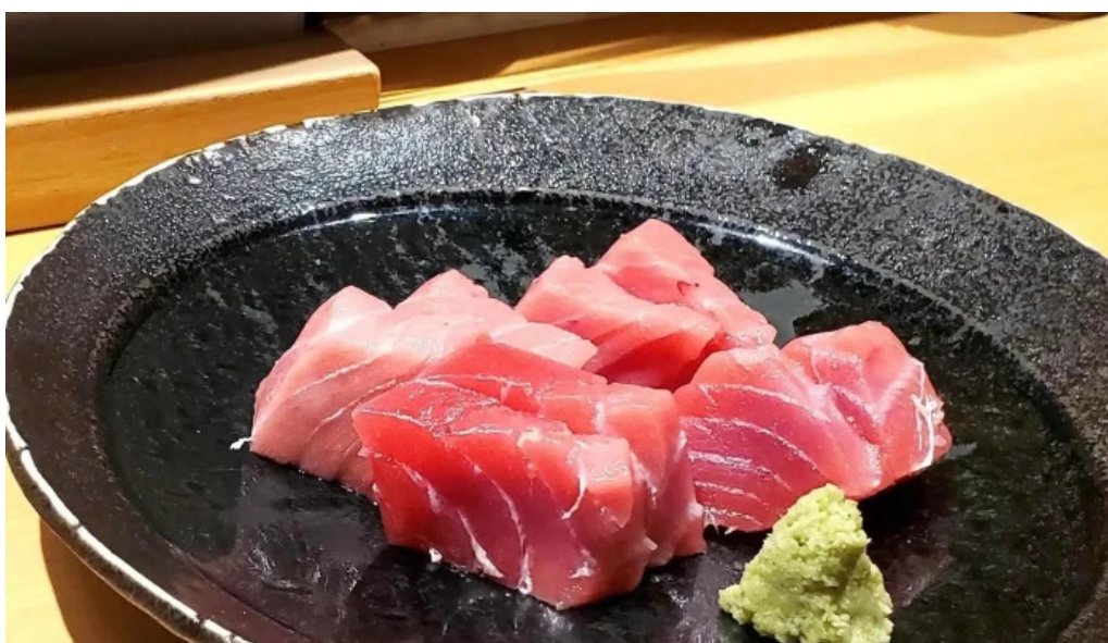
魚肴食堂 魚ふじ どこ