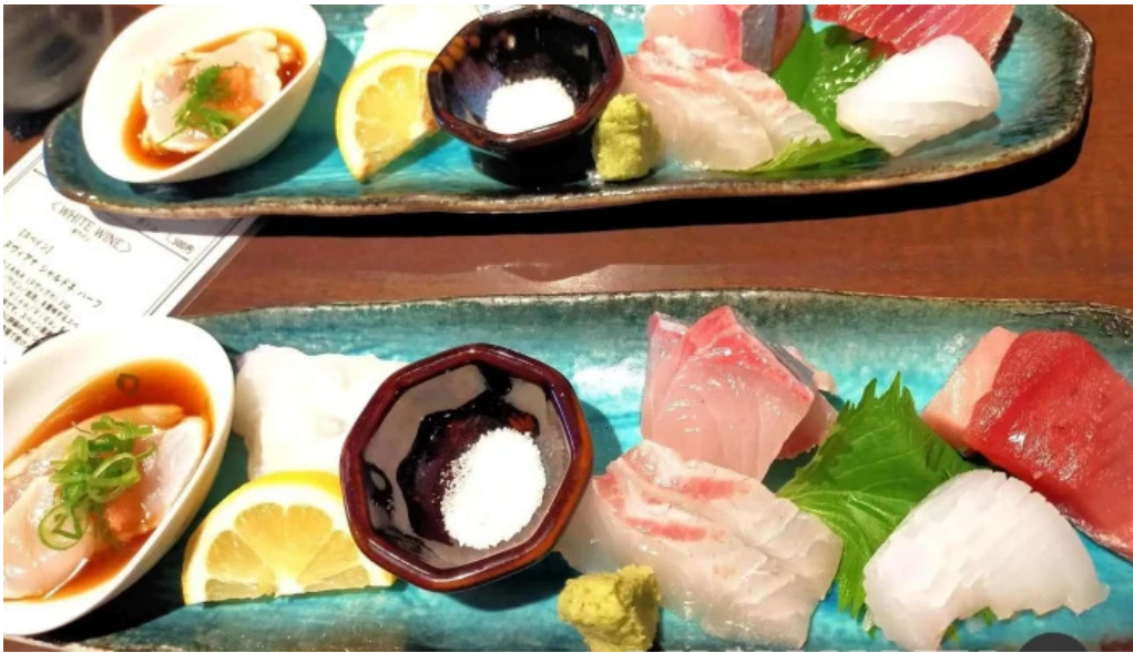
魚肴食堂 魚ふじ 最新