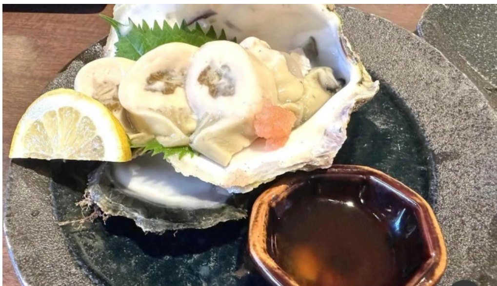
魚肴食堂 魚ふじ カキ