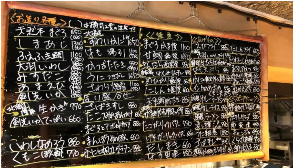
魚肴食堂 魚ふじ メニュー