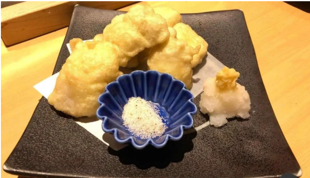
魚肴食堂 魚ふじ 天ぷら