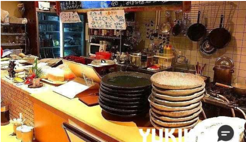
魚肴食堂 魚ふじ 料理飲み物