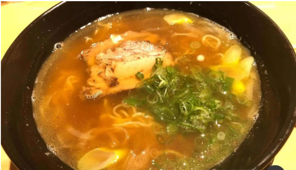
魚肴食堂 魚ふじ ラーメン