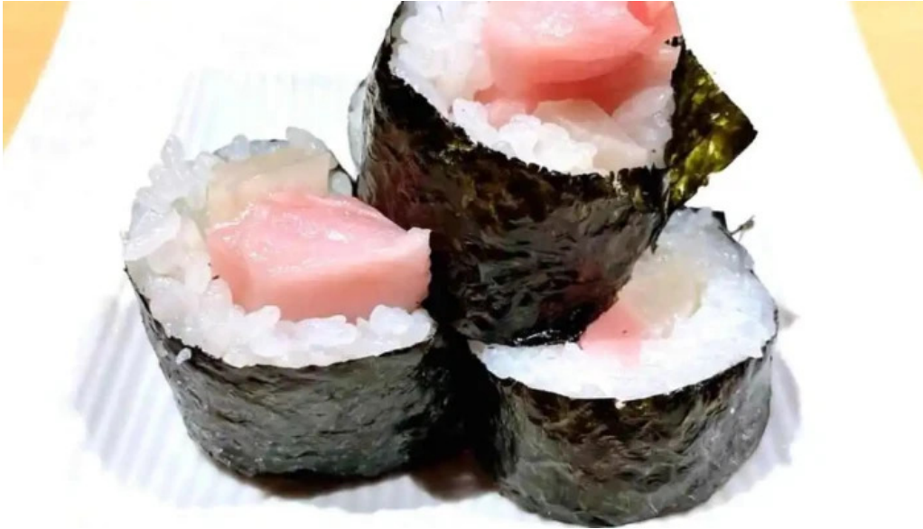
魚肴食堂 魚ふじ 寿司