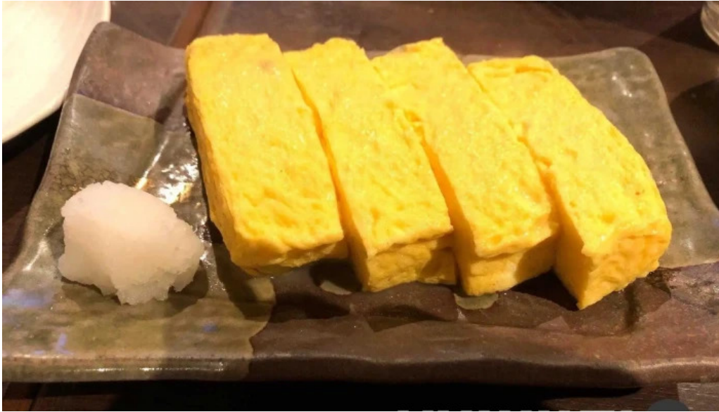
魚肴食堂 魚ふじ 卵焼き