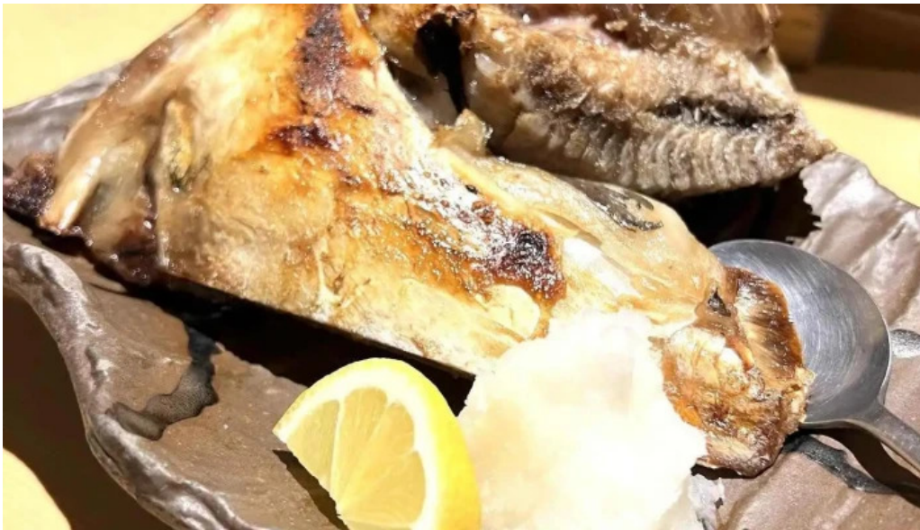
魚肴食堂 魚ふじ サバ