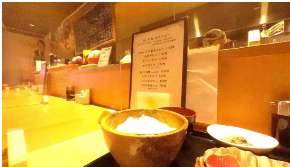
魚肴食堂 魚ふじ 向日市