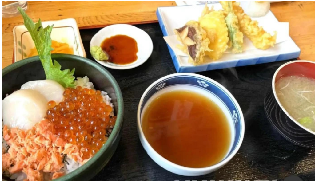
いくら亭 料理飲み物