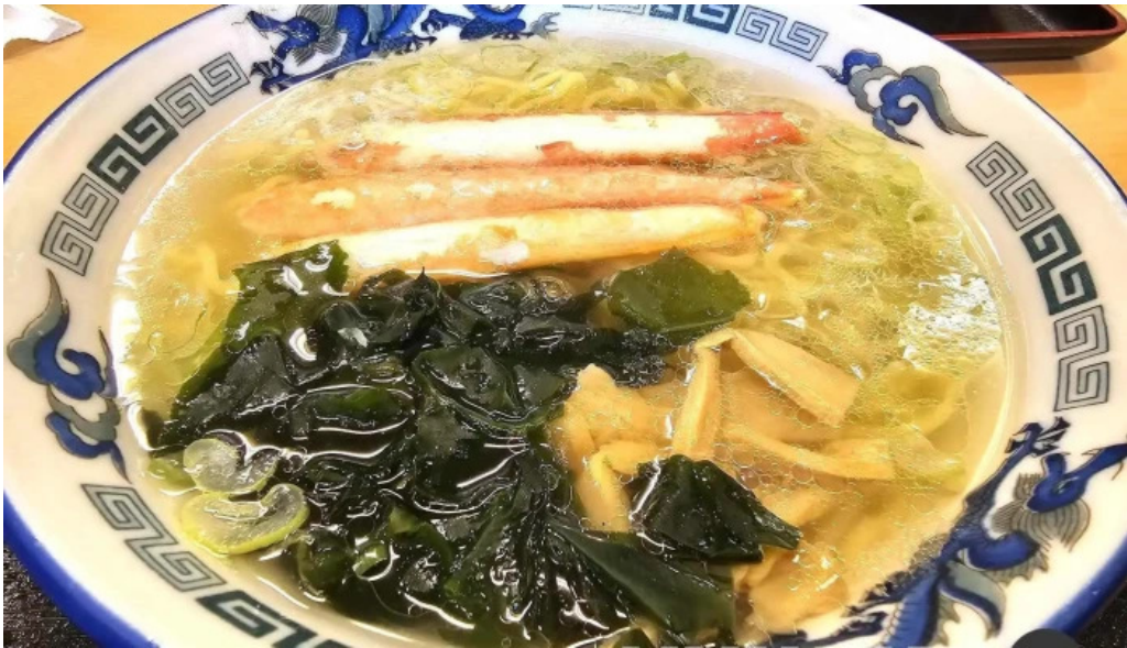
いくら亭 ラーメン