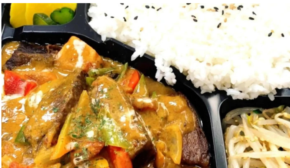
龍之鍋 ウェブサイト