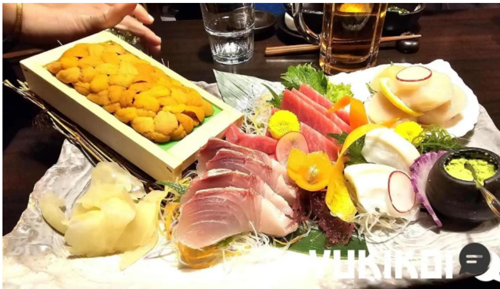
龍之鍋 料理飲み物