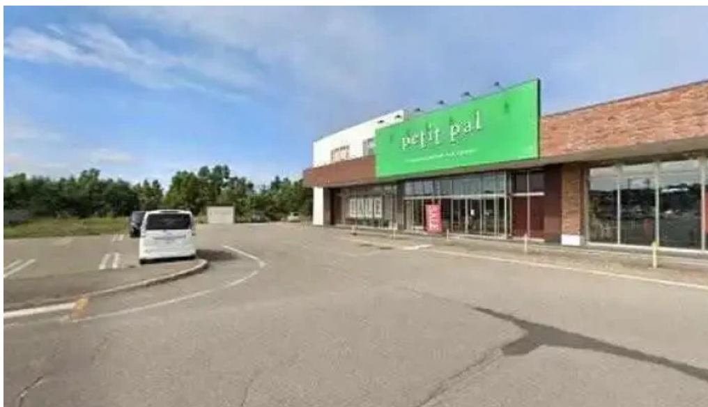
道東えびすやキッチンカー すべて