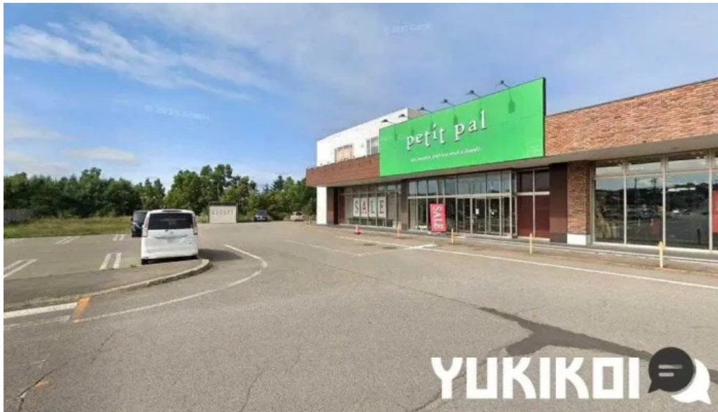
道東えびすや（キッチンカー） 網走市