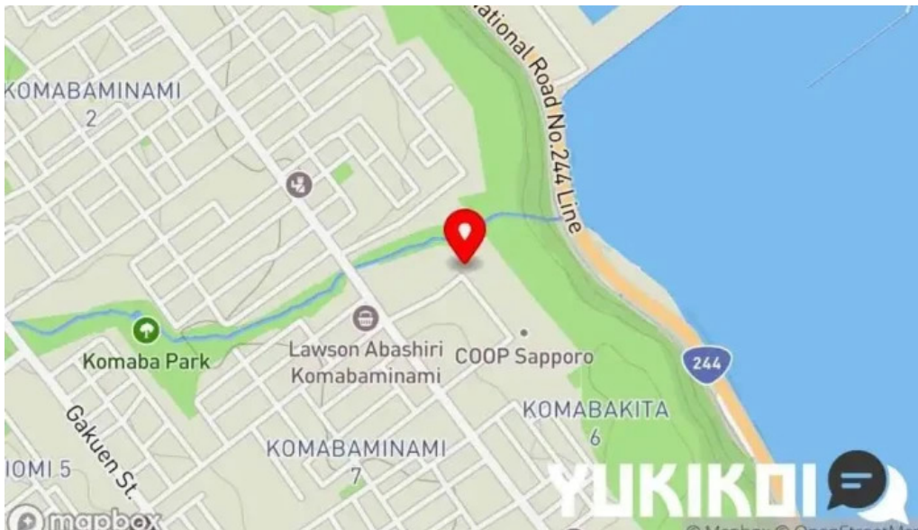
道東えびすやキッチンカー地図