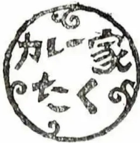
カレー家たく オーナー提供