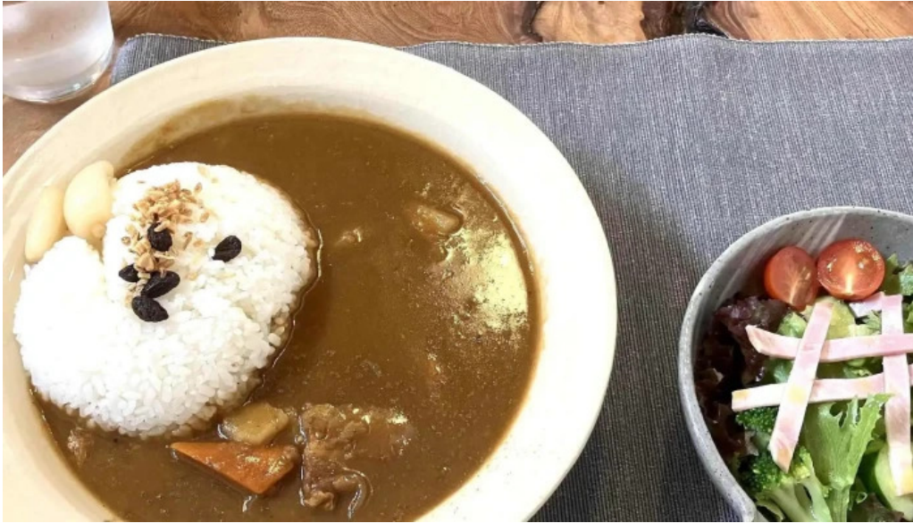
カレー家たく comentario 4