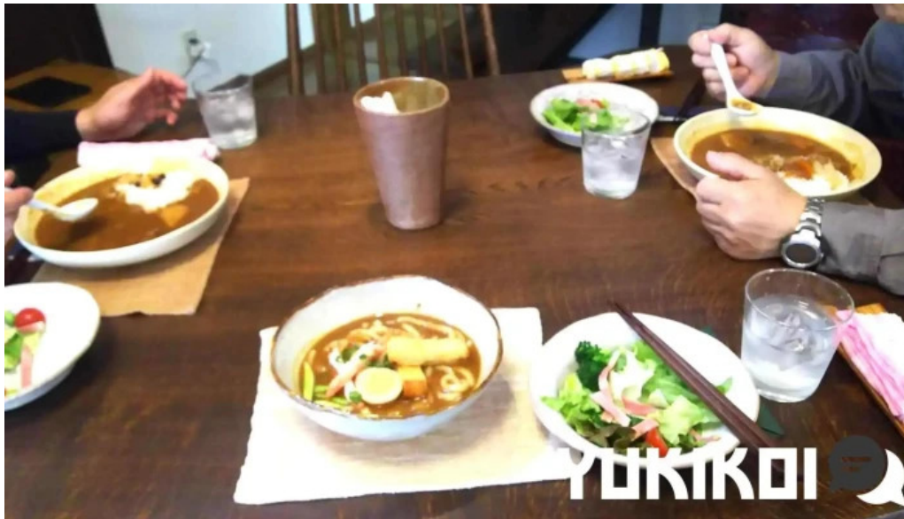
カレー家たく カレー