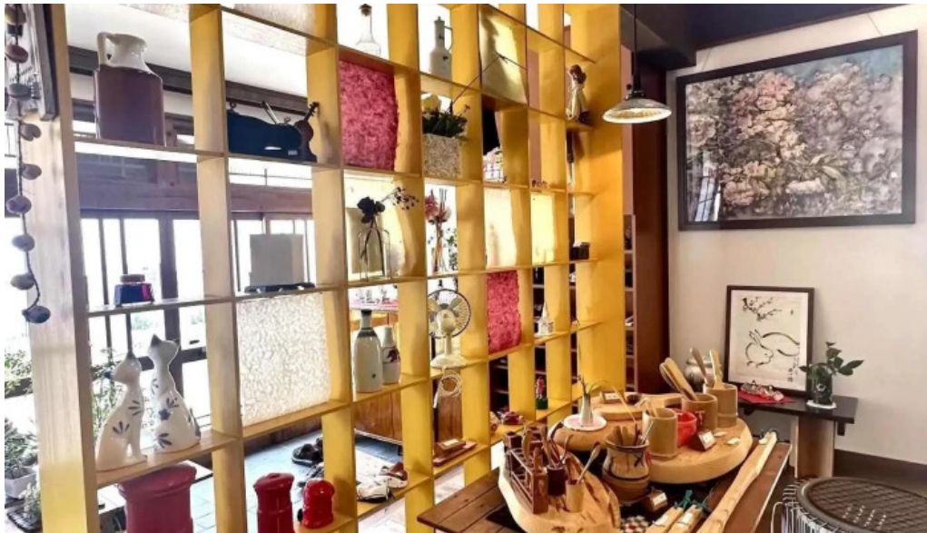
カレー家たく すべて