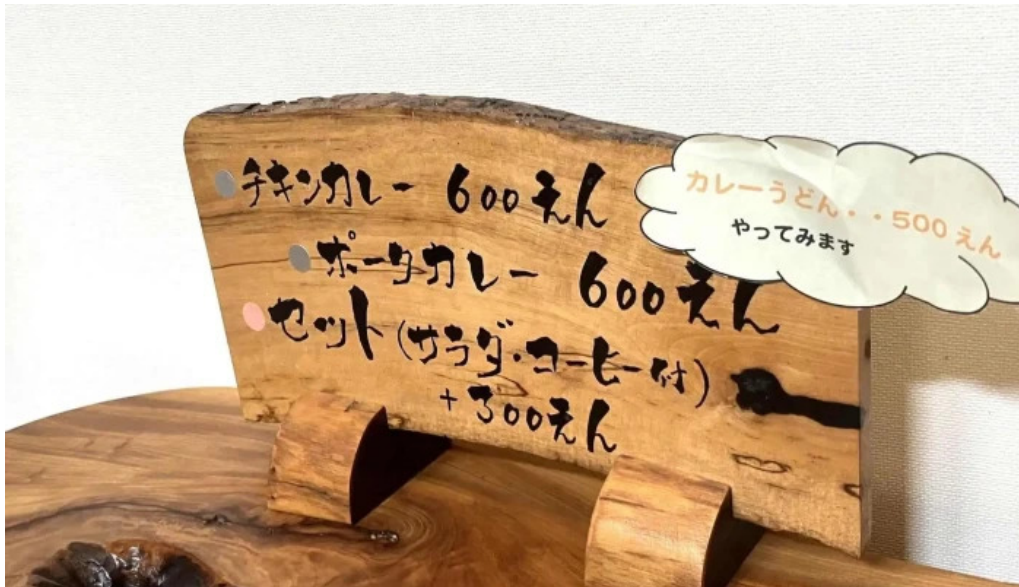
カレー家たく comentario 2