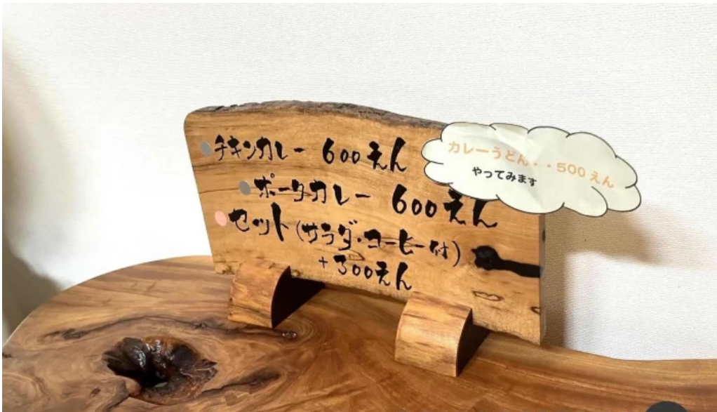
カレー家たく メニュー