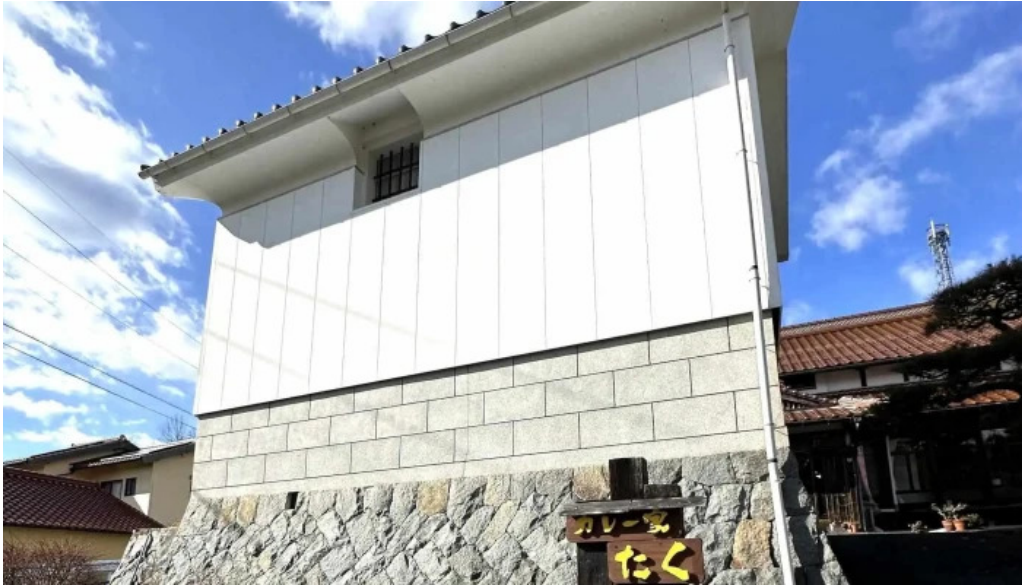
カレー家たく comentario 6