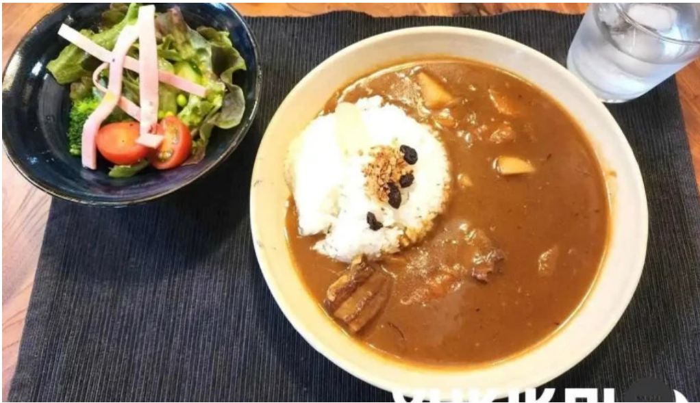
カレー家たく 料理飲み物