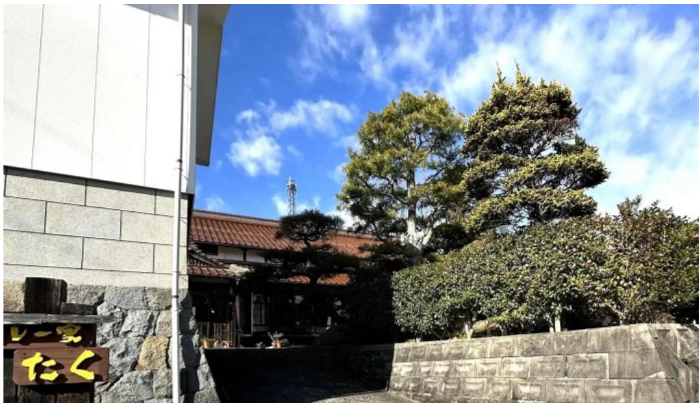
カレー家たく comentario 7