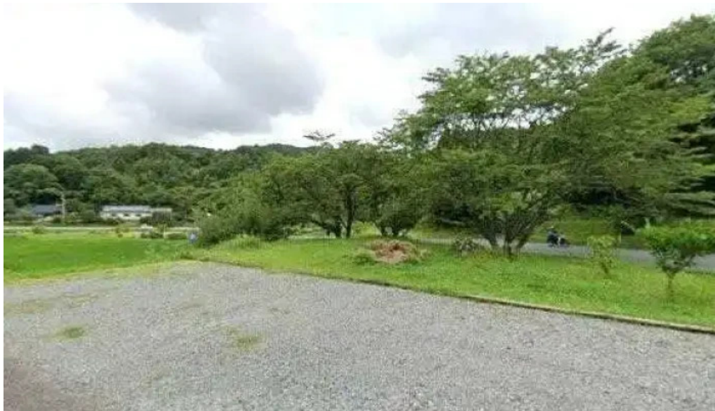
カレー家たく ストリートビューと 360 ビュー