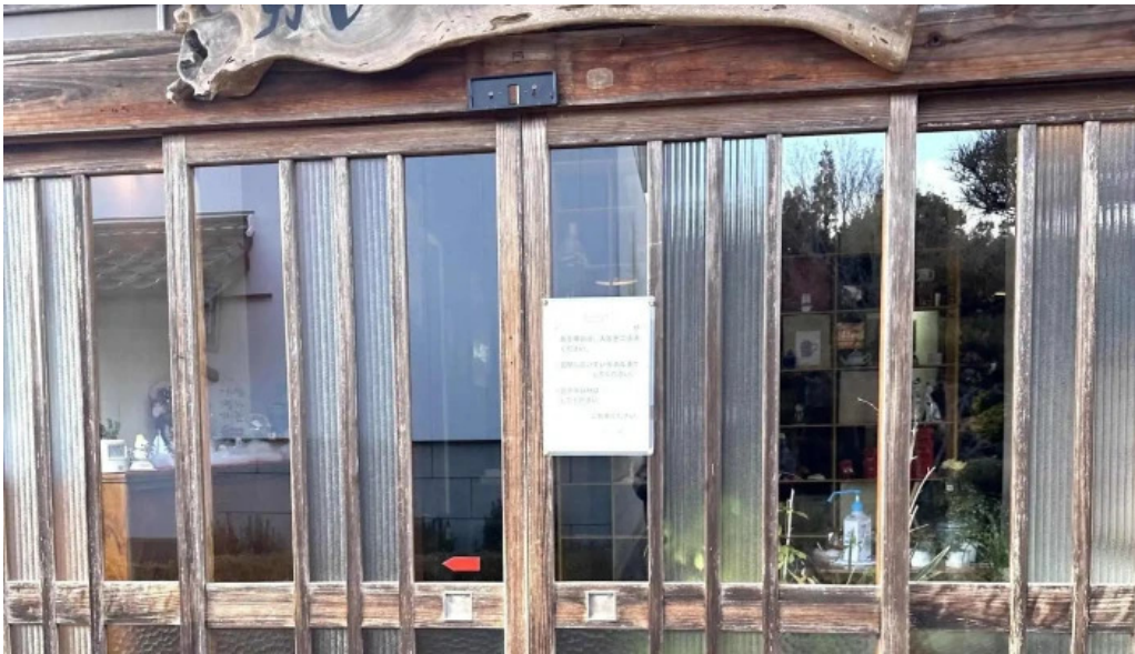
カレー家たく comentario 5