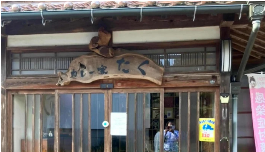
カレー家たく comentario 3