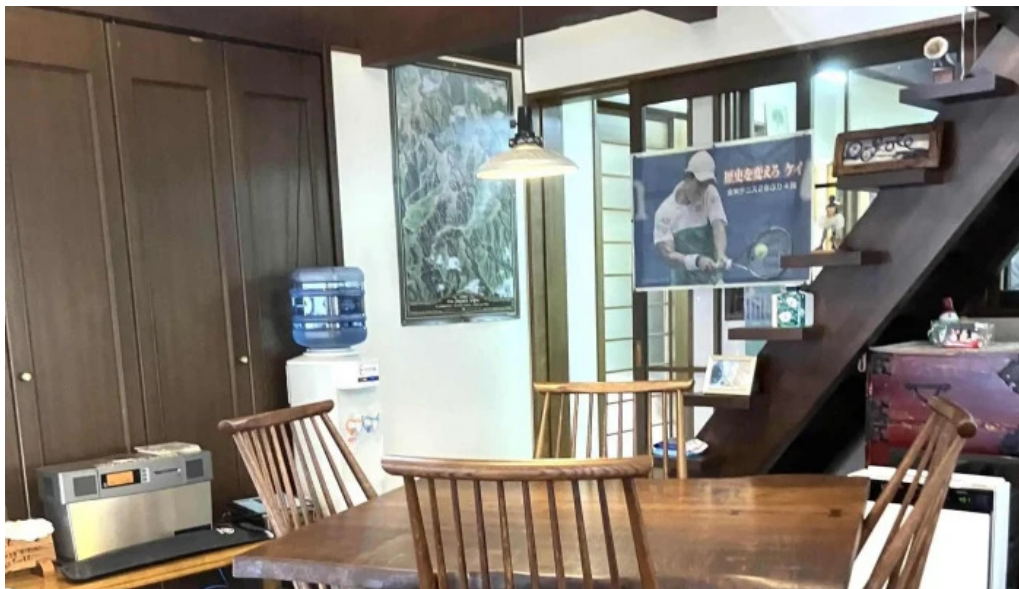
カレー家たく comentario 1