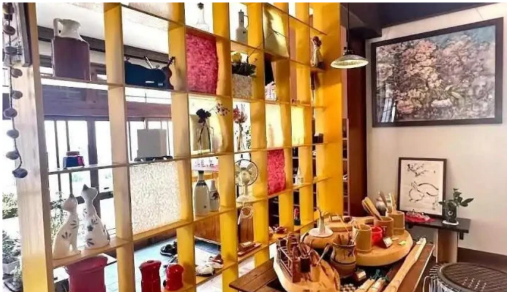
カレー家「たく」江津市