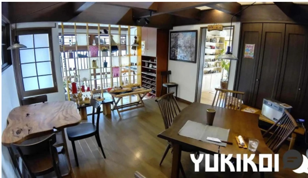
カレー家たく 雰囲気