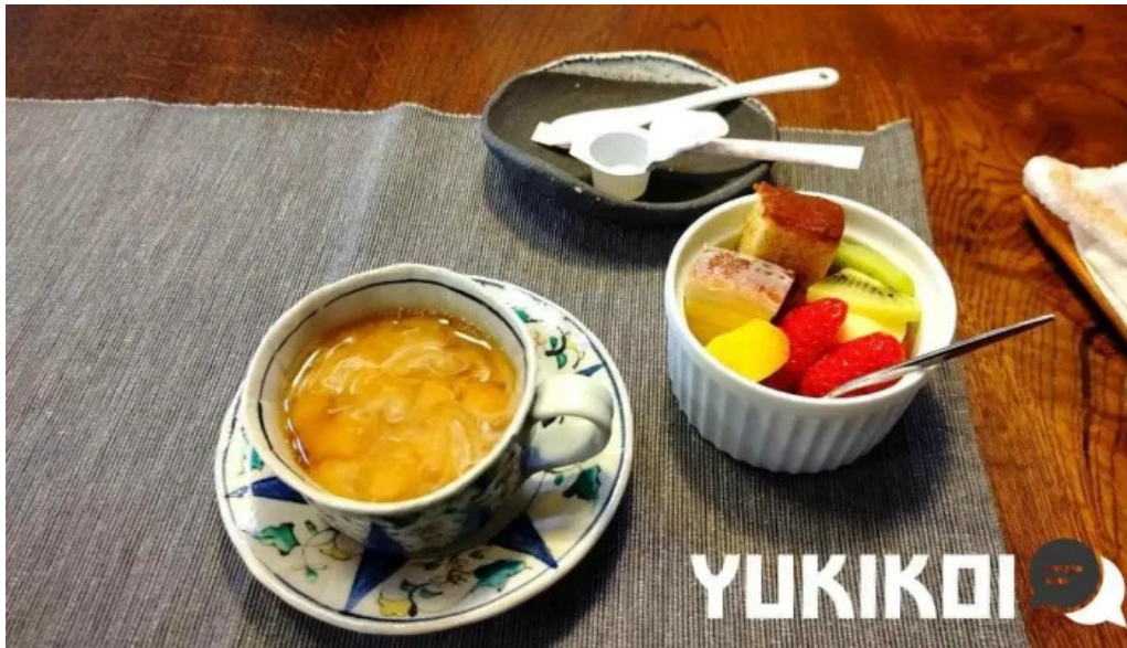
カレー家たく スープ