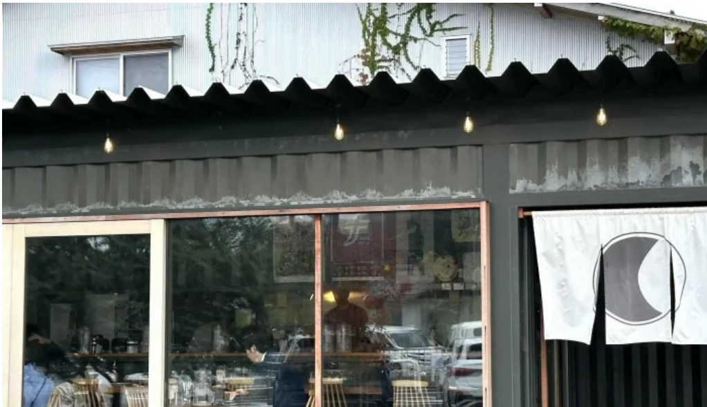
Pangaeaパンゲア comentario 1