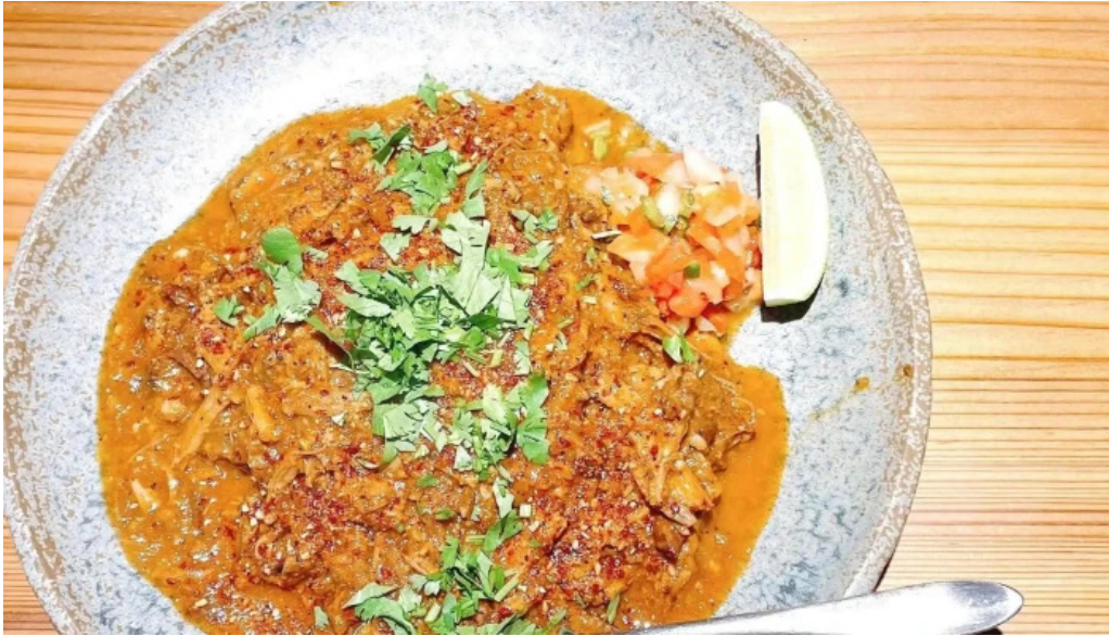
Pangaeaパングエア comentario 6