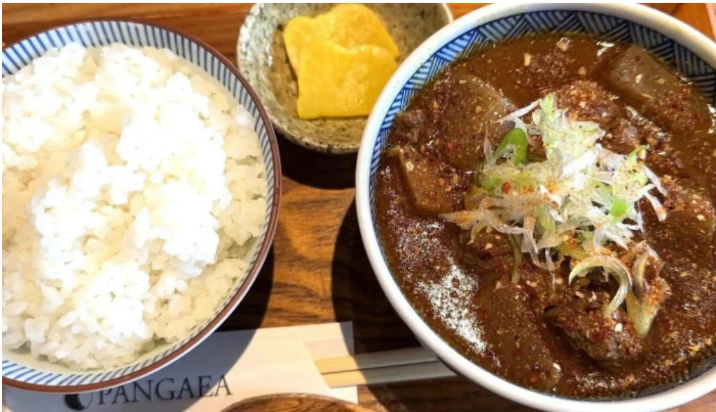
Pangaeaパングエア comentario 5