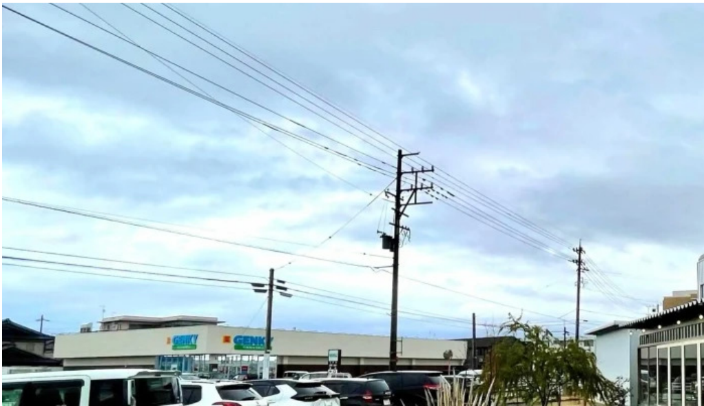
Pangaea/パンゲア comentario 9