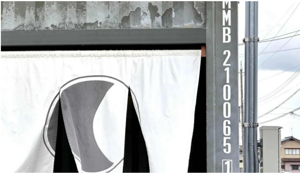
Pangaeaパンゲア comentario 2