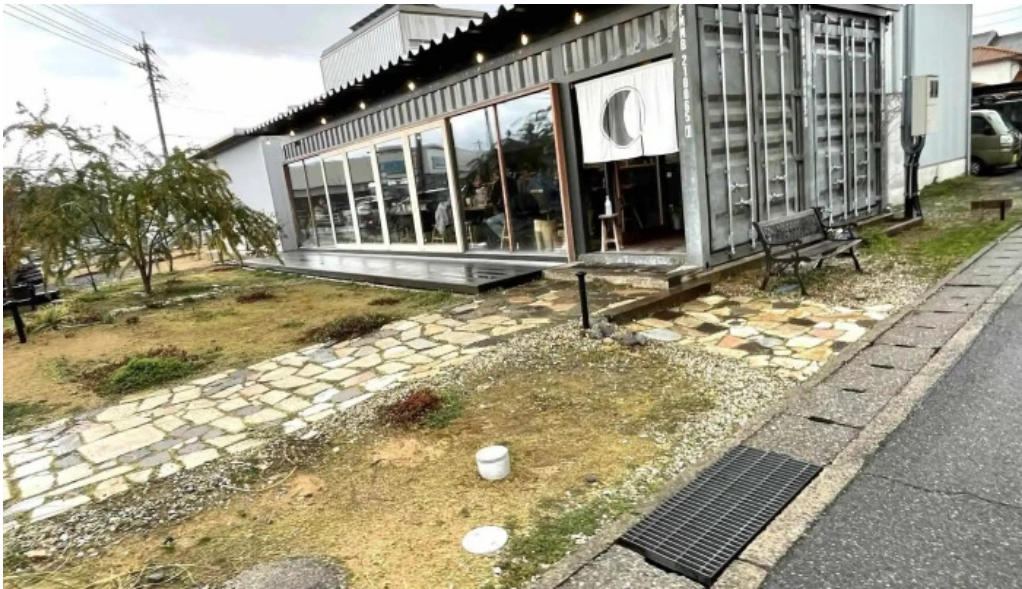
Pangaeaパンゲア comentario 7