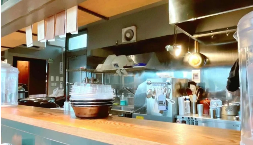
Pangaeaパンゲア comentario 8