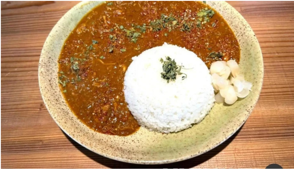
Pangaea/パンゲア 料理飲み物