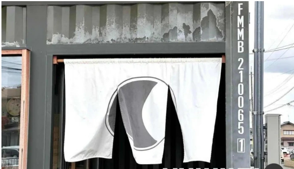
Pangaea パンゲア 坂井市