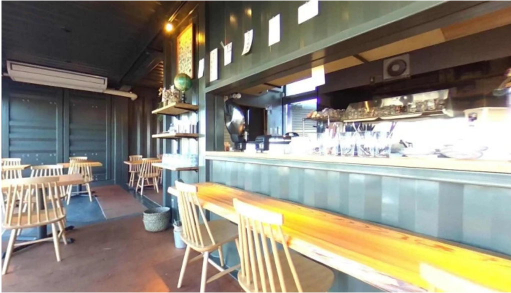
Pangaeaパングェア ストリートビューと 360 ビュー