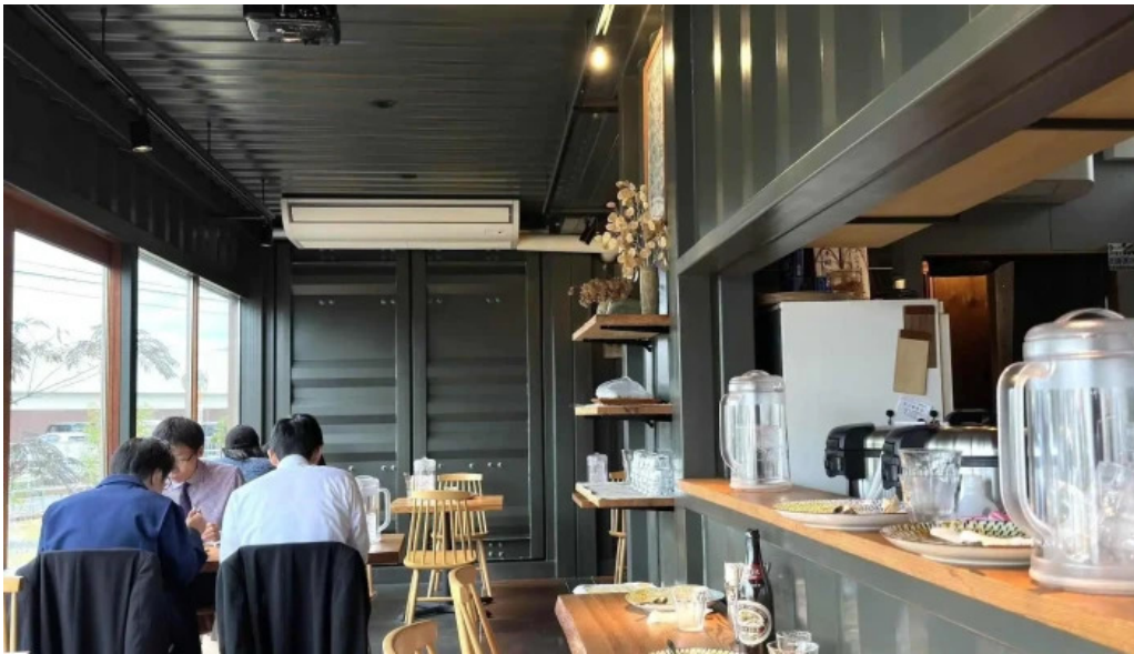
Pangaeaパンゲア comentario 3