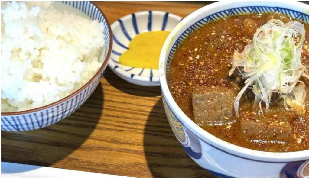
Pangaeaパンゲア comentario 4