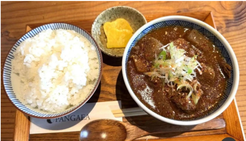
Pangaeaパングェア カレー