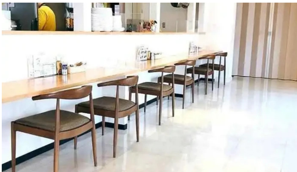
スパイスキッチン 成ス 雰囲気