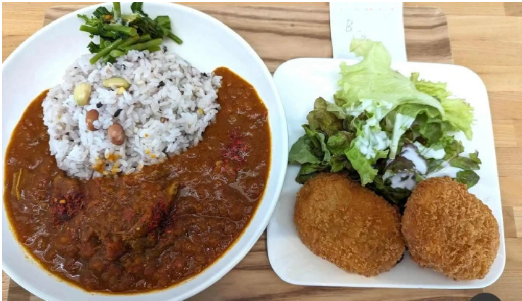
スパイスキッチン 成ス カレー