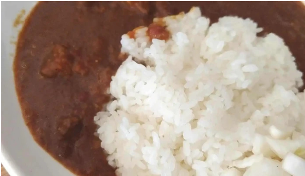
スパイスキッチン 成ス 最新