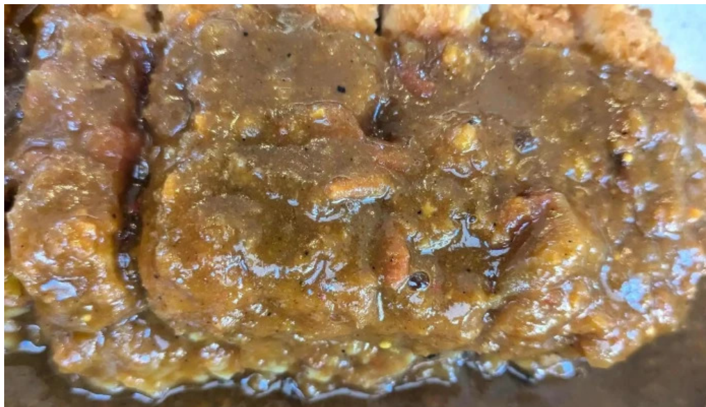
スパイスキッチン 成ス プロモーション