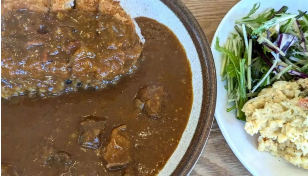
スパイスキッチン 成ス 行き方