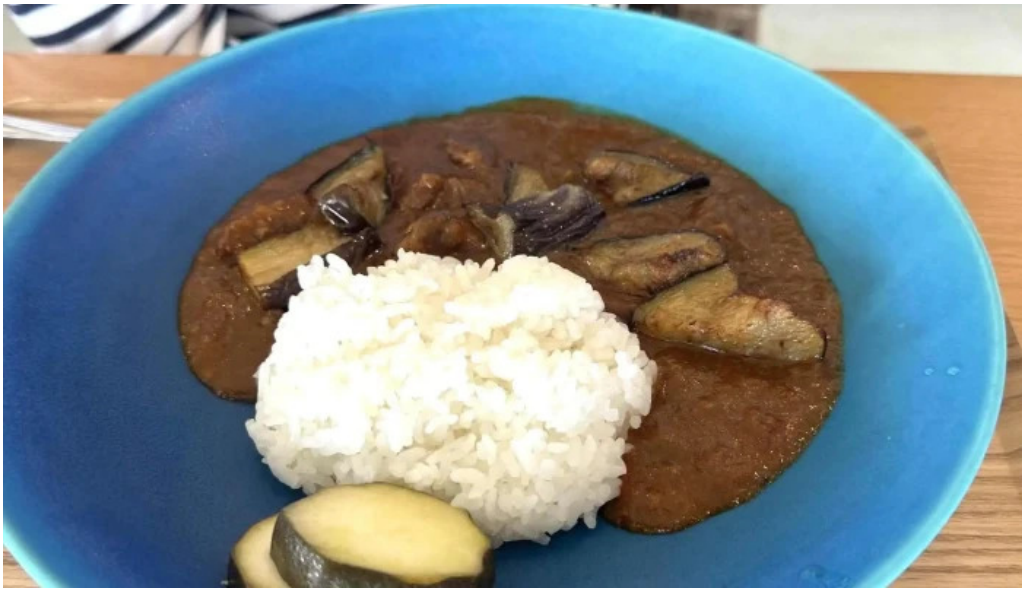
スパイスキッチン 成ス 料金