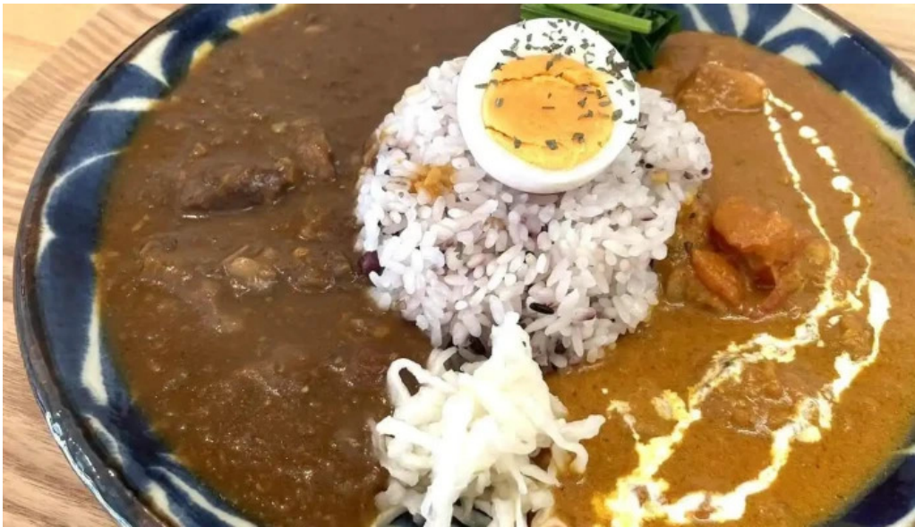
スパイスキッチン 成ス 料理飲み物