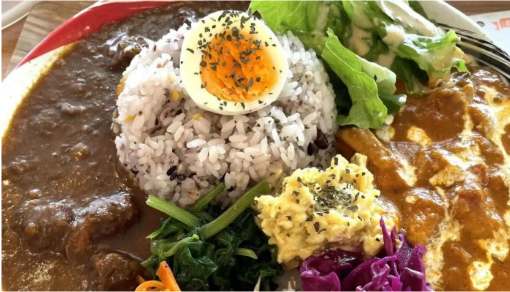
スパイスキッチン 成ス カタログ