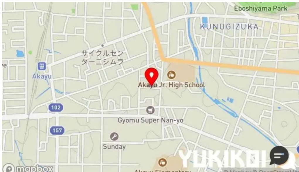
スパイスキッチン 成ス 地図