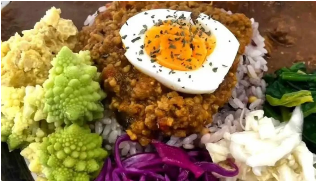
スパイスキッチン 成ス