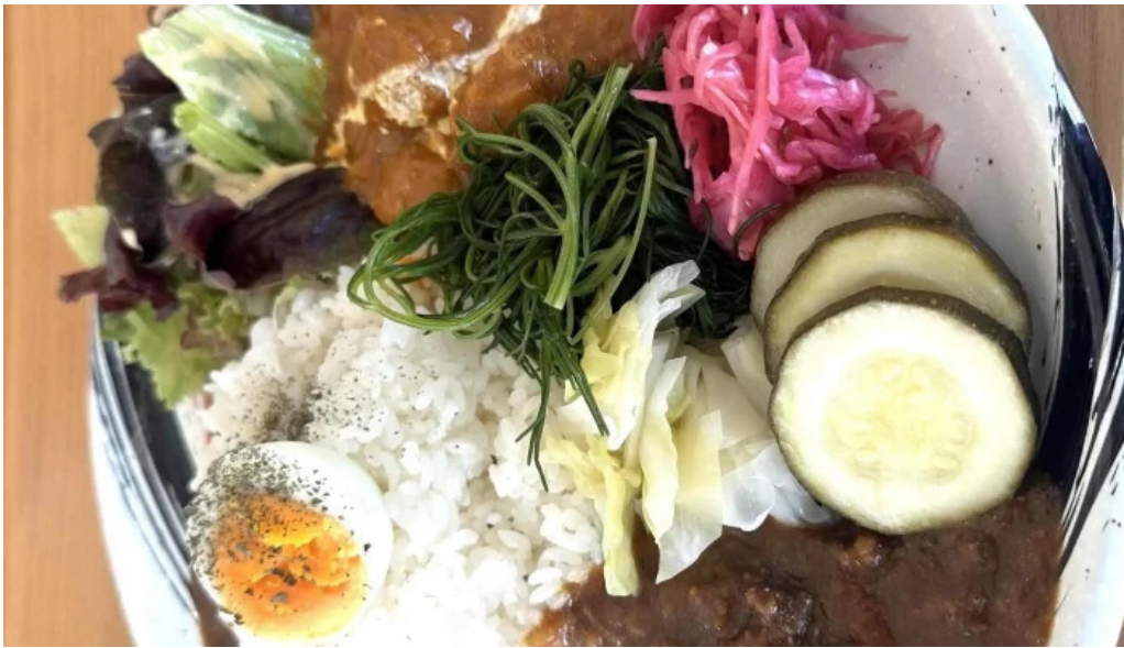
スパイスキッチン 成ス スコア