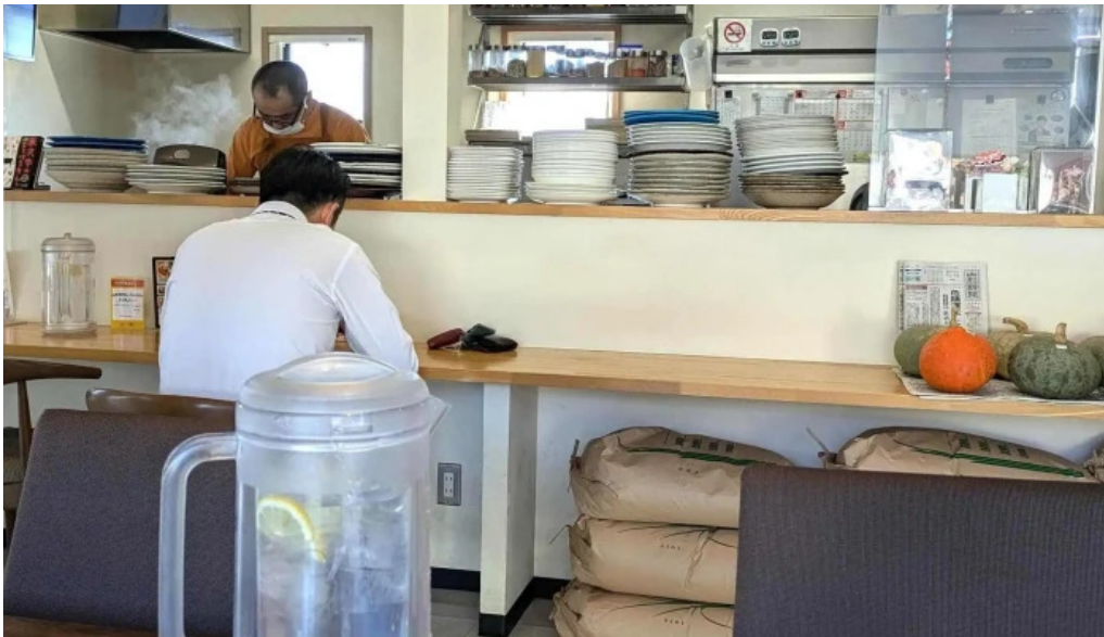
スパイスキッチン 成ス南陽市