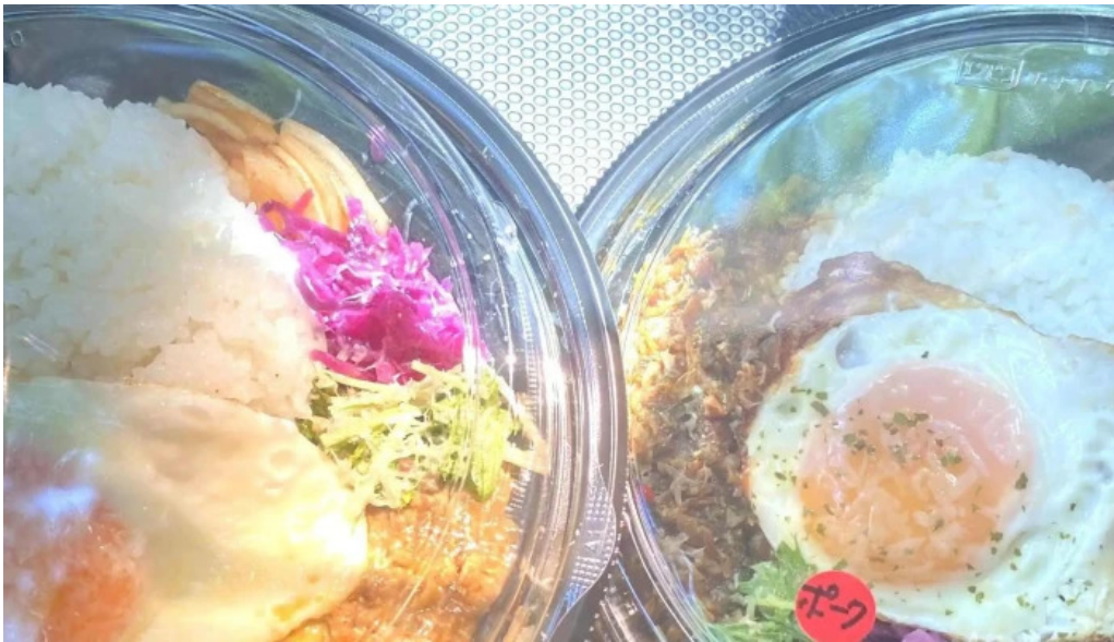
042currybaseゼロヨンニカリィベイス スパイスカレー専門店 写真