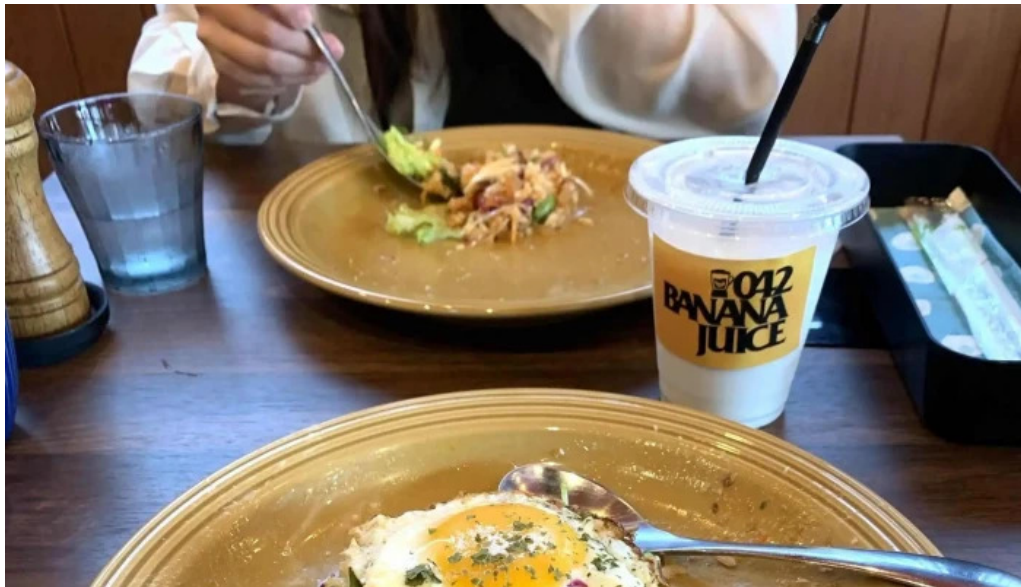
042currybaseゼロヨンニカリィベイス スパイスカレー専門店 営業中