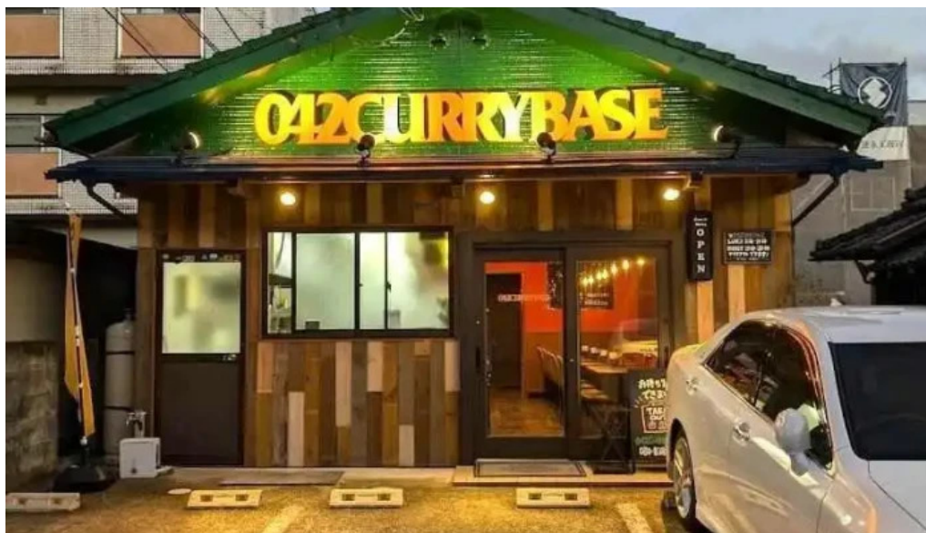
042currybase (ゼロヨンニカリィベース) スパイスカレー専門店 人吉市