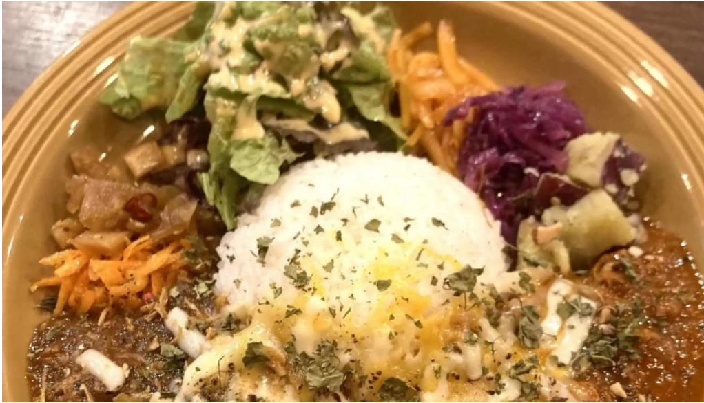
042currybaseゼロヨンニカリィベイス スパイスカレー専門店 ウェブサイト