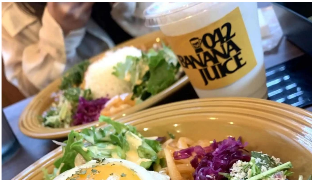
042currybaseゼロヨンニカリィベイス スパイスカレー専門店 エリア