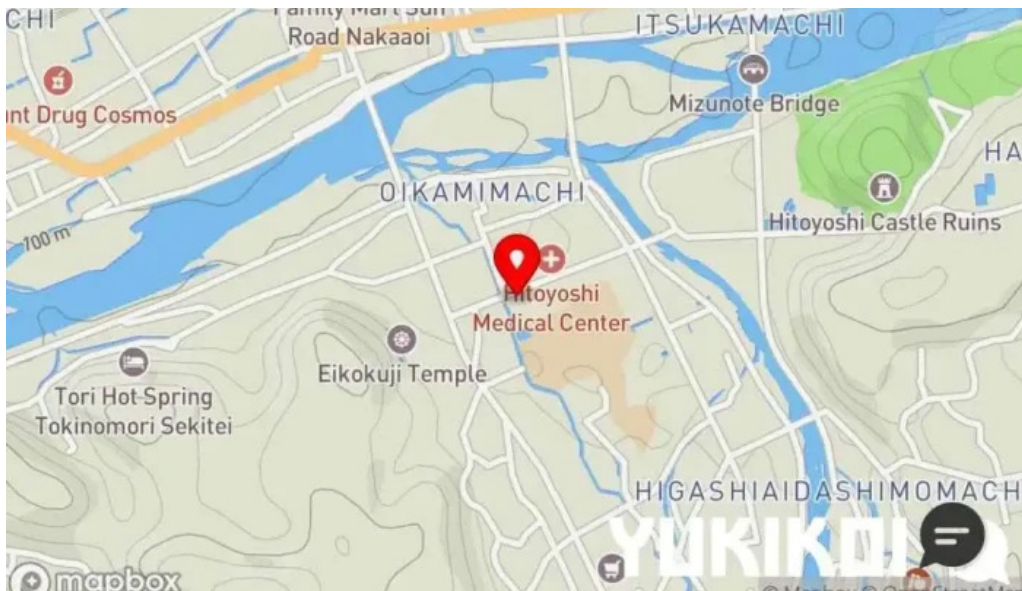
042currybaseゼロヨンニカリィベイス スパイスカレー専門店 地図