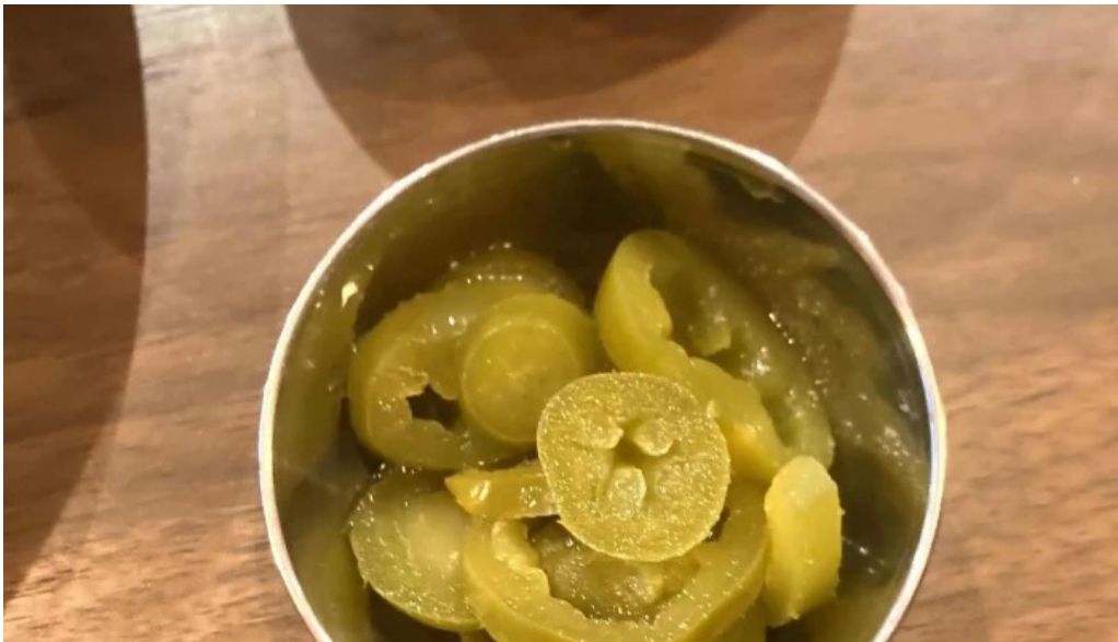
042currybaseゼロヨンニカリィベイス スパイスカレー専門店 どこ