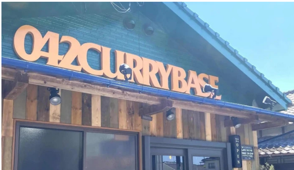
042currybaseゼロヨンニカリィベイス スパイスカレー専門店 口コミ