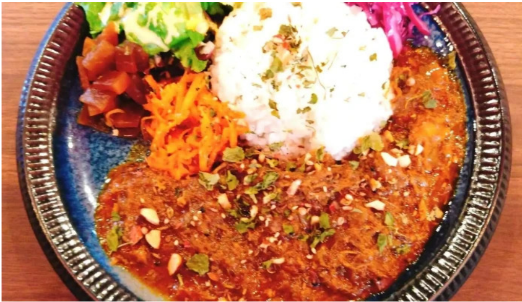
042currybaseゼロヨンニカリィベイス スパイスカレー専門店 料理飲み物