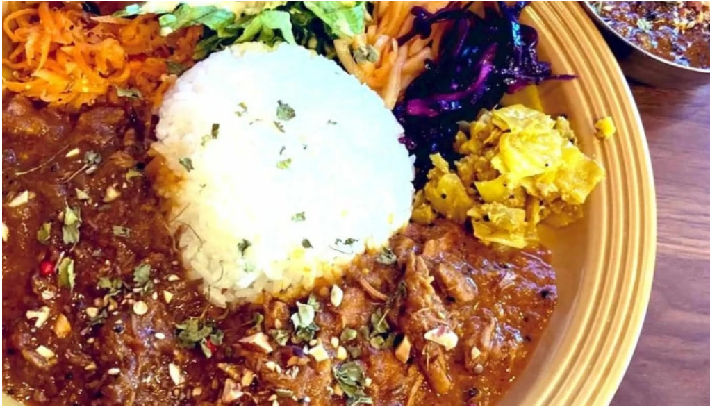
042currybaseゼロヨンニカリィベイス スパイスカレー専門店 割引