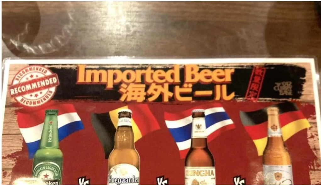
042currybaseゼロヨンニカリィベイス スパイスカレー専門店 プロモーション