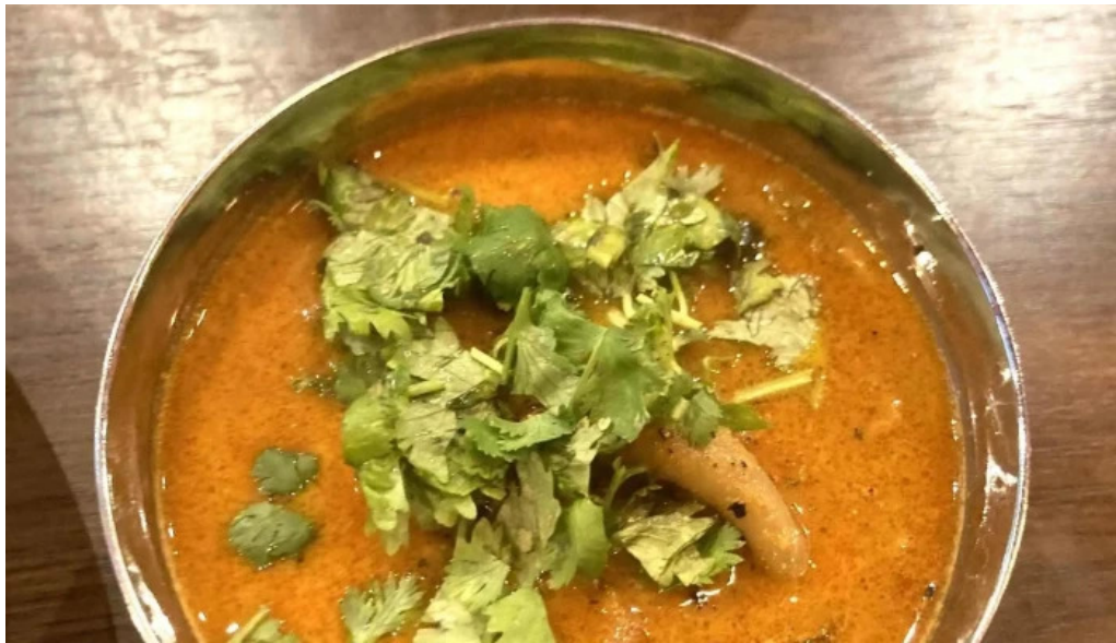
042currybaseゼロヨンニカリィベイス スパイスカレー専門店 コメント