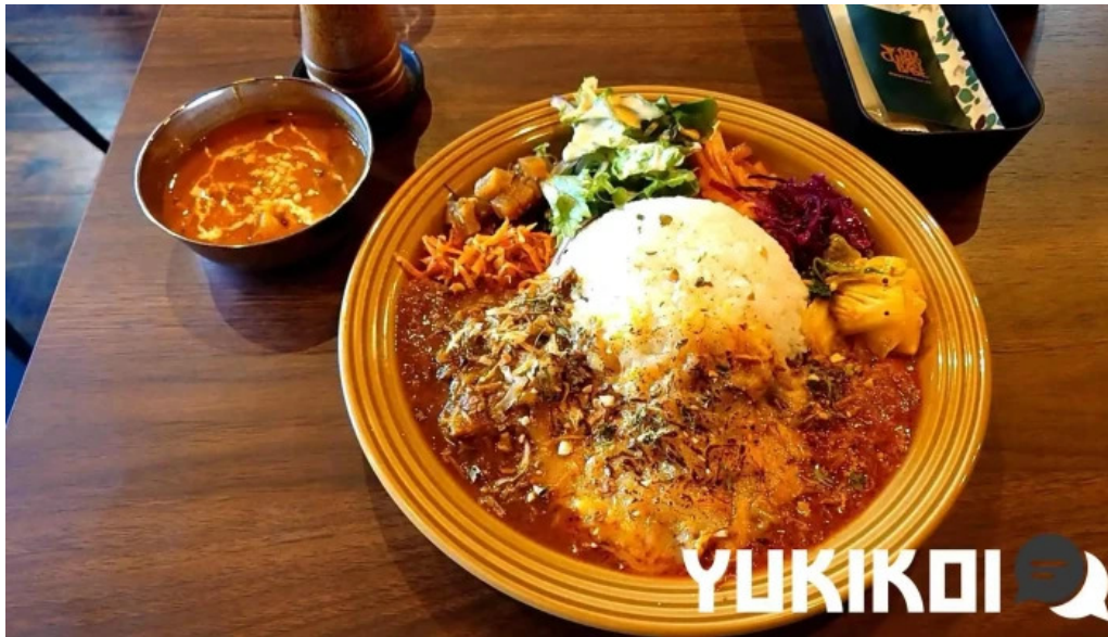
042currybaseゼロヨンニカリィベイス スパイスカレー専門店 カレー