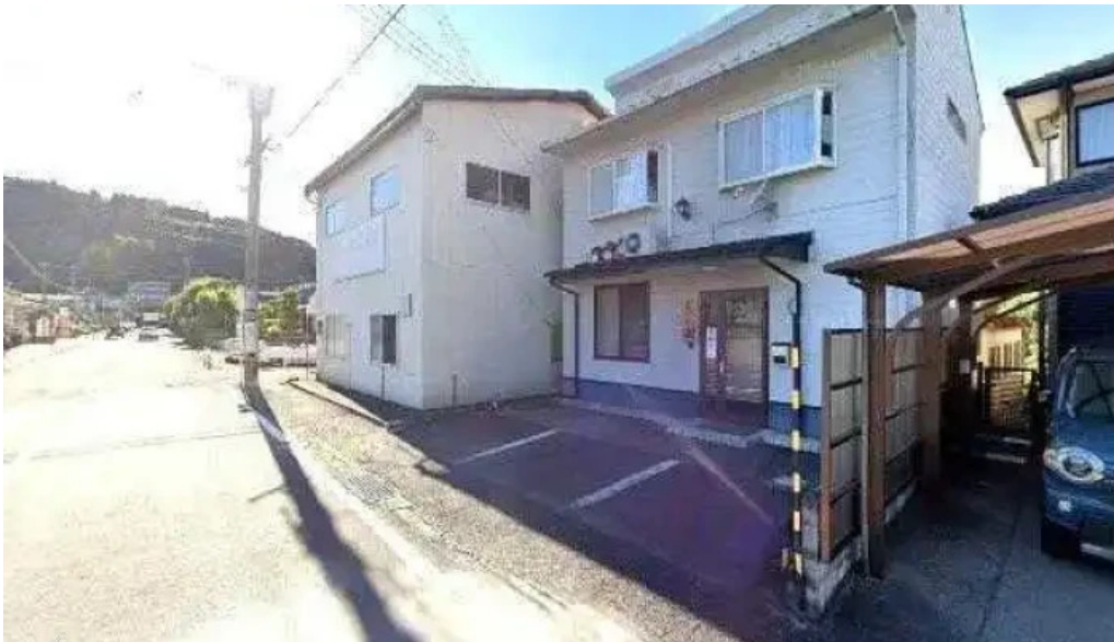
042currybaseゼロヨンニカリイベイス スパイスカレー専門店 人吉市