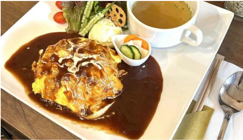
くいの巣 コーヒー