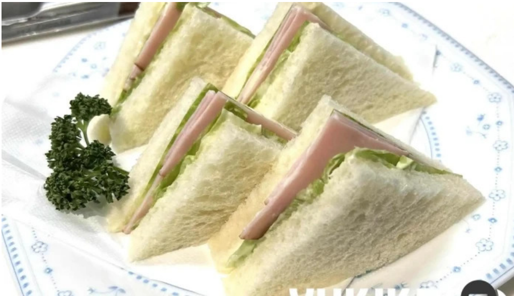
くいの巣 料理飲み物