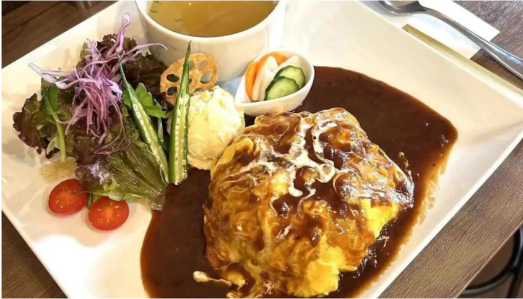
くいの巣