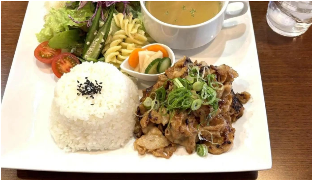
くいの巣 カタログ