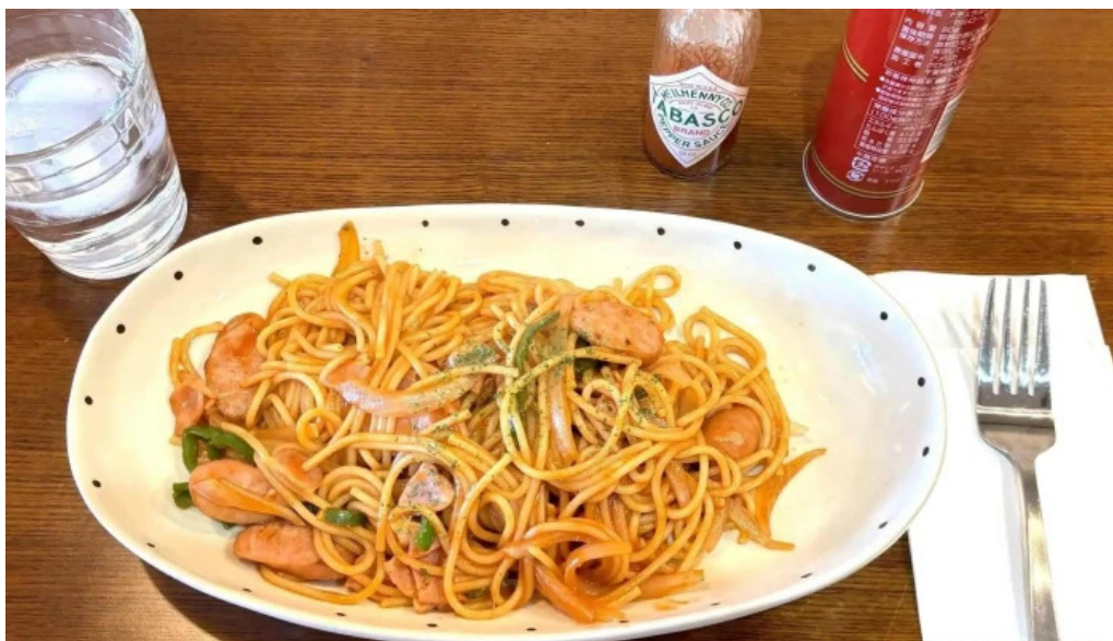
くいの巣 ウェブサイト