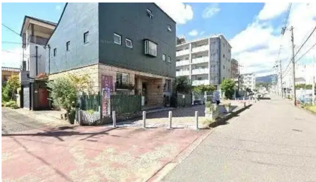
くいの巣 長岡京市