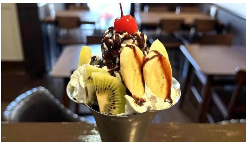
くいの巣 アイスクリーム