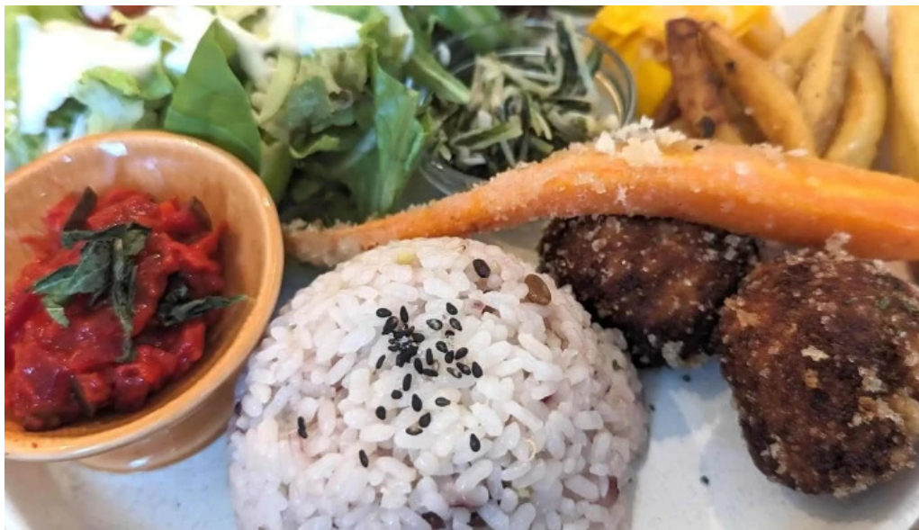
Tumikiつみき natural café 営業中