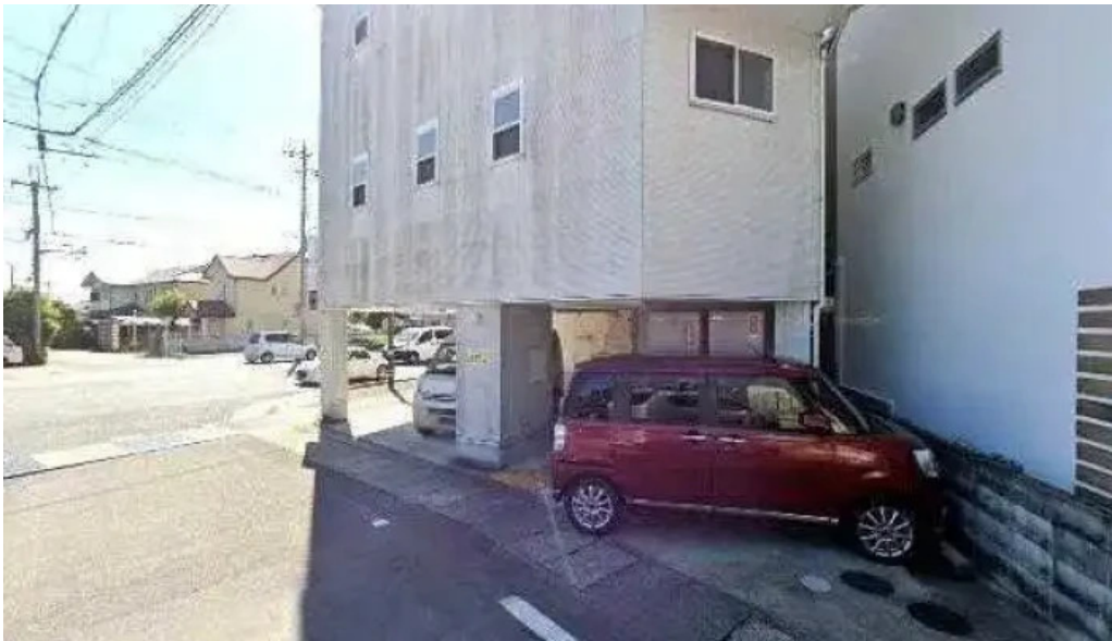
Tumikiつみき natural café 長岡京市