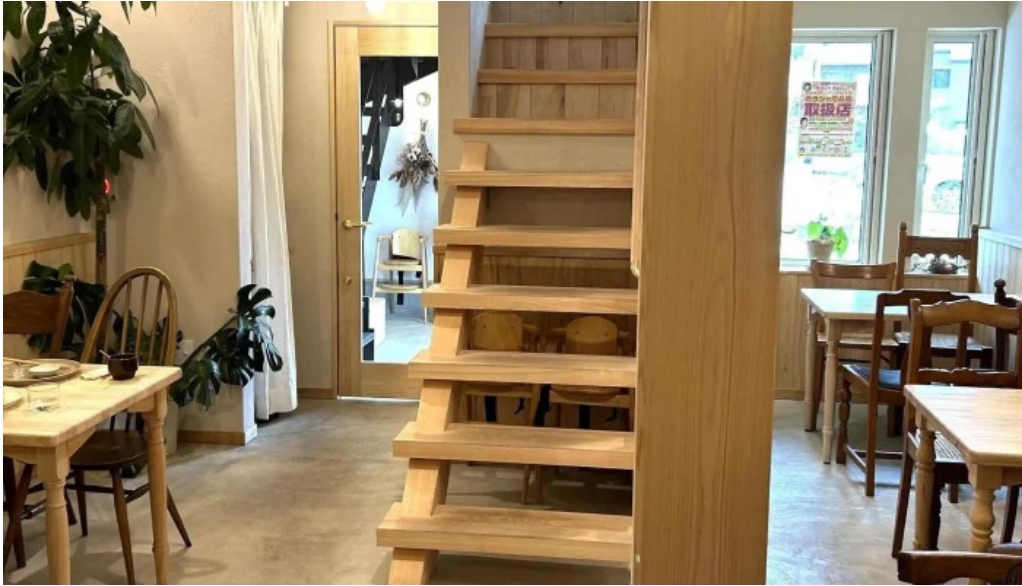
Tumikiつみき natural café 番号