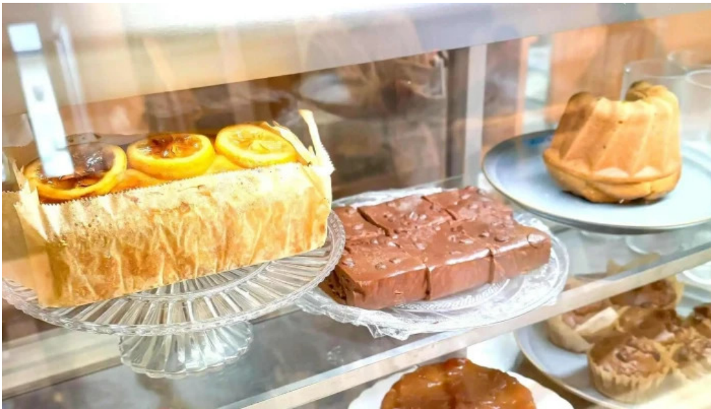
Tumikiつみき natural café 料金