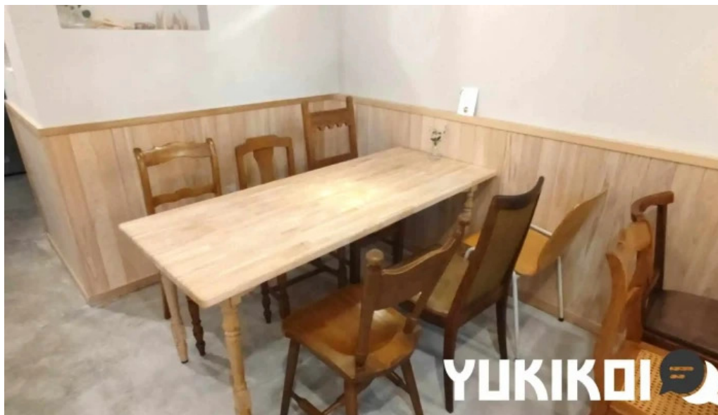
Tumiki (つみき) ~natural cafe~ 長岡京市