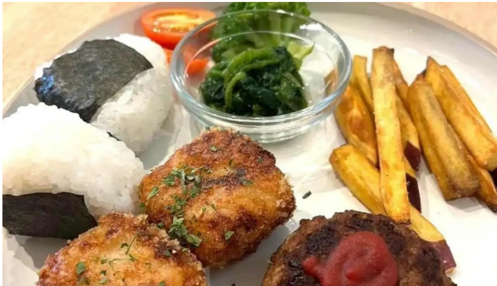
Tumikiつみき natural café 料理飲み物