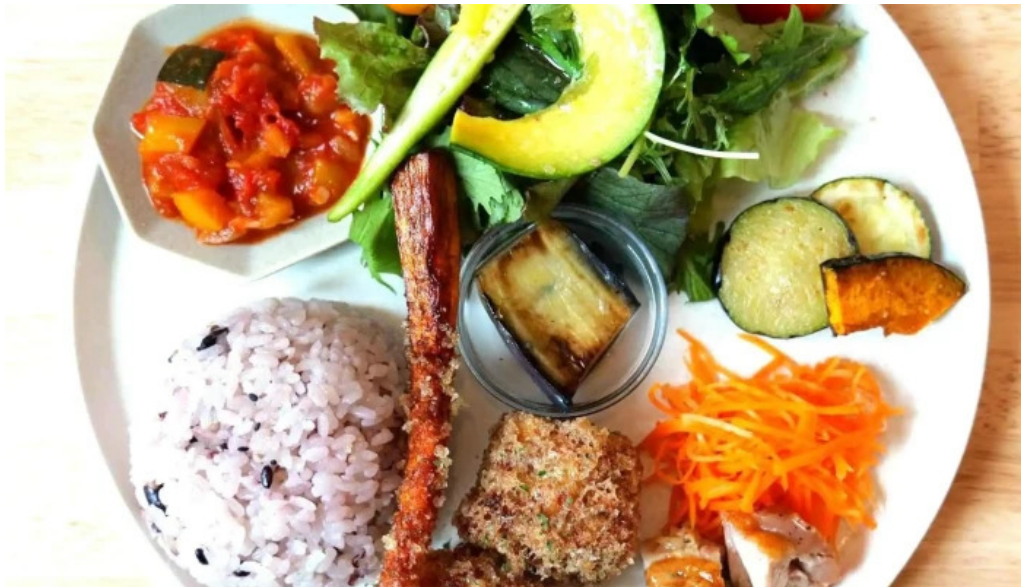
Tumikiつみき natural café 営業時間