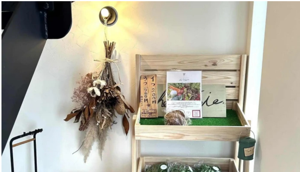
Tumikiつみき natural café ウェブサイト