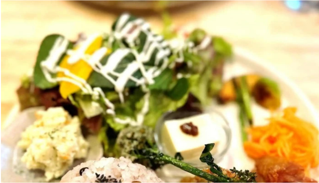
Tumikiつみき natural café カタログ