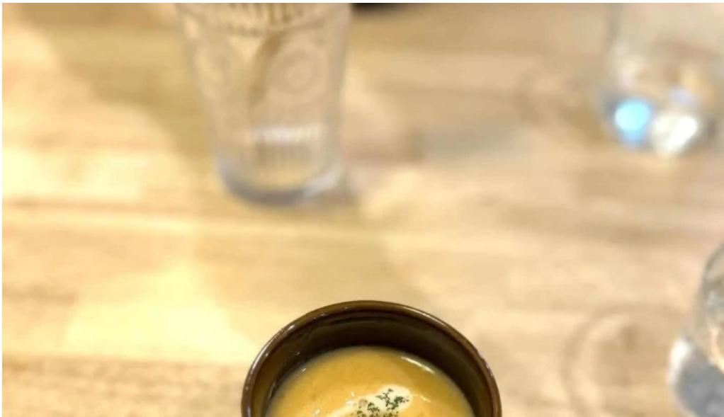
Tumikiつみき natural café 住所