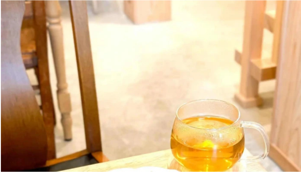
Tumikiつみき natural café 写真