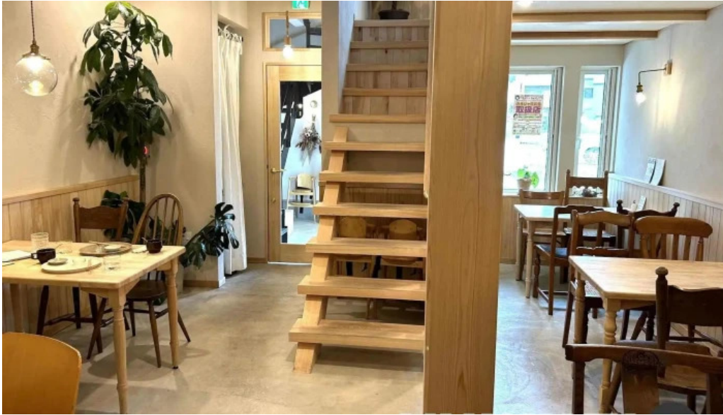
Tumikiつみき natural café 霧圀気