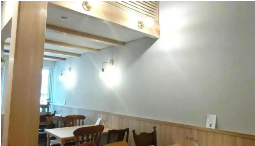
Tumikiつみき natural café オーナー提供