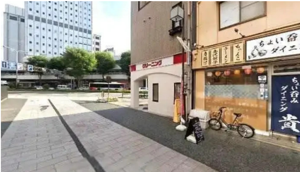
Curio espresso and vintage design 金沢市