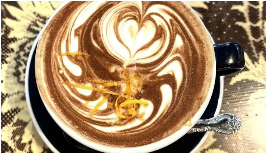
Curio espresso and vintage design カフェラッテ