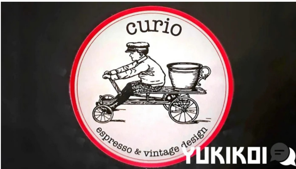
Curio espresso and vintage design