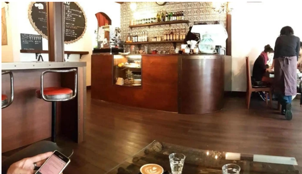
Curio espresso and vintage design コーヒー