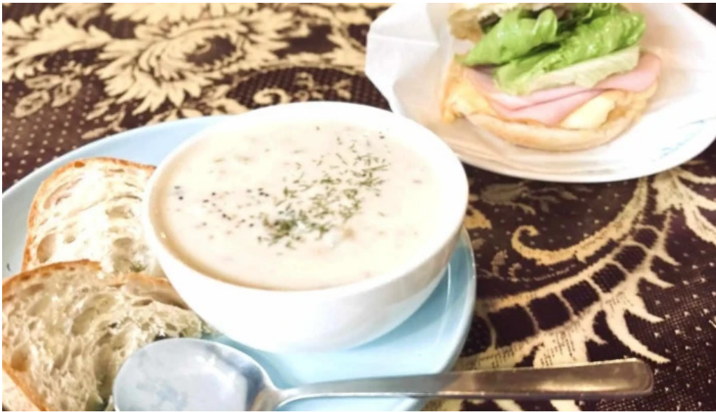
Curio espresso and vintage design 動画