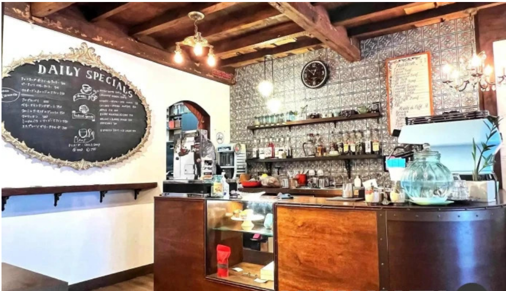
Curio espresso and vintage design 雰囲気