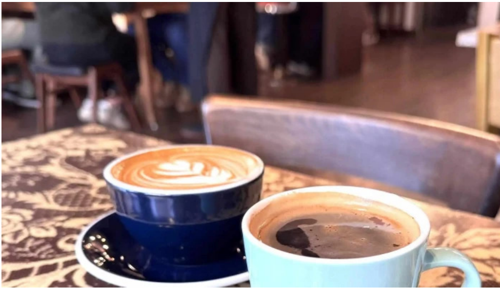
Curio espresso and vintage design 所在地