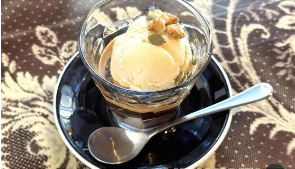
Curio espresso and vintage design アフォガート