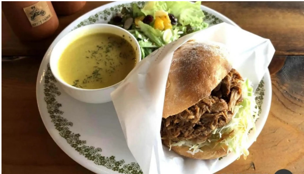
Curio espresso and vintage design プルドポーク