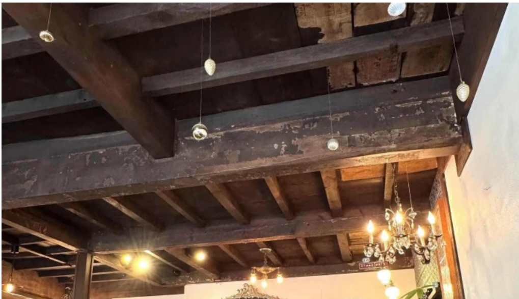
Curio espresso and vintage design 電話