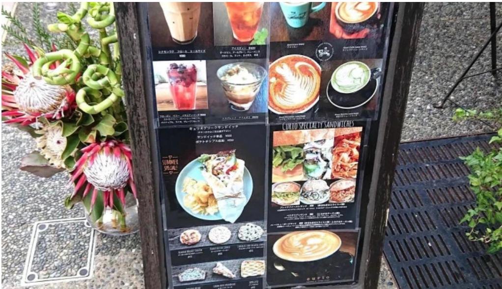
Curio espresso and vintage design メニュー