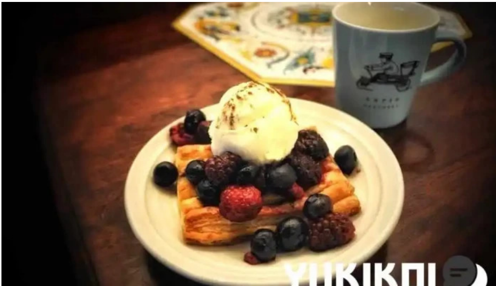
Curio espresso and vintage design 料理飲み物