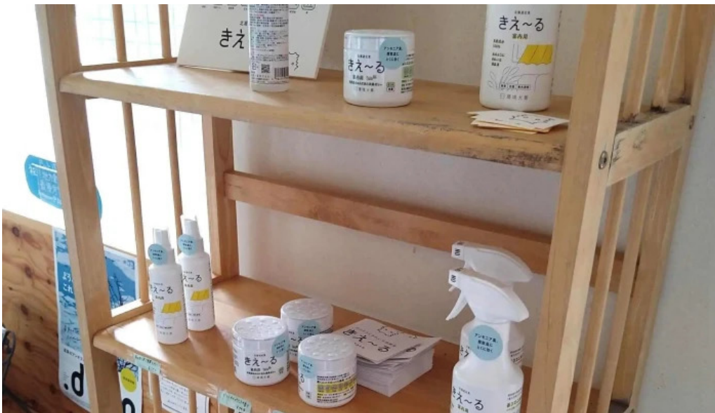
Shi Tang manma comentario 3