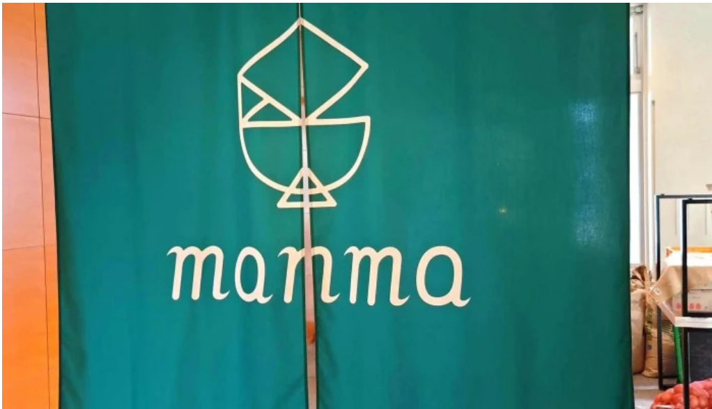
Shi Tang manma comentario 5