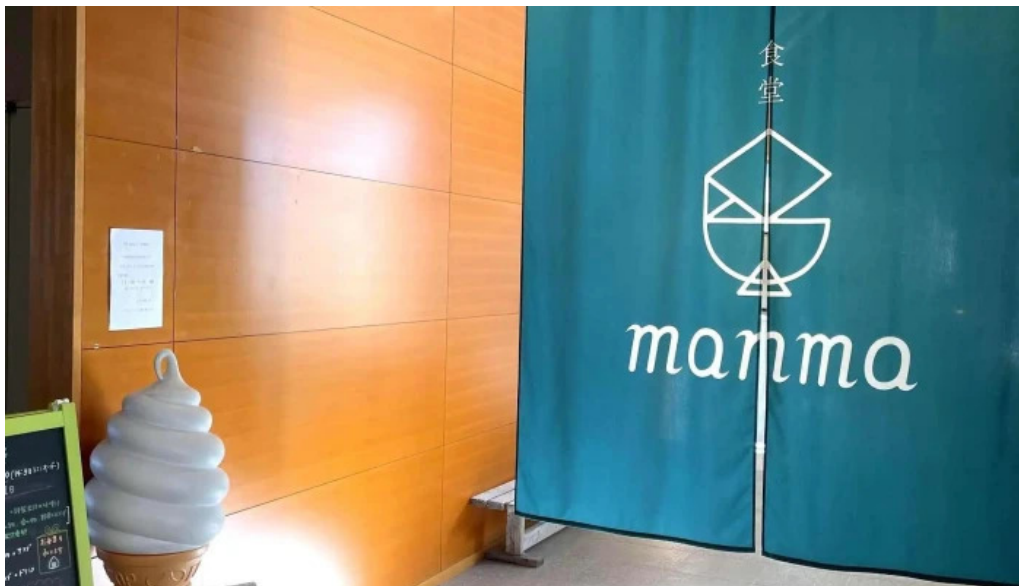
Shi Tang manma comentario 9