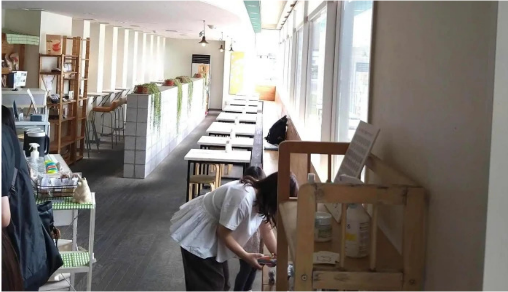
Shi Tang manma comentario 2