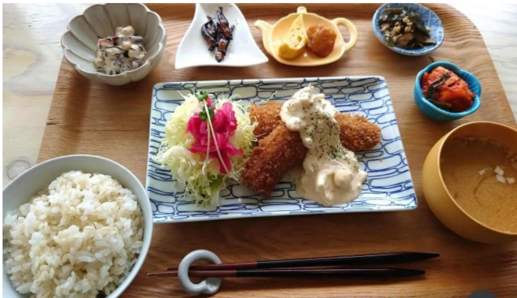
Shi Tang manma Liao Li Yin miWu