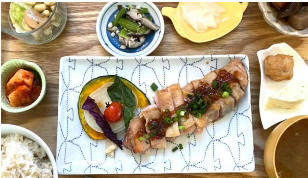
Shi Tang manma comentario 7