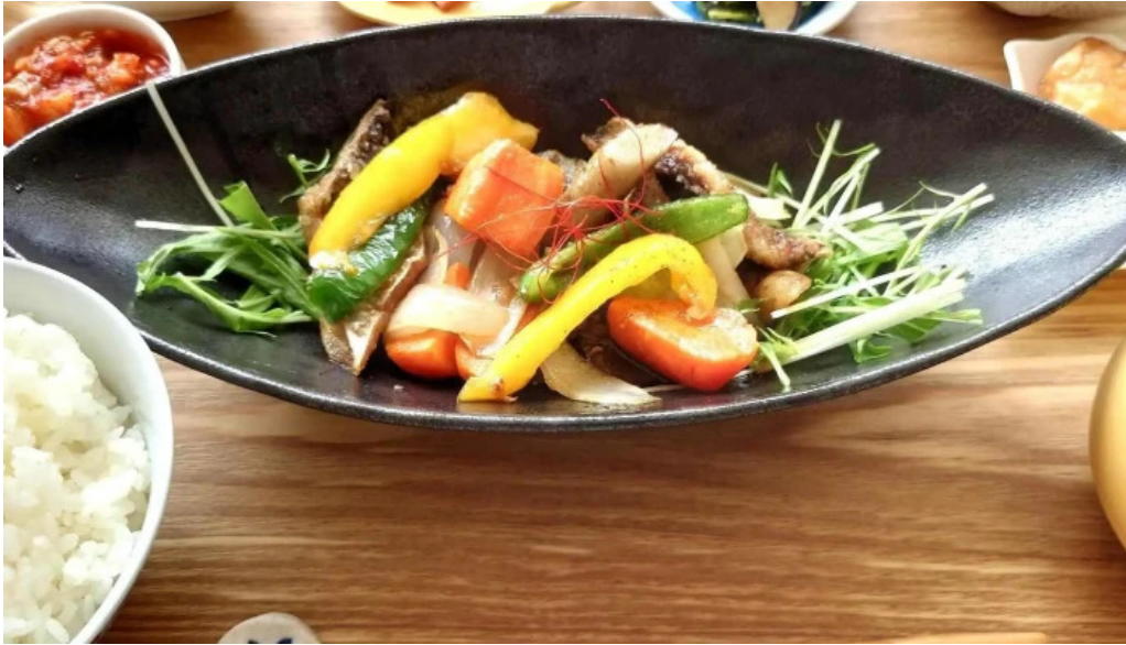
Shi Tang manma comentario 6