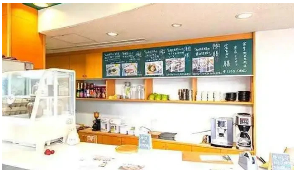
食堂 manma 網走市