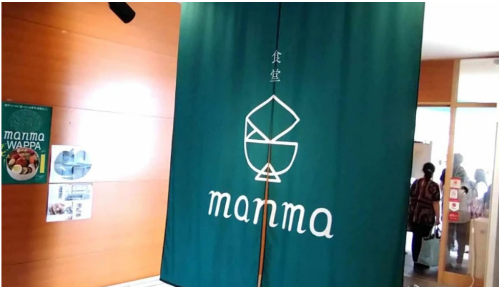
Shi Tang manma comentario 1