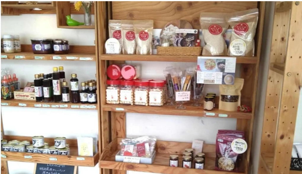
Shi Tang manma comentario 4