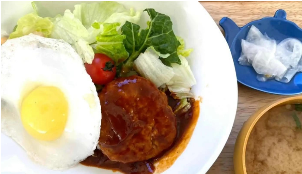
Shi Tang manma comentario 8