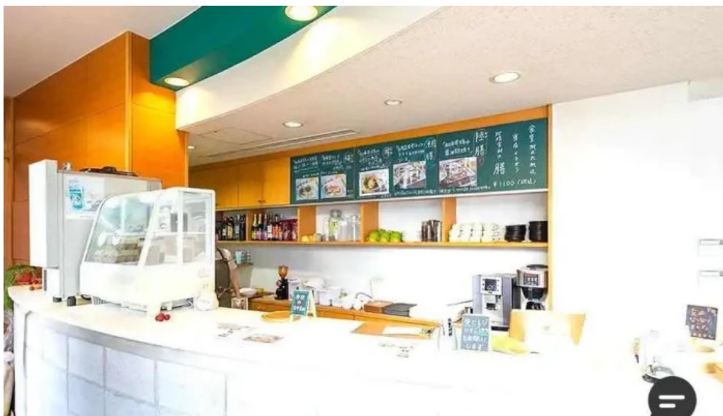
Shi Tang manma Fen Wei Qi