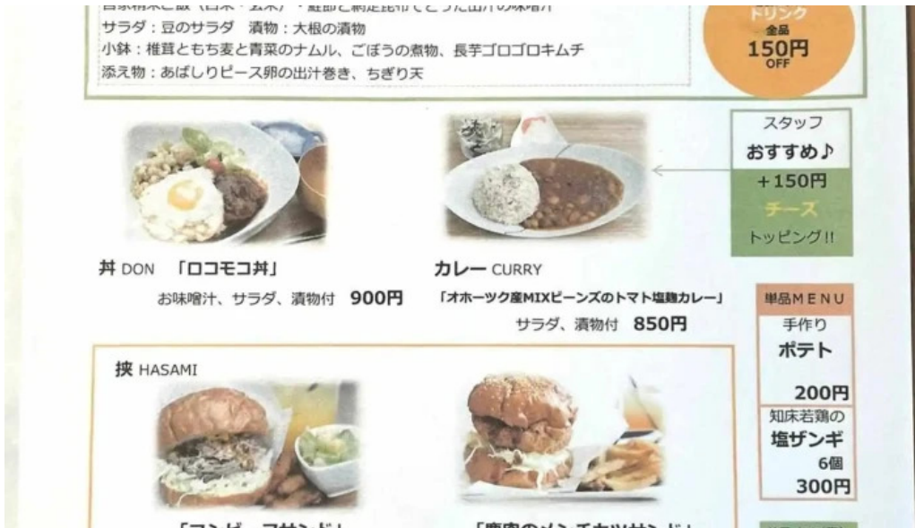
Shi Tang manma meniyu