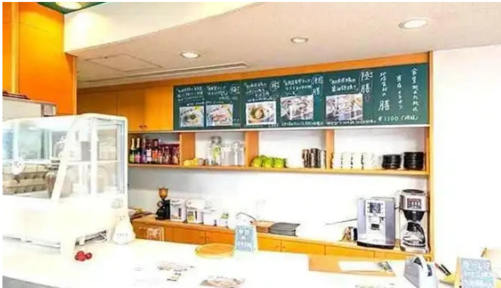
Shi Tang manma subete