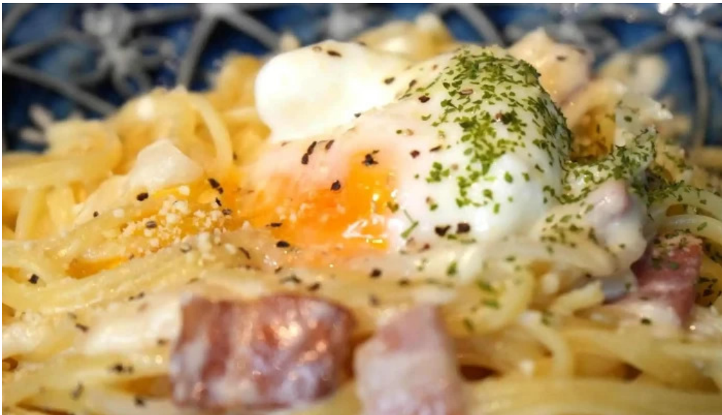
Liacafe comentario 6