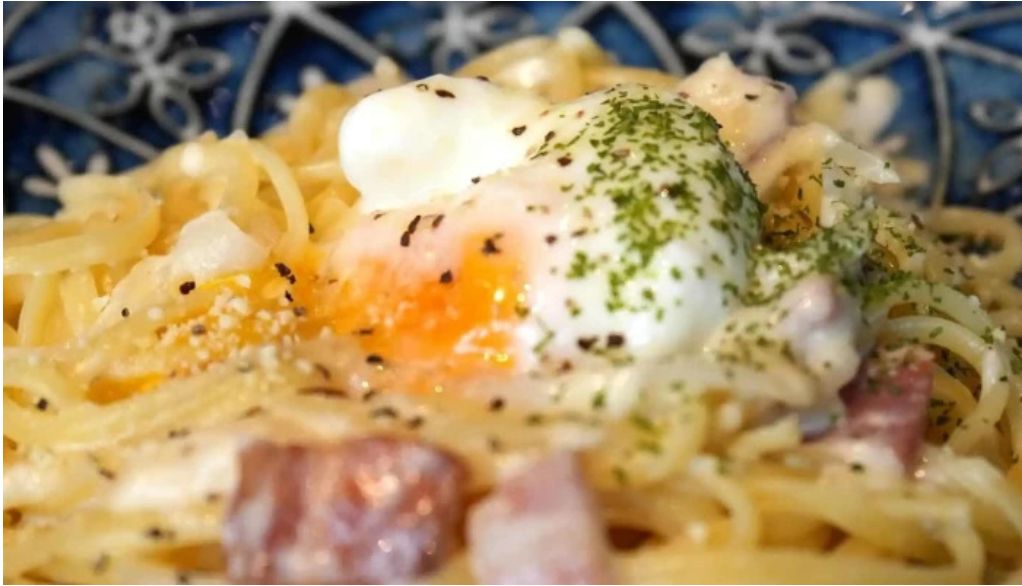
Liacafe comentario 5