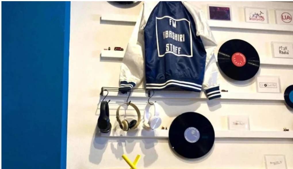
Liacafe comentario 1