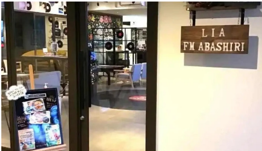
Lia cafe 網走市