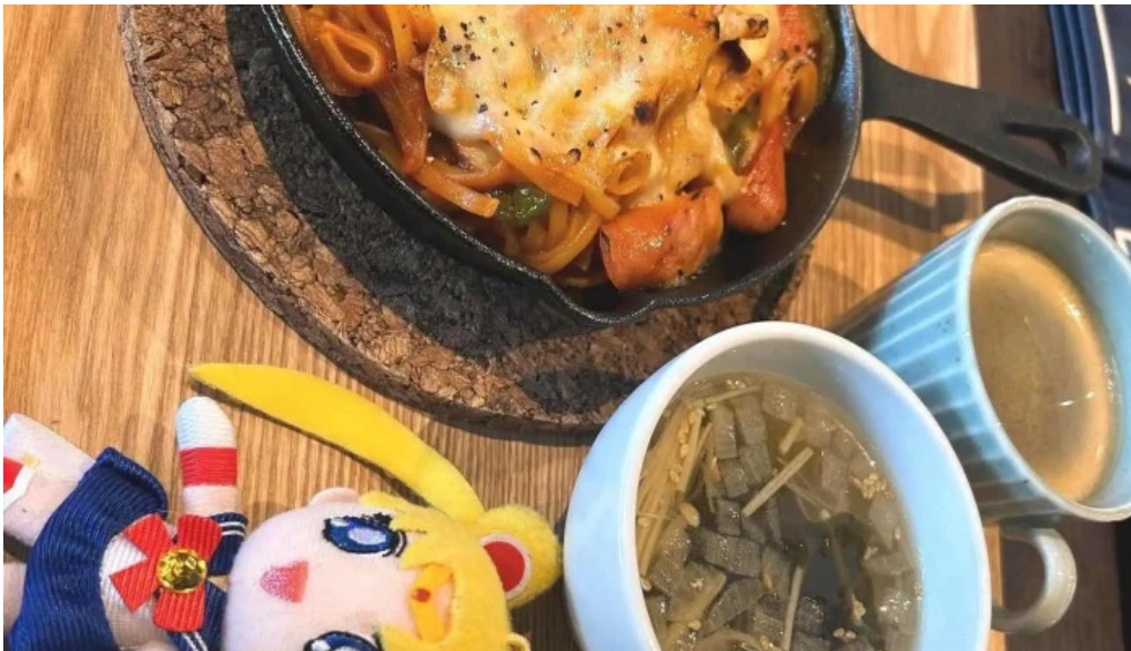
Liacafe comentario 2