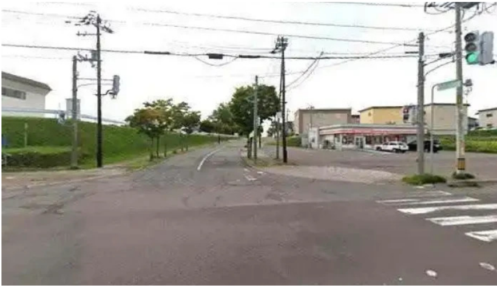
Liacafe ストリートビューと 360 ビュー