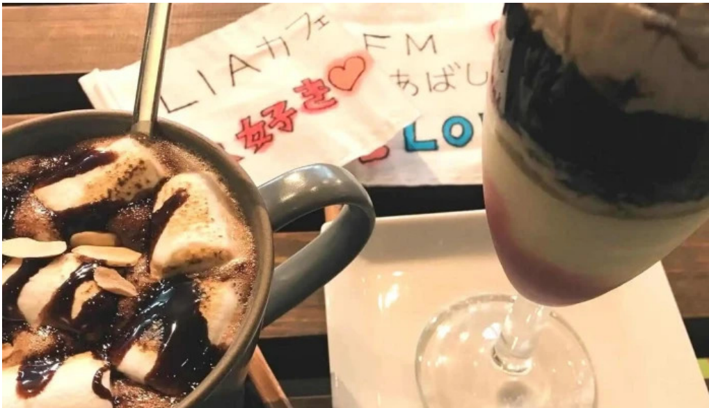
Liacafe comentario 3