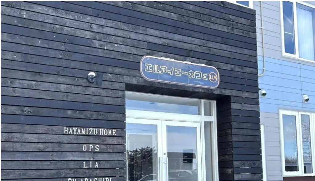
Liacafe comentario 4