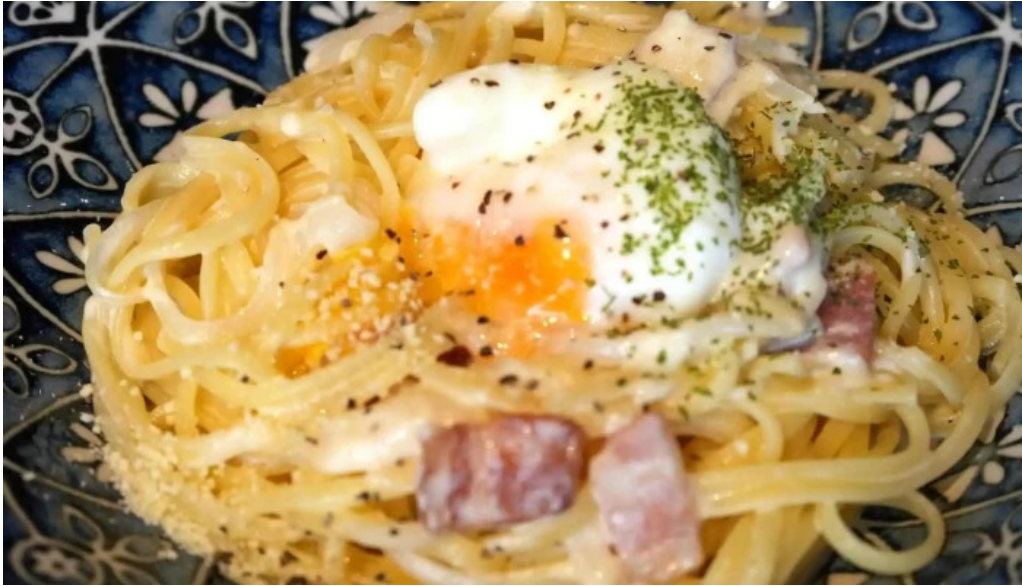
Liacafe comentario 7