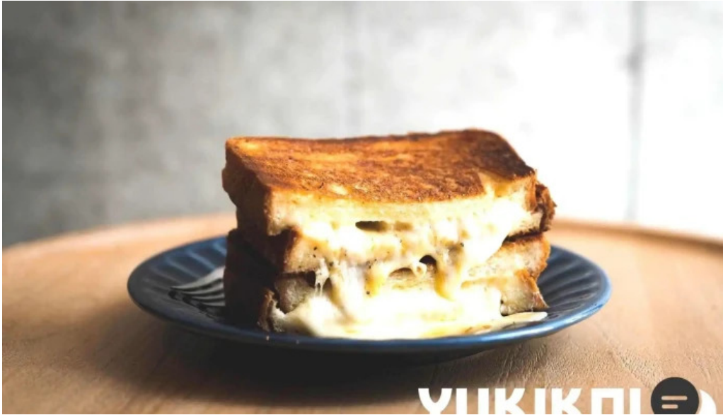
禁断果実 kindankajitsu チーズサンド