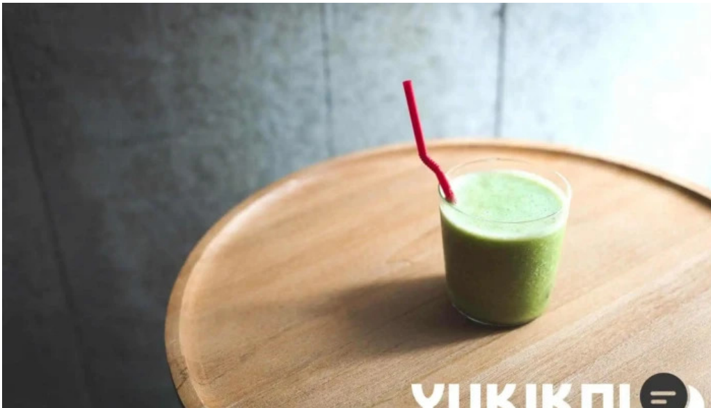
禁断果実 kindankajitsu スムージー