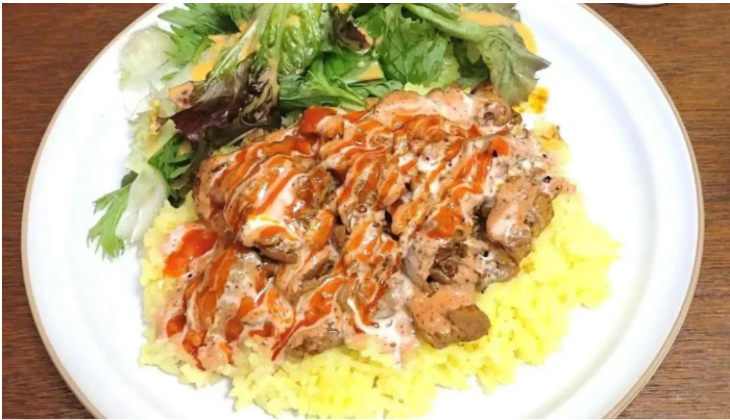
禁断果実 kindankajitsu プルドポーク