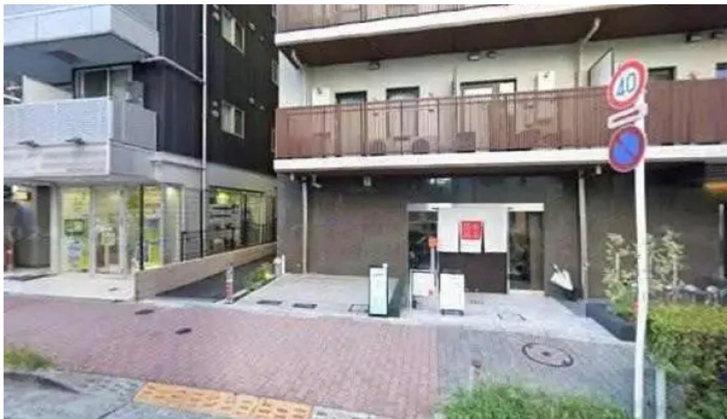
禁断果実 kindankajitsu 目黒区