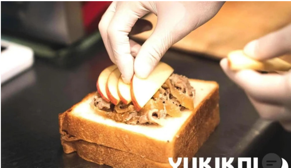
禁断果実 kindankajitsu トースト