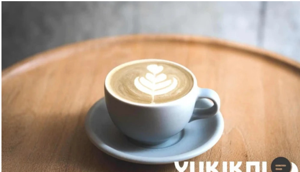
禁断果実 kindankajitsu 料理飲み物