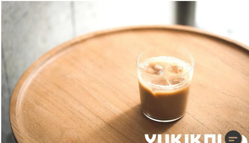
禁断果実 kindankajitsu コーヒー