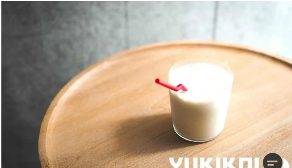
禁断果実 kindankajitsu ラッシー