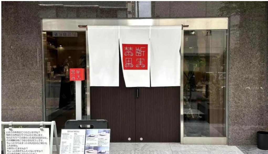
禁断果実 kindankajitsu