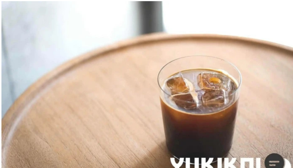
禁断果実 kindankajitsu アイスコーヒー