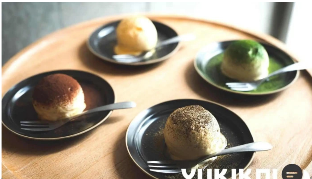
禁断果実 kindankajitsu 餅