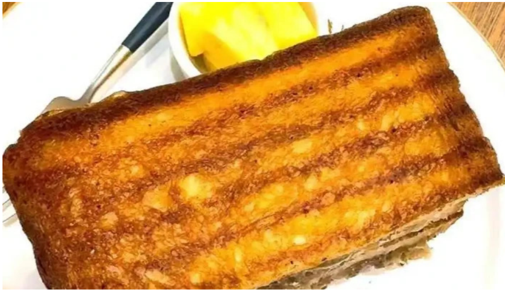
禁断果実 kindankajitsu 動画