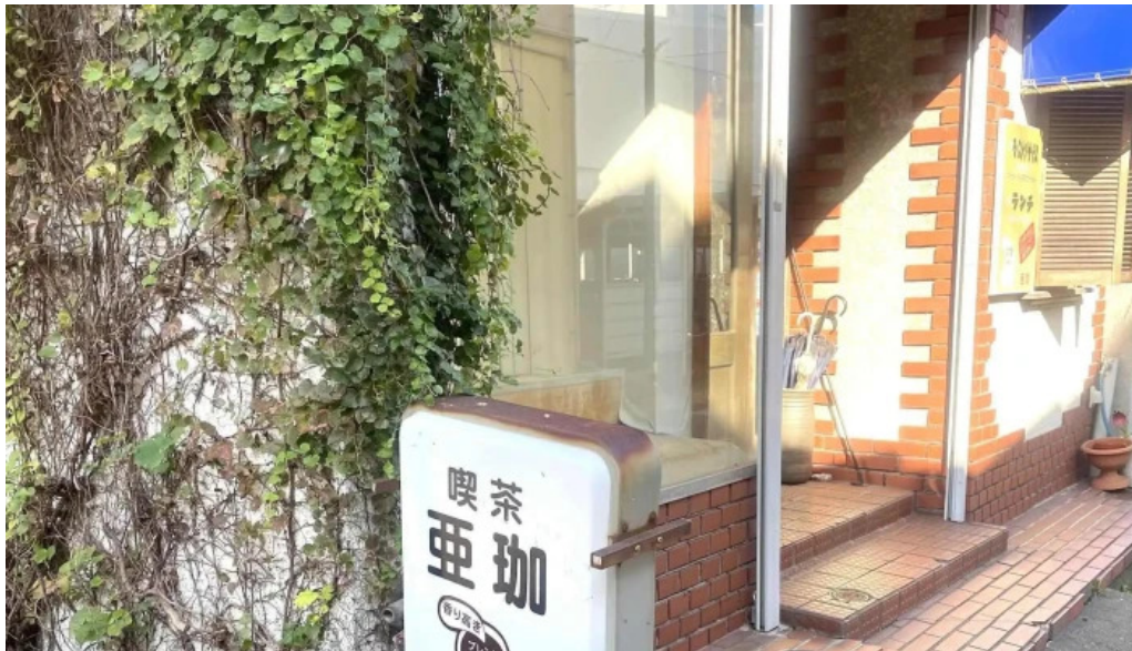
亜珈 ウェブサイト