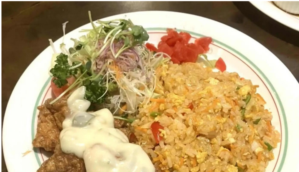
亜珈プロモーション