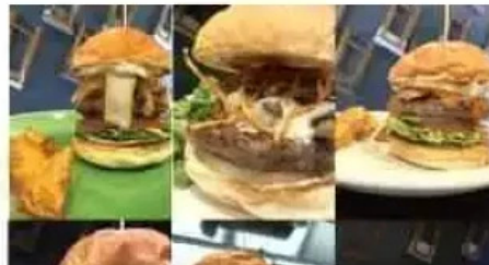
Beach hill food works メニュー