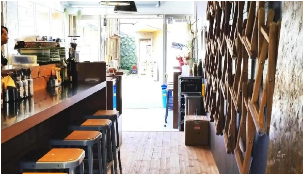
Beach hill food works 雰囲気