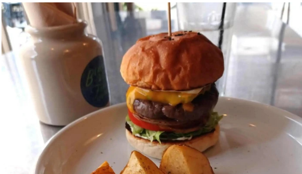
Beach hill food works comentario 2