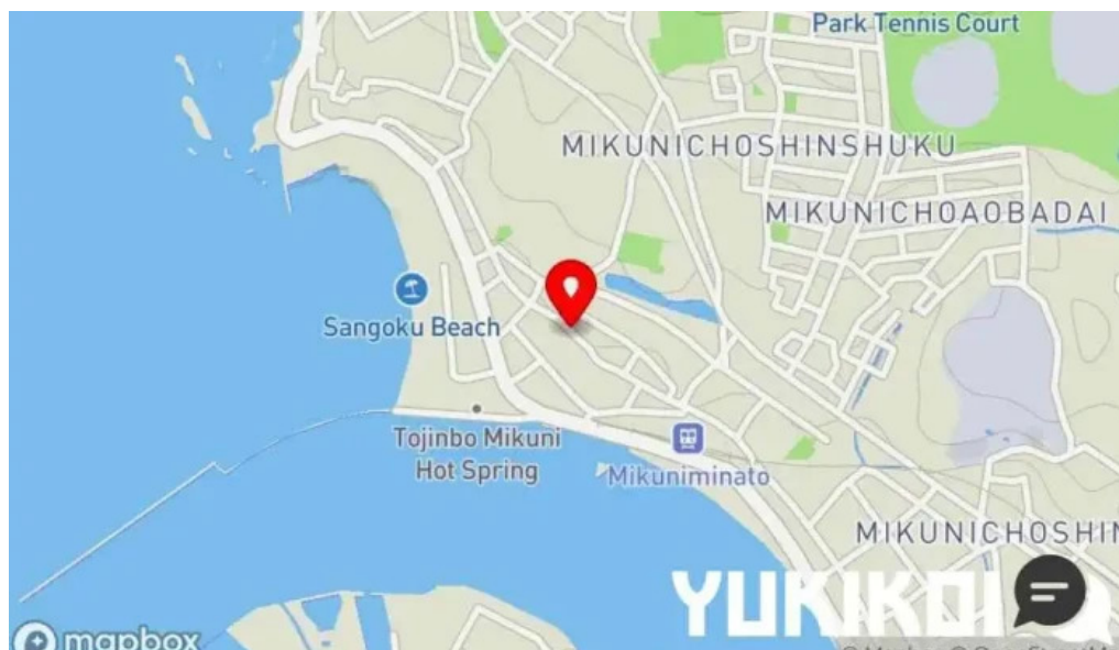
Beach hill food works地図