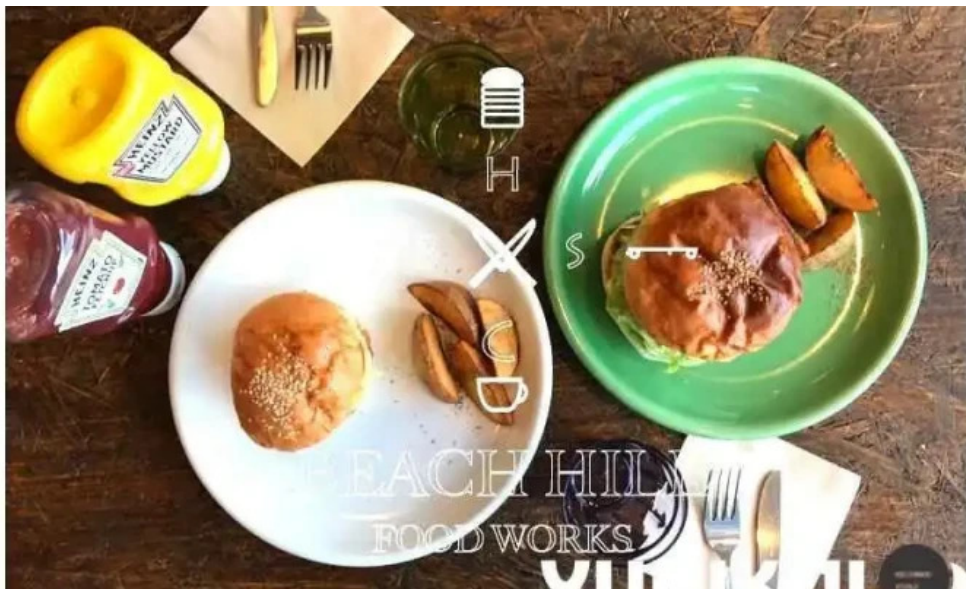
Beach hill food works 料理飲み物