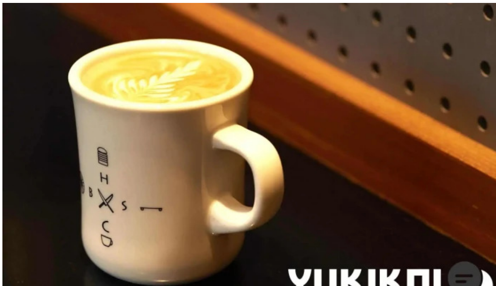
Beach hill food works コーヒー