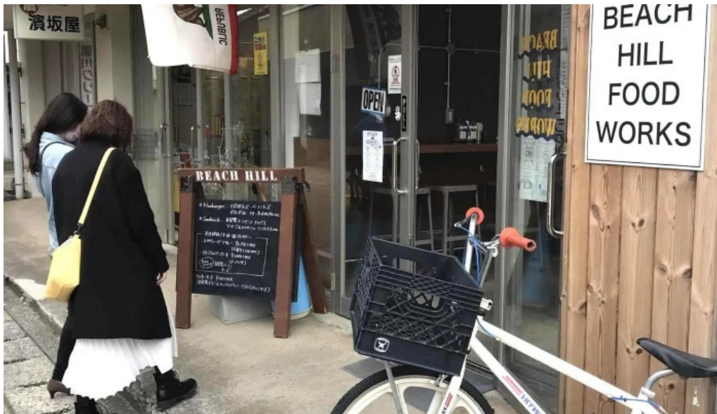
Beach hill food works comentario 4