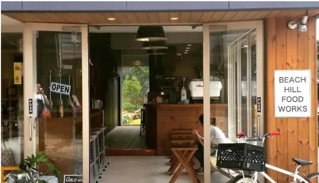
Beach hill food works 坂井市