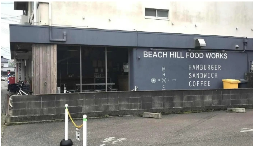
Beach hill food works comentario 3