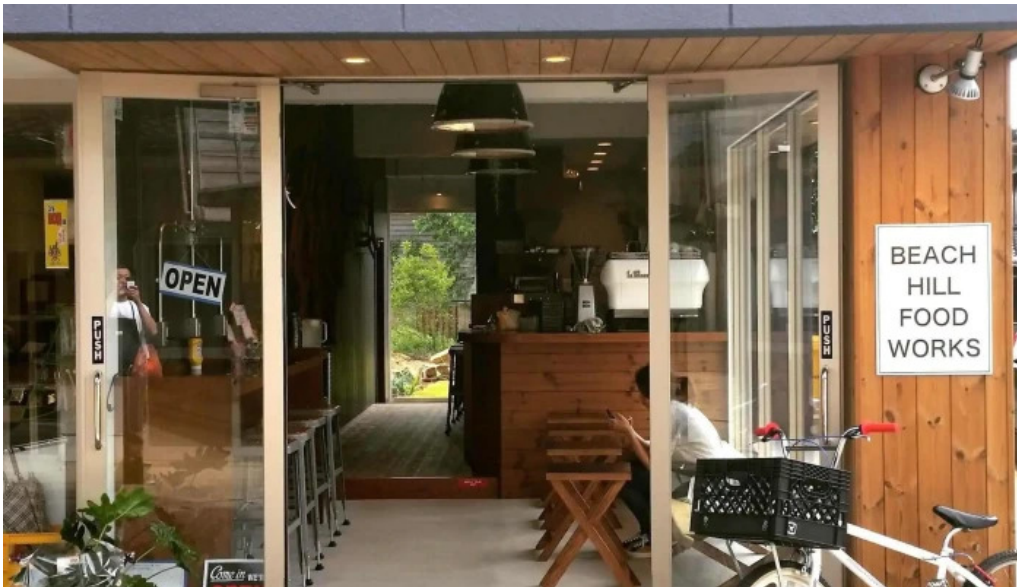
Beach hill food works すべて