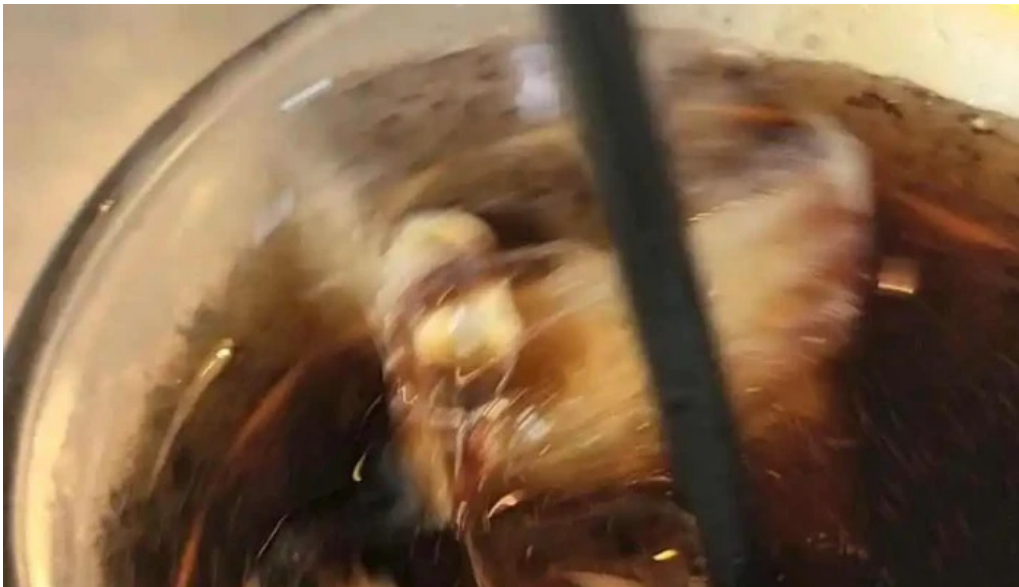
Beach hill food works 動画