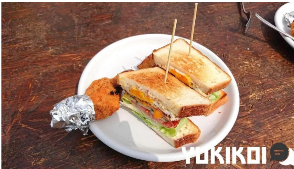
Beach hill food works アメリカンクラブハウスサンド