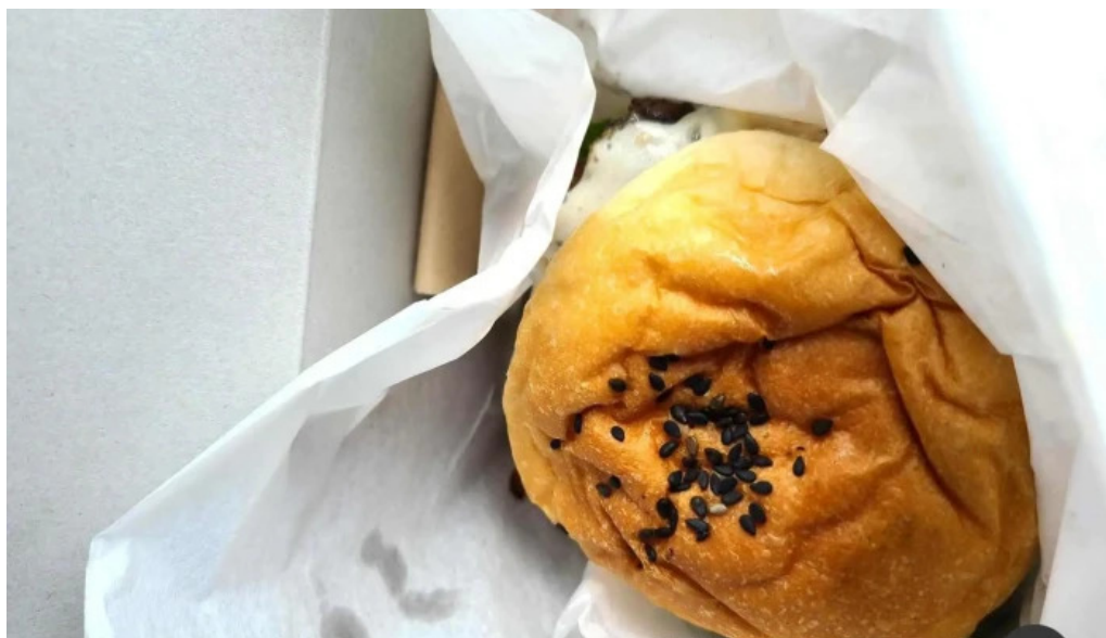
Beach hill food works チキンサンド