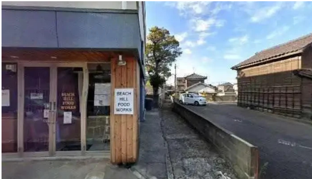
Beach hill food works ストリートビューと 360 ビュー