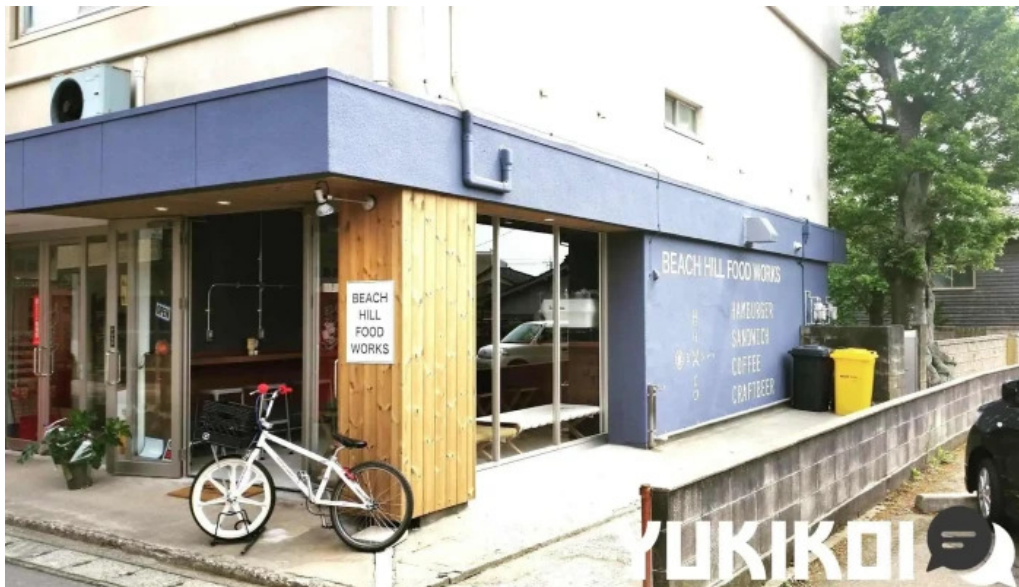
Beach hill food works オーナー提供