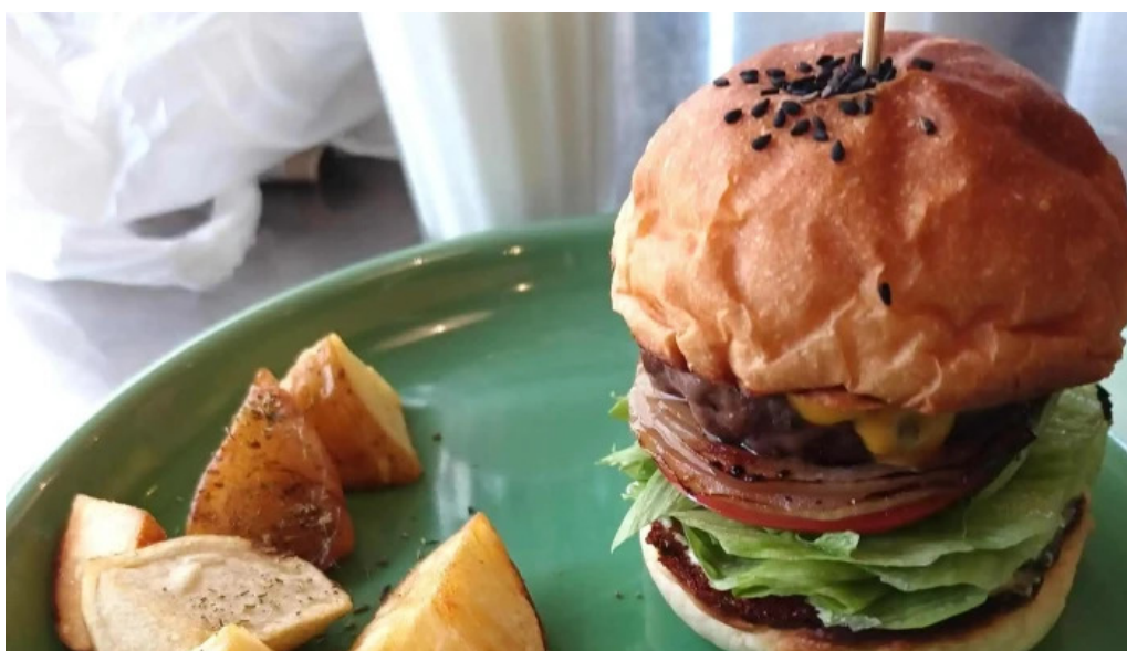
Beach hill food works comentario 1