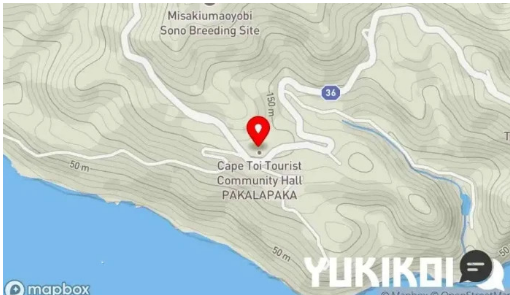
Pakala paka都井岬観光交流館 地図