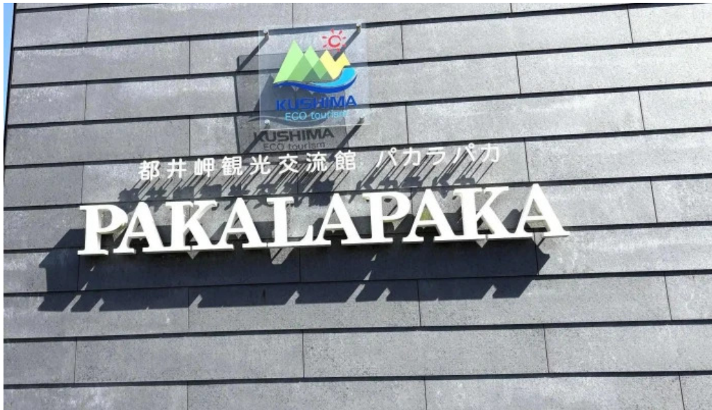
Pakala paka都井岬観光交流館 口コミ