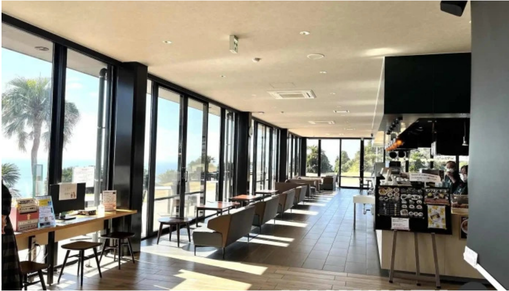
Pakala paka都井岬観光交流館 雰囲気