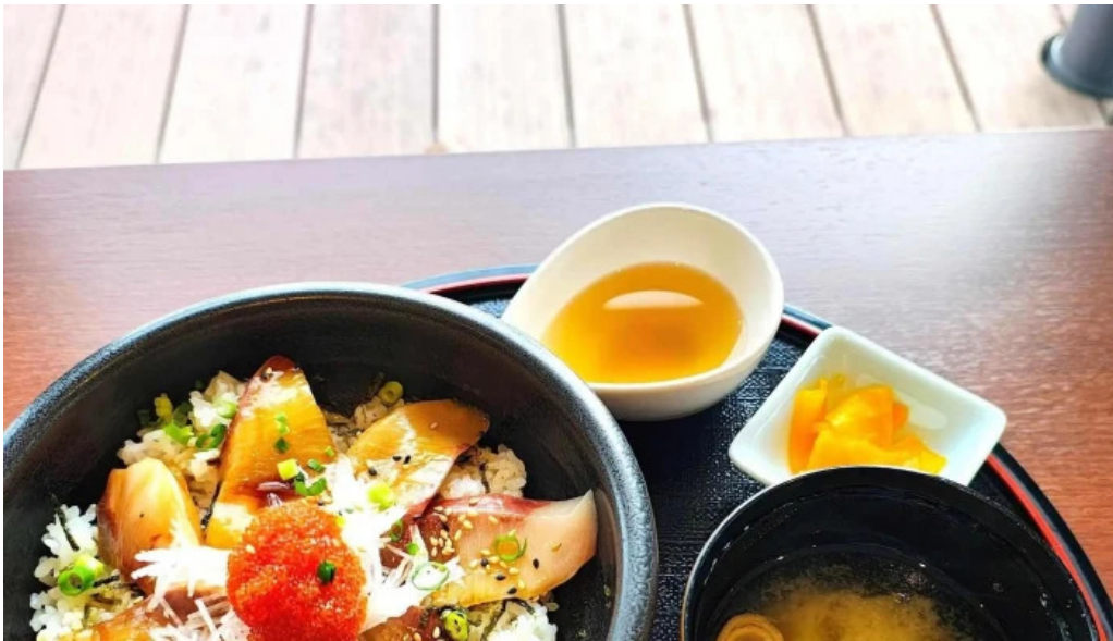
Pakala paka都井岬観光交流館 住所