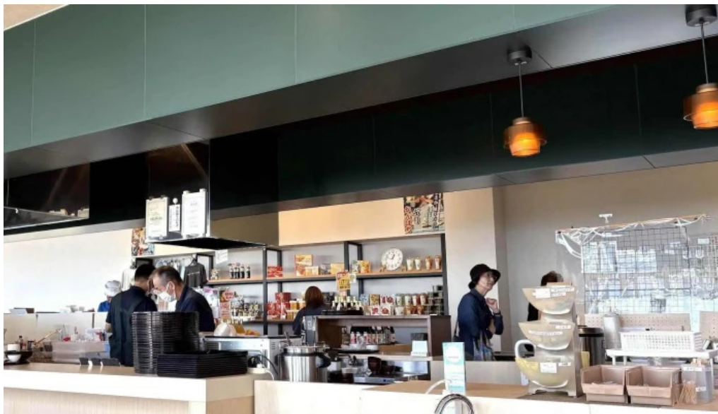
Pakala paka都井岬観光交流館 どこ