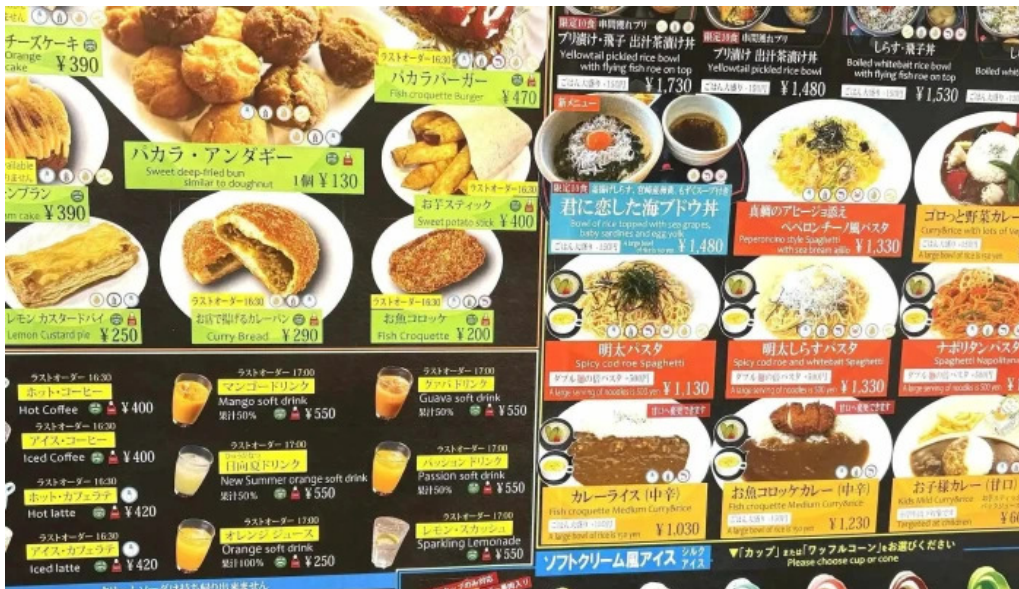
Pakala paka都井岬観光交流館 動画