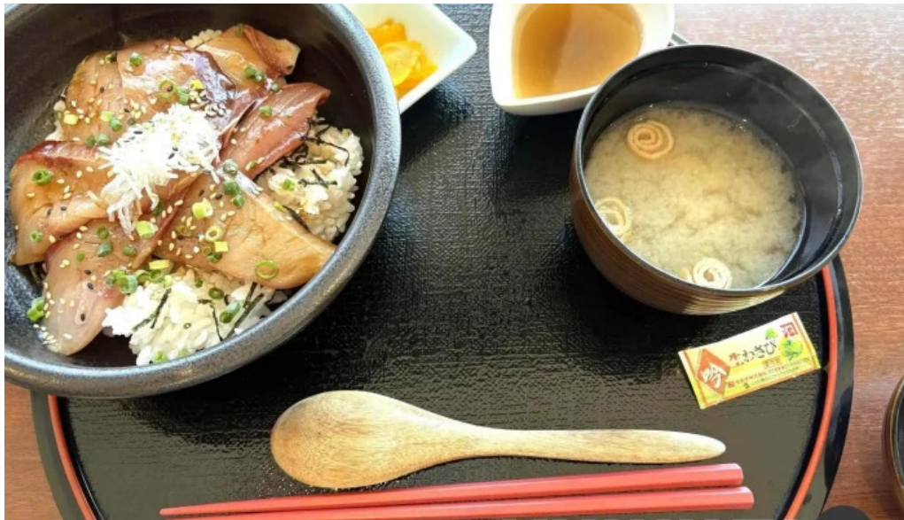
Pakala paka都井岬観光交流館 丼物