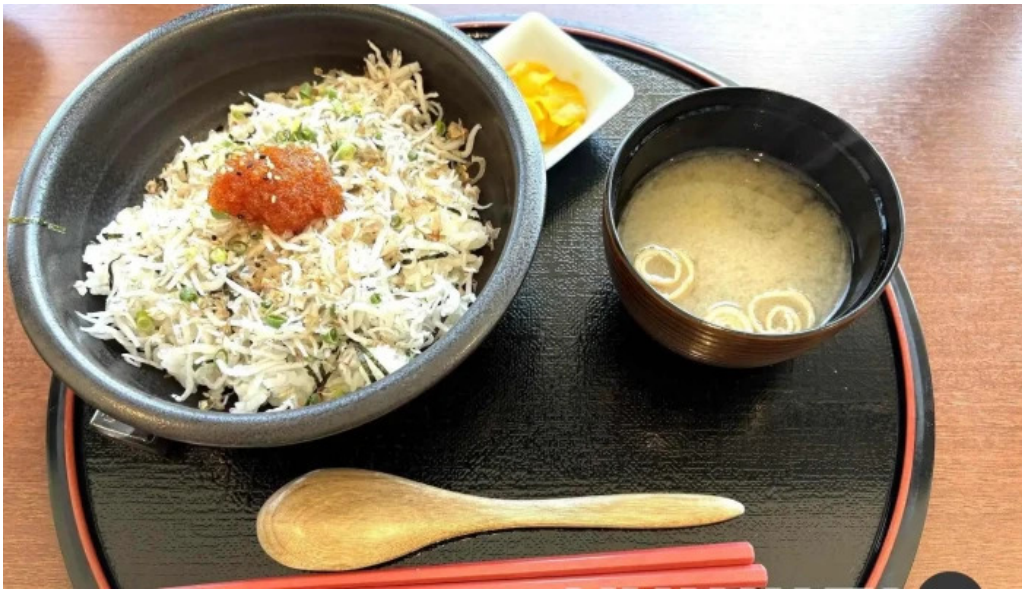
Pakala paka都井岬観光交流館 蕎麦