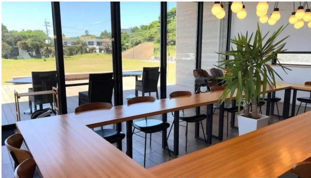
Pakala paka（都井岬観光交流館） 串間市