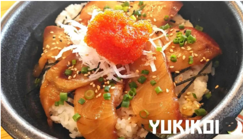
Pakala paka都井岬観光交流館 最新