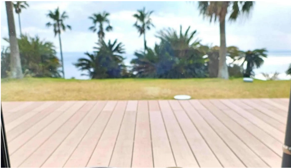
Pakala paka都井岬観光交流館 写真