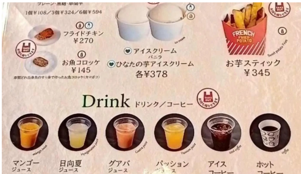
Pakala paka都井岬観光交流館 メニュー