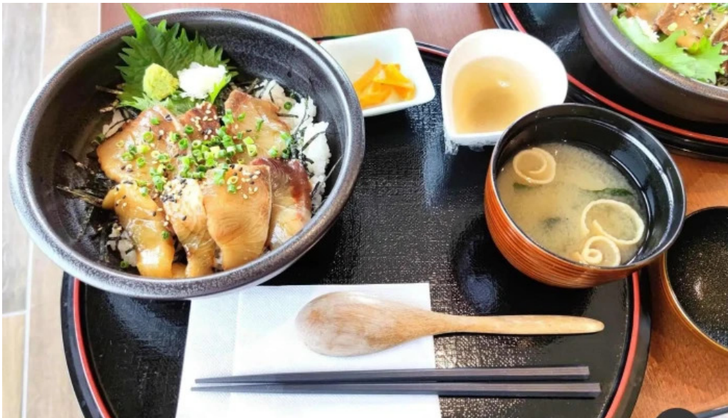
Pakala paka都井岬観光交流館 料理飲み物