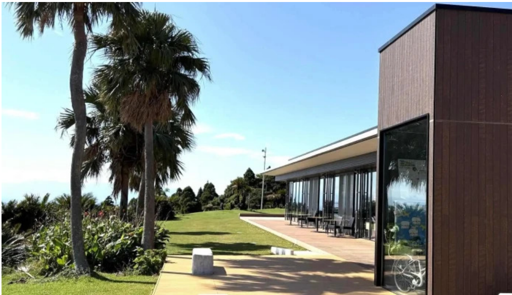
Pakala paka都井岬観光交流館 営業時間