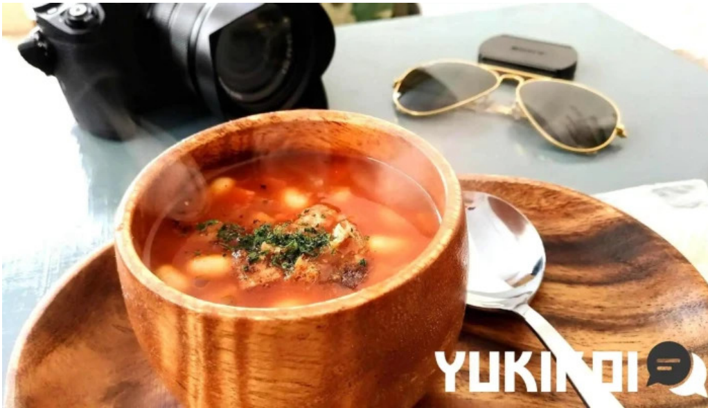
ニセコ山麓パーラー スープ