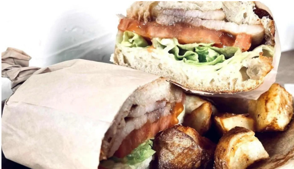
ニセコ山麓パーラー プロモーション