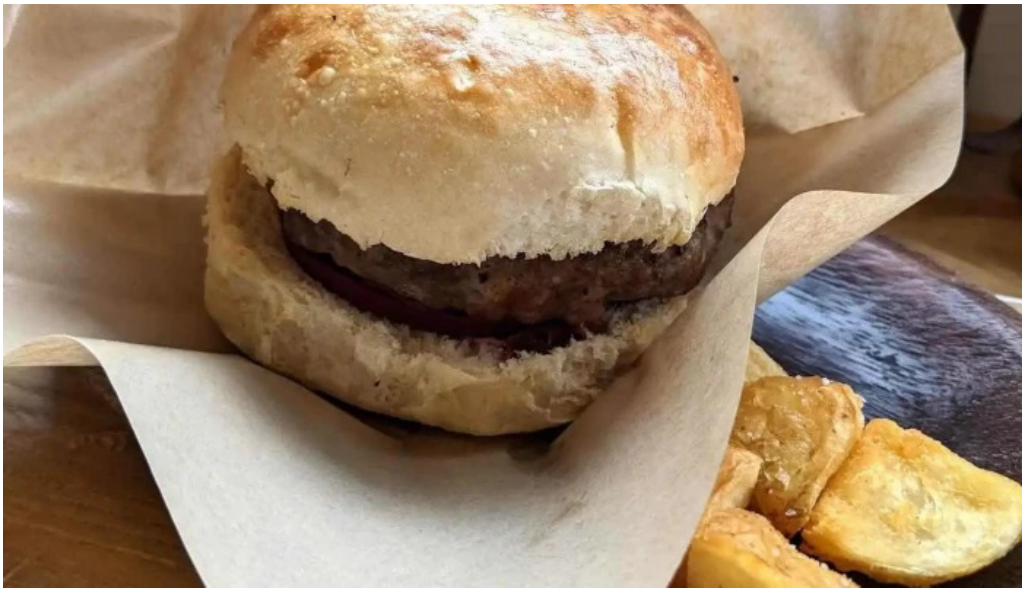
ニセコ山麓パーラー ハンバーガー