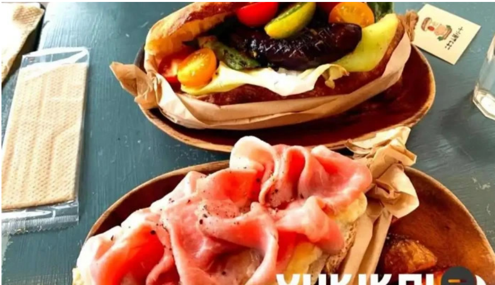
ニセコ山麓パーラー ハム