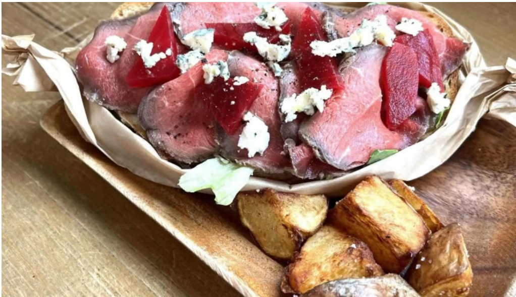
ニセコ山麓パーラー 番号