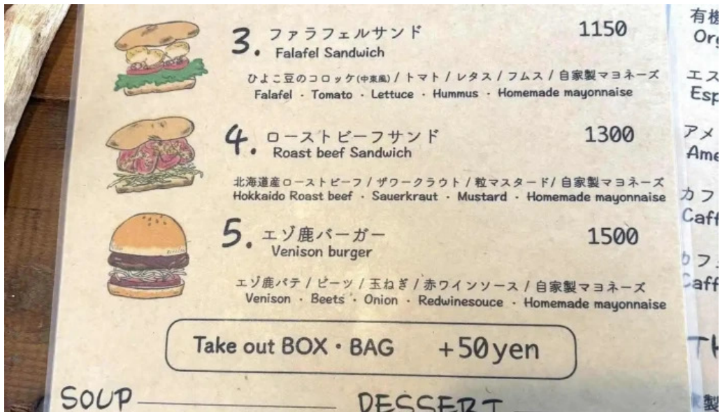
ニセコ山麓パーラーメニュー