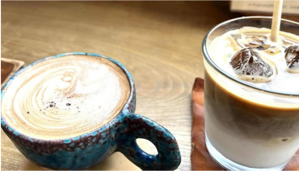
ニセコ山麓パーラー 近く