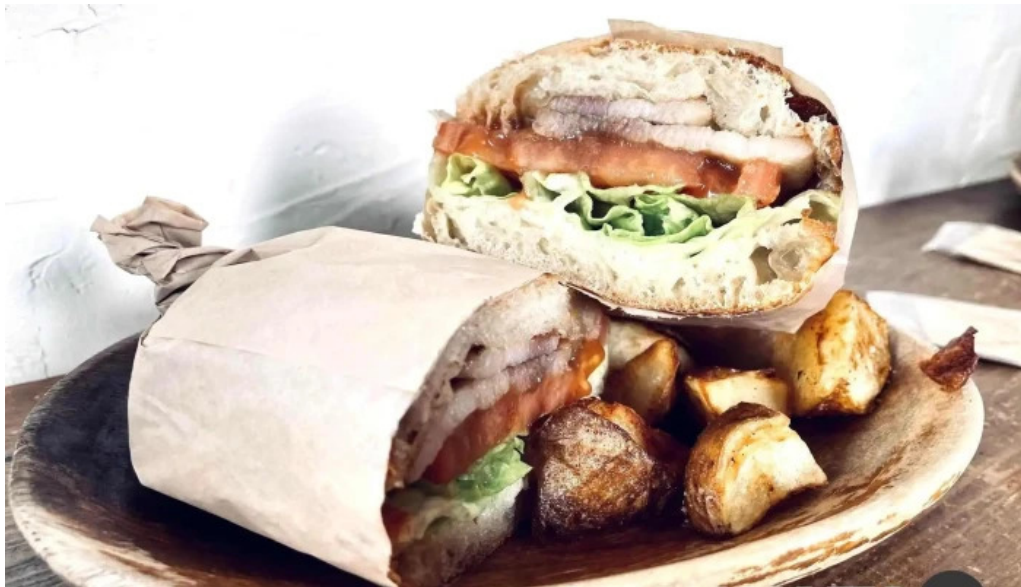
ニセコ山麓パーラー 料理飲み物