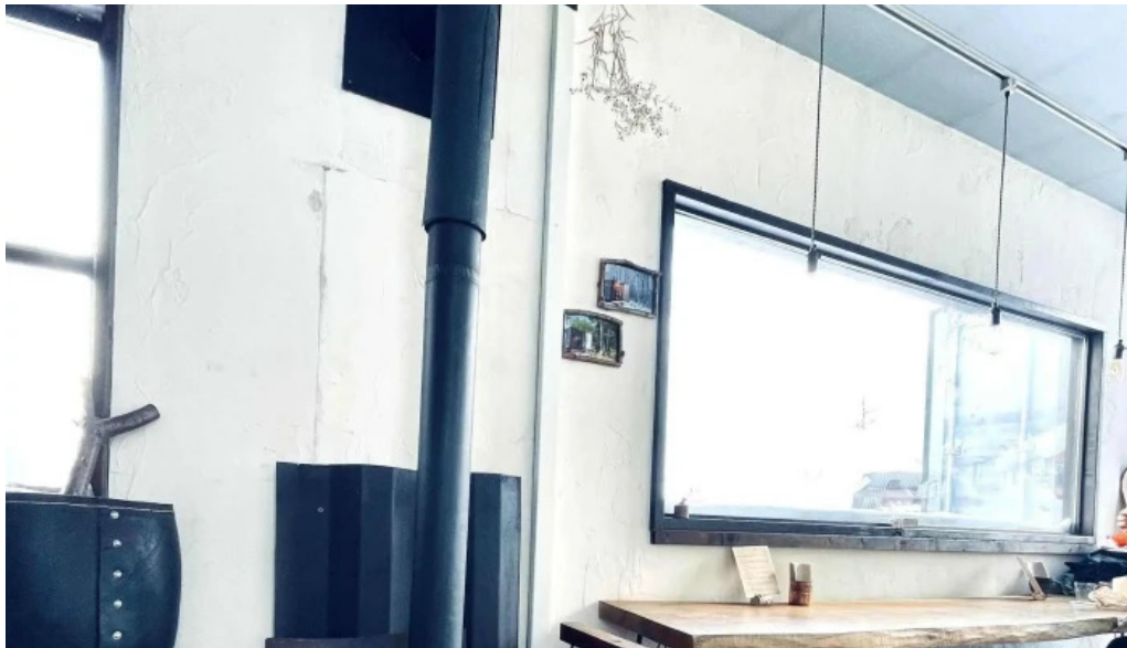
ニセコ山麓パーラー カタログ