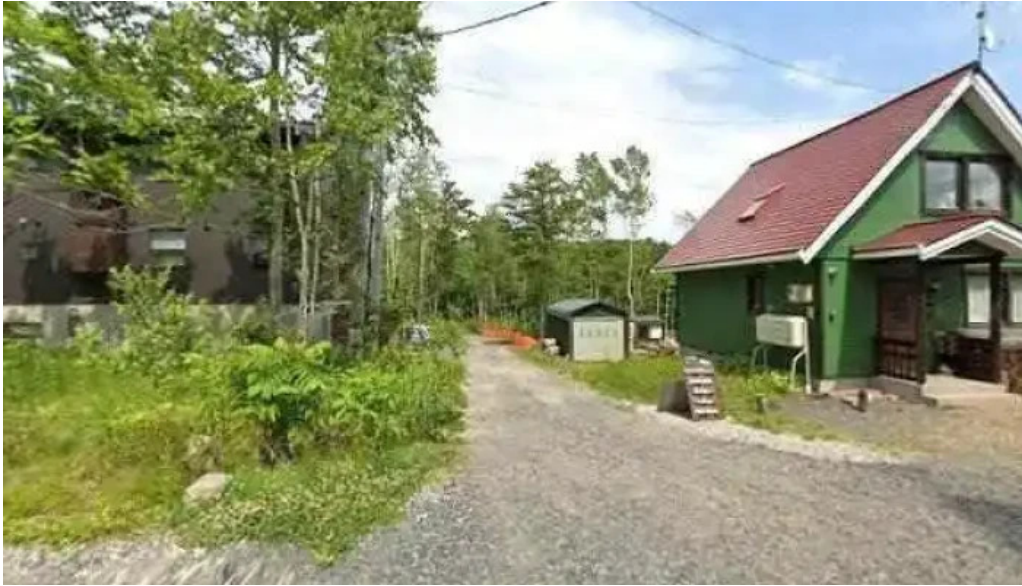
ニセコ山麓パーラー ニセコ町