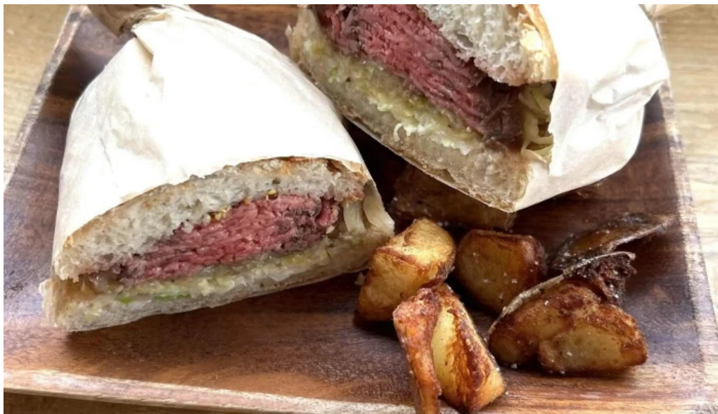
ニセコ山麓パーラー どこ