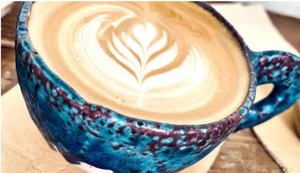
ニセコ山麓パーラー 割引