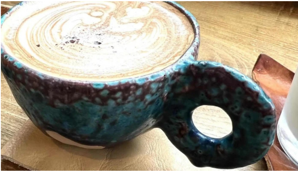
ニセコ山麓パーラー 営業時間