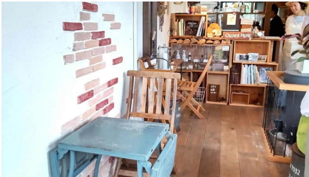
ニセコ山麓パーラー 雰囲気