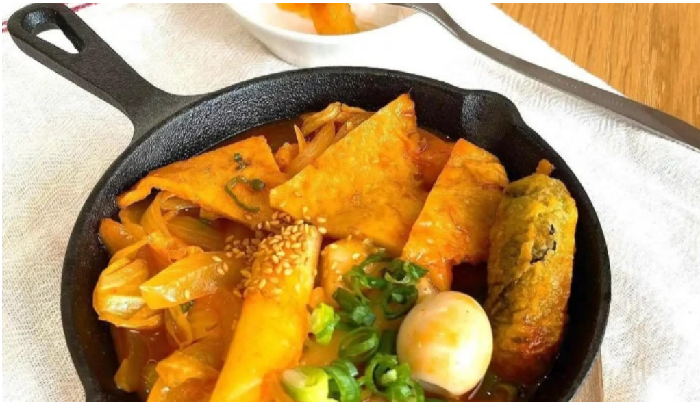
カフェジップ cafe zeeb オーナー提供