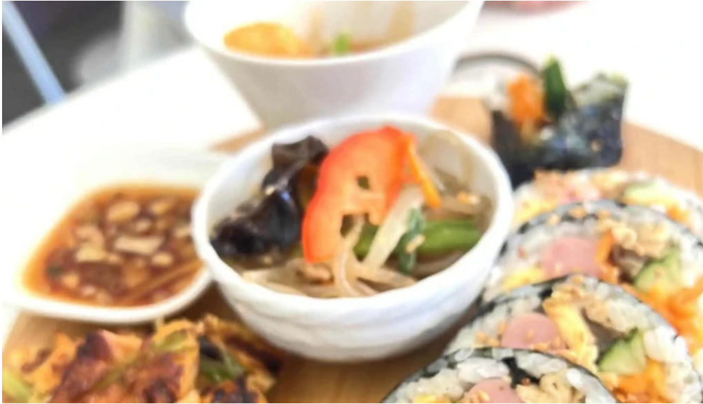
カフェジップ cafe zeeb instagram