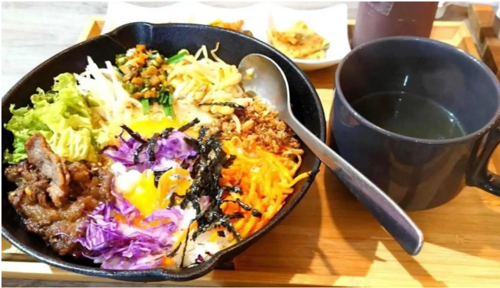
カフェジップ cafe zeeb 最新