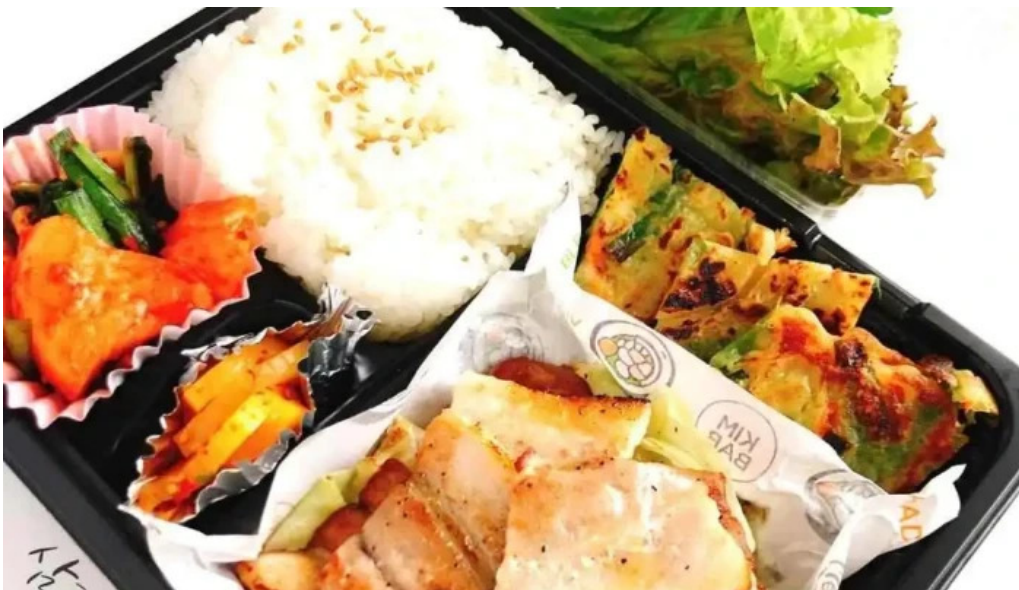
カフェジップ cafe zeeb 料理飲み物