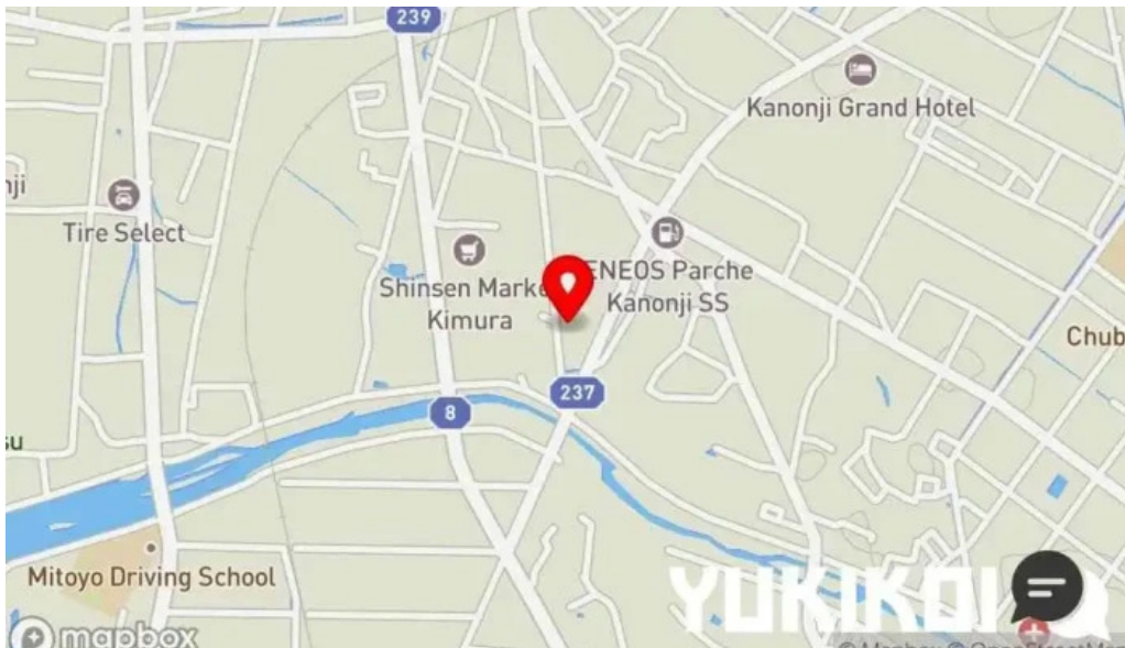
カフェジップ cafe zeeb 地図