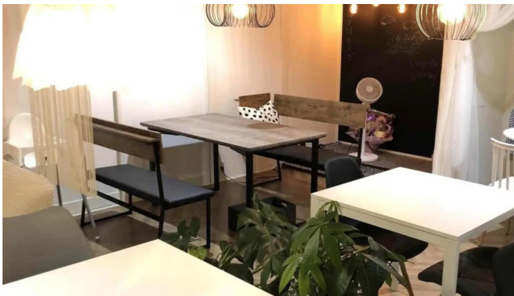
カフェジップ cafe zeeb 雰囲気