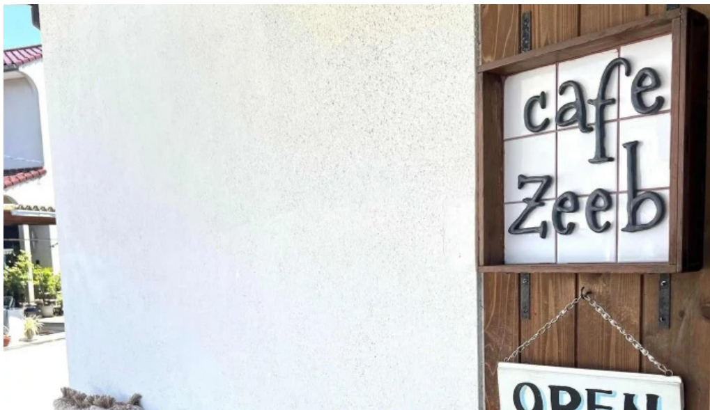
カフェジップ cafe zeeb 写真