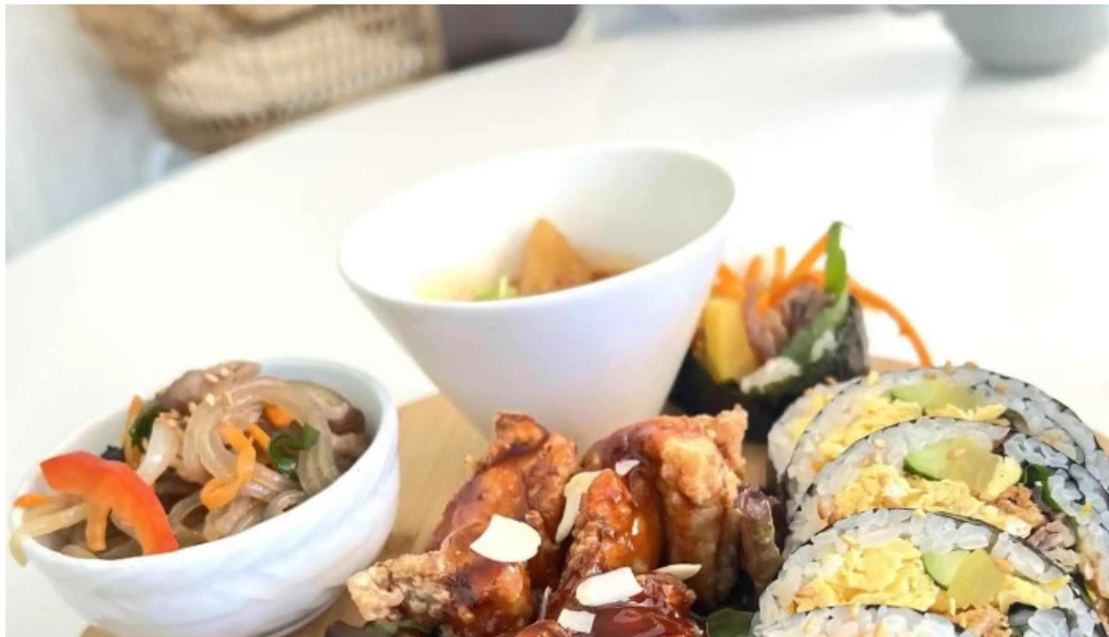
カフェジップ cafe zeeb 住所