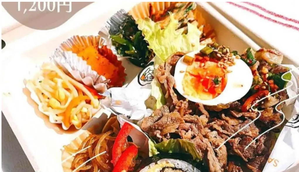
カフェジップ cafe zeeb ビビンバ