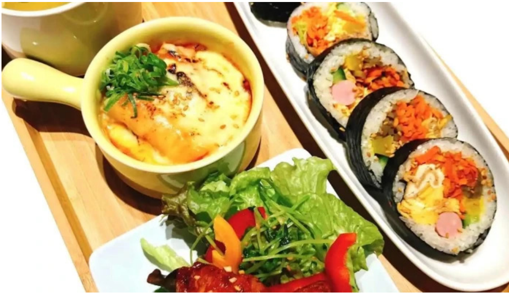
カフェジップ cafe zeeb 寿司