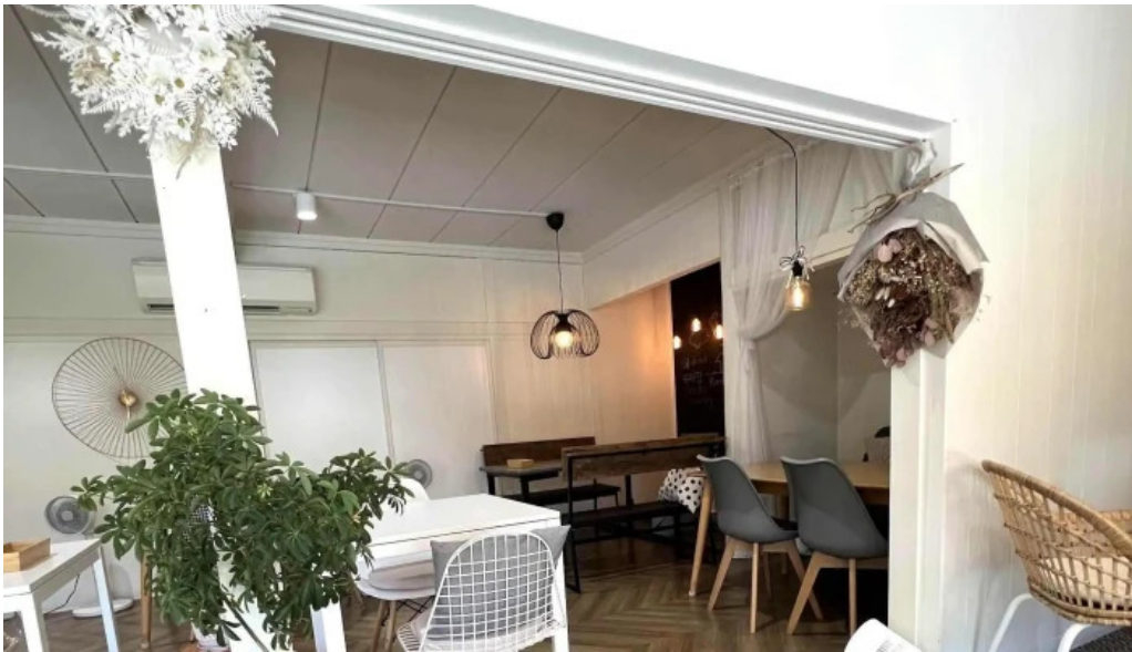
カフェジップ cafe zeeb エリア