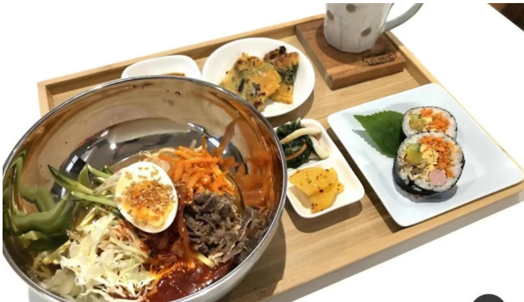
カフェジップ cafe zeeb コーヒー