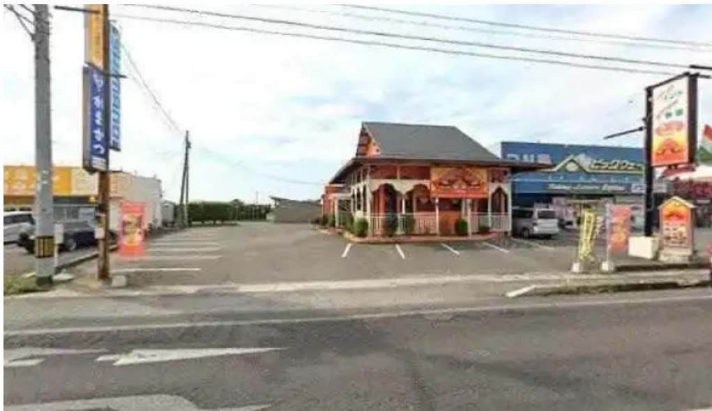
スピマハル 観音寺市