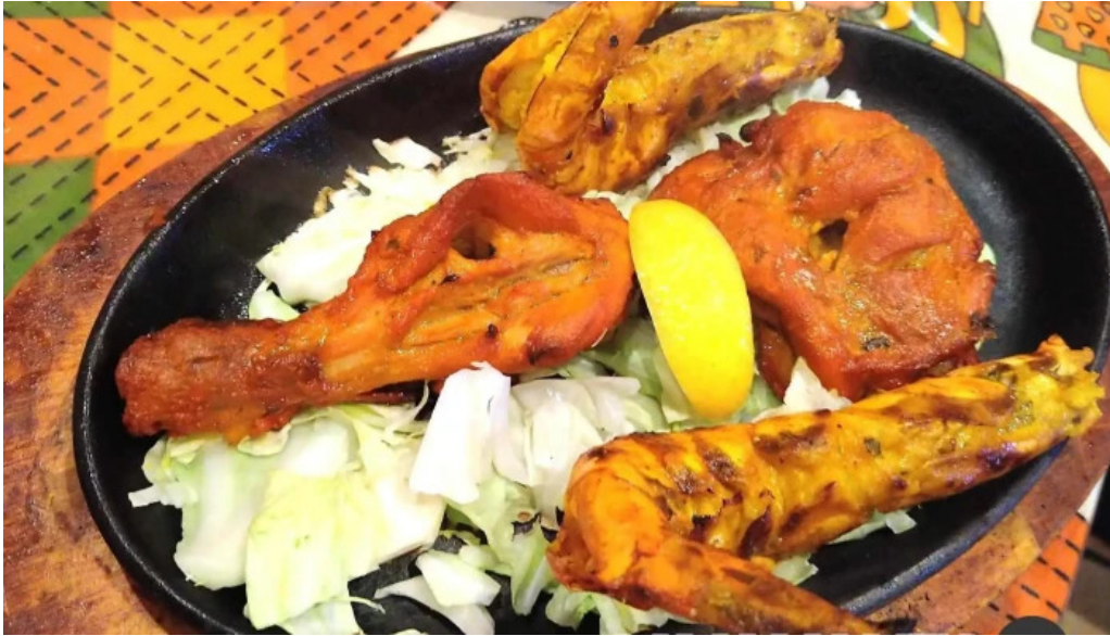
スビマハル タンドリーチキン