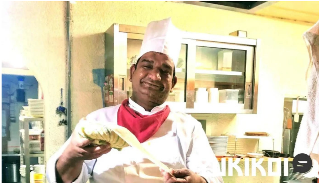
スビマハル オーナー提供