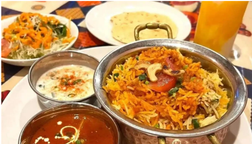
スピマハルビリヤニ