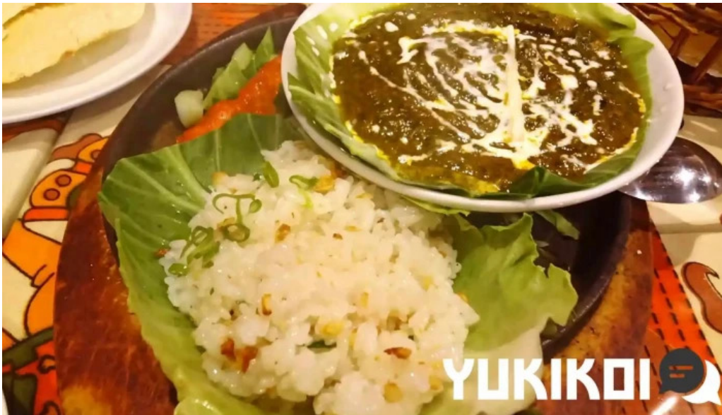
スビマハル カレー