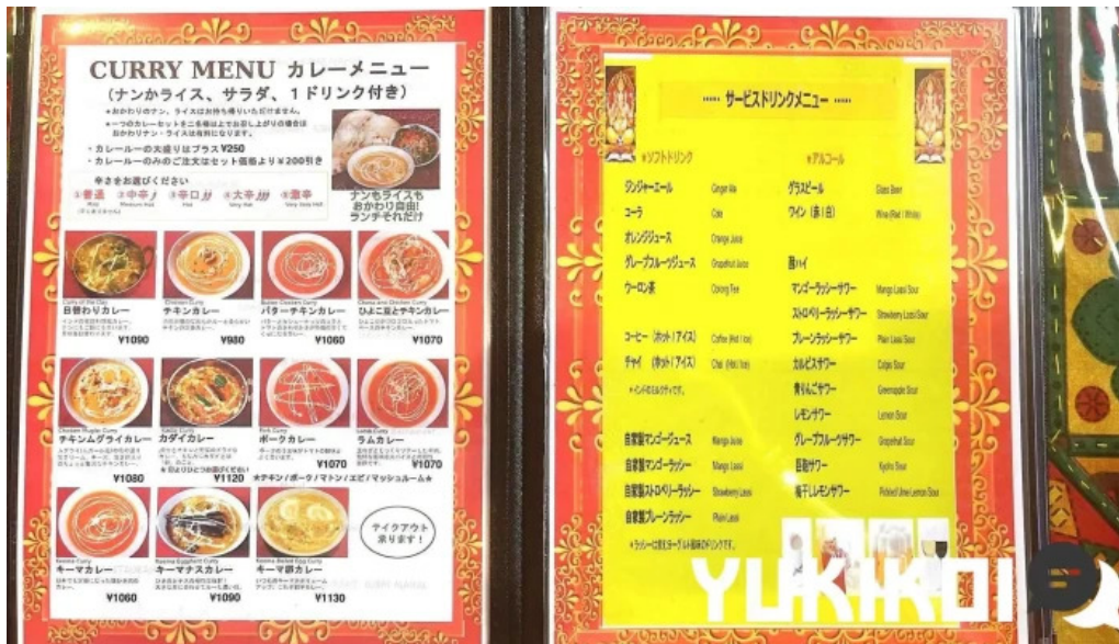
スピマハルメニュー