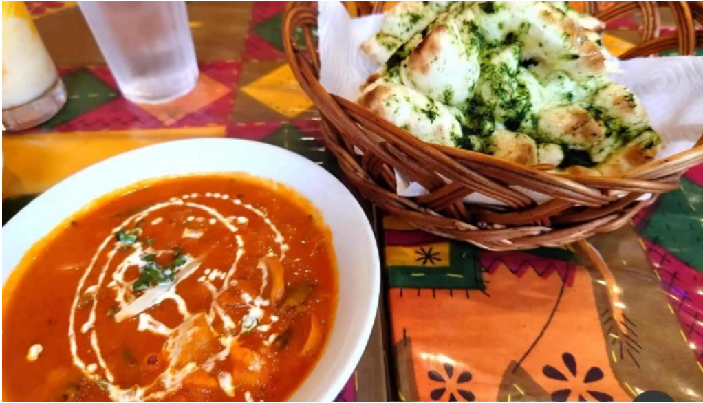
スビマハル バターチキンカレー