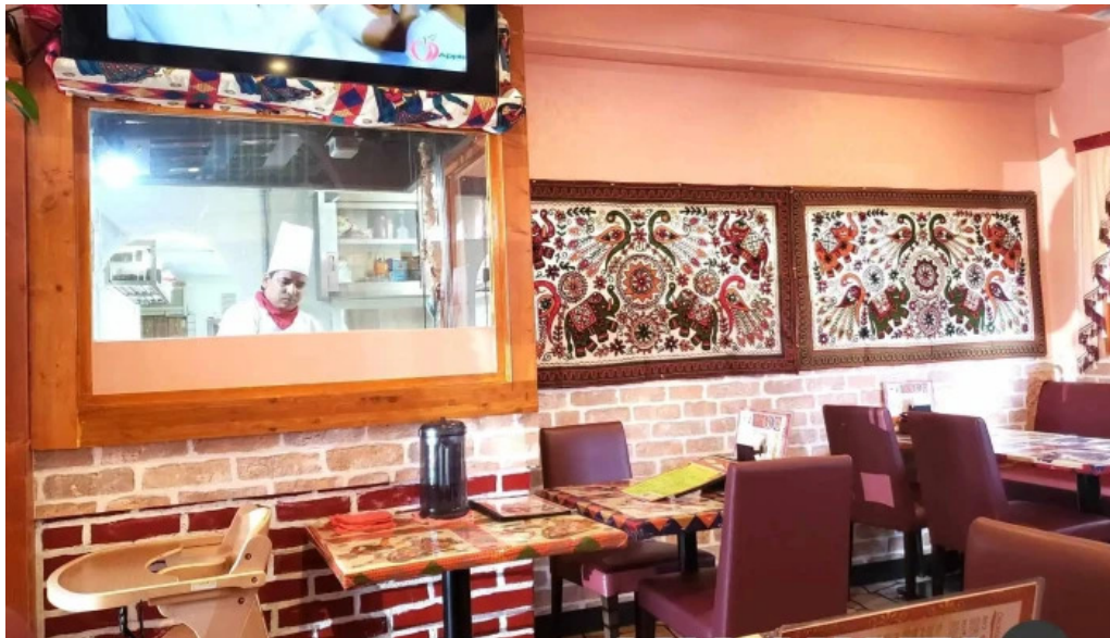
スピマハル 霧田気