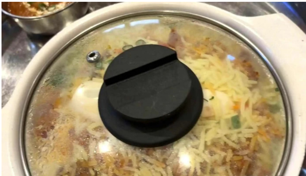
スビマハル エリア