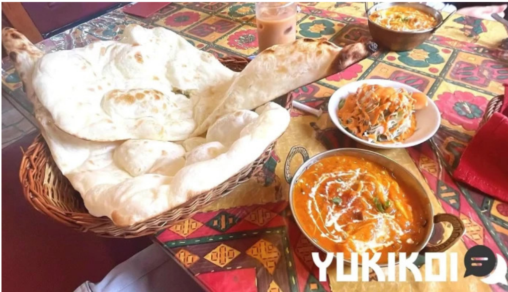
スビマハル 料理飲み物