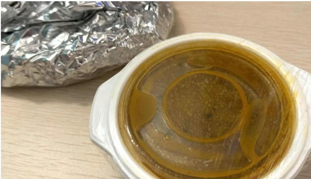
ナマステカレー comentario 2