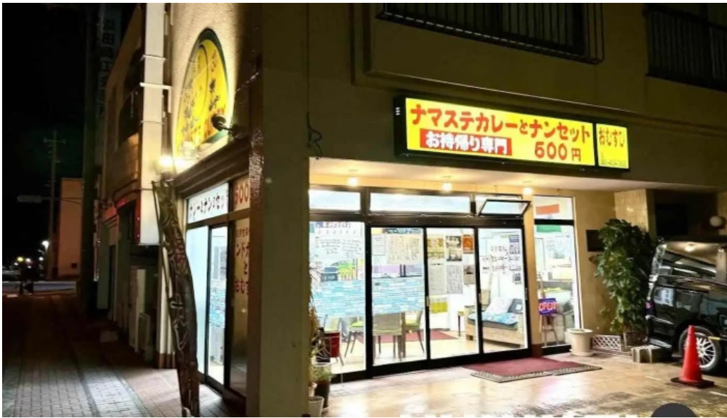
ナマステカレー 浜田市