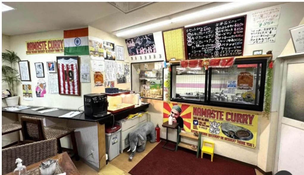
ナマステカレー 雰囲気