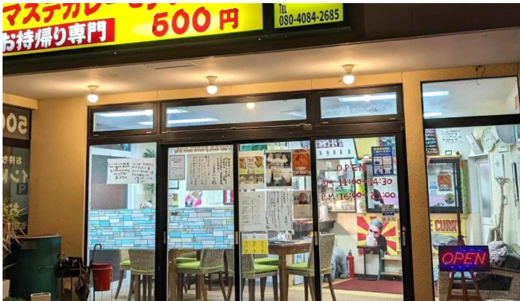
ナマステカレー comentario 7