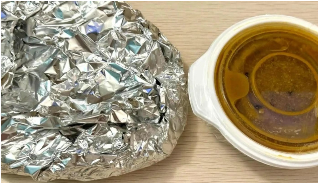
ナマステカレー comentario 3