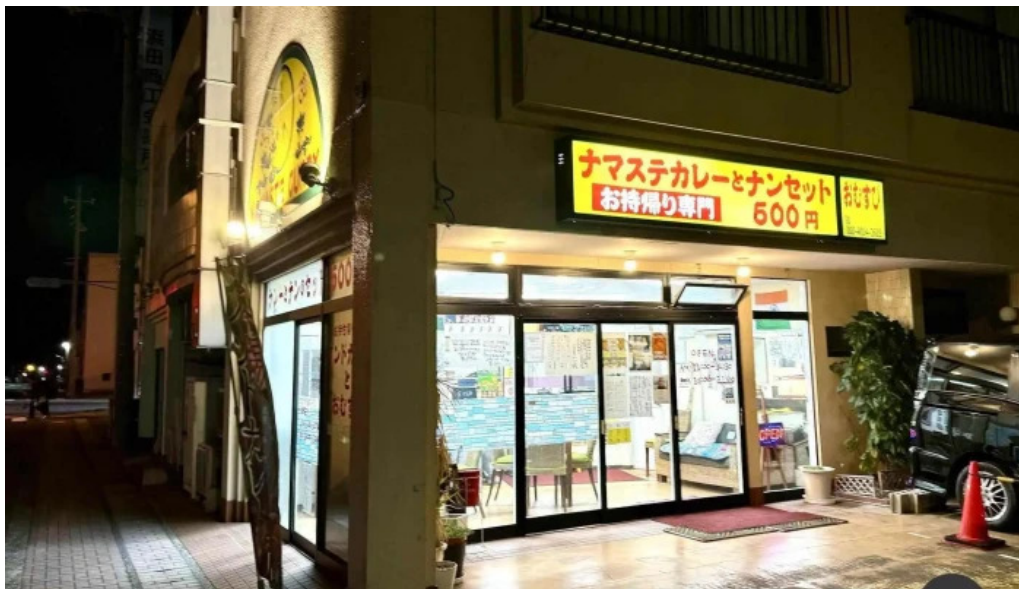
ナマステカレー すべて