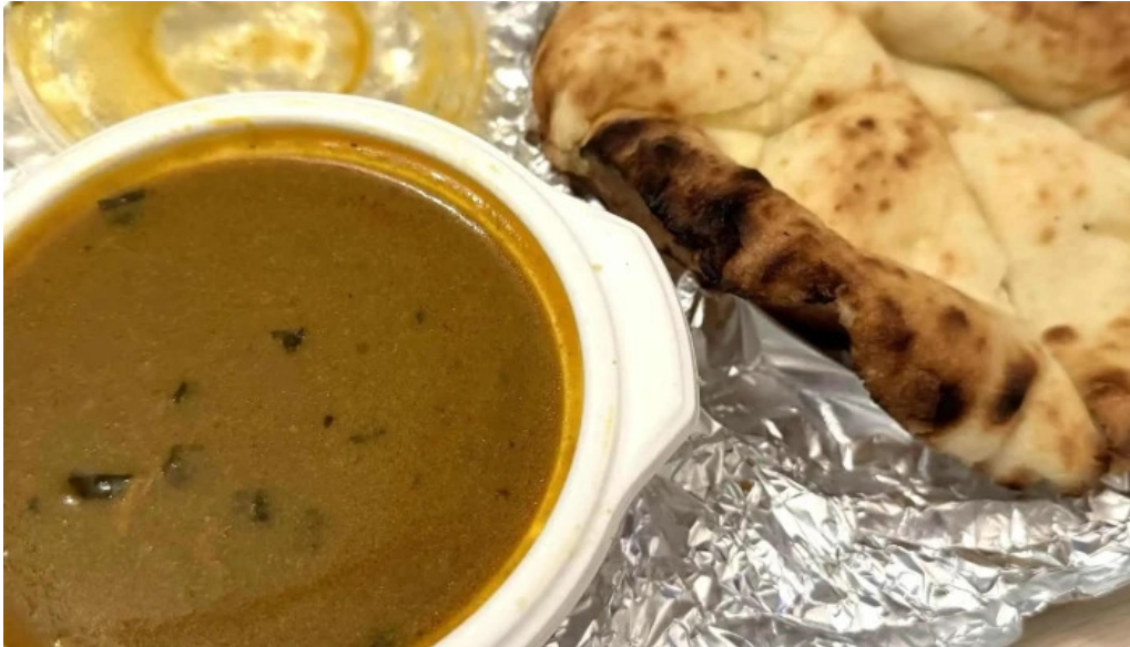
ナマステカレー comentario 1