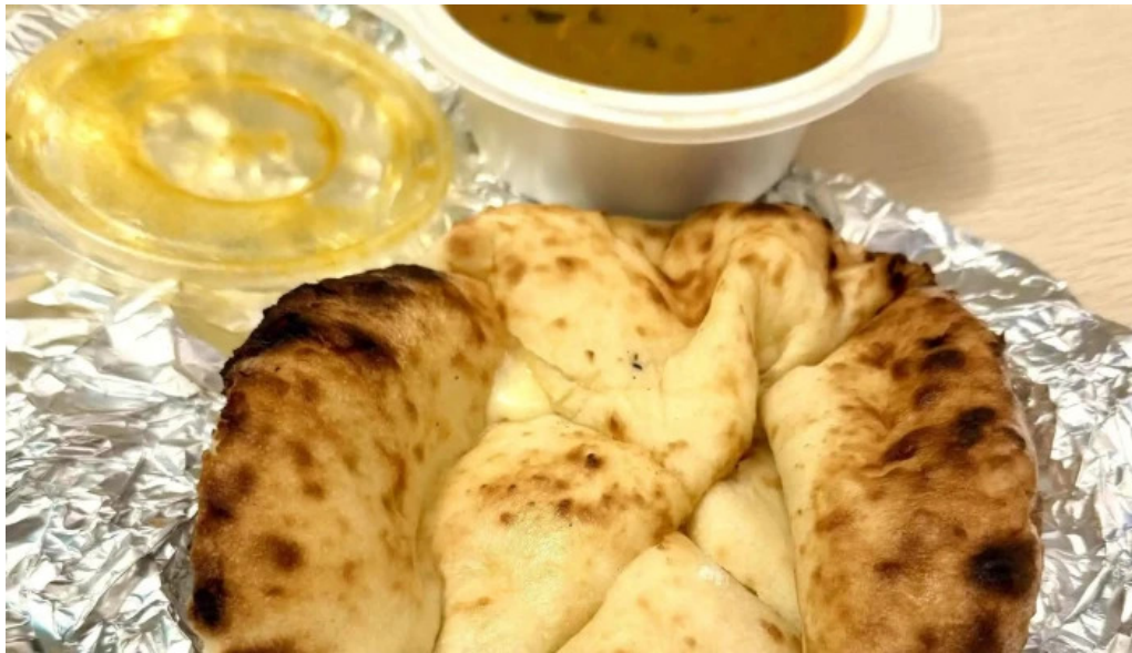
ナマステカレー comentario 4