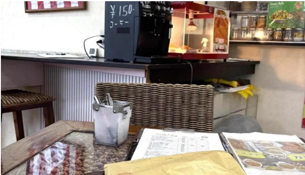
ナマステカレー 最新