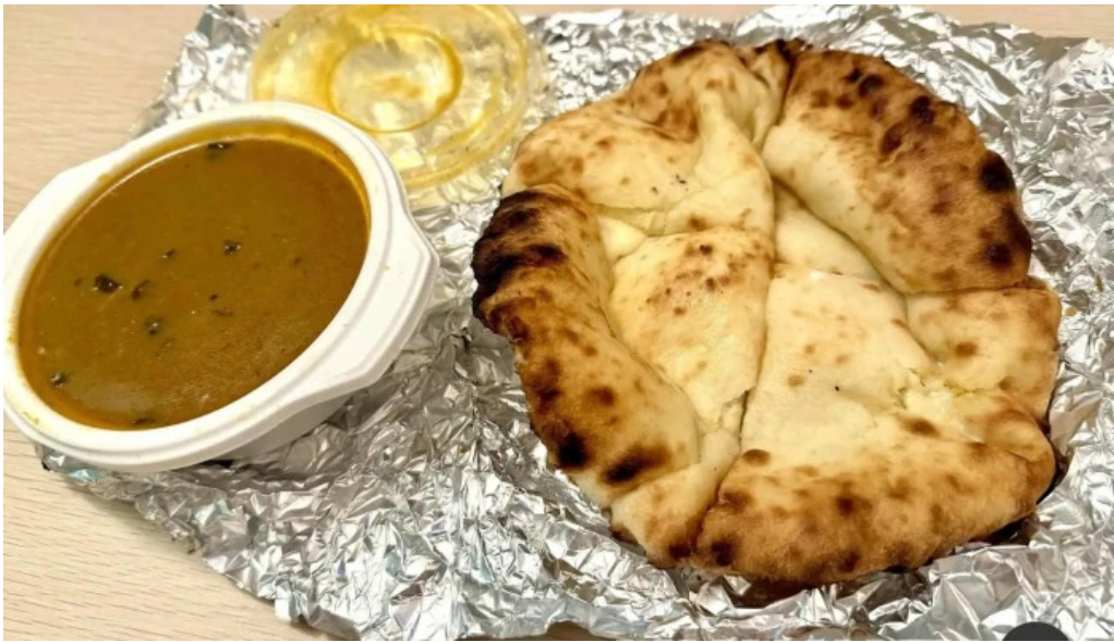
ナマステカレー ナン