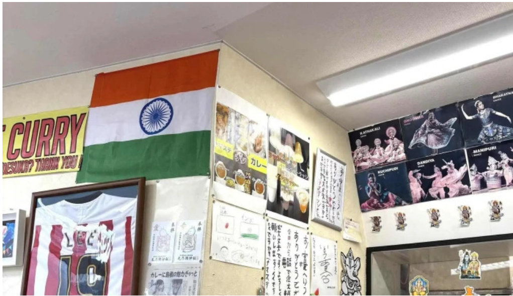
ナマステカレー comentario 5