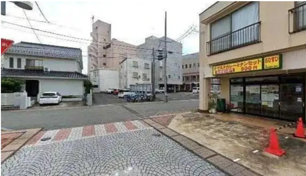
ナマステカレー ストリートビューと 360 ビュー