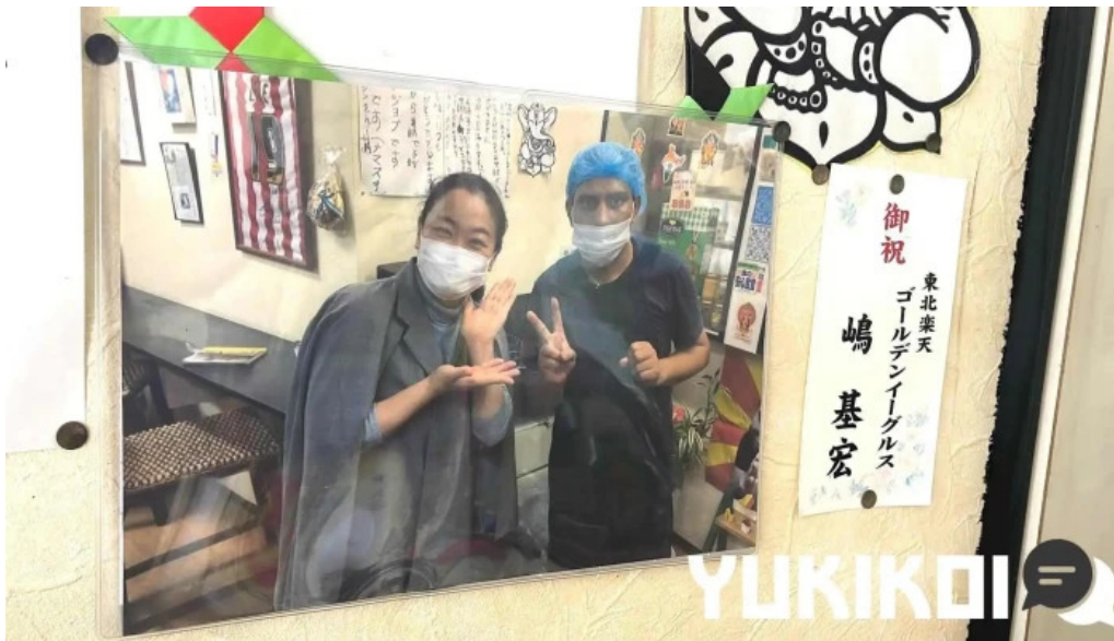
ナマステカレー