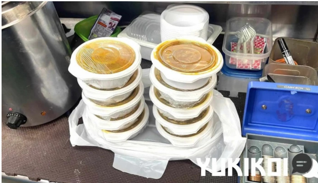
ナマステカレー 料理飲み物