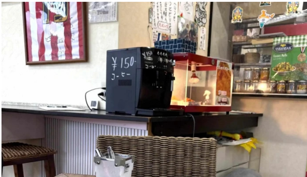
ナマステカレー comentario 6