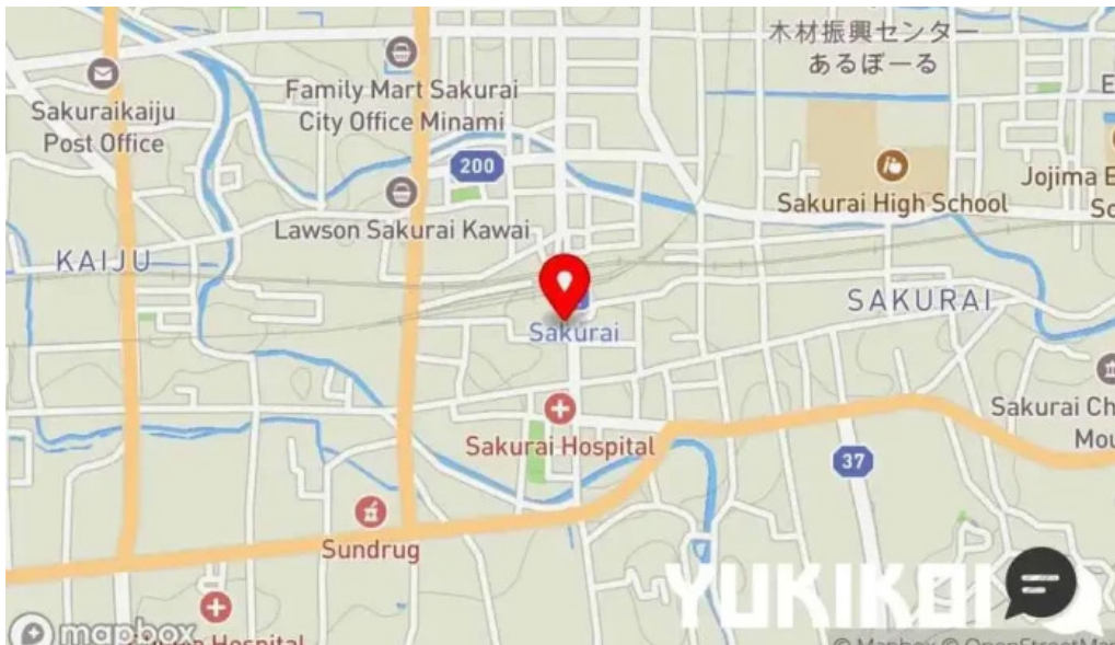
インド料理 yummy 地図