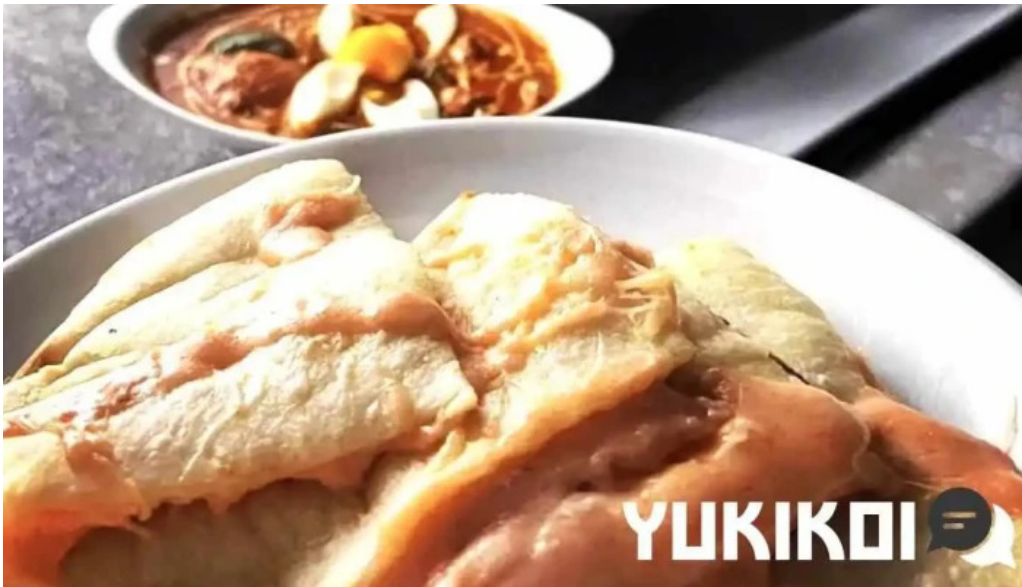
インド料理 yummy 料理飲み物