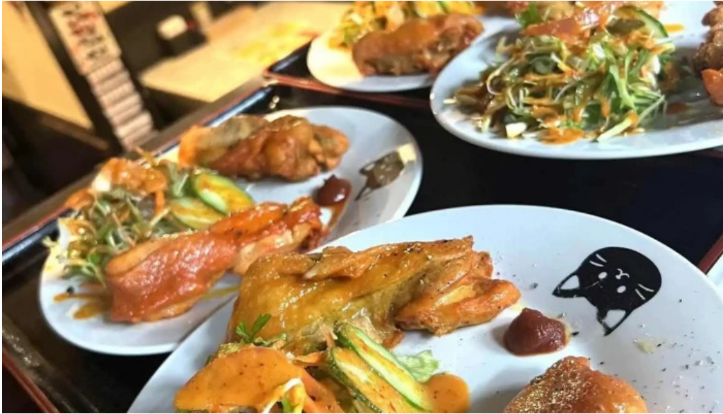
インド料理 yummy 最新