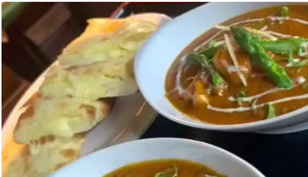
インド料理 yummy 動画