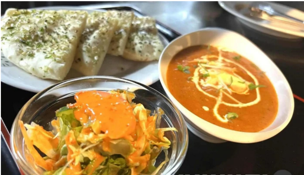
インド料理 yummy ナン