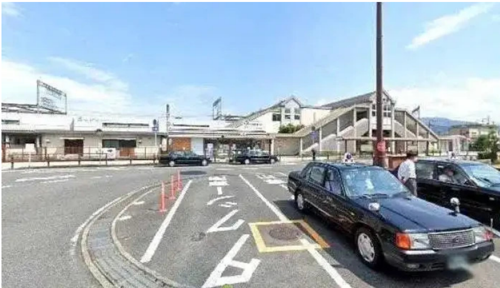
インド料理 yummy 桜井市