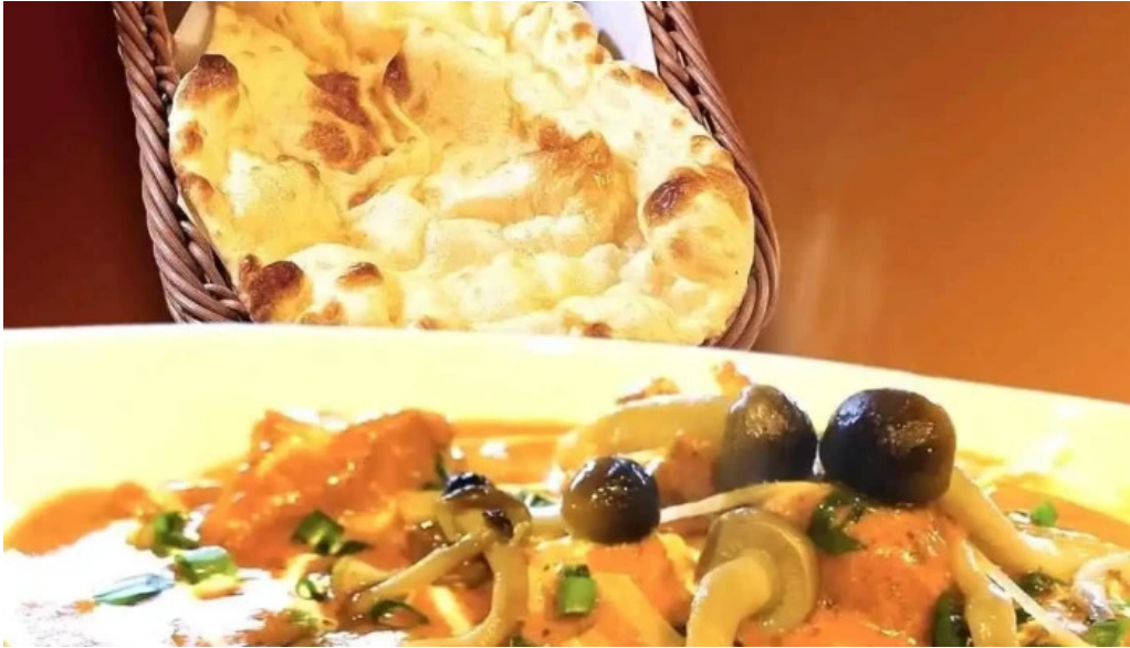
インド料理 yummy カレー