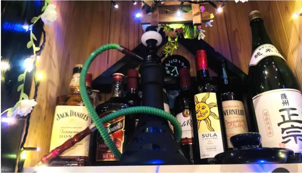
インド料理 yummy 霧田気