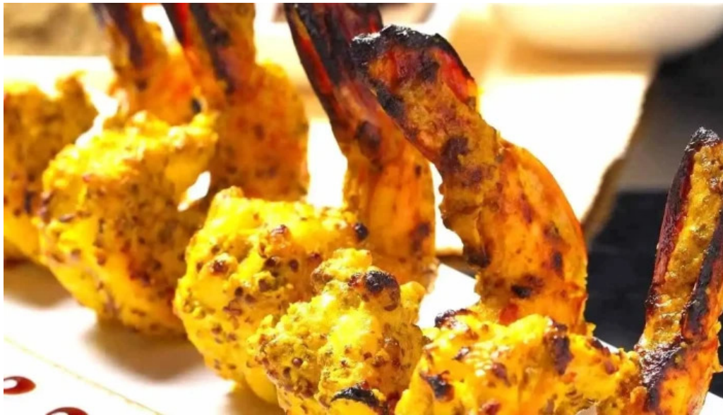
インド料理 yummy タンドリーチキン