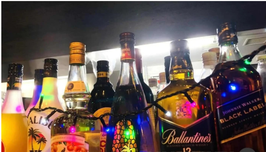
インド料理 yummy テキーラ