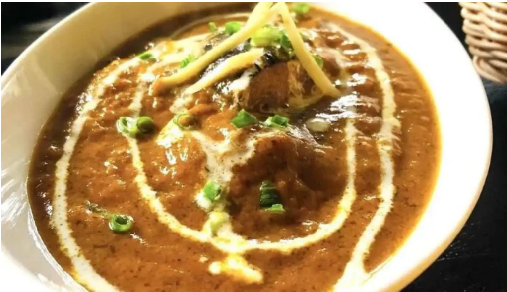
インド料理 yummy バターチキンカレー