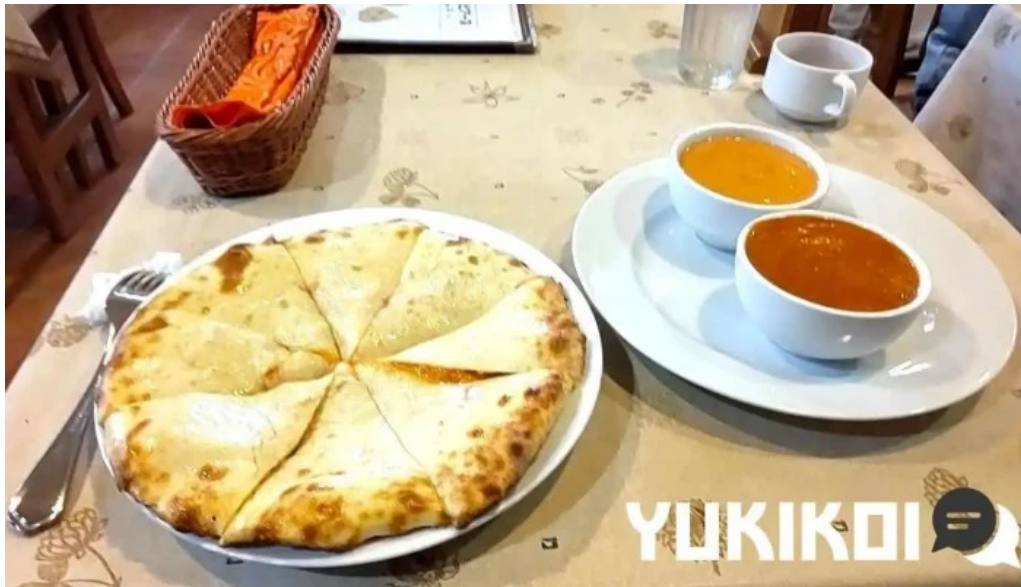
ピアーズ 東村山店 最新