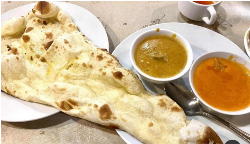
ピアーズ 東村山店 カレー