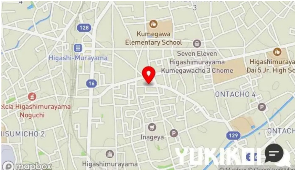
ピアーズ 東村山店 地図