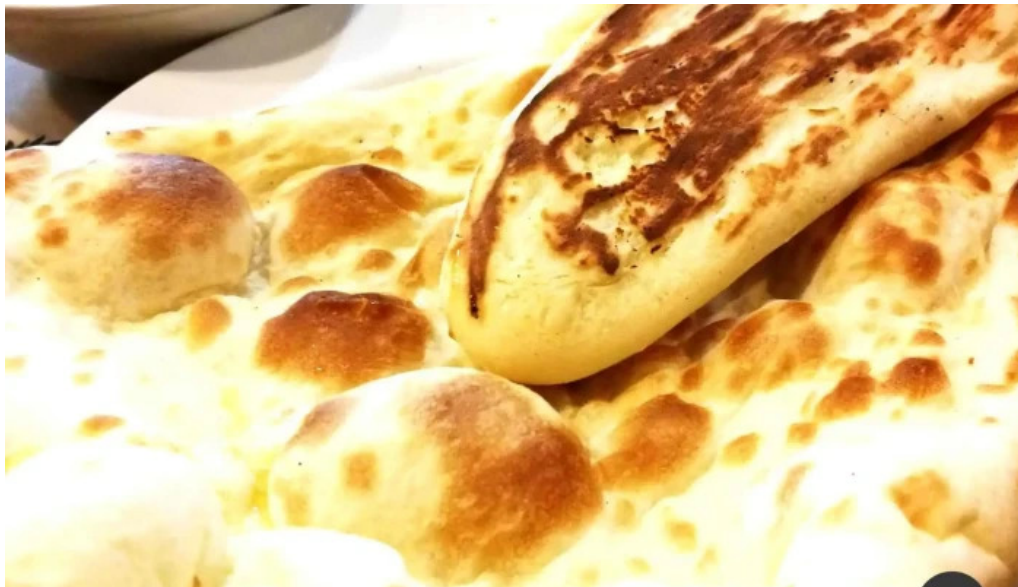
ピアーズ 東村山店 ナン