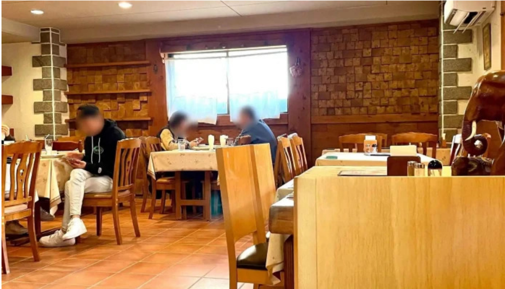
ピアーズ 東村山店 ウェブサイト