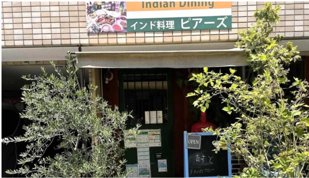
ピアーズ 東村山店 行き方