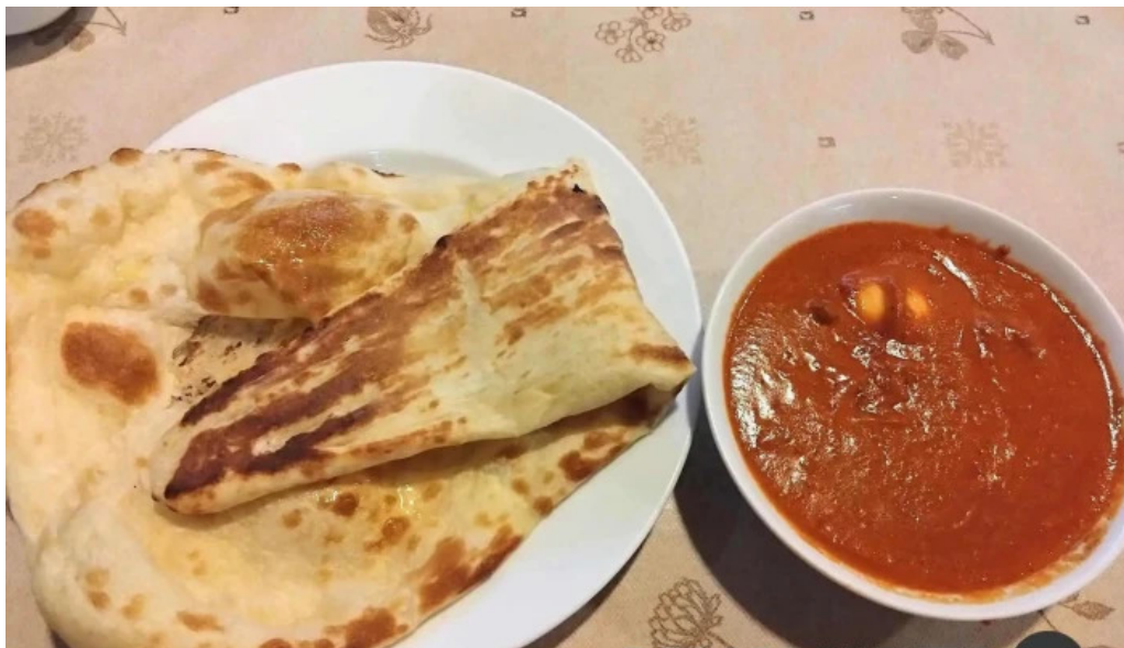
ピアーズ 東村山店 料理飲み物