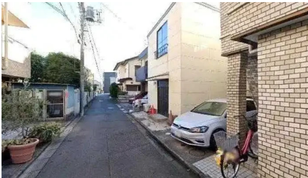
ピアーズ 東村山店 東村山市