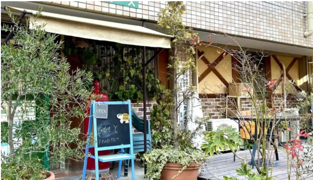
ピアース 東村山店 住所