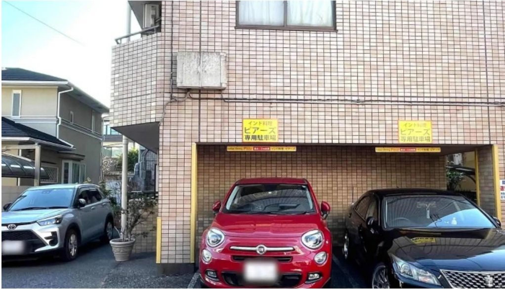
ピアース 東村山店 割引