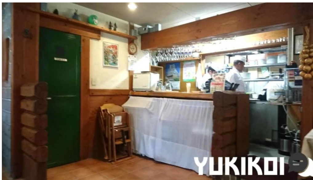
ピアーズ 東村山店 雰囲気