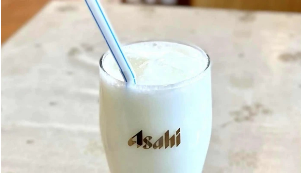
ピアーズ 東村山店 コメント