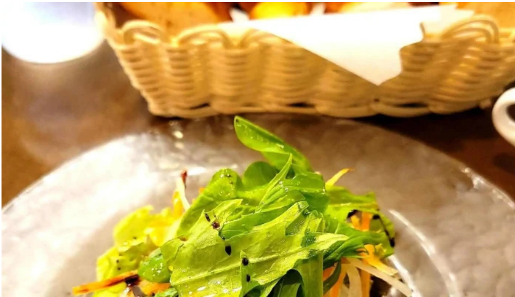
イタリアン手造りパン工房 ボンジョルノ comentario 6