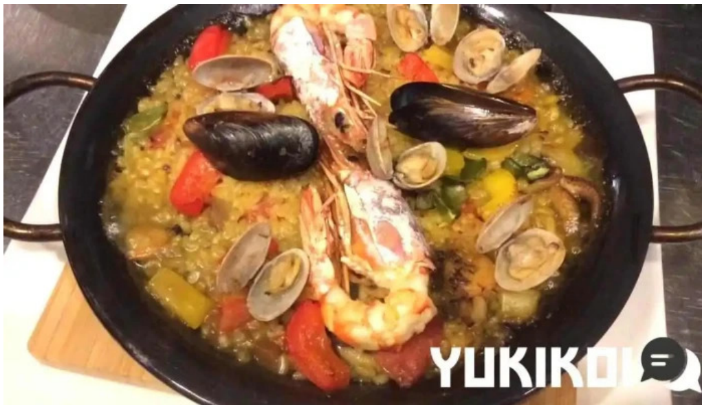
イタリアン手造りパン工房 ボンジョルノ 動画