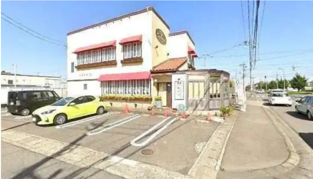
イタリアン手造りパン工房 ボンジョルノ ストリートビューと 360 ビュー