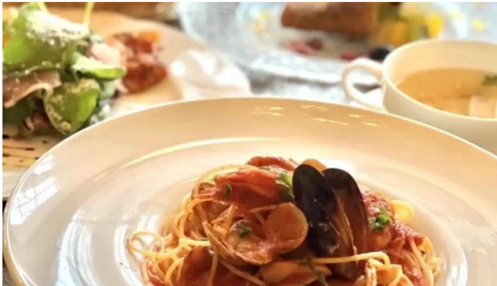
イタリアン手造りパン工房 ボンジョルノ スパゲッティ