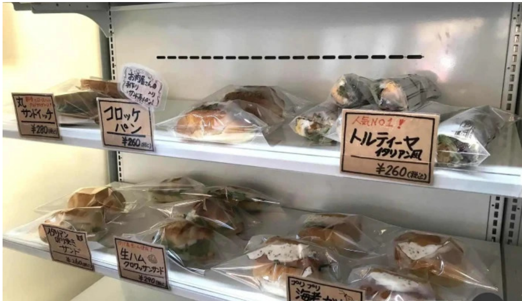
イタリアン手造りパン工房 ボンジョルノ 霧岡気