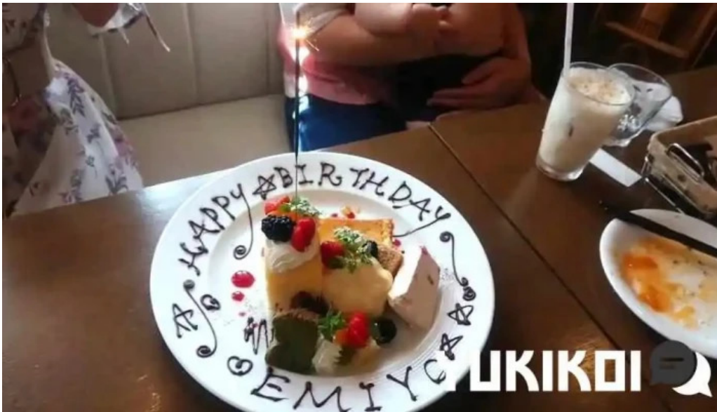
イタリアン手造りパン工房 ボンジョルノ オーナー提供