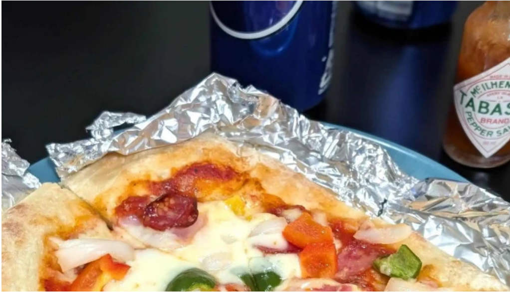
イタリアン手造りパン工房 ボンジョルノ comentario 3