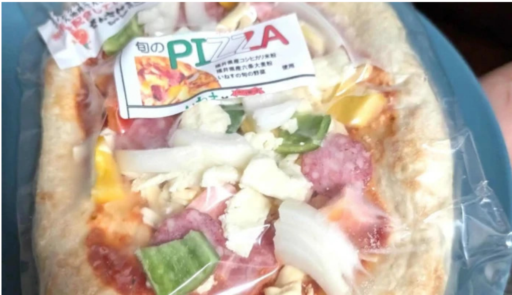
イタリアン手造りパン工房 ボンジョルノ comentario 2