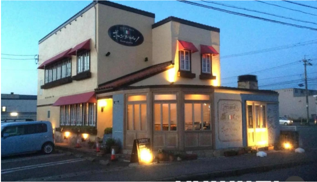
イタリアン手造りパン工房 ボンジョルノ すべて