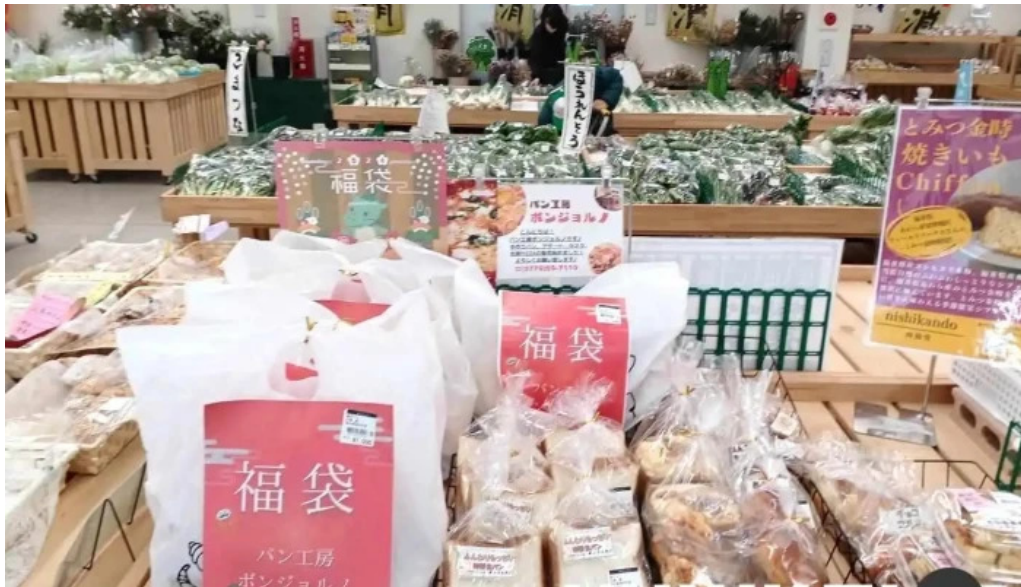
イタリアン手造りパン工房 ボンジョルノ 料理飲み物