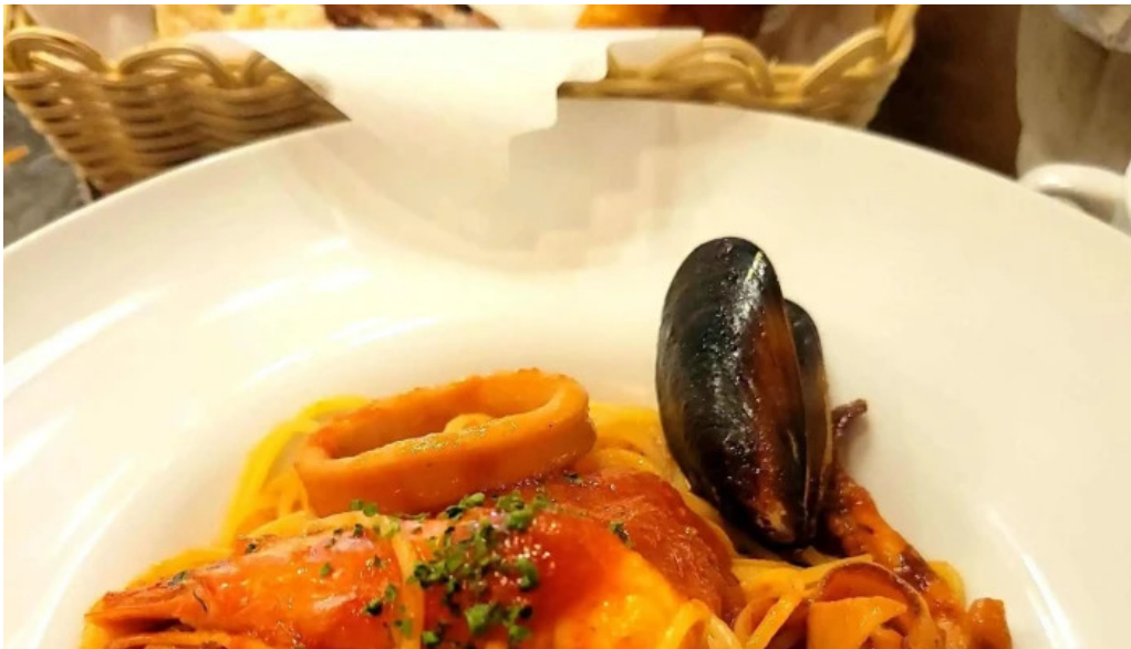
イタリアン手造りパン工房 ボンジョルノ comentario 4