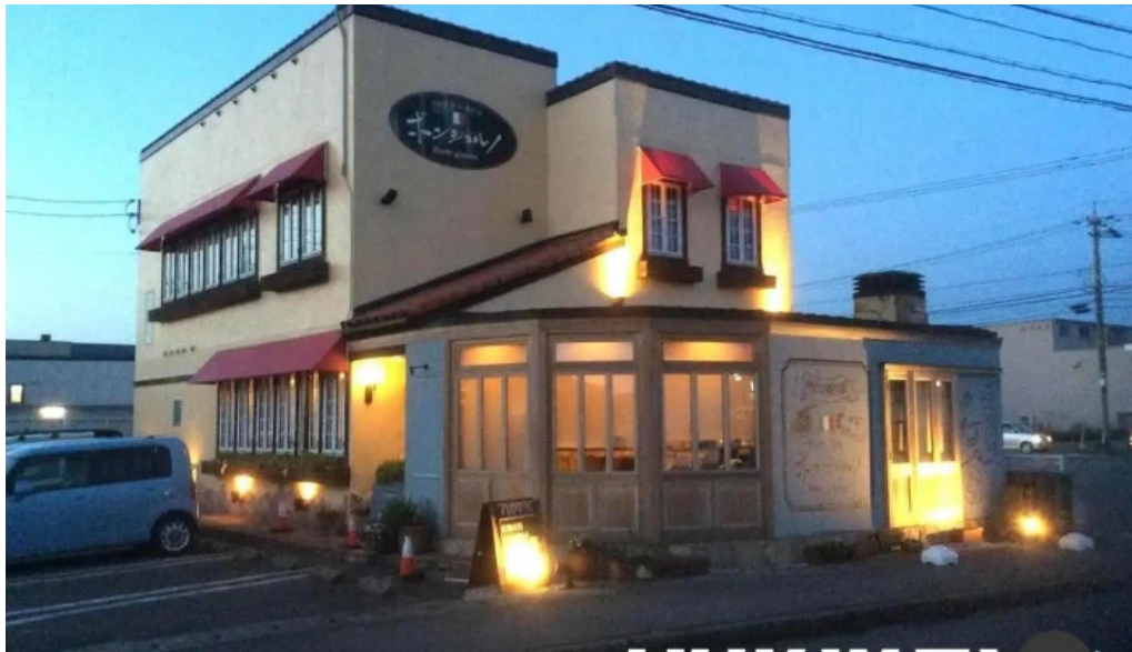
イタリアン手造りパン工房 ボンジョルノ 福井市