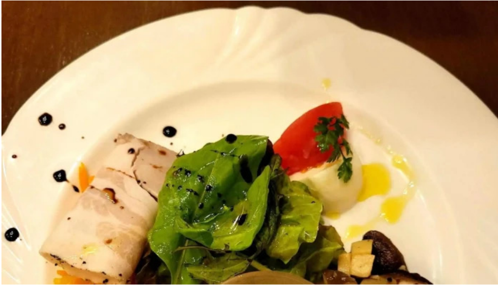
イタリアン手造りパン工房 ボンジョルノ comentario 5