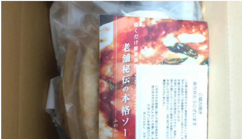
イタリアン手造りパン工房 ボンジョルノ comentario 1