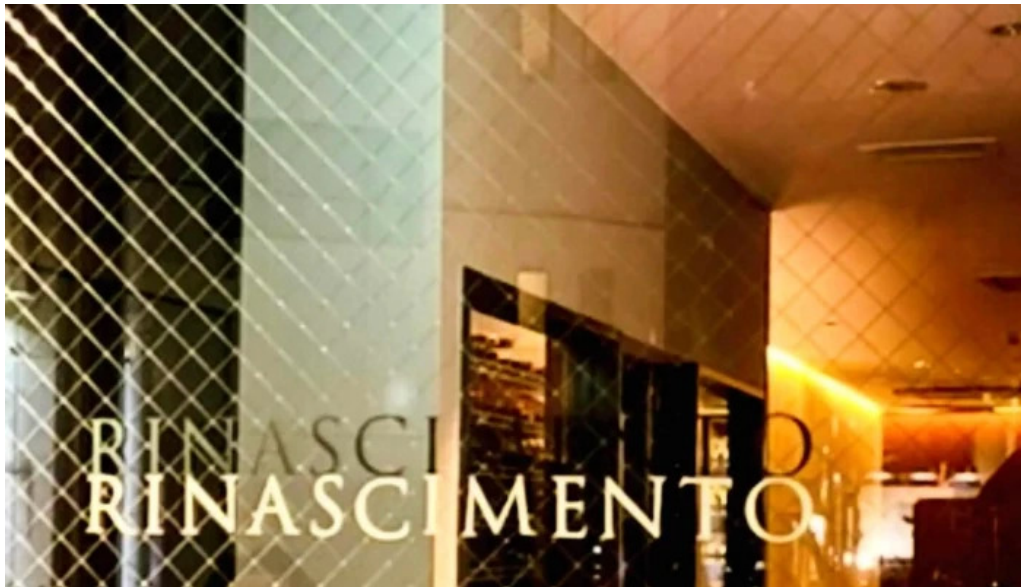
リナシメント 近く