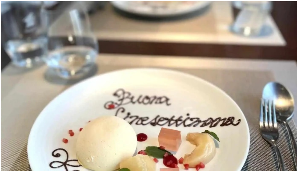
リナシメント パンナコッタ