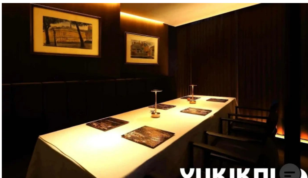
リナシメント 雰囲気