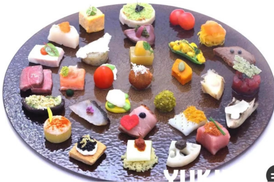
リナシメント オーナー提供