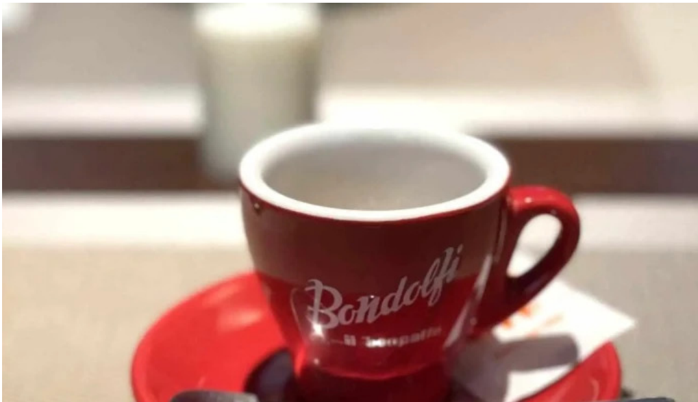
リナシメント エスプレッソ