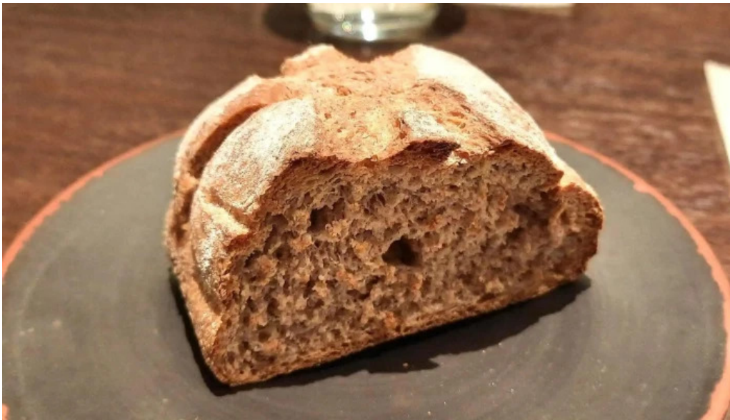
リナシメント サワードウ