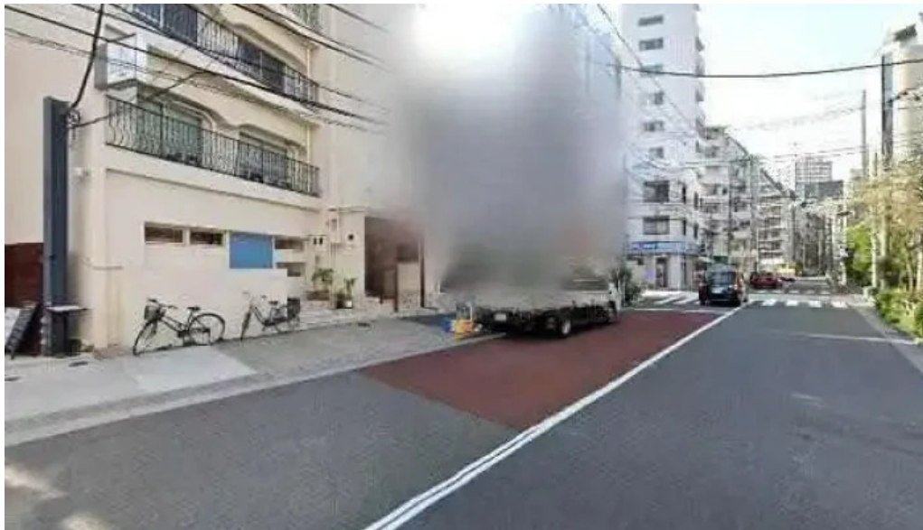
リナシメント 目黒区