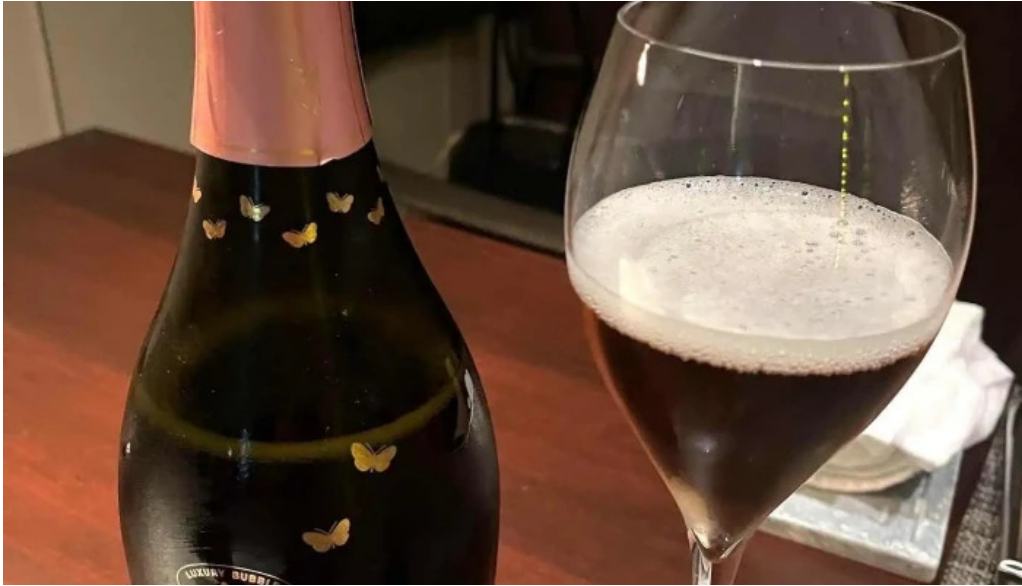
リナシメント ワイン