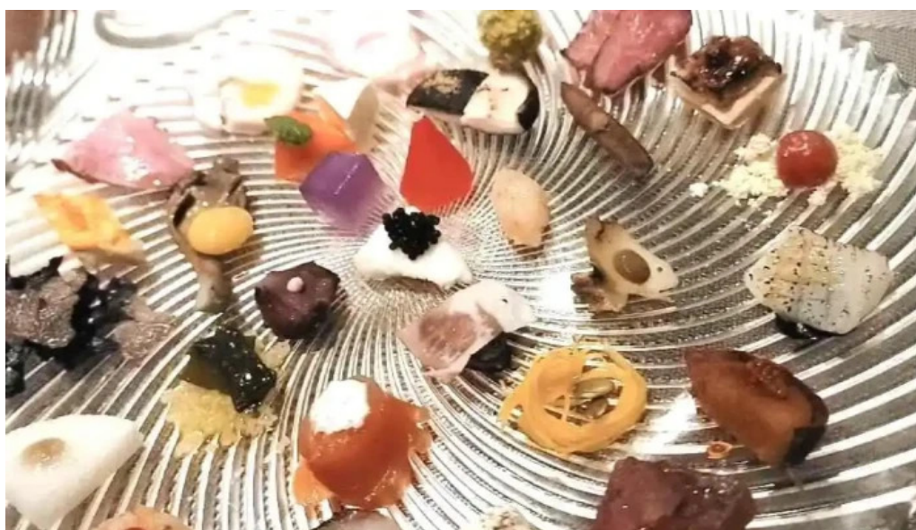
リナシメント 動画