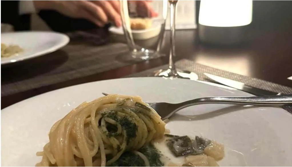
リナシメント スパゲッティ