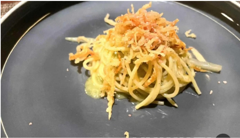
リナシメント ボッタルガ