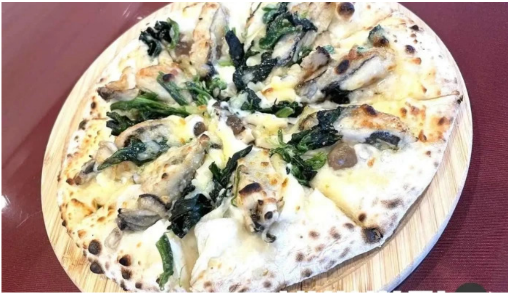
イタリアンキッチン 菜の華 ピザ