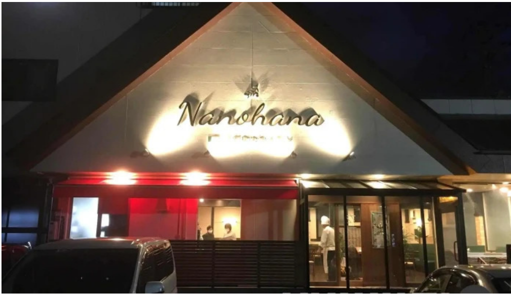
イタリアンキッチン 菜の華 すべて