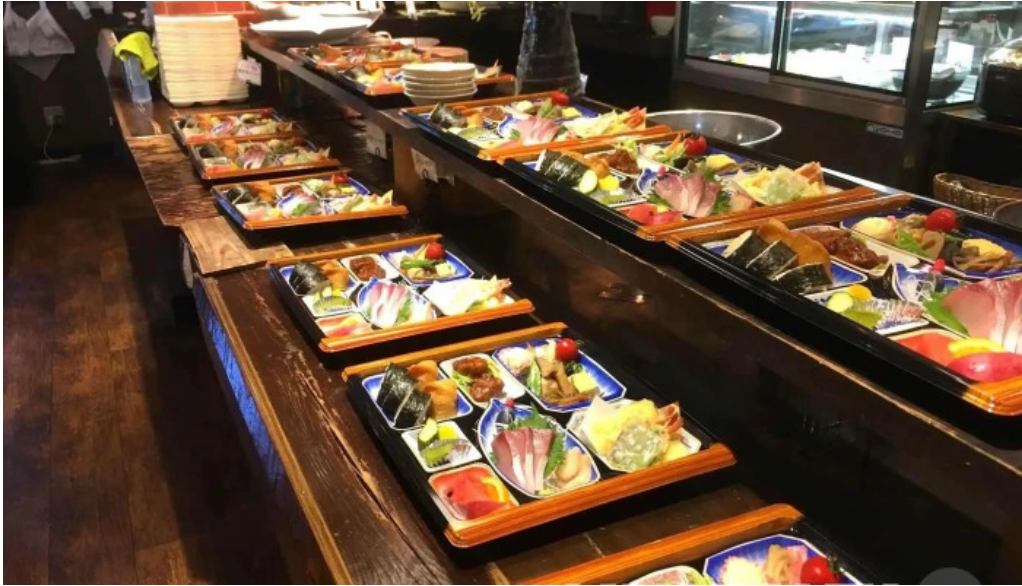
イタリアンキッチン 菜の華 霧田気