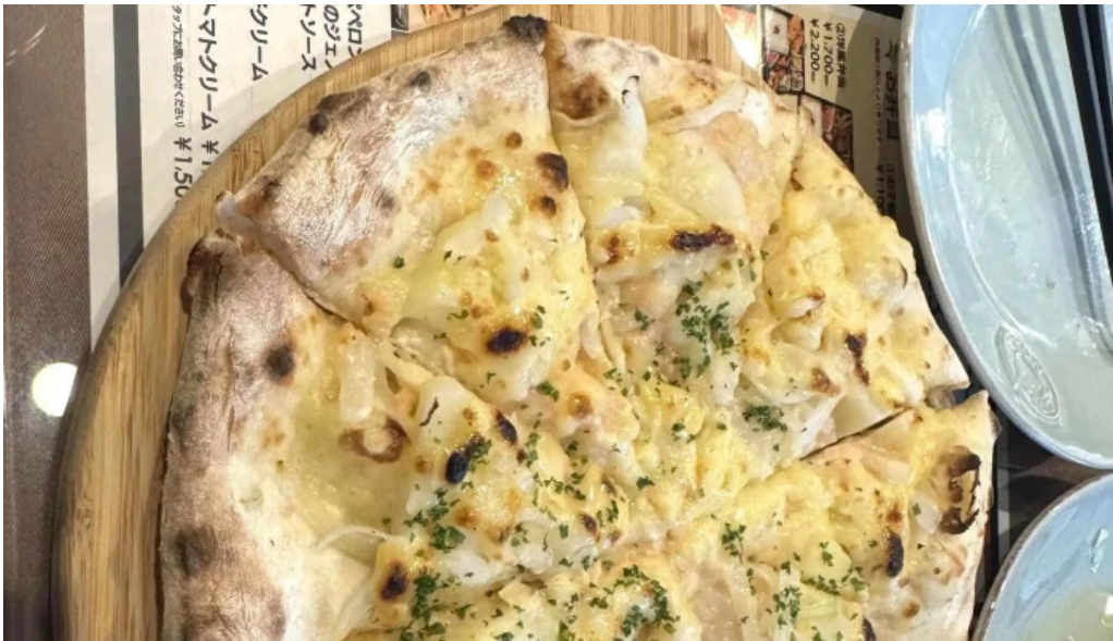
イタリアンキッチン 菜の華 comentario 3