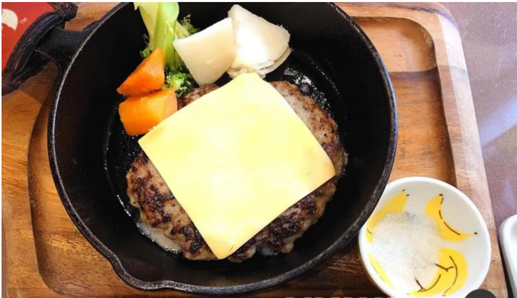
イタリアンキッチン 菜の華 ソールズベリーステーキ