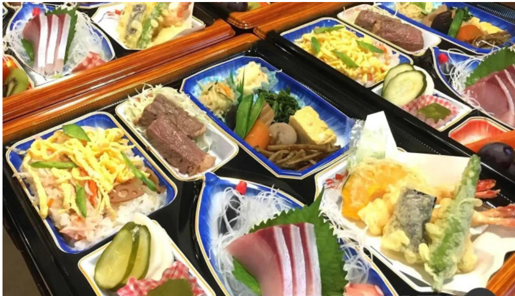
イタリアンキッチン 菜の華 弁当