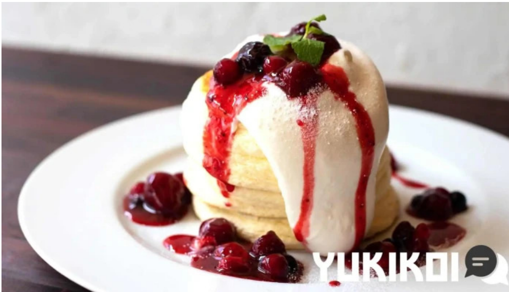
イタリアンキッチン 菜の華 料理飲み物