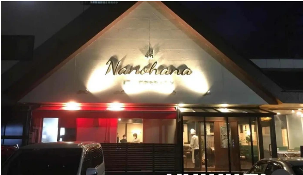
イタリアンキッチン 菜の華 浜田市