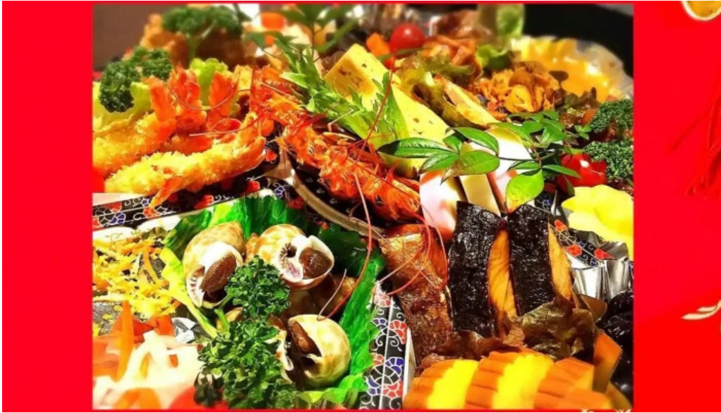
イタリアンキッチン 菜の華 最新