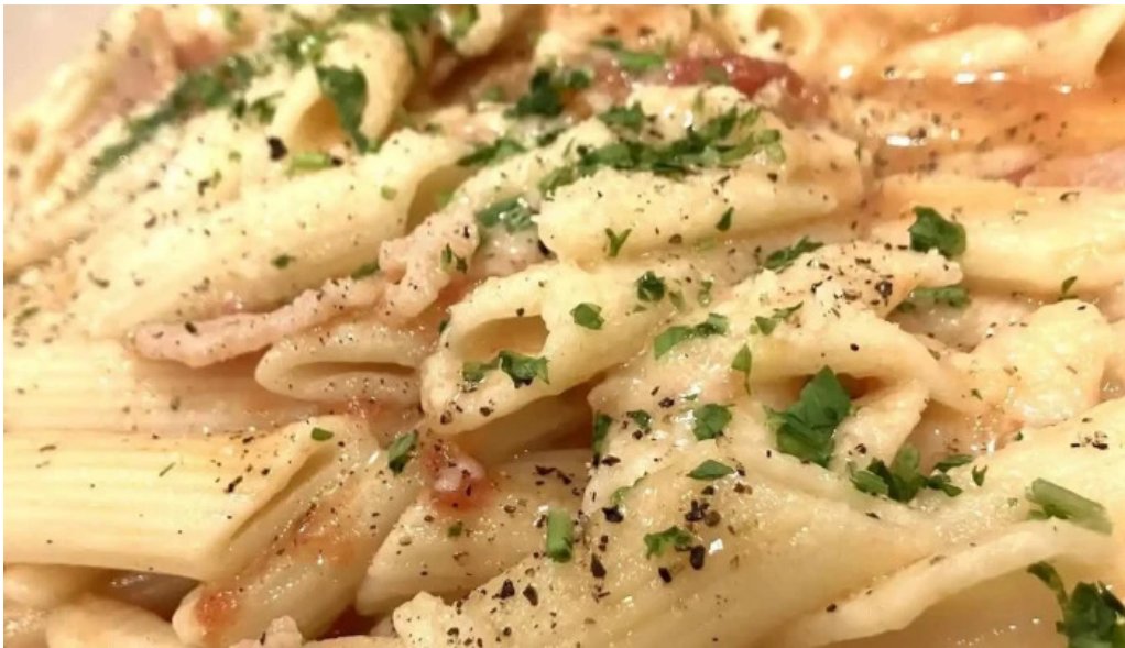
イタリアンキッチン 菜の華 オーナー提供