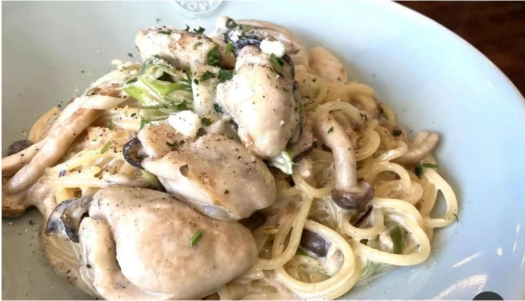
イタリアンキッチン 菜の華 スパゲッティ