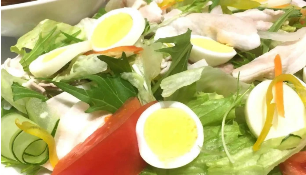
イタリアンキッチン 菜の華 サラダ