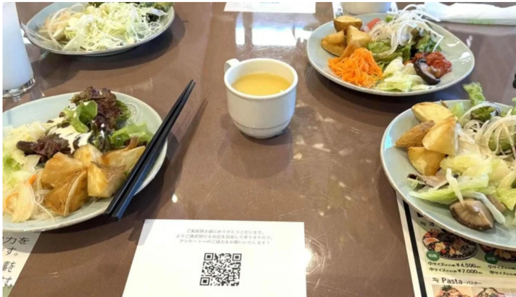
イタリアンキッチン 菜の華 comentario 2