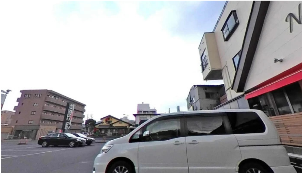
イタリアンキッチン 菜の華 ストリートビューと 360 ビュー