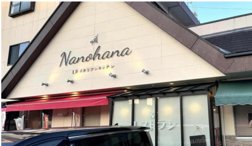
イタリアンキッチン 菜の華 comentario 1