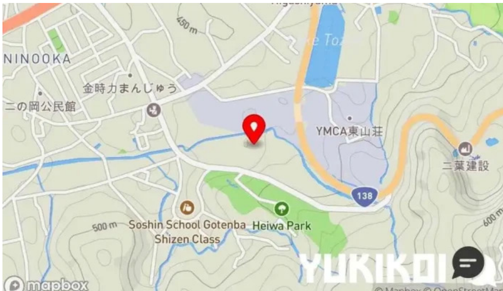
レストランテ 桜鏡 地図