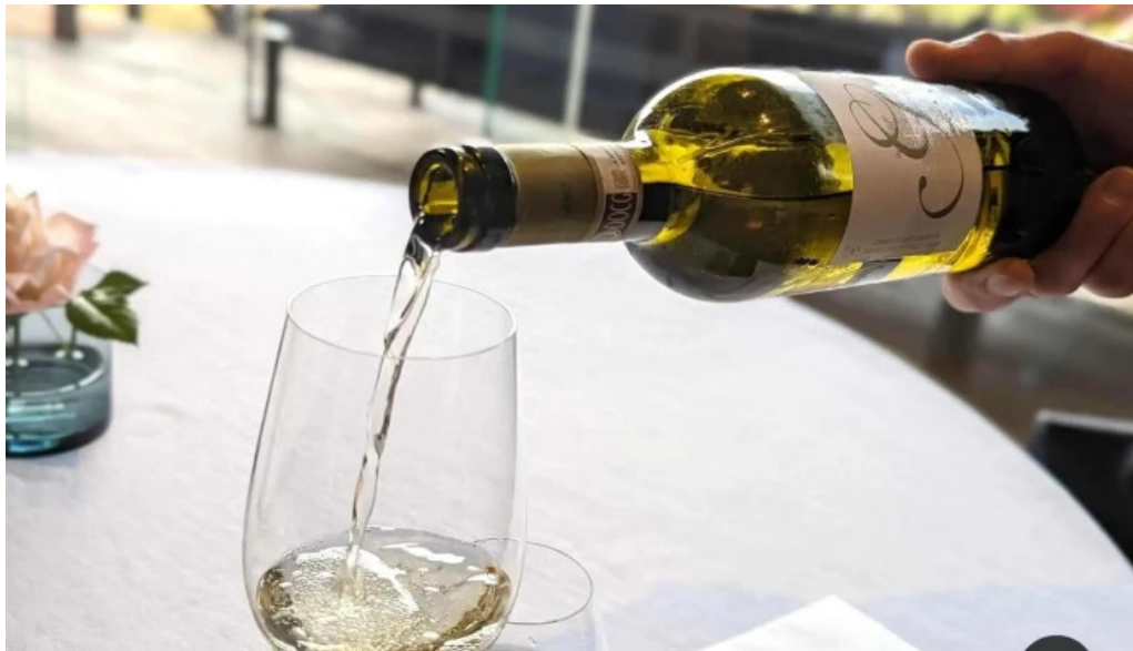
リストランテ 桜鏡 ワイン