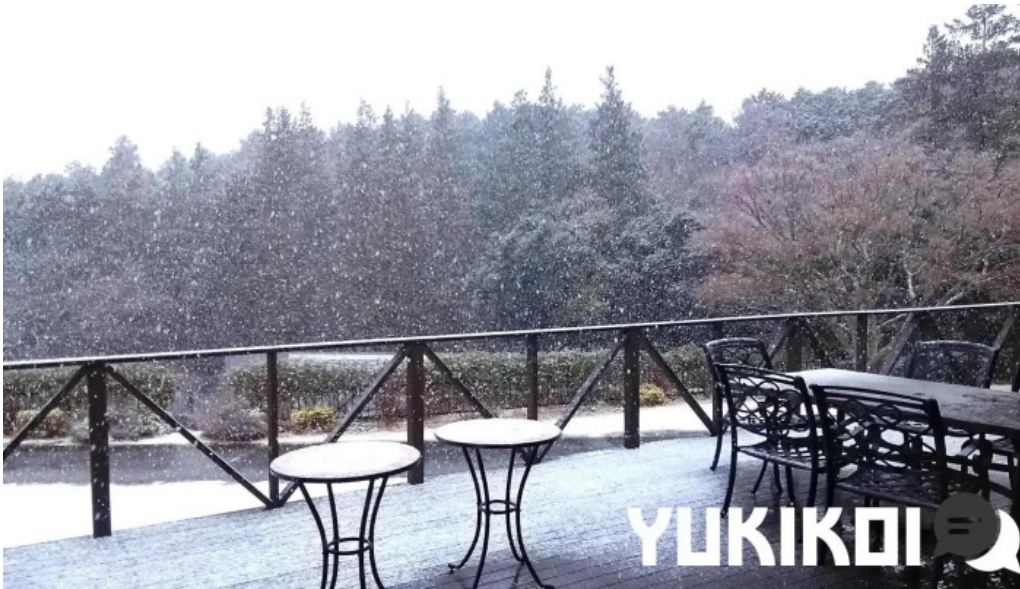
レストランテ 桜鏡 御殿場市