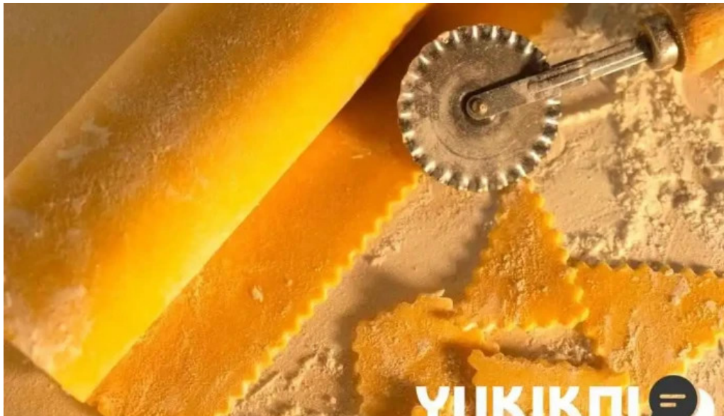
レストランテ 桜鏡 料理飲み物