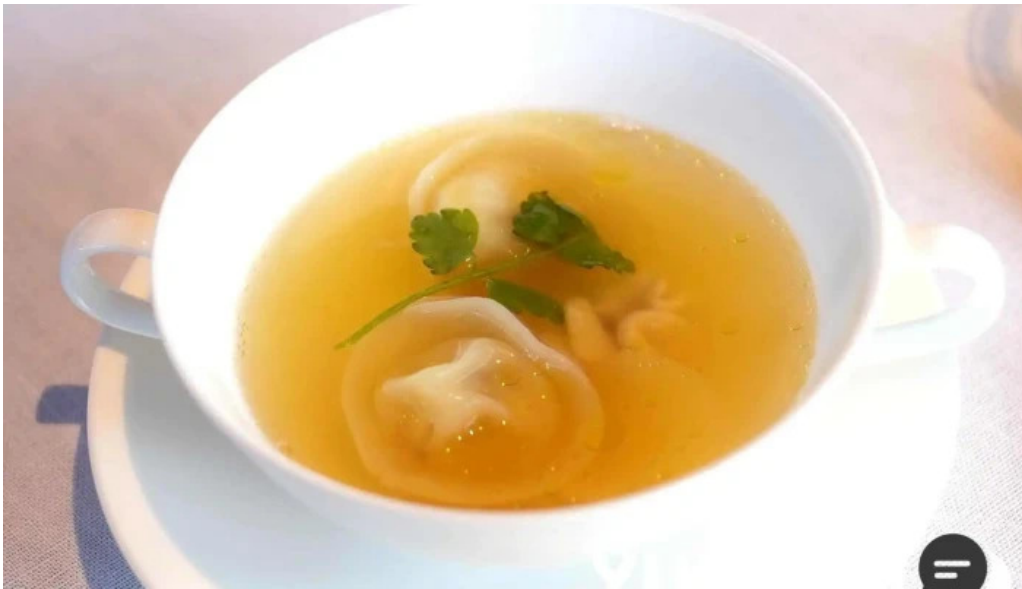
リストランテ 桜鏡 コンソメ