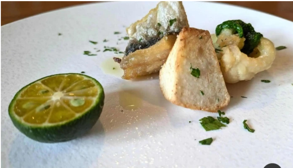
レストランテ 桜鏡 天ぷら