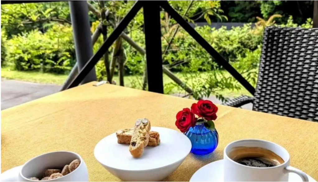
リストランテ 桜鏡 コーヒー