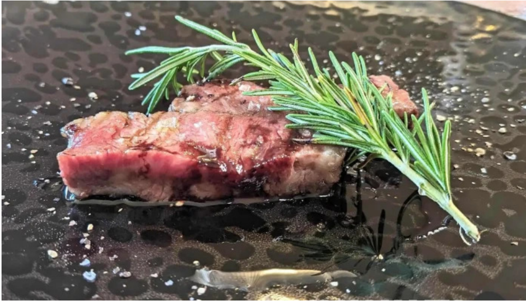
リストランテ 桜鏡 ステーキ