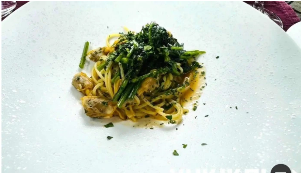
リストランテ 桜鏡 スパゲッティ