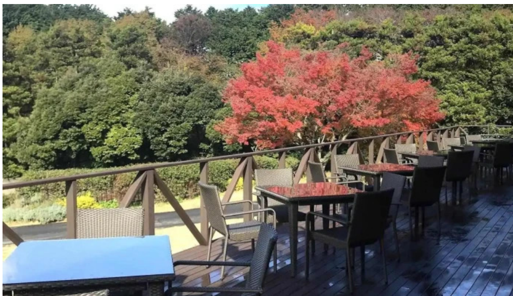
レストランテ 桜鏡 雰囲気