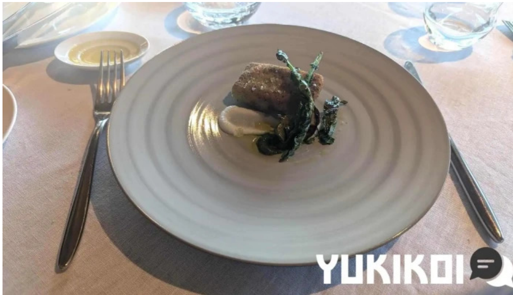
レストランテ 桜鏡 最新