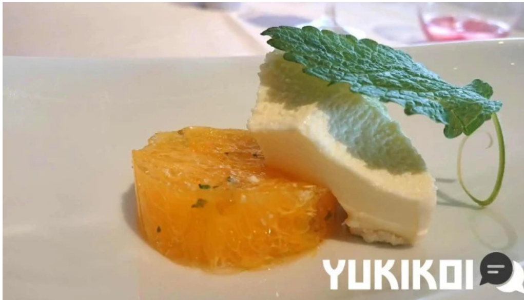
リストランテ 桜鏡 動画