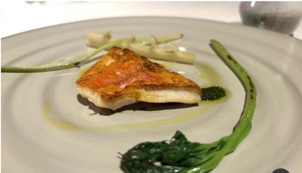
リストランテ 桜鏡 シーバス