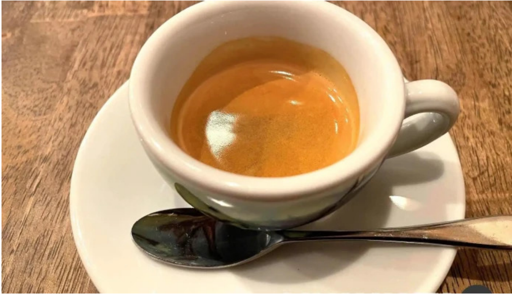
トラットリア フィレンツェ エスプレッソ