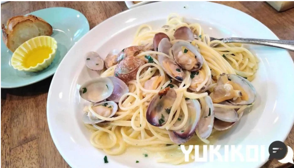
トラットリア フィレンツェ ヴォンゴレ