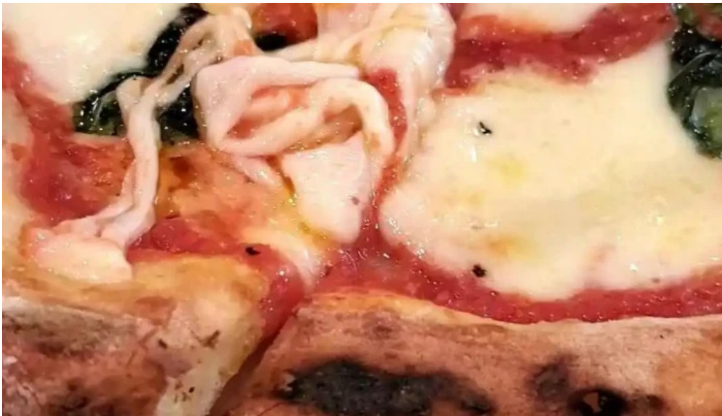
トラットリア フィレンツェ 動画