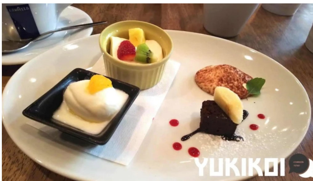
トラットリア フィレンツェ ブラウニー