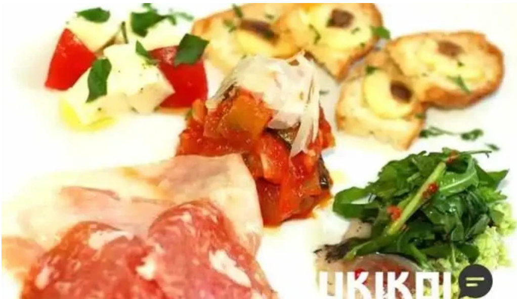
トラットリア フィレンツェ オーナー提供