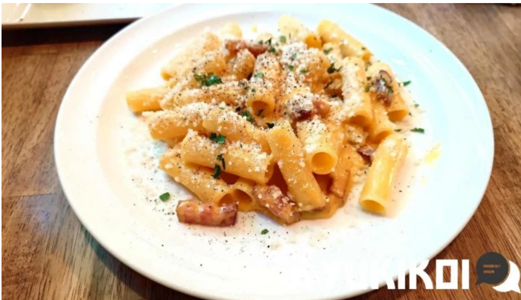
トラットリア フィレンツェ リガトーニ