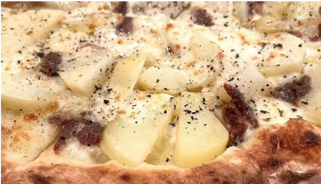
トラットリア フィレンツェ ゴルゴンゾーラ