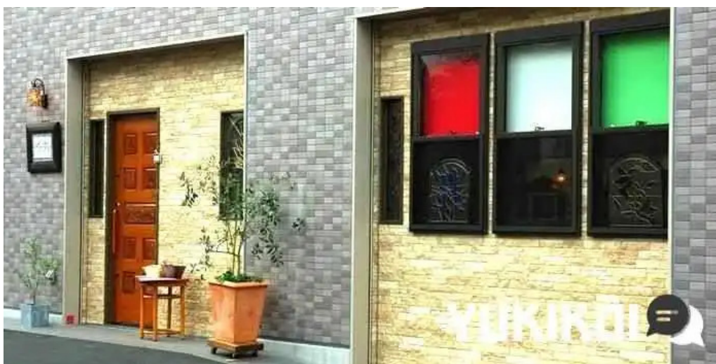
トラットリア フィレンツェ 御殿場市