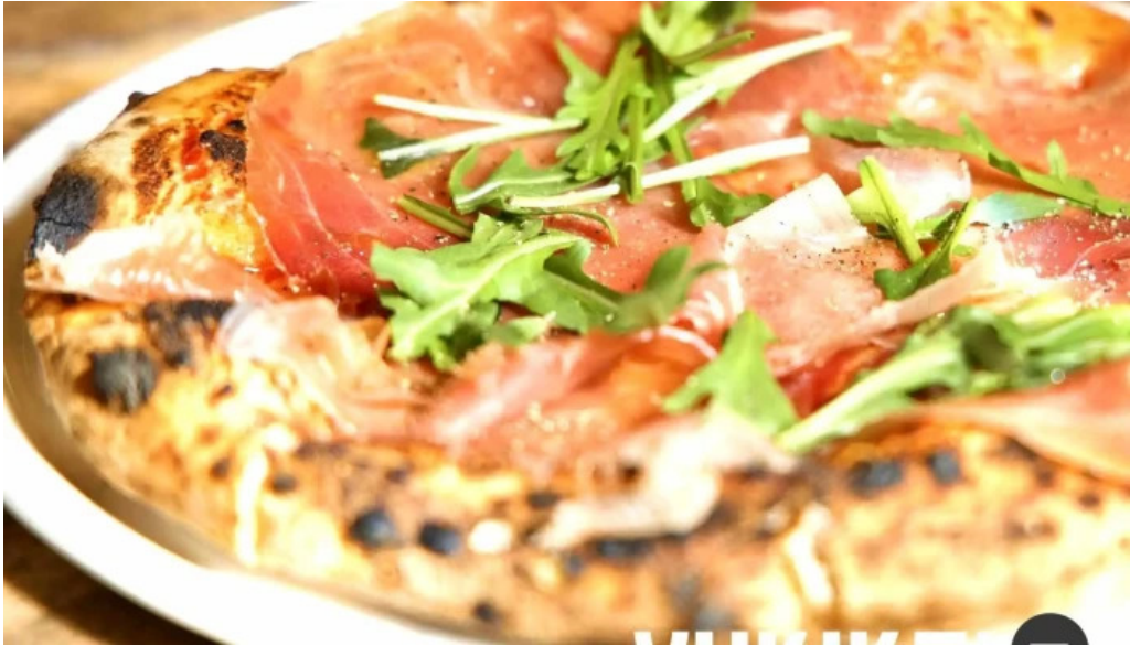
トラットリア フィレンツェ ピザ