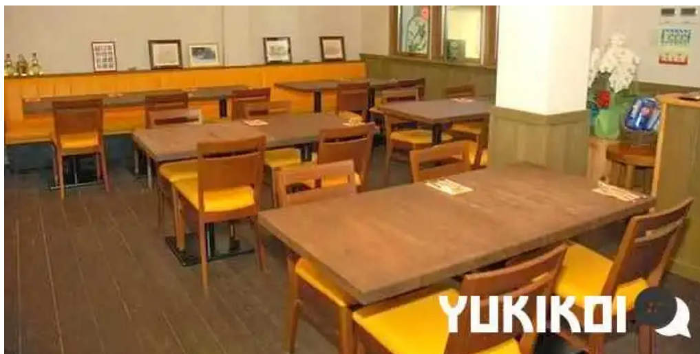
トラットリア フィレンツェ 雰囲気