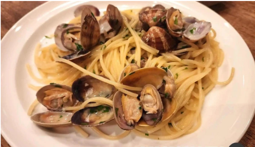
トラットリア フィレンツェ スパゲッティ