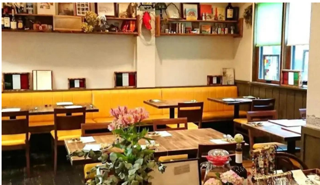
トラットリア フィレンツェ 料理飲み物